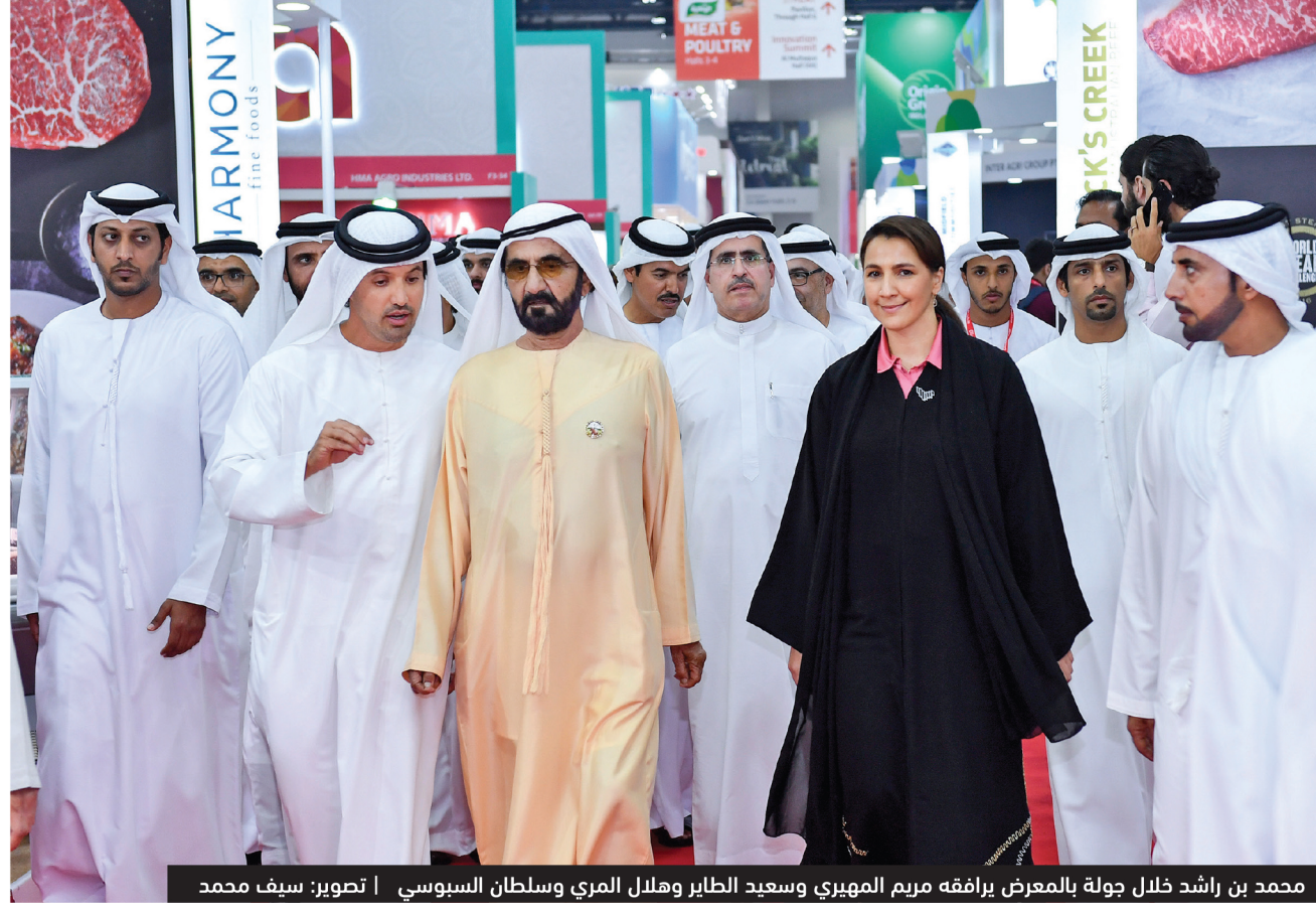
محمد بن راشد خلال جولة بالمعرض يرافقه مريم المهيري وسعيد الطائر وهلال المري وسلطان السوسني

«سموّه زار «جلفود» مرحباً بالعدد الهائل من المشاركات الداخلية والخارجية