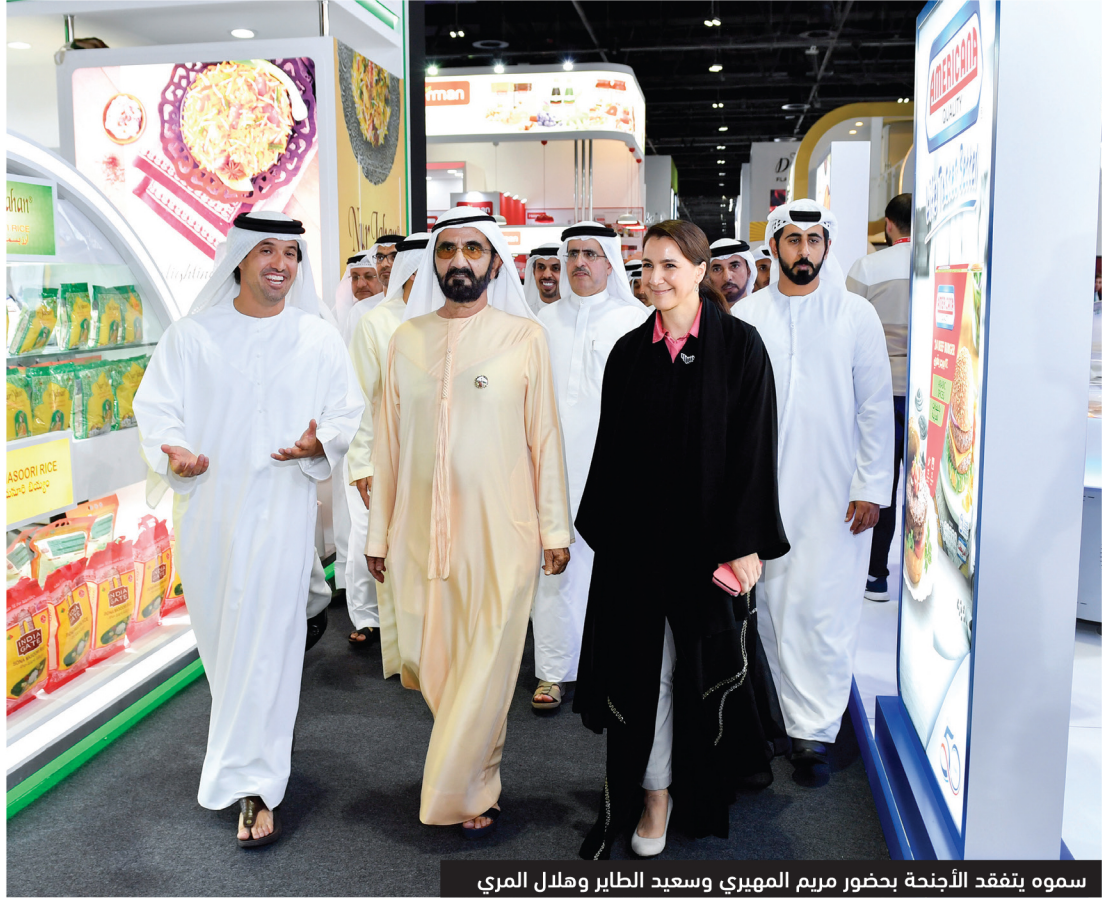
سموه ينفذ الأجنحة بحضور مريم المهيري وسعيد الطائر وهلال المري

دبي - وام أكد صاحب السمو الشيخ محمد بن راشد آل مكتوم، نائب رئيس الدولة رئيس مجلس الوزراء حاكم دبي، رعاه الله، خلال جولة لسموه مساء أمس، في معرض الخليج للأغذية «جلفود» الذي يستضيفه مركز دبي التجاري العالمي، أن أهمية المعرض «نتج من كونه يهتم في غناء الإنسان وصحته وسلامته والإنسان هو أسنى مخلوقات الله عز وجل وبناء عليه فإن الدول والحكومات عموماً، ودولتنا خاصة تعني أن الأمن الغذائي هو في صلب استراتيجية الدولة يجب حمايته واتخاذ جميع التدابير والاحتياطات الضرورية والمهمة من أجل هذا الغرض، لهذا حرصت عند تشكيل حكومتي الأخيرة على إنشاء وزارة للأمن الغذائي». وتؤجل سموه في أروقة وردحات المعرض في تسخته الخامسة والعشرين والذي ينظم في الفترة من 16 إلى 20 الجاري، وتعدّ من بين أكبر وأشهر وأهم المعارض المتخصصة في المنطقة والعالم، إذ اطّلع سموه على معروضات ومنتجات الشركات الحكومية والخاصة المتخصصة في إعداد وصناعة وتعليب الأغذية والمشروبات، والتقنيات الحديثة المتبعة في هذه العمليات المتكاملة والمتطورة، بحيث تحفظ للأغذية والمشروبات قيمتها الغذائية الأساسية وضمان سلامتها وصلاحياتها للاستهلاك البشري.