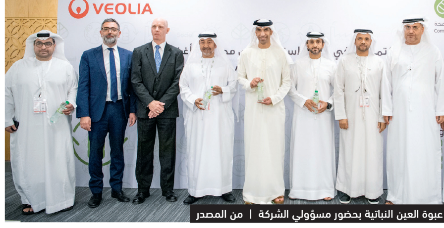
ثاني الزيودي يشهد إطلاق أغذية عبوة العين النباتية بحضور مسؤولي الشركة

حالياً، حيث تصدر إلى أكثر من 47 دولة حول العالم، معرباً عن تفاؤله بمواصلة نمو مبيعات الشركة خلال العام الجاري. وشاركت أغذية أمس في الإعلان عن تأسيس اتحاد خاص بعنى بشؤون القطاع على مستوى الخليج، في دبي. كما أطلقت أغذية خلال المعرض عبوة العين النباتية، وهي أول عبوة مياه مُستمددة من النباتات في المنطقة، وتأتي هذه الخطوة تزامناً مع شهر الإمارات للاختراعات بحضور معالي الدكتور ثاني بن أحمد الزيودي، وزير التغير المناخي والبيئة، وتمتيز عبوة مياه العين النباتية الجديدة، بأنها صديقة للبيئة ومصنوعة من مصادر نائية بنسبة 100%.