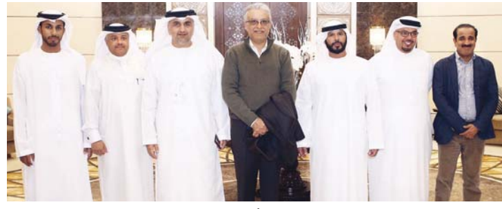
سلمان بن إبراهيم لدى وصوله العاصمة أبو ظبي

وأعرب الشيخ سلمان عن سعادته بزيارة أبو ظبي، مبدياً ثقته التامة بقدرة الإمارات على توفير مختلف الظروف المثالية لإنجاح منافسات كأس العالم للأندية 2017، وإخراجها بصورة متميزة تليق بالسعة العظيمة التي تتمتع بها البلاد على ساحة كرة القدم الدولية. وقال رئيس الاتحاد الآسيوي في تصريح صحافي لدى وصوله: إن منح الاتحاد الدولي لكرة القدم شرف تنظيم كأس