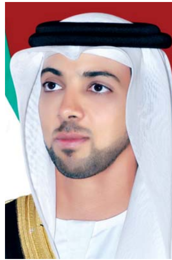
منصور بن زايد آل نهيان

ووجه سموه الدعوة لجماهير الإمارات لمؤازرة ومساندة فريق الجزيرة، (بطل دوري الخليج العربي الموسم الماضي)، الذي يمثل الوطن في المحفل العالمي المرتقب، مؤكداً سموه أن التشجيع الحضاري الذي تتصف به عموم جماهير أندية الإمارات، يشكل حافزاً مهماً للاعبين الجزيرة لتحقيق نتيجة مميزة، تقوده لتخطي المباراة الافتتاحية أمام أوكلاند سيتي النيوزلندي بطل أوقيانوسيا، والانتقال للدور الثاني لمواجهة بطل القارة الآسيوية، داعياً سموه عموم مجتمع الإمارات للتفاعل مع مباريات الحدث الدولي، الذي تحتضنه أبو ظبي ويقام