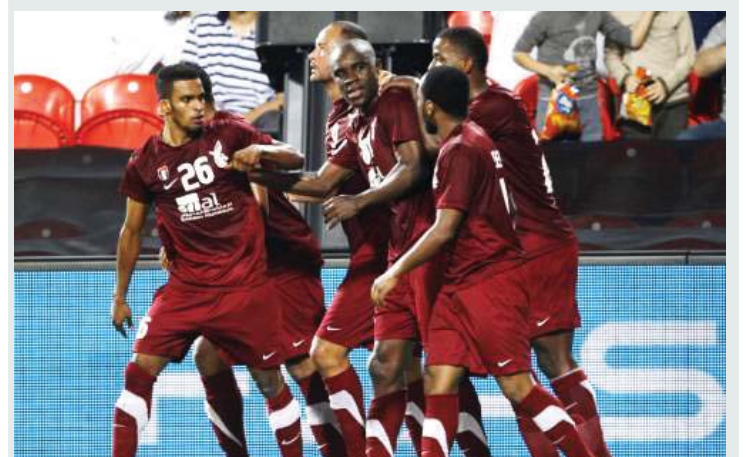
الوحدة خلال مشاركته في نسخة 2010 | البيان

جددت الإمارات استضافتها للحدث العالمي للعام الثاني على التوالي عام 2010، ومثل فيها العرب فريق الوحدة الذي تخطى هيكاري من بابوا غينيا الجديدة 0 - 3 وخسر أمام سيونغنام في المباراة الثانية 1 - 4 وفي تحديد المركزين الخامس والسادس خسر أمام باشوكا بكرات الترجيح. أما في نسخة عام 2011 فقد شهدت مشاركة الترجي.