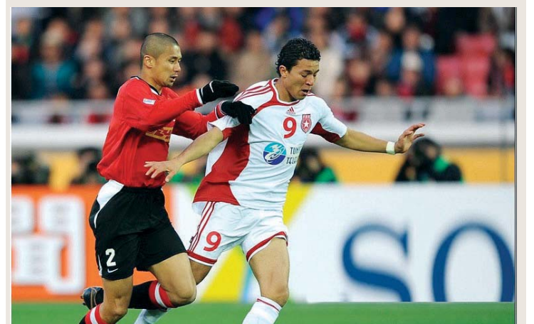
النجم خسر المركز الثالث | البيان

مثل النجم الساحلي الأندنية العربية في بطولة عام 2007 محققاً الفوز في مباراته الأولى ضد باشوكا المكسيكي بهدف موسى ناري وخسر في المواجهة الثانية أمام بوكاجينيورز الأرجنتيني بهدف، وفي مواجهة تحديد المركزين الثالث والرابع خسر بكرات الترجيح أمام أوراوا الياباني 2 - 4 بعد، وتوج ميلان الإيطالي باللقب.