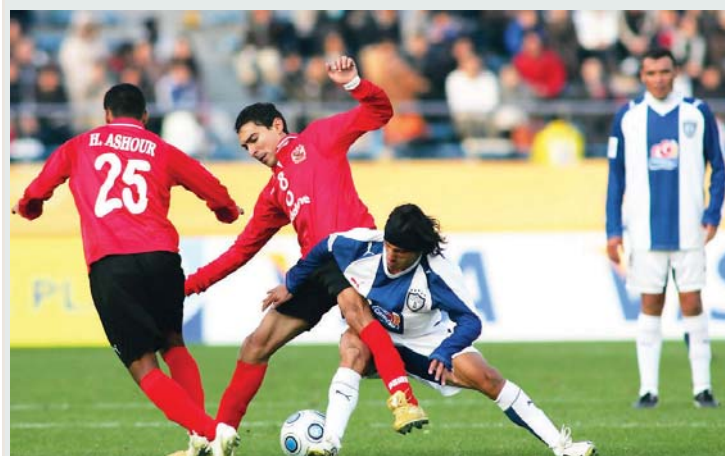
الأهلي خسر أمام باشوكا | البيان

أقيمت نسخة 2008 في اليابان ومثل فيها العرب فريق الأهلي القاهري الذي خسر أمام باشوكا المكسيكي 2 - 4 وتكررت خسارته للمرة الثانية أمام ادلايد يونائيد الأسترالي بهدف، وأقيمت المنافسة في اليابان وتوج بلقبها مانشستر يونايتد.