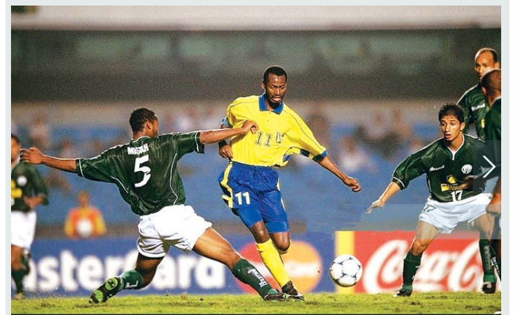
جانب من لقاء النصر والرجاء

نال النصر السعودي والرجاء المغربي شرف المشاركة في النسخة الأولى من المنافسة التي أقيمت بالبرازيل عام 2000 ولعب الفريقان العريبان في مجموعة وحقق النصر فوزاً على الرجاء بنتيجة 4 - 3 وخسر أمام ريال مدريد 1 - 3 وأمام كورينثيانز بولوتسا 0 - 2، وتوج كورينثيانز بلقب البطولة بعد نجاحه في بقية المشوار.