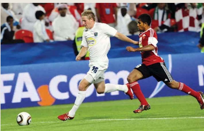
شباب الأهلي - دبي أول فريق إماراتي يشارك في مونديال الأندية | أرسيفية

انتقلت البطولة للإمارات عام 2009 في أول تنظيم لها، وشارك في هذه النسخة شباب الأهلي - دبي، الذي كان يحمل حينها اسم «الأهلي»، وخسر ممثل الإمارات مباراته الأولى ضد أوكلاندي سيتي 0 - 2 في الدور الأول ليكتفي بهذه المشاركة، ونال البطولة فريق برشلونة الإسباني.