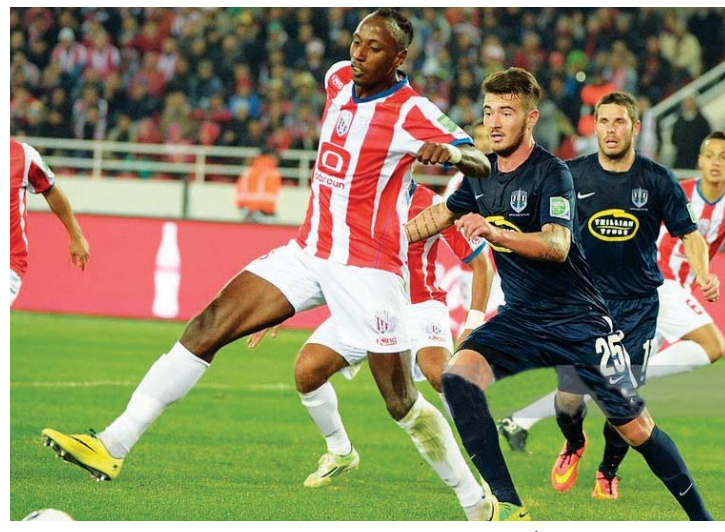
المغربي التطواني وأوكلاندي سيتي في بطولة 2014 | البيان

أقيمت نسخة 2015 في اليابان وفاز بها برشلونة الأسباني وشهدت البطولة غياباً تاماً للأندية العربية. وتكرر ذات المشهد في النسخة الماضية عام 2016 التي أقيمت باليابان وفاز بلقبها ريال مدريد الأسباني حامل اللقب حالياً، لتعود الفرصة من جديد أمام الأندية العربية التي يمثلها الجزيرة والوداد في بطولة 2017 التي تنطلق اليوم. أبوظبي - البيان الرياضي