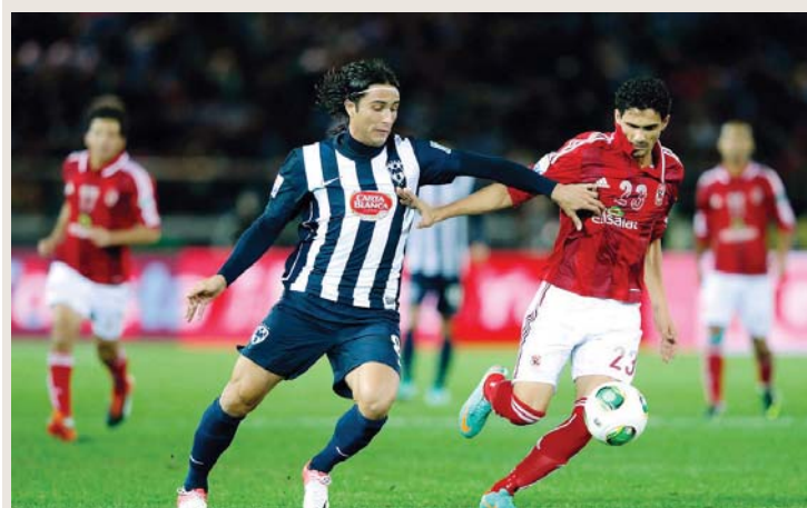
الأهلي حل رابعاً | البيان

عام 2012 أقيمت البطولة في اليابان أيضاً وفاز بها كورينثيانز، ظهر الأهلي القاهري فيها ممثلاً للعرب، محققاً الفوز في المواجهة الأولى على سانفريس 2 - 1 وفي نصف النهائي خسر نادي القرن أمام بطل المنافسة بهدف، وفي مباراة تحديد المركزين الثالث والرابع خسر أمام مونتيري المكسيكي 0 - 2 لينال المركز الرابع.