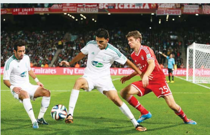
الرجاء خسر نهائي 2013 | البيان

شهدت النسخة العاشرة من المنافسة عام 2013 التي أقيمت بالمغرب مشاركة الأهلي المصري والرجاء المغربي، الذي حقق أفضل ظهور عربي بوضوله إلى النهائي الذي خسره أمام بايرن ميونخ 0 - 2 بعد مشوار مميز حقق فيه الفوز على أوكلاندي 2 - 1 ومونتيري، واتلتيكو منيرو 3 - 0 ليخسر بعدها في عرس الختام.