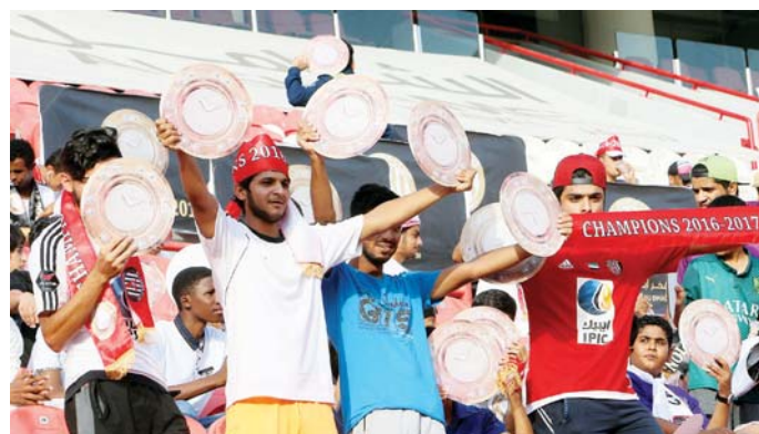
الجمهور على موعد احتفالي | البيان