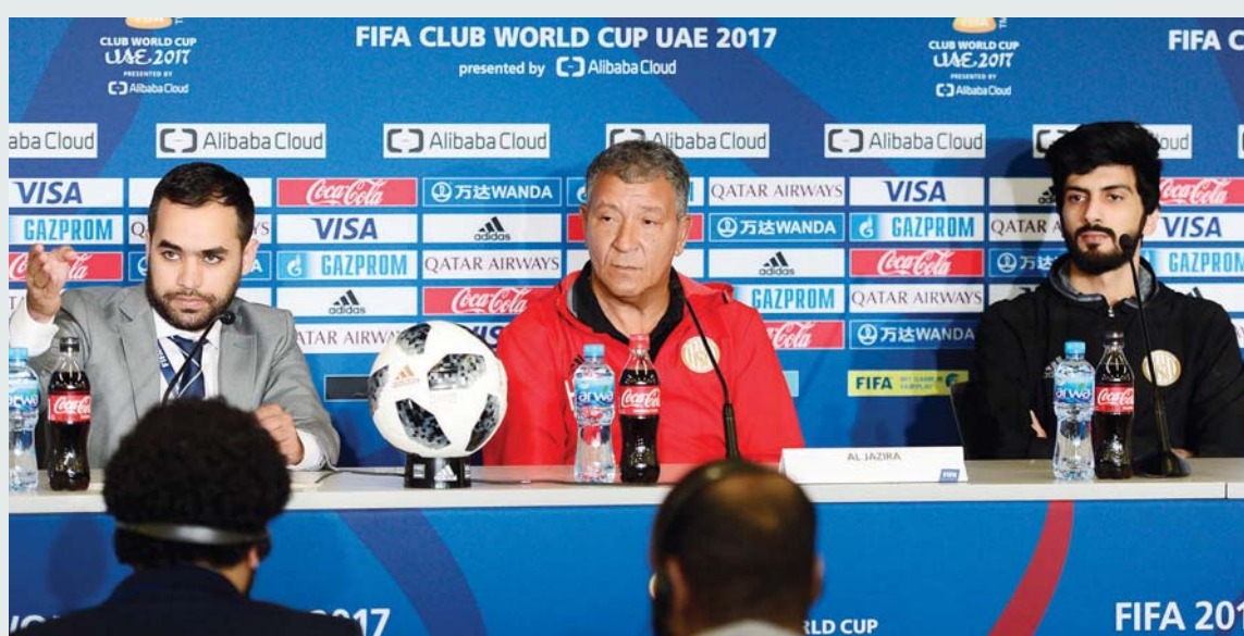
■ تين كات متحدثاً في المؤتمر الصحفي | البيان

وعبر المدرب الهولندي عن تمنياته بتواجد جماهيري كبير للوقوف خلف اللاعبين ومساندتهم في مباراة الليلة، لأن الجزيرة ممثل للوطن في هذه البطولة، وقال إنهم حضروا قبل فترة كافية لمدينة العين وتعودوا على الأجواء، وهم متحمسون للمواجهة الأولى اليوم وفخورون بالمشاركة في هذا المحفل العالمي الكبير، وقال: أنا فخور بتدريب هؤلاء اللاعبين الشباب وقد