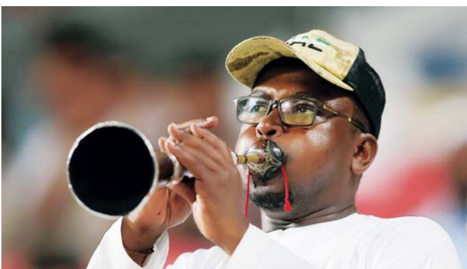
الفن الشعبي حاضر بقوة | البيان