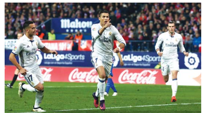
الجماهير تتربق وصول رونالدو ونجوم الريال

إبداعات أديداس في عالم أحذية كرة القدم والتي ارتداها أخيراً، أبرز اللاعبين أمثال بول بوغبا، وديلي ألي، وإيفان راكيتيتش وغيرهم. في حين تختبر منطقة «المهاجم» من «علي بابا كلاود» المهارات الرئيسية التي يجب أن يتمتع بها المهاجم اليوم في عالم كرة القدم، ومنها السرعة والقوة والدقة، حيث سيلتقي المشركون وجهاً لوجه مع منافسين آخرين، ليتأهل الفائزون لتسلم جوائز قيمة في منصة «علي بابا كلاود».