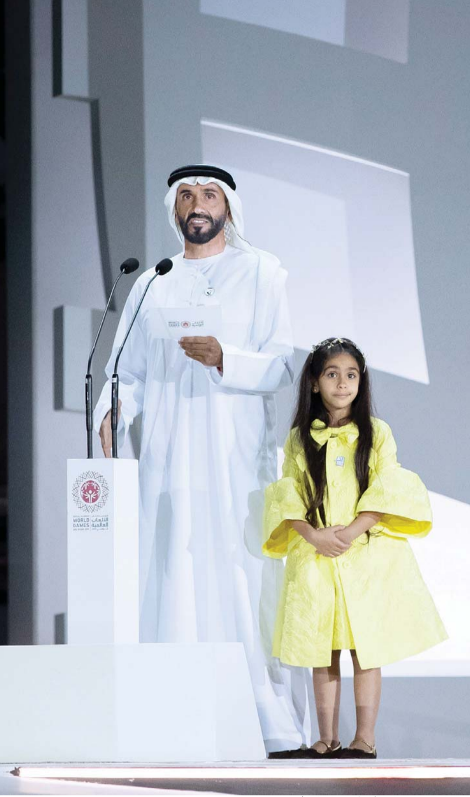
■ نهيان بن زايد يلقي كلمة في الختام | البيان