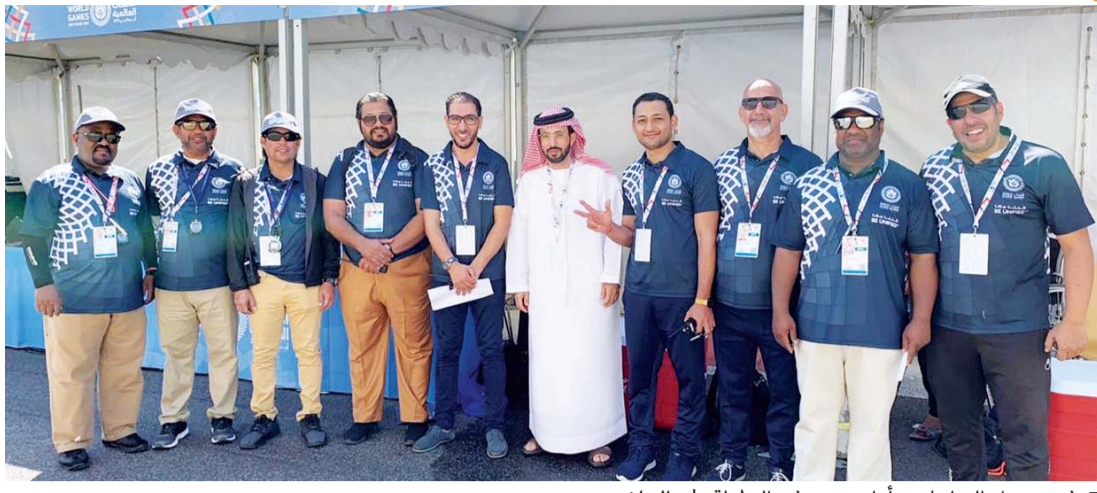
فريق عمل الدراجات وأداء متميز في البطولة | البيان