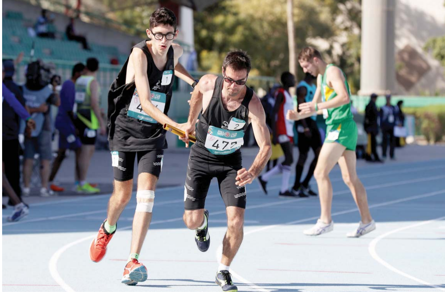
جانب من منافسات سباق 400 متر

وكانت معالي الدكتورة أمل القبيسي قد قامت بزيارة إلى فعاليات الألعاب العالمية للأولمبياد الخاص «أبوظبيي 2019» في أرض المعارض بأبوظبيي وحضورها جانباً من الفعاليات المقامة وقامت بتكريم عدد من الفائزين والحديث معهم والتقاط الصور التذكارية مع الأبطال. وأكدت أن استضافة هذا الحدث الرياضي الإنساني العالمي تمثل رسالة للعالم أجمع بأن الإمارات كانت وستبقى وفيه لقيمها ومبادئها الإنسانية النبيلة، وستظل خير داعم لكل جهد بشري يستهدف بناء جسور التواصل والانفتاح والاحتواء والمحبة والتعاون والتعايش الإنساني، كما أنه يعكس القدرات التنظيمية العالمية التي تتمتع بها دولة الإمارات. وأشارت معاليها إلى أن خلال الزيارة لمسنا الفرحة والثقة الكبيرة التي يشعر بها أصحاب الهمم لمشاركتهم وسعادتهم الغامرة بخوض ألعاب الأولمبياد وشعورهم بالامتنان الكبير لما يحظون به من رعاية ودعم ليس له نظير وأمالهم الكبيرة في الإنجاز والاستمرار في تحقيق البطولات.