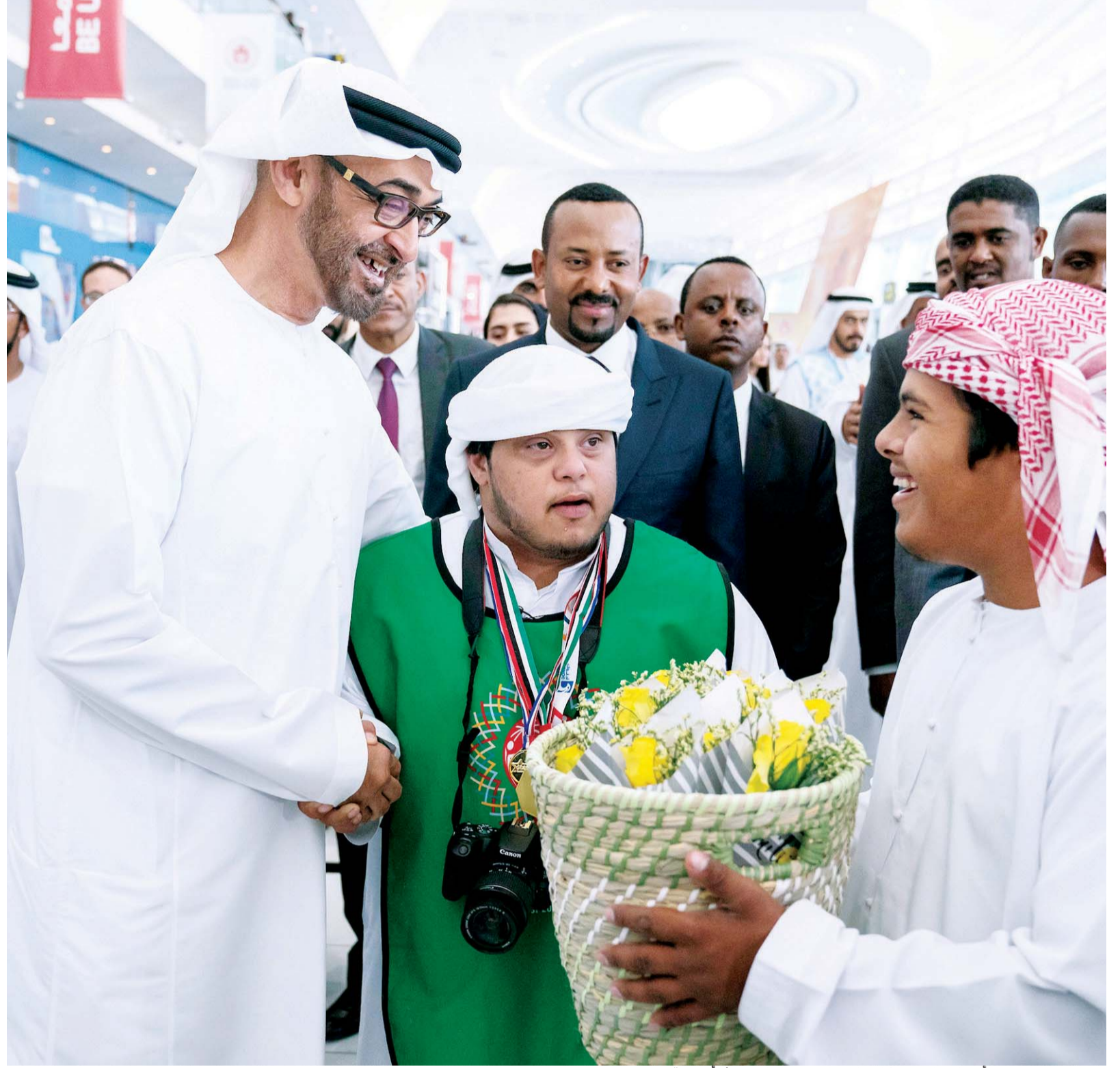
■ محمد بن زايد مع أصحاب الهمم خلال زيارته للمجمع الرياضي