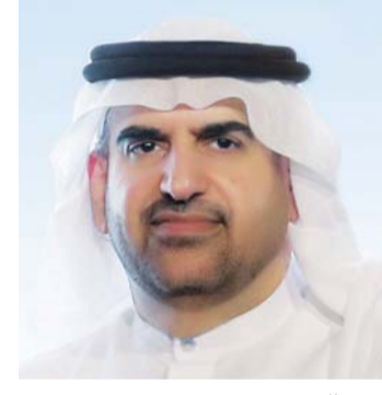
جمال بن حويرب

قال سعيد الغفلي: «تولي قيادة دولة الإمارات أهمية خاصة لترسيخ الشعور بالسعادة في المجتمع، من خلال العديد من البرامج والمبادرات الهادفة إلى نشر السعادة، لتصبح نهجاً في كل قطاعات الدولة، بما ينعكس على سعادة كل فرد في المجتمع. فبرؤية قيادة الدولة الرشيدة، أصبحت السعادة هدفاً وحققاً مكتسباً لجميع مواطني ومقيمي دولة الإمارات».