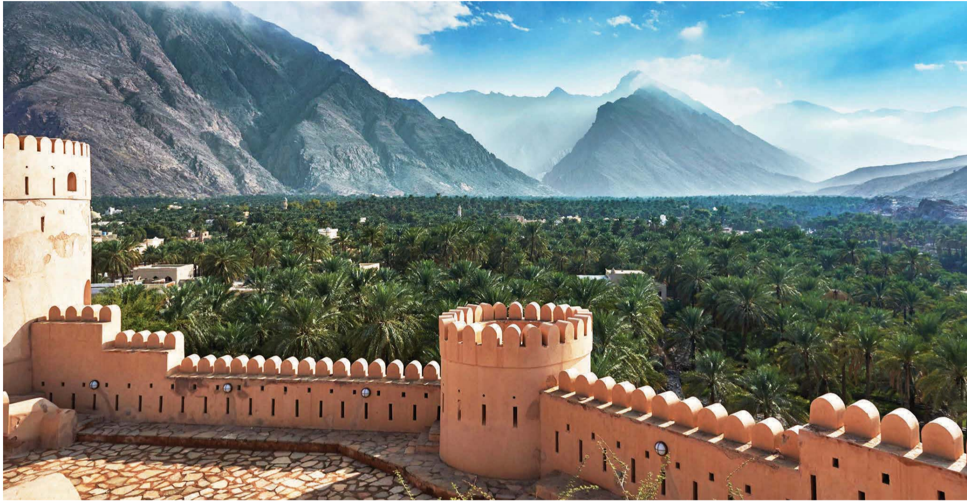
■ السلطنة تحتفظ بتقاليدها وتحافظ على موروثها الحضاري