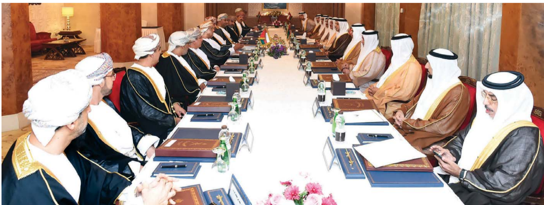
■ اللجنة المشتركة الإماراتية العمانية عززت التعاون الثنائي

تعاون وتنسيق مشترك بين البلدين في مختلف المجالات