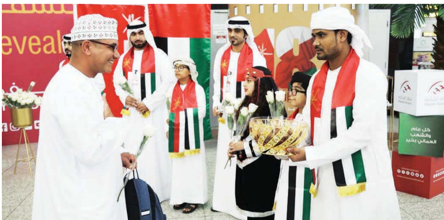
استقبال العمانيين القادمين إلى الدولة بالورود

وتشارك مطار الشارقة المسافرين العمانيين احتفالاً بهم بالعيد الوطني الثامن والأربعين، الذي يُصادف الثامن عشر من نوفمبر من كل عام. وبهذه المناسبة قام موظفو المطار باستقبال الزوار العُمانيين القادمين إلى الإمارات عبر المطار لقضاء إجازاتهم في ربوع الدولة بالهدايا التذكارية والورود والضيافة وقدموا إليهم التهانى بهذه المناسبة الوطنية المهمة. ولاقى استقبال موظفي المطار استحسان المسافرين العمانيين، وأسعدتهم هذه اللقطة الودية التي قام بها الموظفون، ما يؤكد عمق الروابط الأخوية والصداقة بين البلدين الشقيقين.