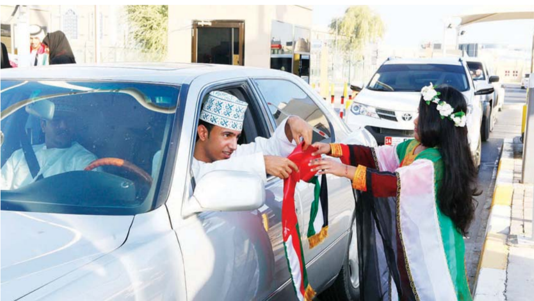
فعاليات متنوعة لمشاركة الأشقاء احتفالاً بهم بالعيد الوطني | أرشيفية

100 درهم لكل درهم يتم إنفاقها على منتجات الصحة والجمال والعناية الشخصية والعمود. ويشارك في العروض الخاصة أكثر من 140 متجرًا في سبعة مراكز تسوق كبرى منها؛ الوحدة مول، وياس مول، ومارينا مول، ودلما مول، والمشراف مول، والخالدية مول، والوادي مول. وضمن عرض «زوماتو» يقدم 20 مطعمًا من أفضل المطاعم في أبوظبي قائمة من 4 أصناف بسعر خاص يبلغ 179 درهماً إماراتياً. حيث انطلقت مبادرة «أفضل قائمة طعام في أبوظبي» في 7 نوفمبر الحالي وتستمر حتى اليوم الوطني لدولة الإمارات في 2 ديسمبر المقبل، لتتيح بذلك فرصة استثنائية للزوار والمقيمين في أبوظبي لتجربة أفضل المأكولات الشهية من أيدي أبرع وأشهر الطهاة. وتشمل قائمة المطاعم المشاركة «سمبوسك»، و«بنجاب جريل»، و«تشو جاو»، و«سيركو»، و«سيتيم