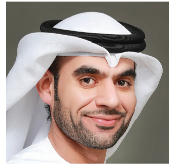
■ يونس آل ناصر

أكد يونس آل ناصر مساعد مدير عام دبي الذكية والمدير التنفيذي لمؤسسة بيانات دبي، أن التوقعات العالمية لأثر التقنية على مختلف القطاعات في العام 2019 أعطت تطبيقات البيانات دوراً استراتيجياً في رفع كفاءة وفعالية التخطيط في المؤسسات، ومن هنا تزداد الأهمية الاستراتيجية للتخطيط في حياة كل قائد حكومي يرغب في دخول المستقبل منذ الآن وضمان النجاح والتفوق في عالم شديد المنافسة، ولذا جاء التخطيط «ضع