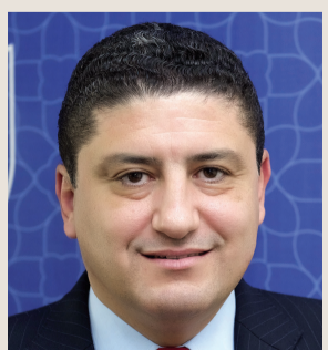
* البروفيسور رائد عواملة

الاعتبارات والظروف هو ركيزة رئيسية لتحقيق المستهدفات ورفع الكفاءة وتحسين الأداء، أي على كل مسؤول أو قيادي أن يضع كل الاحتمالات وأن يناقش كافة السيناريوهات المحتملة، ويعمل على توظيف التفكير الإبداعي الاستراتيجي في اتخاذ القرارات الحاسمة التي تقود المؤسسة نحو النجاح، فالتخطيط الصحيح، وخصوصاً في الإدارة الحكومية، هو الركيزة الرئيسية لتحقيق المستهدفات والوصول إلى الغايات، والأجهزة الحكومية القادرة على وضع خطط واقعية بعيدة المدى هي التي تمتلك القدرة على البقاء والمنافسة عالمياً، وتحقيق نهضة حقيقية في عمل القطاعات الرئيسية، ويات ضرورياً تبني ثقافة مؤسسية جديدة تواكب متطلبات