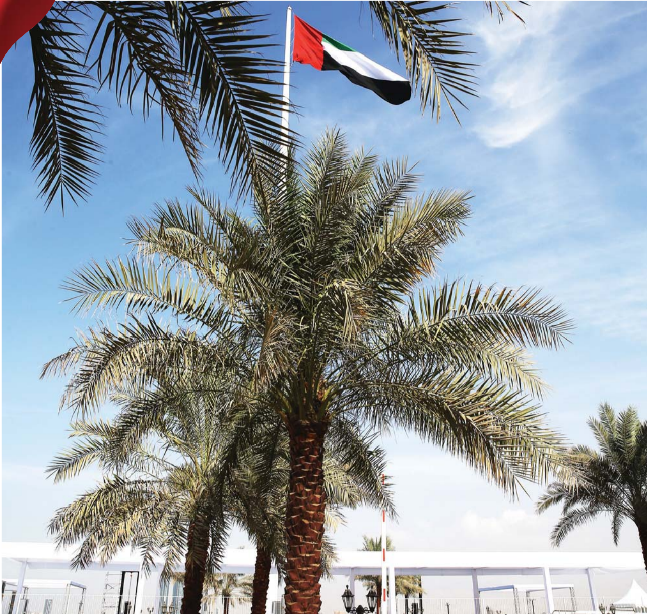
■ راية الإمارات خفاقة في سماء رأس الخيمة | تصوير: إبراهيم صادق