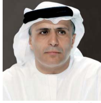
■ مطر الطاير

من ناحيته قال سعيد محمد الطاير، العضو المنتدب الرئيس التنفيذي لهيئة كهرباء ومياه دبي بالمناسبة: يطيب لي أن أتوجه بأسمى آيات التهاني والتبريكات إلى مقام صاحب السمو الشيخ خليفة بن زايد آل نهيان، رئيس