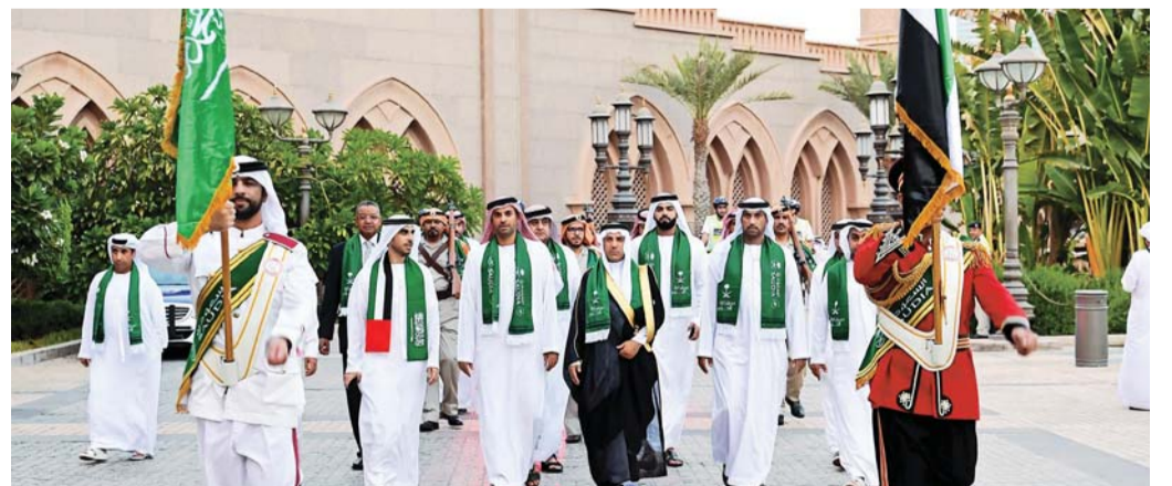
■ جانب من احتفالات شرطة أبوظبي باليوم الوطني السعودي