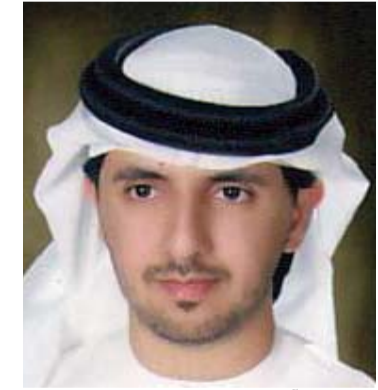
عبد الله آل علي

وأعرب الدكتور عارف النورياتي المدير التنفيذي لمستشفى القاسمي بالشارقة عن عميق حزنه برحيل المغفور له، بإذن الله تعالى، الملك عبد الله بن عبد العزيز آل سعود، هذا الرجل الذي دافع بصدق عن قضايا العربية والإسلام، وأعرب عن عميق مواساته للأشقاء في المملكة