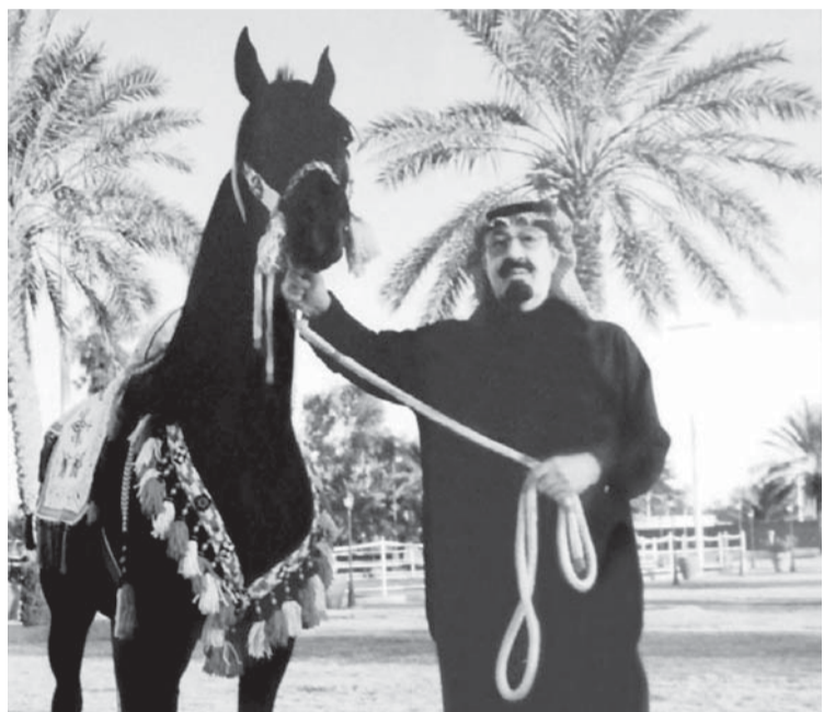
..وفي رحلة داخلية قرب الرياض