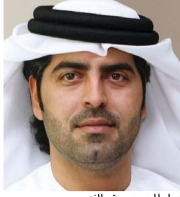
سلطان بن صقر النعيمي

ورحابة صدر تجلت في جميع المواقف والأحداث. ويقول علي مسفر مدير دائرة الأراضي والأملاك في أم القيوين نعزي أنفسنا أولاً في فقد الجلال بالنسبة للأمتين الإسلامية والعربية برحيل خادم الحرمين الشريفين مبيناً أن رحيله يعد فقداً وخسارة للأمة العربية .