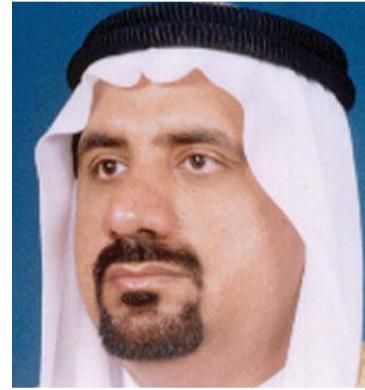
علي بن حنيفة