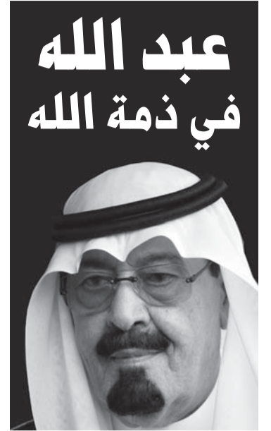
عبد الله في ذمة الله

مواقع التواصل الاجتماعي تغرّد: إلى جنات الخلد أبا متعب