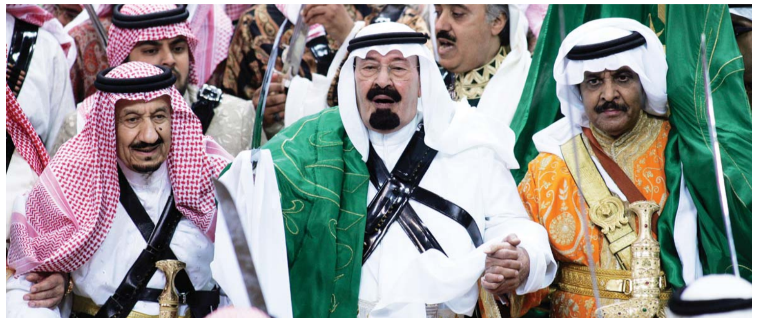
عبدالله بن عبدالعزيز يحمل السيف في افتتاح مهرجان الجنادرية سنة 2007