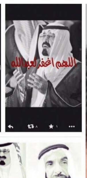
هاشناج بنعي الملك الراحل على تويتر

مصباح جليل وغرد وزير الخارجية البحريني الشيخ خالد