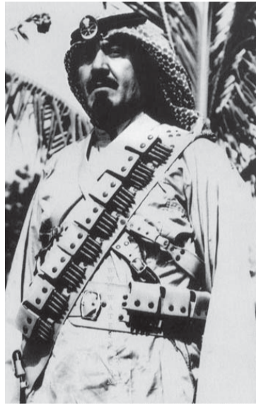
..ومرتدياً البزة العسكرية أرشيفية