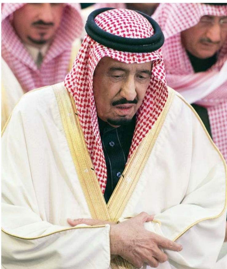
العاهل السعودي أثناء صلاة الجنازة في الرياض

في الأثناء، أصدر العاهل السعودي الجديد ستة مراسيم ملكية، حيث أعلن الديوان الملكي مبايعة الأمير مقرن بن عبد العزيز