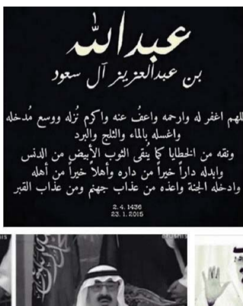
هاشناج بنعي الملك الراحل على تويتر

ونعى رئيس الوزراء اللبناني الأسبق سعد الدين الحريري الملك عبدالله مغرداً: «الأمّة العربية فقدت شخصية استثنائية طبعت تاريخ المملكة بـعظيم الإنجازات والمبادرات، وكان العين الساهرة على الأمة العربية والمسلمين».