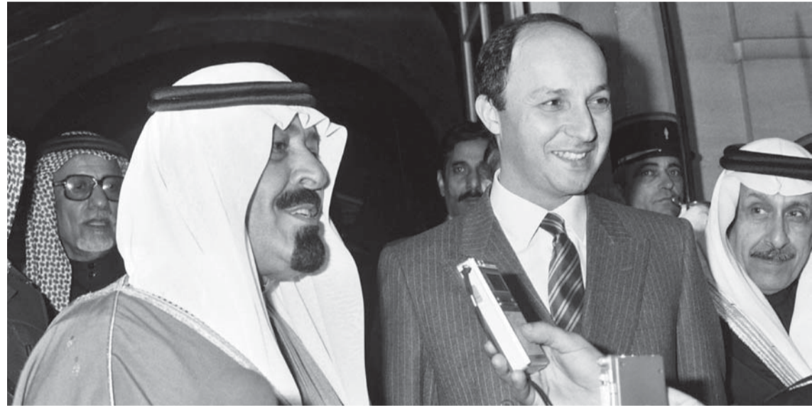
..وفي لقاء مع الصحفيين خلال زيارته باريس سنة 1985 أرشيفية