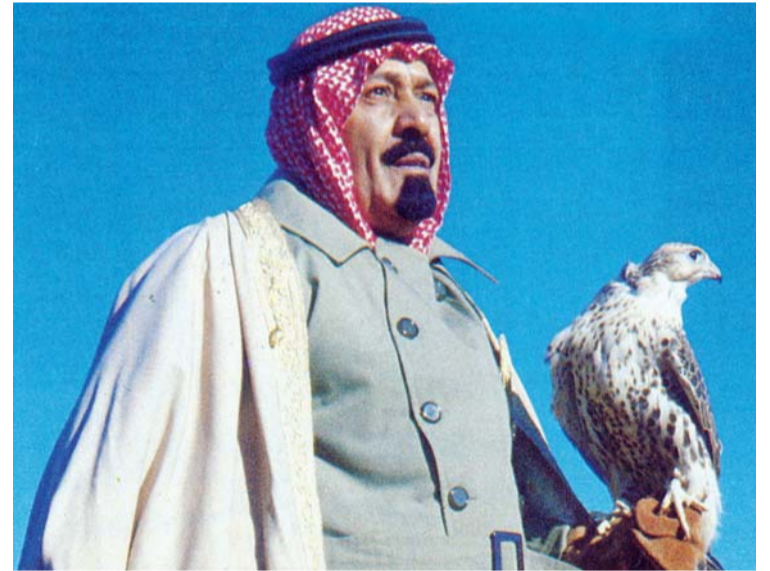
الملك الراحل خلال رحلة صيد بالصقور أرشيفية

وبادر الملك عبدالله خلال مؤتمر القمة العربية الاقتصادية المنعقد في الكويت في عام 2009 بالدعوة إلى إنهاء الخلافات العربية - العربية وسرعان ما عقد لقاء مصالحة مع الزعيم الليبي السابق العقيد معمر القذافي. وفي الشأن الداخلي اتخذ الملك عبدالله سلسلة من الإصلاحات منها زيادة صلاحيات مجلس الشورى وسمح لأول مرة للمرأة بحق الترشح والانتخاب وافتتح جامعة الملك عبدالله للعلوم والتقنية كأول جامعة مختلطة في تاريخ المملكة وأنشأ عددا من الجامعات المتطورة.