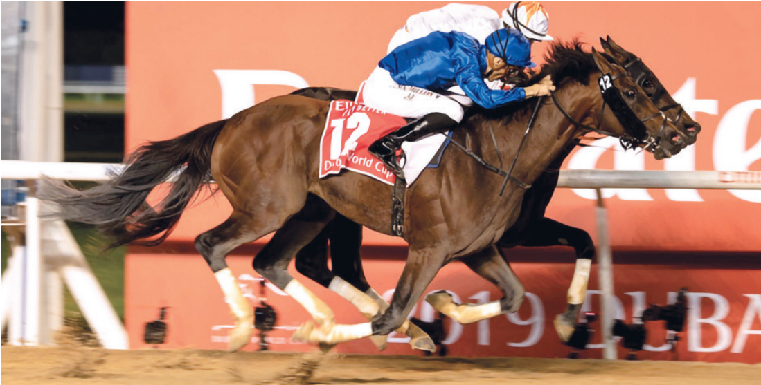
منافسة قوية في أشواط السباق كافة | البيان

وتوجه بالشكر لرعاة الحدث وشركاء النجاح في مقدمتهم طيران الإمارات، لوجين، دبي بي وورلد، نخيل، جميرا، عزيزي لتطوير العقاري، إعمار، الطائر للسيارات وزعيل فيد على دعمهم المتواصل، كما ثمن جهود جميع الشركاء والجهات والمؤسسات الحكومية والخاصة.