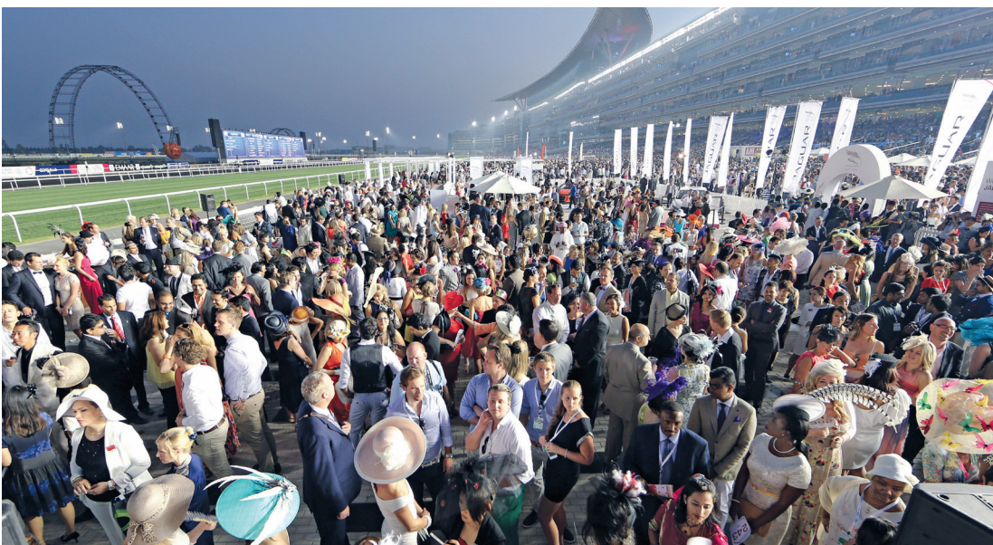
الجمهور على موعد مع إثارة منافسات كأس دبي العالمي اليوم | البيان

كما كان الاهتمام كبيراً من الإعلام الياباني، ويأتي ذلك منذ فوز الفرس الشهيرة «فيكتور بيزا» بلقب كأس دبي العالمي عام 2011، لتصبح الأمسية الأشهر عالمياً في سباقات الخيل قبله للصحافة اليابانية في تنامي مطرد لأعدادها عاماً بعد آخر. ويشهد الشارع الياباني على مدار أكثر من ربع قرن، تنامياً في ثقافة سباقات الخيل، وفوز «فيكتور بيزا» سلط الضوء بشكل كبير على