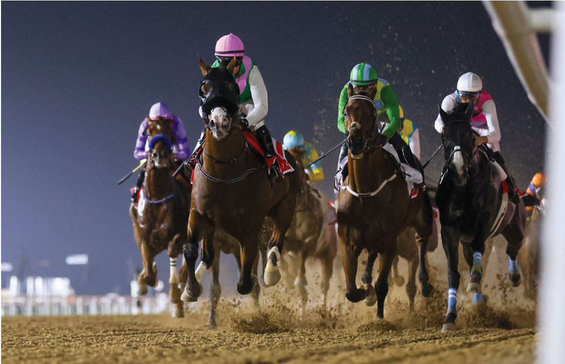
نخبة خيول العالم تشارك في الحدث الكبير | البيان

وتوجه الشيخ راشد بن دلموك آل مكتوم، في ختام حديثه بخالص الشكر والتقدير لأعضاء اللجنة المنظمة للأمسية العالمية، والجهات الحكومية، والشركاء والرعاة الذين أصلوا دعمهم للحدث العالمي الكبير، متمنياً كل النجاح والتوفيق لكل المشاركين في الأمسية.