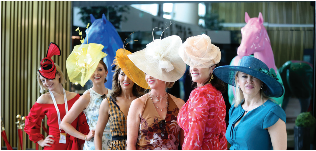
مسابقة القبعات والأزياء من إبداعات كأس دبي العالمي | البيان