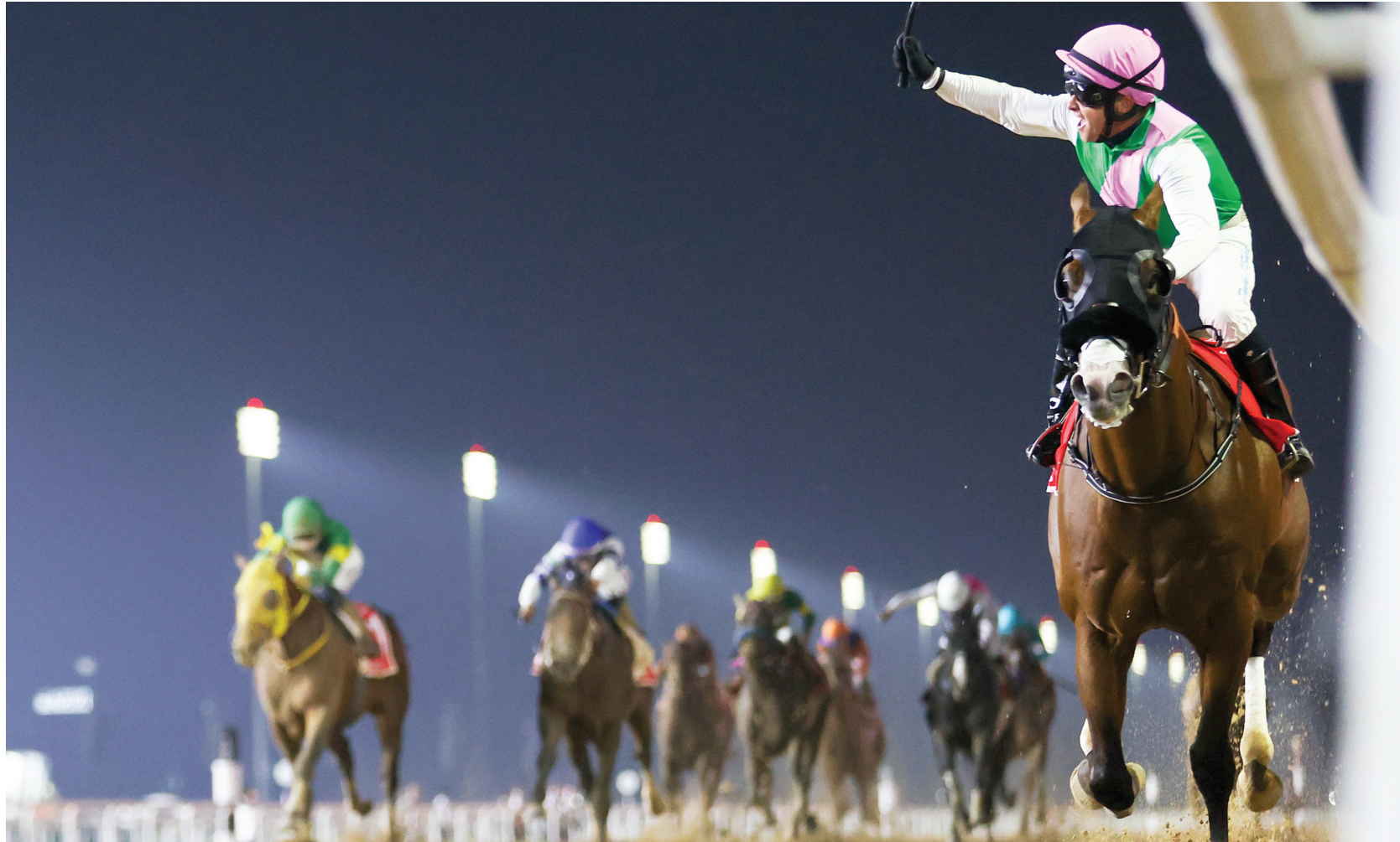
الجواد «لوريل ريفر» الفائز بالسباق التاسع لكأس دبي العالمي 2024 | أرشيفية