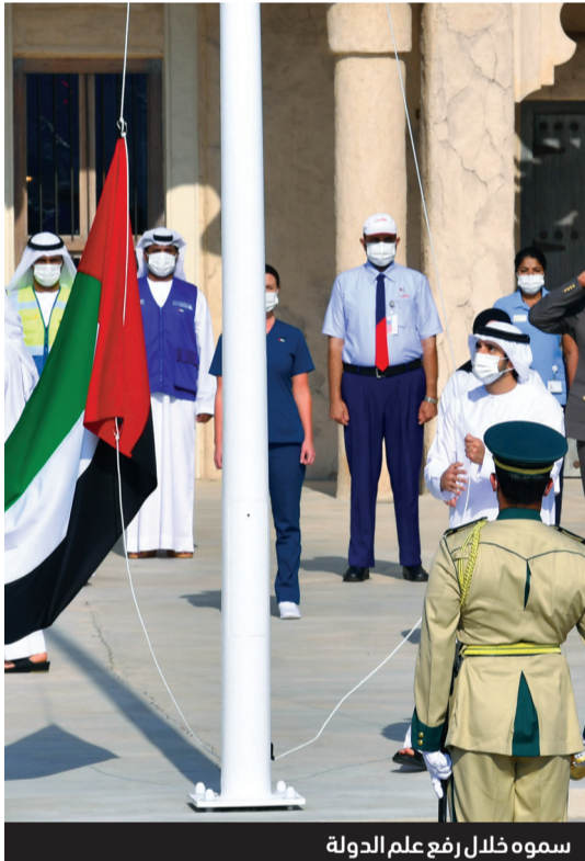
سموه خلال رفع علم الدولة