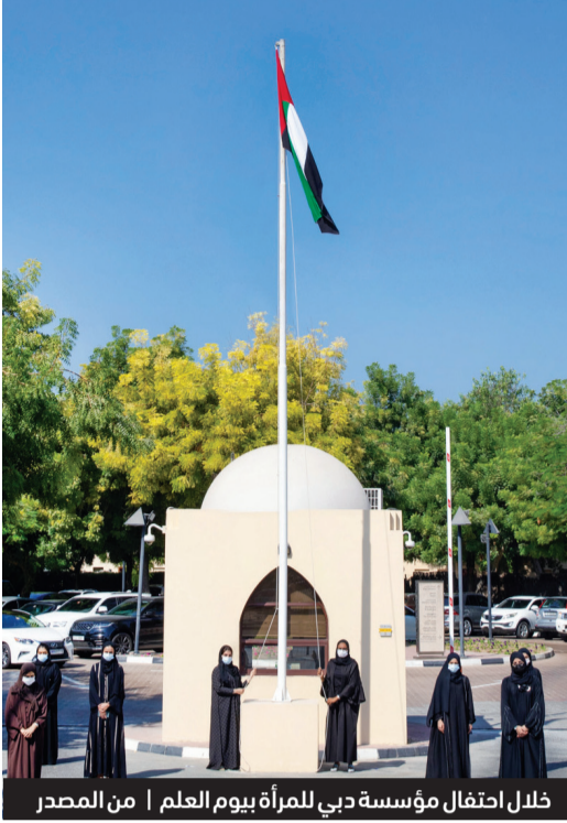
خلال احتفال مؤسسة دبي للمرأة بيوم العلم

وأضافت سمو الشيخة منال بنت محمد بن راشد آل مكتوم «إن الاحتفال بيوم العلم يمثل دعوة للحفاظ على المكتسبات والبناء عليها لتحقيق مزيد من الإنجازات وصولاً لأهداف خطة 50 عاماً