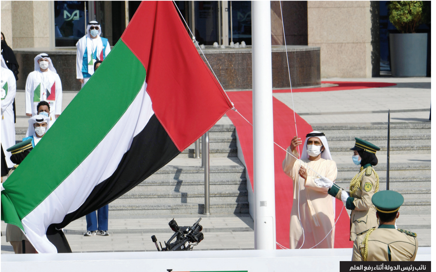
نائب رئيس الدولة أثناء رفع العلم