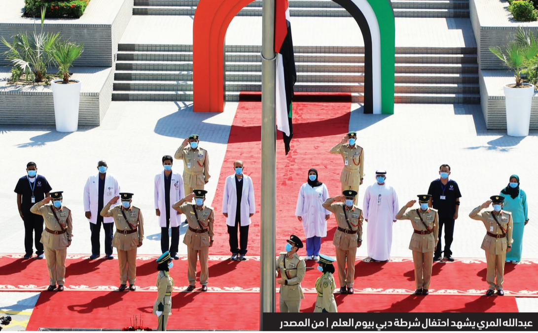
عبدالله المري يشهد احتفال شرطة دبي بيوم العلم