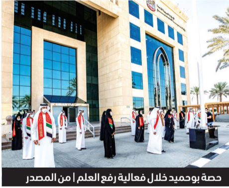
حصّة بوحميد خلال فعالية رفع العلم ام المنصدر

رفعت معالي حصّة بنت عيسى بوحميد، وزيرة تنمية المجتمع، علم الإمارات على المبنى المشترك لوزارتها الموارد البشرية والتوطين، وتنمية المجتمع، بحضور عدد من القيادات والمسؤولين في الوزارتين، وبمشاركة عدد محدود من الموظفين، وذلك استجابةً للظروف الحالية ووفقاً للتدابير الاحترازية لمنع انتشار فيروس كورونا المستجد.