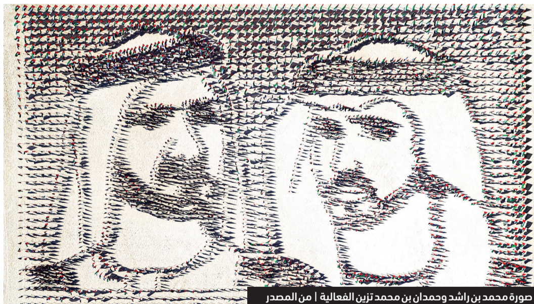
صورة محمد بن راشد وحمدان بن محمد تزين الفعالية