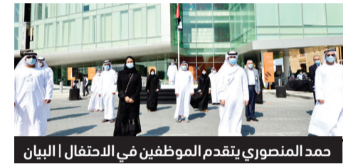
حمد المنصوري يتقدم الموظفين في الاحتفال

احتفت الهيئة العامة لتنظيم قطاع الاتصالات بيوم العلم الإماراتي، بمشاركة موظفي الهيئة في مبني الهيئة في أبوظبي ودبي، معبرين عن اعتزاز شعب الإمارات بعلم وطنهم الذي يمثل رمز الانتماء والوحدة، مؤكداً أن هذه المناسبة السنوية هي تأكيد للبيت الواحد، والانتماء الذي لا يزيد الزم إلا نباتاً ورسوخاً. وصدحت أنغام النشيد الوطني في ساحة الهيئة، في أجواء سادتها مشاعر الفخر والاعتزاز، وقد بدأ الاحتفال بكلمة افتراضية ألقاها حمد عبيد المنصوري مدير عام الهيئة العامة لتنظيم قطاع الاتصالات، تلاها رفع العلم أمام مبني الهيئة، وعزف السلام الوطني لدولة الإمارات. (دبي - البيان)