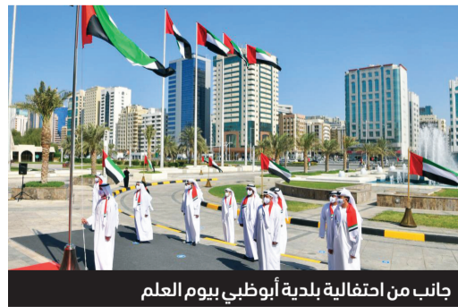
جانبا من احتفالية بلدية أبوظبي بيوم العلم

وعروبة ألوته، في كل المحافل والساحات رمزاً للتميز والعطاء المبدع».