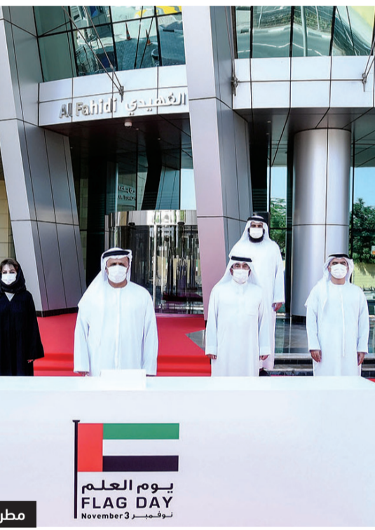
يوم العلم FLAG DAY نوفمبر 3