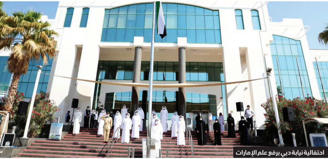
احتفالية نيابة دبي برفع علم الإمارات