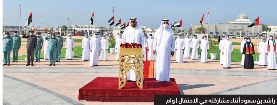
راشد بن سعود أثناء مشاركته في الاحتفال

سعود بن راشد المعلا رئيس دائرة البلدية، والشيخ صقر بن سعود بن راشد المعلا، والمهندس الشيخ أحمد بن خالد المعلا رئيس دائرة التخطيط العمراني بأم القيوين، واللواء الشيخ راشد بن أحمد المعلا قائد عام شرطة أم القيوين، وناصر سعيد التلاي مدير الديوان الأميري بأم القيوين، وراشد محمد أحمد مدير التشريعات بالديوان الأميري، وسيف حميد سالم مدير مكتب ولي عهد أم القيوين وعدد من المسؤولين.