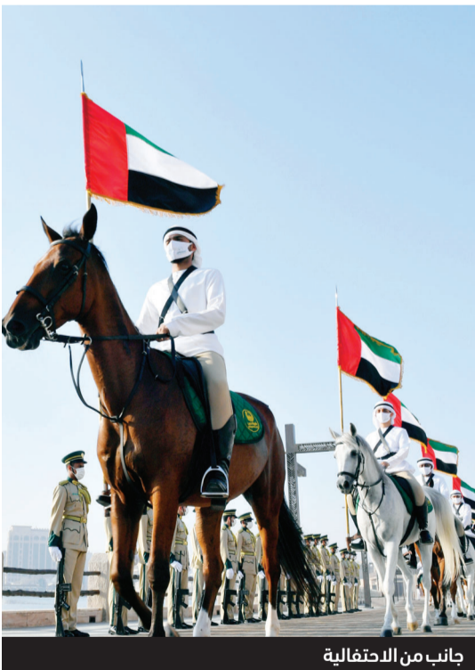
جانب من الاحتفالية