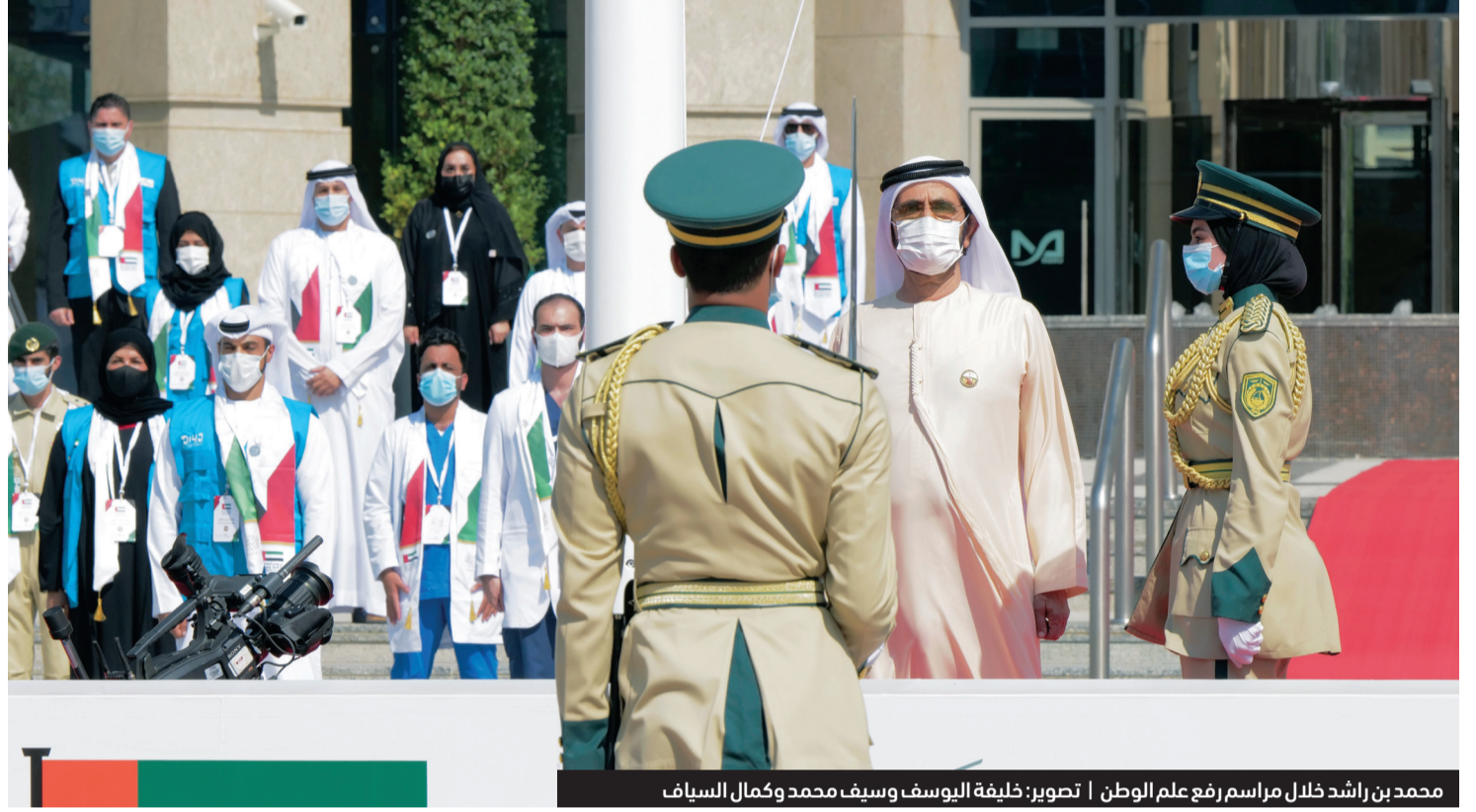
محمد بن راشد خلال مراسم رفع علم الوطن