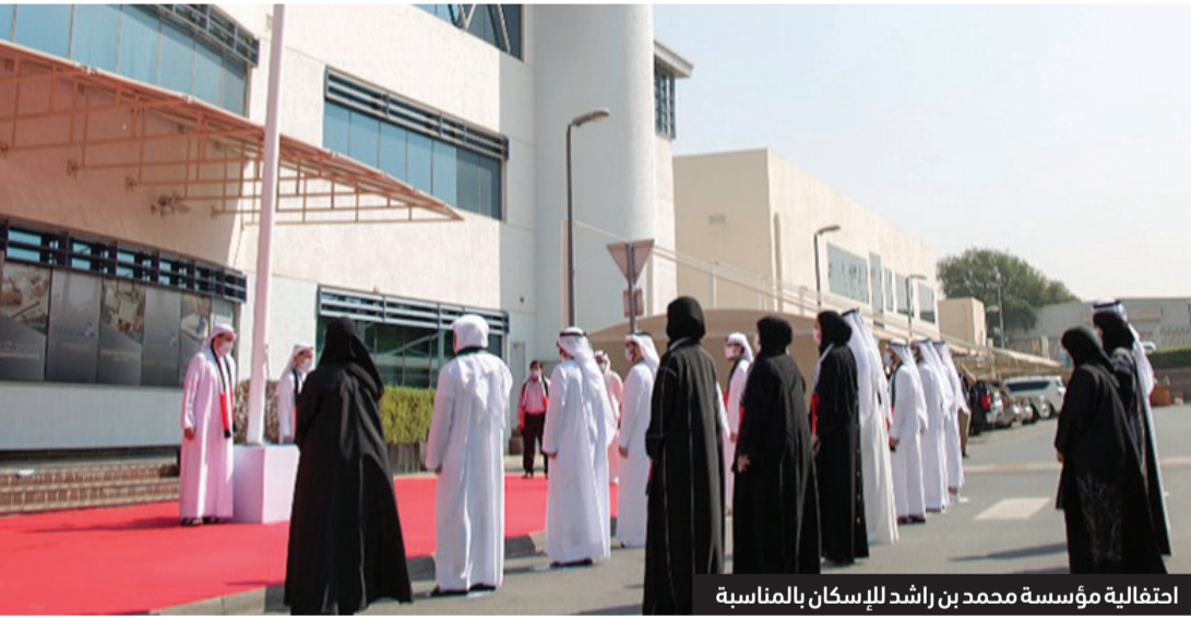
احتفالية مؤسسة محمد بن راشد للإسكان بالمناسبة