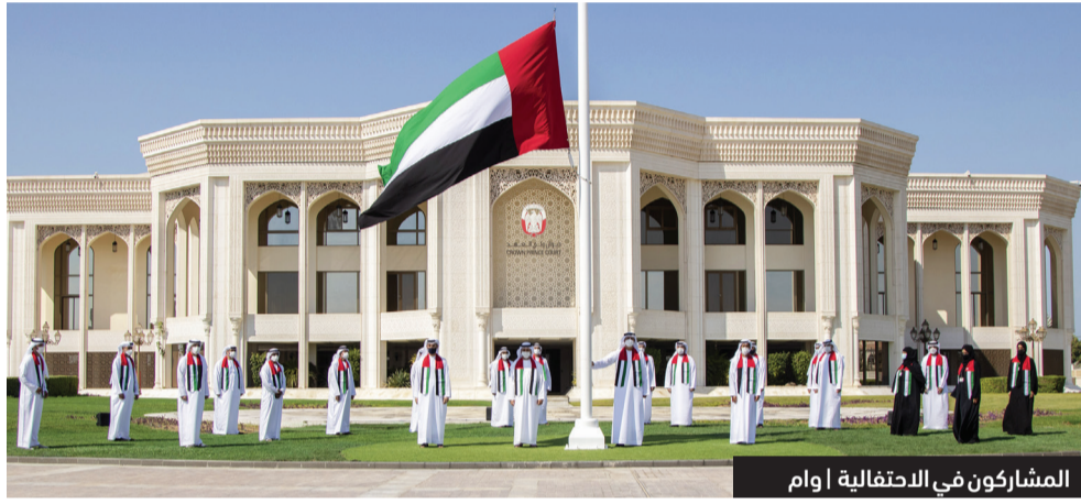
المشاركون في الاحتفالية ام

الدولة من إنجازات على جميع المستويات، واستذكّار الجهود المخلصة التي بذلها الآباء المؤسسون الذين رفعوا راية الوطن وضحو من أجل عزه ورفعته، والتي تشكل معيناً لنا بنضب نستقي منه حب الوطن والانتماء إليه.