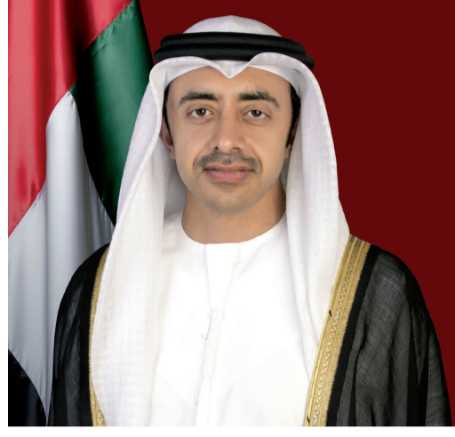
أبو ظبي - وام

أعضاء المجلس الأعلى للاتحاد، حكام الإمارات، وإلى أبناء الإمارات وكافة المقيمين على أرضها، مشيراً إلى أن علمنا يشكل دائماً حافظاً لنا جميعاً من أجل تحقيق المزيد من التقدم والتطور والريادة لوطننا. وأكد سموه أن علم الإمارات رمز وحدتنا وسيادتنا وسيظل على الدوام عالياً خفاقاً شامخاً يعانق بأحلام وطموحات الوطن عنان السماء مروراً بالقضاء ووصولاً إلى المريخ احتفاءً بمسيرة نصف قرن من الإنجازات. وبين سموه أهمية هذه المناسبة الوطنية في تعزيز قيم الولاء والانتماء لدى الأجيال الناشئة والتأكيد على ما يمثل علم دولة الإمارات من رمزية وحدوية تنموية، متقدماً بتحية تقدير واعتزاز لشهدائنا الأبرار الذين ضحوا بأرواحهم فداء لهذه الراية. وأكد سمو الشيخ عبدالله بن زايد آل نهيان أن دولة الإمارات برؤية وطموح قيادتها وعزيمة وإرادة أبنائها ستبقى قوية ومزدهرة حاملة رسالة سلام وأمل للعالم.