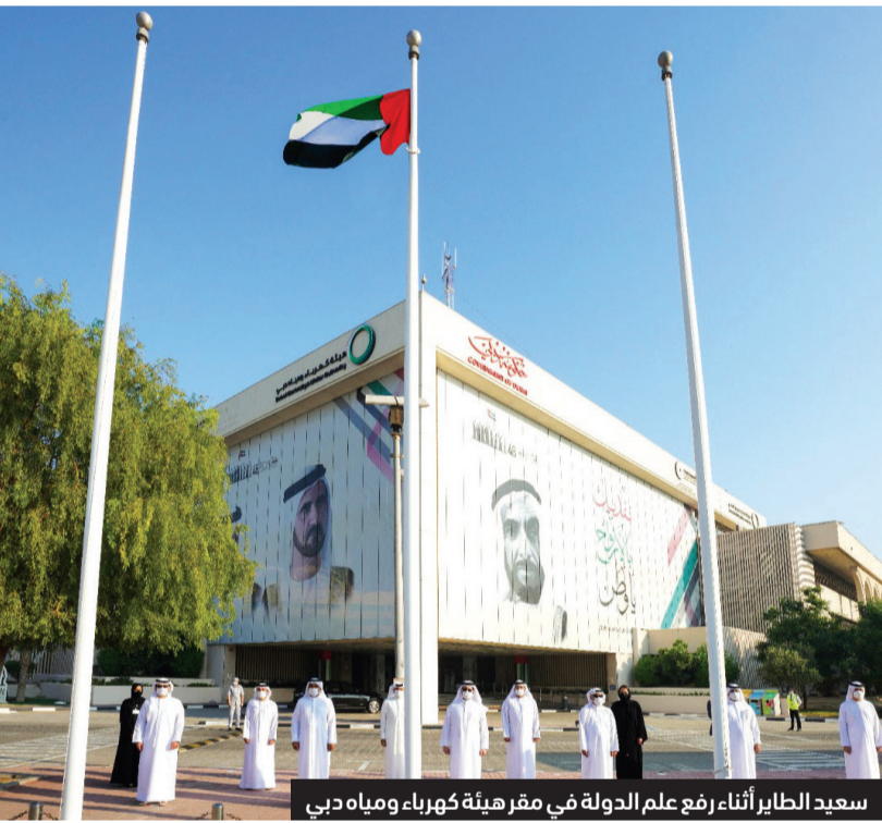
سعيد الطاير أثناء رفع علم الدولة في مقر هيئة كهرباء ومياه دبي