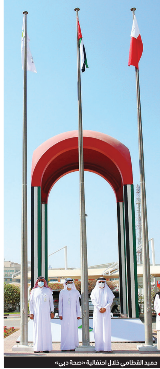
حميد القطامي خلال احتفالية «صحة دبي»