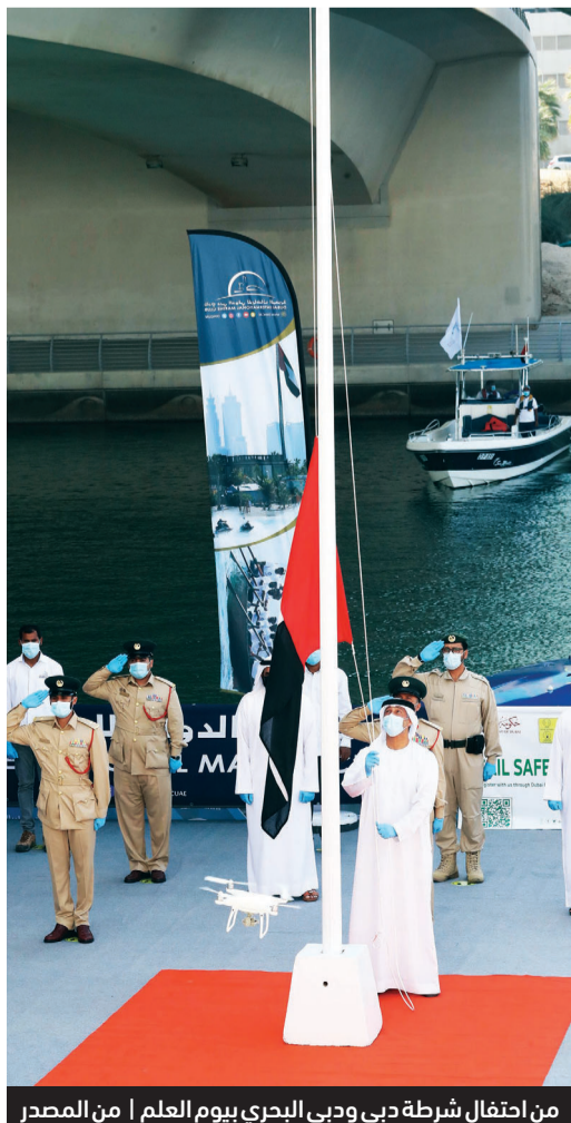
من احتفال شرطة دبي وديي البحري بيوم العلم

أكد عارف حمد العواني الأمين العام لمجلس أبوظبي الرياضي، أن الاحتفال بيوم العلم يجسد اللحمة الوطنية بين القيادة الرشيدة وأبناء الوطن المعطاء في أبهى صورها. وقال: لقد غرس الوالد المؤسس المغفور له بإذن الله تعالى الشيخ زايد بن سلطان آل نهيان، طيب الله ثراه، معاني خالدة وترك إرثاً عظيماً وكبيراً لإعلاء راية الوطن والمساهمة في نهضته وعزته، وكان للتفاني في العمل والاجتهاد خير تعبير عن الالتزام بهذا الإرث الطيب.