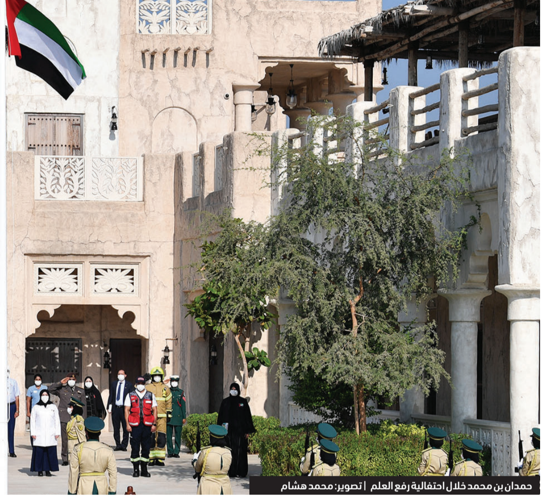
حمدان بن محمد خلال احتفالية رفع العلم

المناسبة تحية إعزاز وتقدير لكل من قدم جهداً أو عطاءً في سبيل الوطن ورفعته رابته، وقال سموه: «نستذكر في هذا اليوم المجيد عطاء أبطال ضحوا بأرواحهم الطاهرة في سبيل الحفاظ على كرامة وطنهم وسطروا بدمائهم الزكية أروع ملاحم البذل والعطاء.. تحية إعزاز وتقدير لشهدائنا الأبرار الذين ضربوا أروع أمثلة التفاني والفداء في سبيل الوطن لتبقى ذكراهم العطرة وقوداً يشعل الهمم ويحفز الطاقات لكي يبقى وطننا دائماً حراً كريماً عزيزاً أياً».