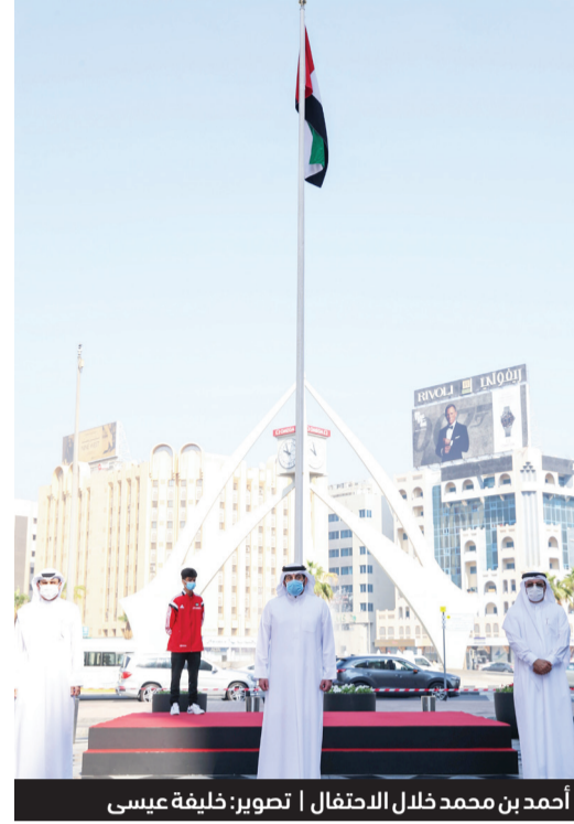
أحمد بن محمد خلال الاحتفال

ونوه سموه بالتقدم الكبير الذي يشهده قطاع الرياضة الإماراتية والذي نجح من خلاله أبطال وبطلات الإمارات في رفع علم دولتهم على منصات التتويج في العديد من المحافل الرياضية الكبرى. وأعرب سموه عن تقديره لجميع الرياضيين والمنتخبات الوطنية سواء ضمن الألعاب الفردية أو الرياضات الجماعية،