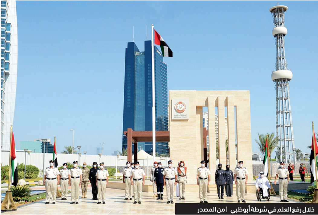
خلال رفع العلم في شرطة أبوظبي ام المنصدر

وقائية واحترافية مناسبة. وأضاف: «إن يوم العلم مناسبة غالية على قلوبنا نستشمرها لنجدد بكل عزم وإيمان عهد الولاء والإخلاص لرايتنا الشامخة، ولقادة الوطن، ولماضيهِ المجيد وحاضره المزهده ومستقبله الواعد، وهو تجديد للتعظيم، مؤكدةً أن يوم العلم هو فرصة الاتحاد نحو آفاق التطور والبناء والتمكين للوطن والمواطن ولمستقبل أجيالنا الصاعدة».