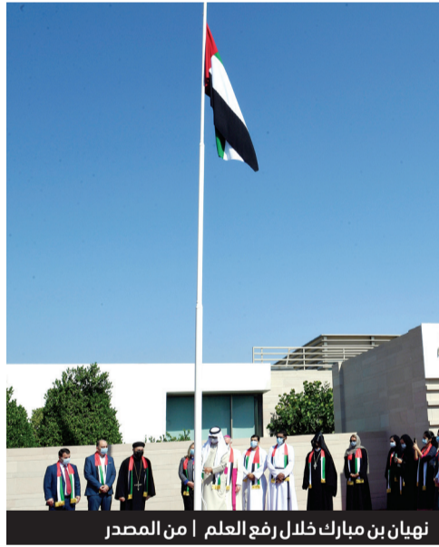
نهيان بن مبارك خلال رفع العلم

وأكد معاليه على القيم الأساسية التي أسس عليها هذا الوطن على يد الوالد المؤسس المغفور له بإذن الله الشيخ زايد بن سلطان آل نهيان، طيب الله ثراه، وهي التسامح والتعايش والسلام والتعاطف والحوار الإيجابي بين كافة المقيمين على أرض هذا الوطن بصرف النظر عن ثقافتهم وأديانهم، لأن هذا كله يؤكد أن مواطني إمارات المحبة والسلام والتسامح متحدون دائماً في الانتماء لهذا الوطن والولاء لقيادته الرشيدة والحب والوفاء لرايته المرفوعة دائماً وأبداً إلى السماء.