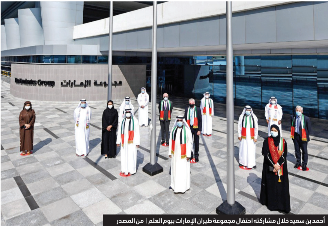
أحمد بن سعيد خلال مشاركته احتفال مجموعة طيران الإمارات بيوم العلم

وأضاف سموه: «التزامنا بدعم أمتنا ثابت لا يتزعزع، خصوصاً في هذه الظروف الصعبة. وفي الوقت الذي نحيا يوم العلم، فإننا نحتفل أيضاً بإنجازات دولتنا خلال العام الماضي، بما في ذلك دعمها المجتمع الدولي خلال الجائحة، وإطلاق مسبار الأمل إلى المريخ. نحن مستعدون لمواجهة التحديات والتغلب عليها، ونقاؤنا بالمستقبل ليس له حدود». من جهة ثانية، رفع سمو الشيخ أحمد بن سعيد آل مكتوم رئيس هيئة دبي للطيران المدني رئيس مطارات دبي الرئيس الأعلى الرئيس التنفيذي لطيران الإمارات والمجموعة، علم الإمارات أمام ساحة مبنى 3 في مطار دبي الدولي وذلك احتفالاً بيوم العلم.