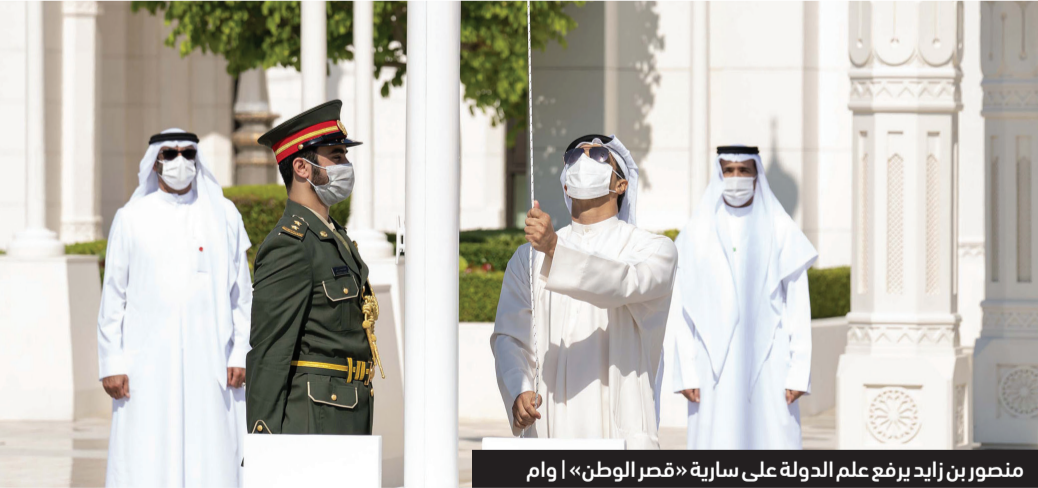
منصور بن زايد يرفع علم الدولة على سارية «قصر الوطن»

لعلم الدولة وسط عزف السلام الوطني، ليرفرف عالياً على سارية قصر الوطن.