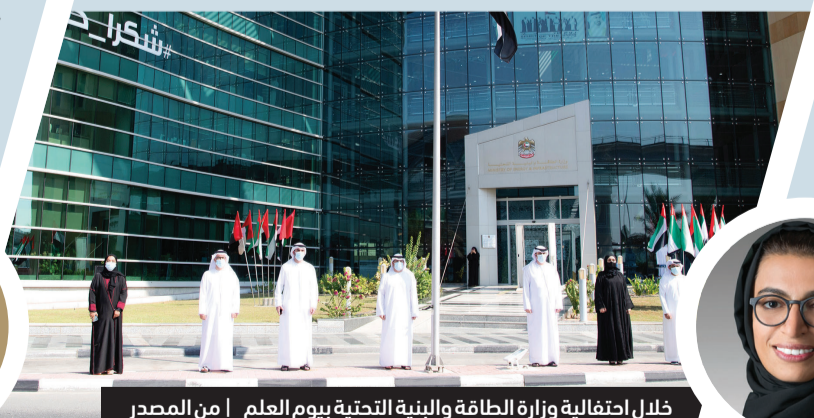
خلال احتفالية وزارة الطاقة والبنية التحتية بيوم العلم

أحييت وزارة الطاقة والبنية التحتية، والمناطق التابعة لها في جميع أرجاء دولة الإمارات العربية المتحدة، أمس، مناسبة يوم العلم، استجابةً لمبادرة صاحب السمو الشيخ محمد بن راشد آل مكتوم نائب رئيس الدولة رئيس مجلس الوزراء حاكم دبي، رعاه الله، للاحتفال بيوم العلم. وقال معالي سهيل المزروعى وزير الطاقة والبنية التحتية: «إن الاحتفاء بيوم العلم إحياء لإنجازات عظيمة، ومسيرة دولة رائدة عالمياً، ومن خلاله نجدد انتماءنا وولاءنا وشعورنا بحب الوطن، كما يعزز التلاحم والتكاتف الشعبي وقيم الوحدة الوطنية، والتسامح في دولة الإمارات العربية المتحدة». (دبي - البيان)