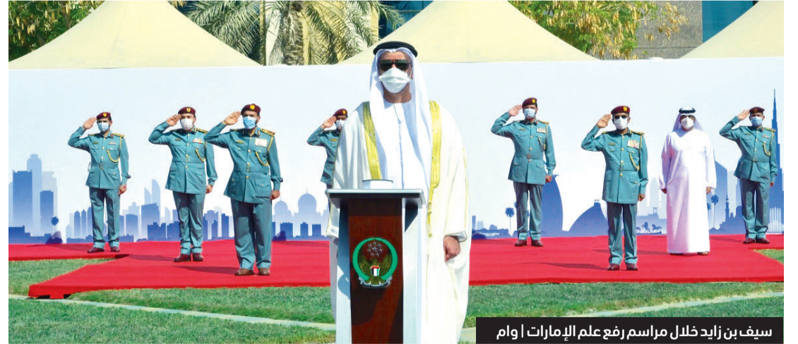
سيف بن زايد خلال مراسم رفع علم الإمارات

العامة للشرطة بمناسبة احتفال دولة الإمارات العربية المتحدة بـ «يوم العلم».