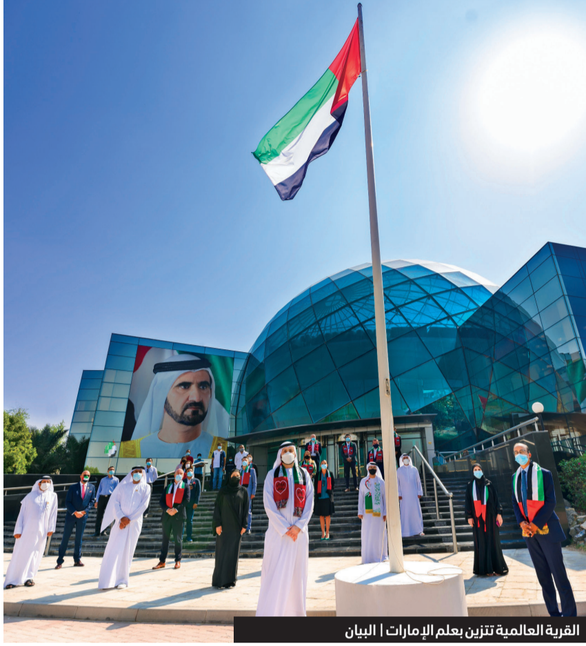
القرية العالمية تترين بعلم الإمارات | البيان

بوحמיד، الرئيس التنفيذي للتسويق. وبهذه المناسبة، عبّر موظفو المجموعة عن ولائهم وفخرهم بانتمائهم لهذا الوطن والتزامهم دعم مسيرة التنمية والازدهار وتمسكهم بقيم العدل والسلام والتسامح المتجذرة في ثقافة دولتنا الحبيبة.