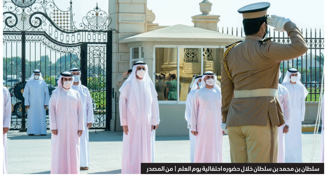
سلطان بن محمد بن سلطان خلال حضوره احتفالية يوم العلم