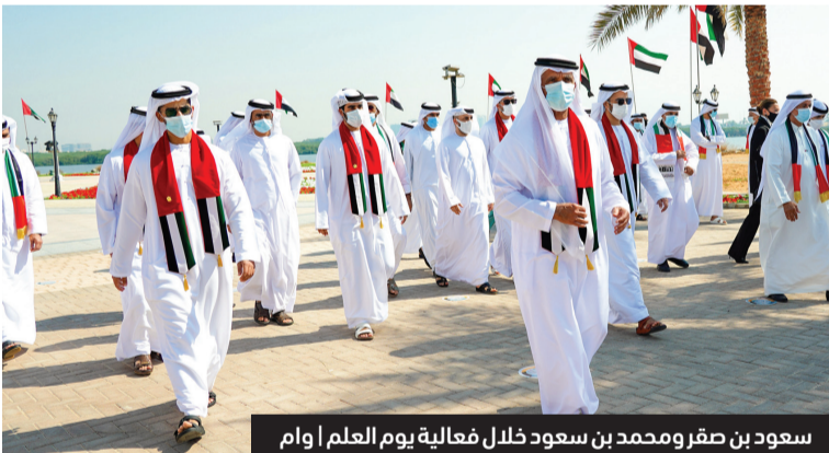
سعود بن صقر ومحمد بن سعود خلال فعالية يوم العلم

أكد صاحب السمو الشيخ سعود بن صقر القاسمي، عضو المجلس الأعلى حاكم رأس الخيمة، أن يوم العلم يمثل احتفالية بالقيم الأصيلة والمبادئ الأساسية التي قامت عليها دولة الإمارات العربية المتحدة، وتعبير عن معاني الولاء والانتماء والتلاحم بين القيادة الرشيدة وأبناء الوطن. جاء ذلك خلال حضور صاحب السمو حاكم رأس الخيمة يرافقه سمو الشيخ محمد بن سعود بن صقر القاسمي، ولي