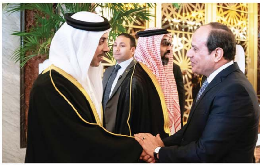
.. ومنصور بن زايد