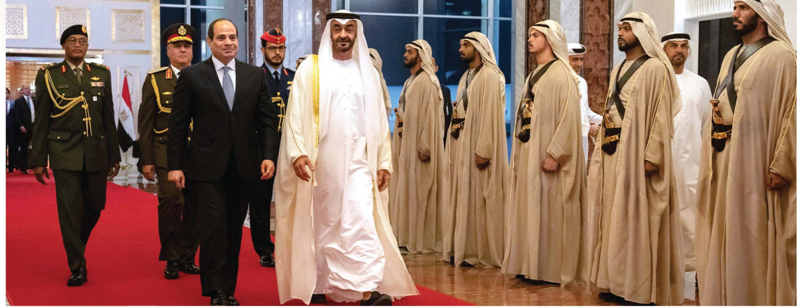
محمد بن زايد في مقدمة مستقبلي الرئيس المصري