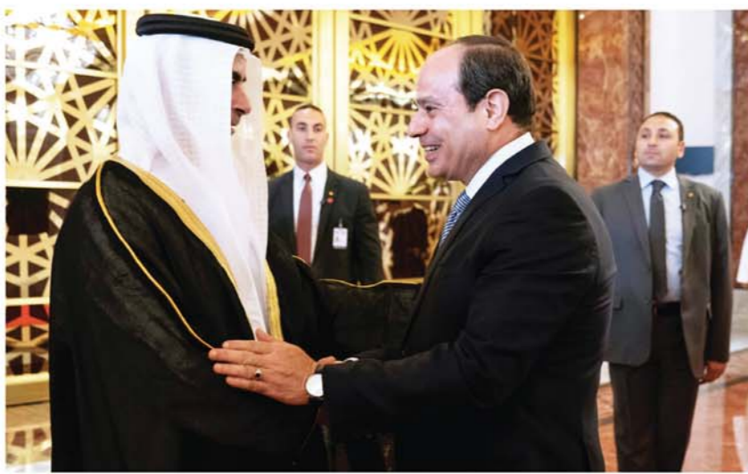
السيسي مصافحاً سيف بن زايد