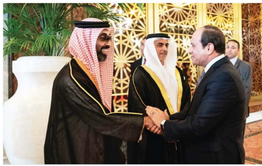
السيسي مصافحاً طحون بن زايد