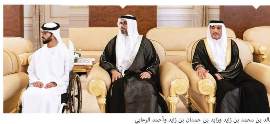
خالد بن محمد بن زايد وزايد بن حمدان بن زايد وأحمد الزعابي