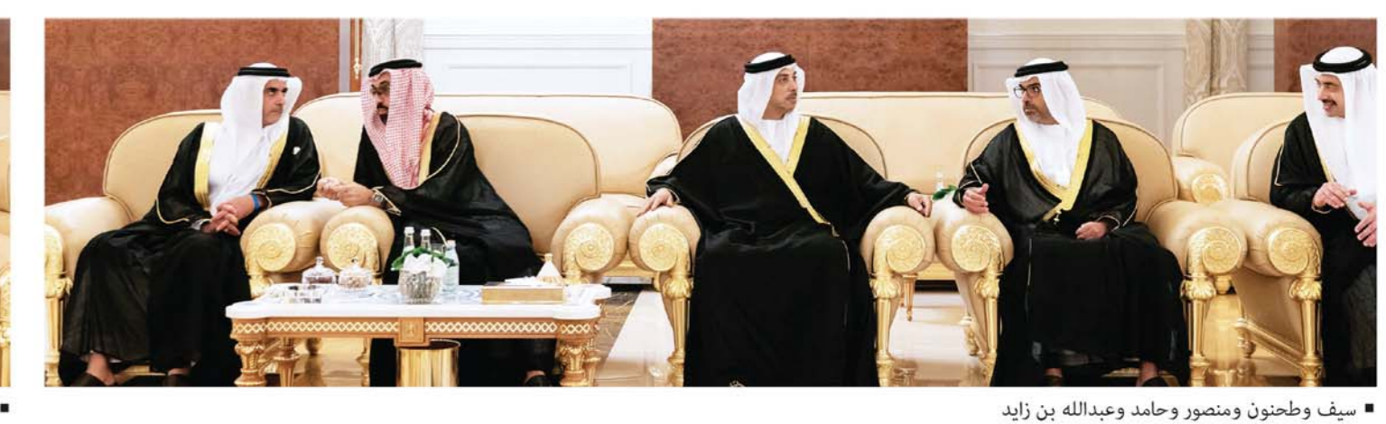
سيف وطحون ومنصور وحامد وعبدالله بن زايد