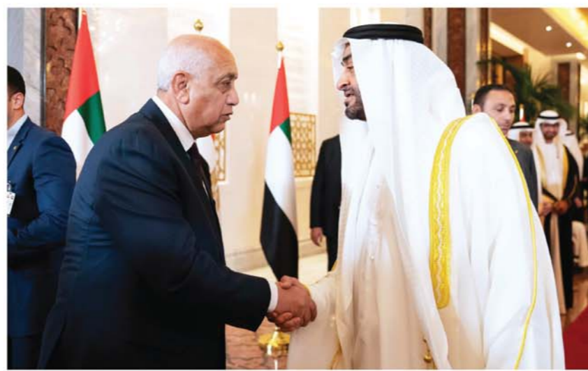
محمد بن زايد مرحباً بأعضاء الوفد المصري