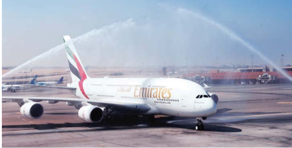
■ خلال الترحيب برحلة تجريبية لطائرة الإمارات «إيرباص A380» العملاقة في مطار القاهرة | البيان

وتمتد علاقة «طيران الإمارات» الوثيقة مع مصر إلى أكثر من 30 عاماً، حيث تعد القاهرة من أوائل المطارات التي بدأت طيران الإمارات خدمتها، حيث بدأت تشغيل رحلاتها إليها في أبريل 1986، ونقلت على هذا الخط منذ ذلك الحين أكثر من 7,3 ملايين راكب وشهدت العمليات نمواً مضطرداً لمواكبة طلب العملاء. وزادت «طيران الإمارات» اعتباراً من أكتوبر الماضي عدد الرحلات الجوية إلى القاهرة بإضافة 4 رحلات في الأسبوع، ما يرتفع بإجمالي رحلات طيران الإمارات التي تخدم القاهرة من 21 إلى 25 رحلة في الأسبوع. ويعمل أكثر من 2000 مواطن مصري في مجموعة متنوعة من الأدوار ضمن مجموعة الإمارات، بمن فيهم ما يزيد على 1000 من أفراد أطقم الخدمات الجوية. وتشمل أشهر الوجهات التي يسافر إليها المصريون ضمن شبكة خطوط طيران الإمارات مدناً في آسيا والأمريكيتين وأستراليا، مثل بكين وشنغهاي وهونغ كونغ وبانكوك، وسيدني ونيودهلي ومومباي، ونيويورك وواشنطن العاصمة. وفي أكتوبر الماضي، بدأت «طيران الإمارات» تسيير