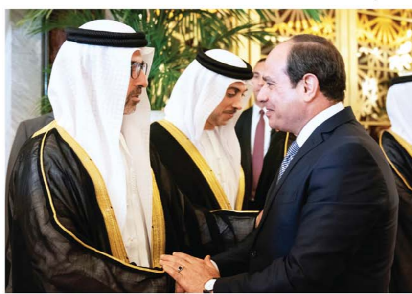
السيسي مصافحاً حامد بن زايد