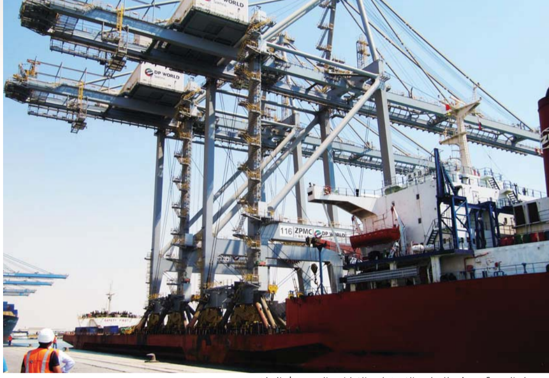
■ ميناء السخنة نموذج للتعاون الاستثماري الإماراتي المصري | البيان

تستند لتاريخ طويل من العلاقات السياسية والاقتصادية والاجتماعية الراسخة، حيث تتسم العلاقات الإماراتية المصرية بأنها نموذج يحتذى من حيث قوتها ومتانتها، وأدى لزيادة قوة العلاقات الثنائية بين البلدين من يوم إلى آخر، إلى ازدياد التعاون بينهما في جميع المجالات وخاصة المجالات الاقتصادية والاستثمارية، الأمر الذي أدى إلى ازدياد حجم الاستثمارات الإماراتية بحيث أصبحت