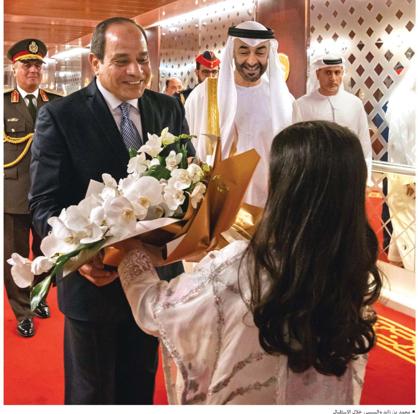
محمد بن زايد والسيسي خلال الاستقبال