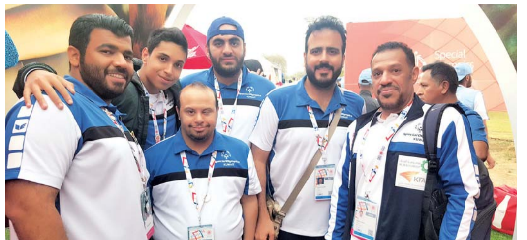
■ لاعبو منتخب الكويت لكرة اليد مع المدرب