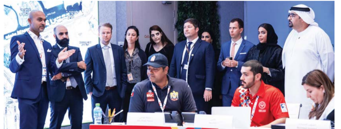
■ وفد إكسبو 2020 دبي خلال الزيارة