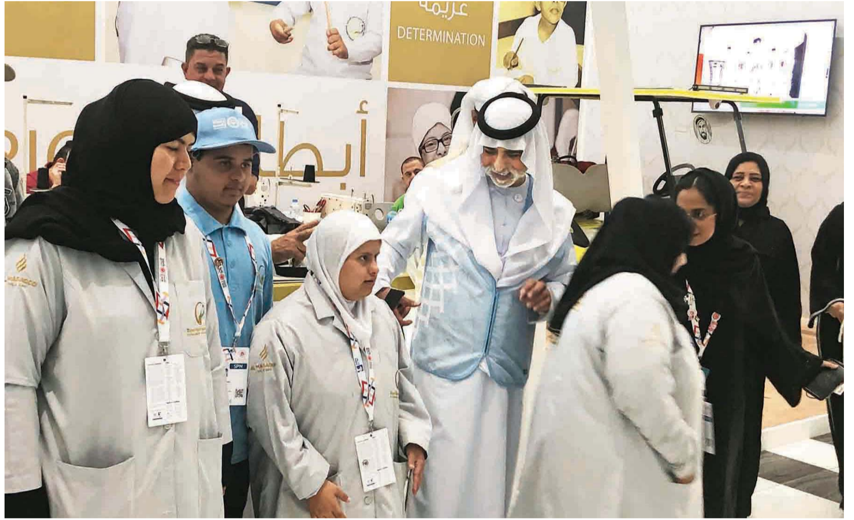
نهيان بن مبارك مرتدياً زي المتطوعين خلال زيارته لـ«ادنيك»