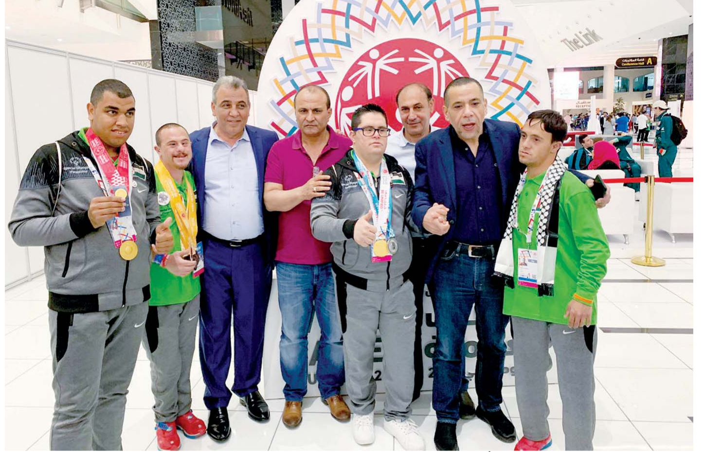
سفير فلسطين يتوسط اللاعبين المشاركين في الأولمبياد الخاص | البيان