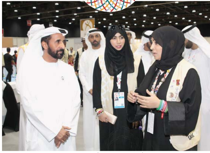
■ مسلم بن حم خلال زيارته أرض المعارض في أبوظبي | البيان

وأشاد الشيخ مسلم بدعم السخي والرعاية التي توليها القيادة الرشيدة، واهتمامهم المباشر بتنمية القطاع الرياضي والارتقاء به لطليعة الدول العالمية، مؤكداً أن الإمارات بالنهج الإنساني الذي تسير عليه في تقديم الرعاية لعموم المجتمع بمن فيهم أصحاب الهمم، تحقق الريادة وتؤكد أن أرض زايد هي أرض مختلف الثقافات وموطن التسامح. أبوظبي - البيان الرياضي