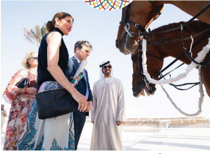
■ خليفة بن طحون آل نهيان وتيموثي شرايفر خلال الزيارة | وام

زار أمس تيموثي شرايفر، رئيس الأولمبياد الخاص الألعاب العالمية، واحة الكرامة في أبوظبي، حيث كان في استقباله الشيخ خليفة بن طحون آل نهيان، مدير تنفيذي مكتب شؤون أسر الشهداء في ديوان ولي عهد أبوظبي. وبصحة الشيخ خليفة بن طحون آل نهيان تجول شرايفر في أروقة واحة الكرامة التي تطلها عرض سلام العلم وعزف الفرقة الموسيقية والخيالة. أبو ظبي - وام