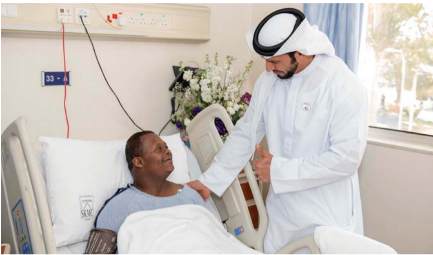
■ عبدالله آل حامد يزور المرضى من أصحاب الهمم