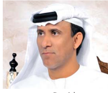
■ محمد بن ثعلوب الدرعي

عبر محمد بن ثعلوب الدرعي رئيس اتحاد المصارعة والجودو عن سعادته بالمشاركة الإيجابية لمنتخب الإزادة لفئة أصحاب الهمم للجودو في دورة الألعاب العالمية للأولمبياد الخاص، وقال بن ثعلوب: «إن منتخب الإزادة لأصحاب الهمم للجودو سيجد كل اهتمام خلال المرحلة القادمة، مع توفير فرص التدريب والمشاركة في المنافسات الرسمية مع أقرانهم الأسوياء بعد التألق الراقع خلال الأولمبياد الحالي،