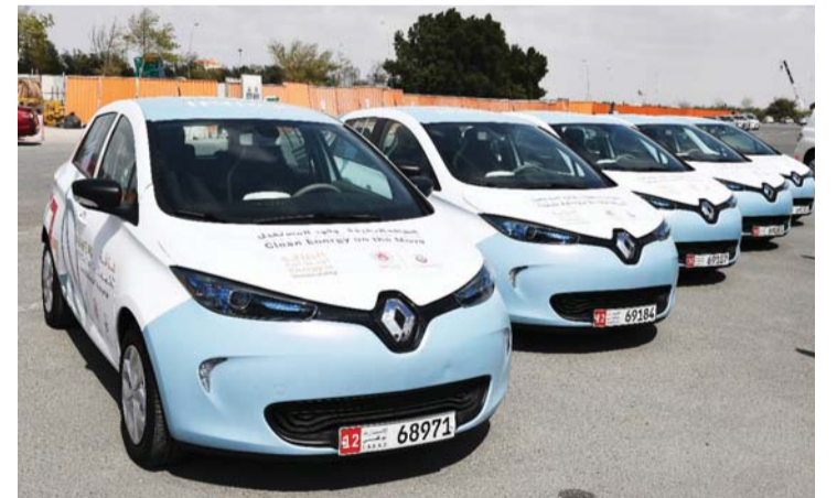
دائرة الطاقة توفر سيارات كهربائية للتنقل بين مقرات الأولمبياد الخاص | البيان