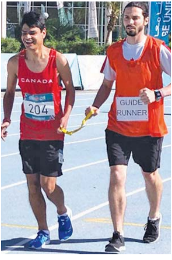
■ كوفاتشي عزيمة على الفوز | البيان

تمكن الكندي جو كوفاتشي، من تحقيق إنجاز رائع، وفاز بالميدالية البرونزية في سباق 5 آلاف متر جري لفئة M01 بالأولمبياد الخاص، وشارك في السباق بمساعدة الدليل الخاص به، وقطع السباق في 31:51:48 دقيقة. وفاز بالذهبية الصيني هونغ لانغ غاو بزمن 26:56:27 دقيقة، وبالفضية السنغافوري ديي - البيان الرياضي.