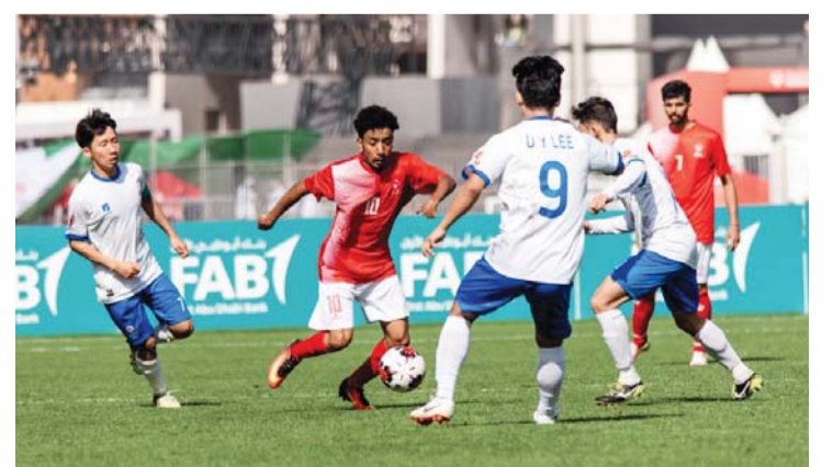
■ من مباراة منتخبنا وكوريا