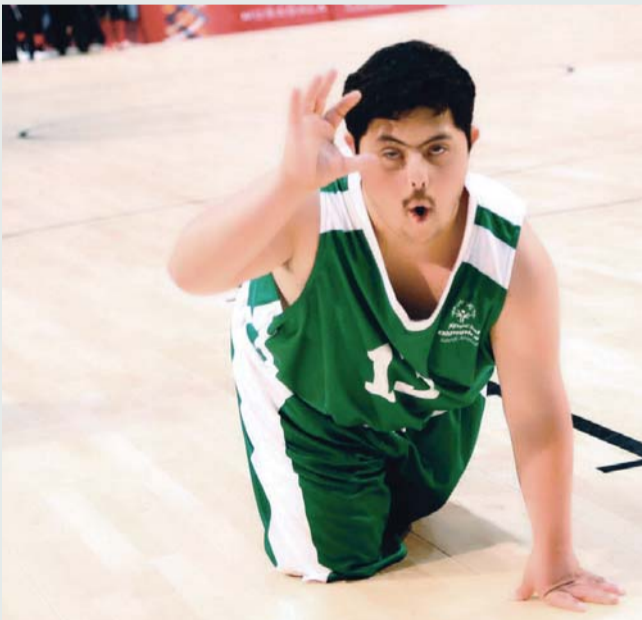
■ الزيد لحظة تقليده مهاجم الهلال السعودي