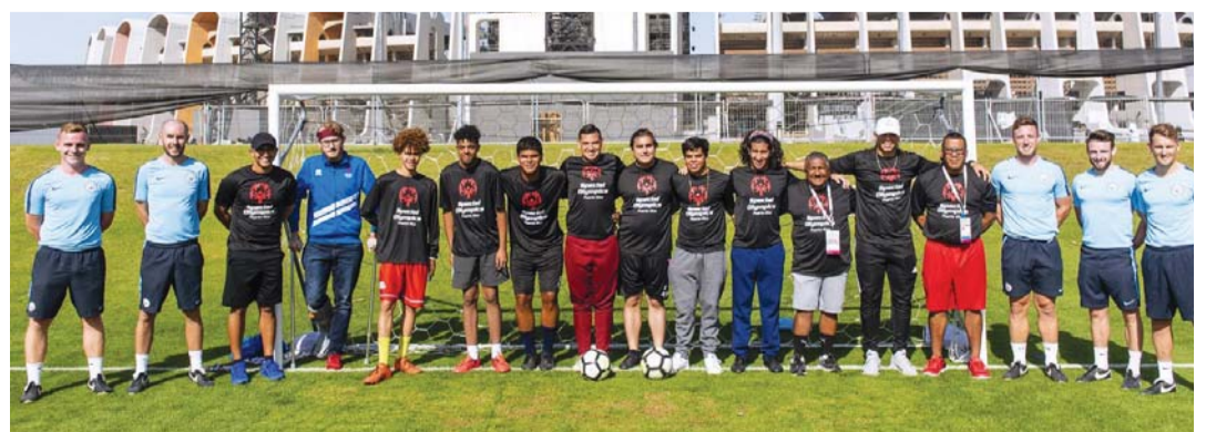
■ نقطة جماعية للمشاركين في الفعالية | البيان