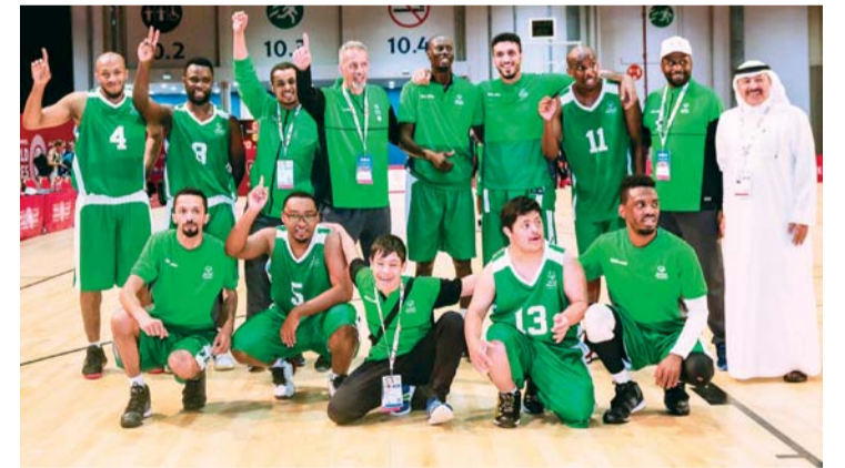
■ لاعبو الأخضر السعودي يحتفلون بالفوز