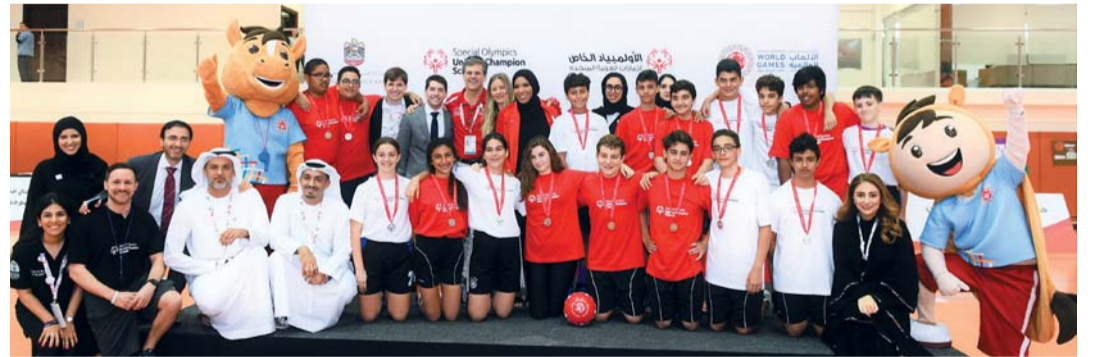
■ جانب من حفل إطلاق برنامج مدارس الأبطال الموحدة

وأضاف: «أجرينا فحوص السمع لنحو 3000 رياضي ورياضية وحتى مدرسين من أصحاب الهمم المشاركين في الألعاب العالمية، ومن مختلف الأعمار السنية، ومن دول عدة من المتواجدين في المنافسات، والأمير الراحل أننا نجحنا في رسم البسملة على وجوه 121 رياضياً ممن استعادوا السمع، حيث نرى هؤلاء الرياضيين يفتخرون ونحن نرى هؤلاء الرياضيين يفتخرون السمع لأول مرة في حياتهم، ومنهم حالة مؤثرة للغاية وهي للاعب كرة قدم سنغالي يبلغ من العمر 31 عاماً ومشارك في الأولمبياد الخاص سمع لأول مرة في حياته، إذ بكى عند سماعه لأول مرة وأبكى من حوله سواء مدربه أو زملاءه في الفريق، حيث كان هذا اللاعب يتواصل بصعوبة مع زملائه ومدربه ويعاني مشكلة غالية في الدقة في السمع، ولكن نجحت الحالة من ضمن حالات أخرى أجرت الفحص