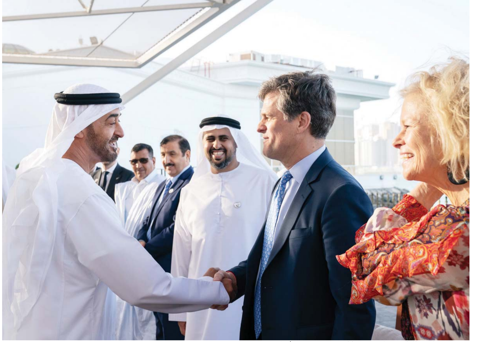
■ محمد بن زايد مصافحاً تيم شرايفر بحضور ذياب بن محمد بن زايد