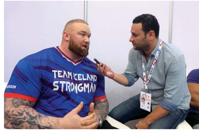
■ محرر البيان مع البطل | البيان

وأبدى بيورنسون إعجابه بالعاصمة أبوظبي والمعالم السياحية التي تتضمنها المدينة، والمستوى التنظيمي العالي للألعاب العالمية للأولمبياد الخاص في ظل مشاركة أكثر من 7500 رياضي ورياضية من 200 دولة في العالم وهو عمل تستحق عليه الإمارات الشكر والتقدير. وعن الرسالة التي يوجهها لأصحاب الهمم قال: «أنتم عظماء وأبطال ولا تجعلوا شيئاً يوقف في طريق طموحاتكم».