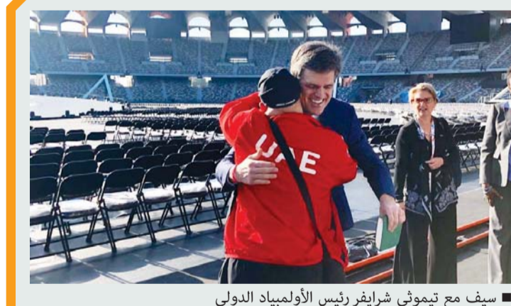
■ سيف مع تيموثي شرايفر رئيس الأولمبياد الدولي

سنوات، وسيف يحترف البولنج بجانب السياحة وهو بطل لامع خلال مسابقات الأولمبياد الخاص والتي بدأها منذ عام 2002، وله صور تاريخية مع مؤسس الأولمبياد الخاص الدولي، كما استقبل تيموثي شرايفر رئيس الاتحاد الدولي للأولمبياد الخاص عام 2006، وسجما معاً في دبي، كما تجمعه صورة تاريخية مع الراحلة يونيس شرايفر مؤسسة الأولمبياد الخاص الدولي.