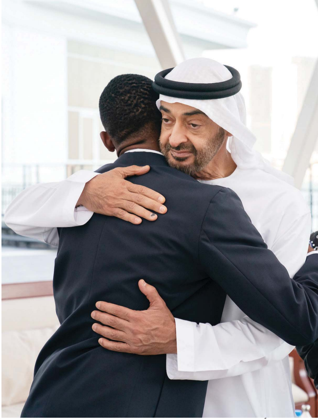
■ محمد بن زايد مرحباً بأحد أبطال الإزادة