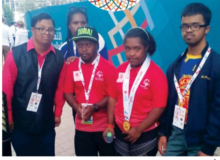
■ أبطال بابوا غينيا الجديدة خلال التتويج | البيان