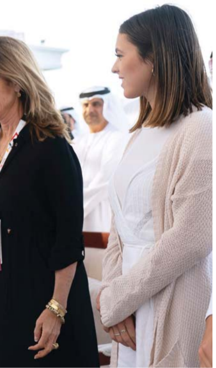
■ ولي عهد أبوظبي يصفح ماريا شرايفر