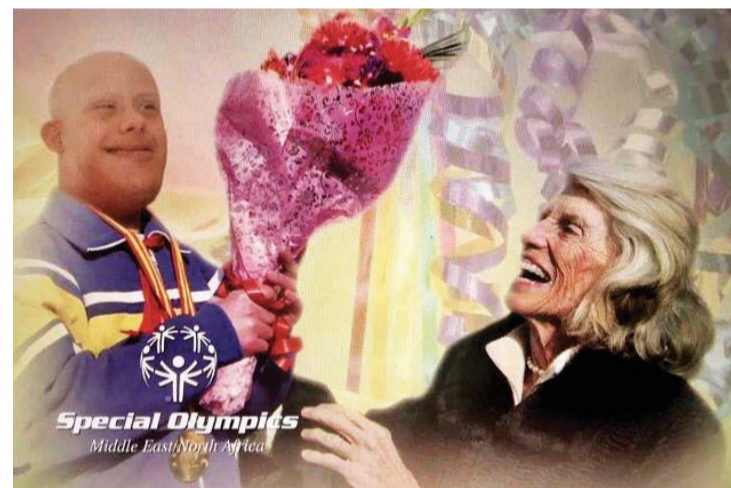
■ سيف الدبل في صورة تاريخية مع يونيس مؤسسة الأولمبياد الخاص الدولي