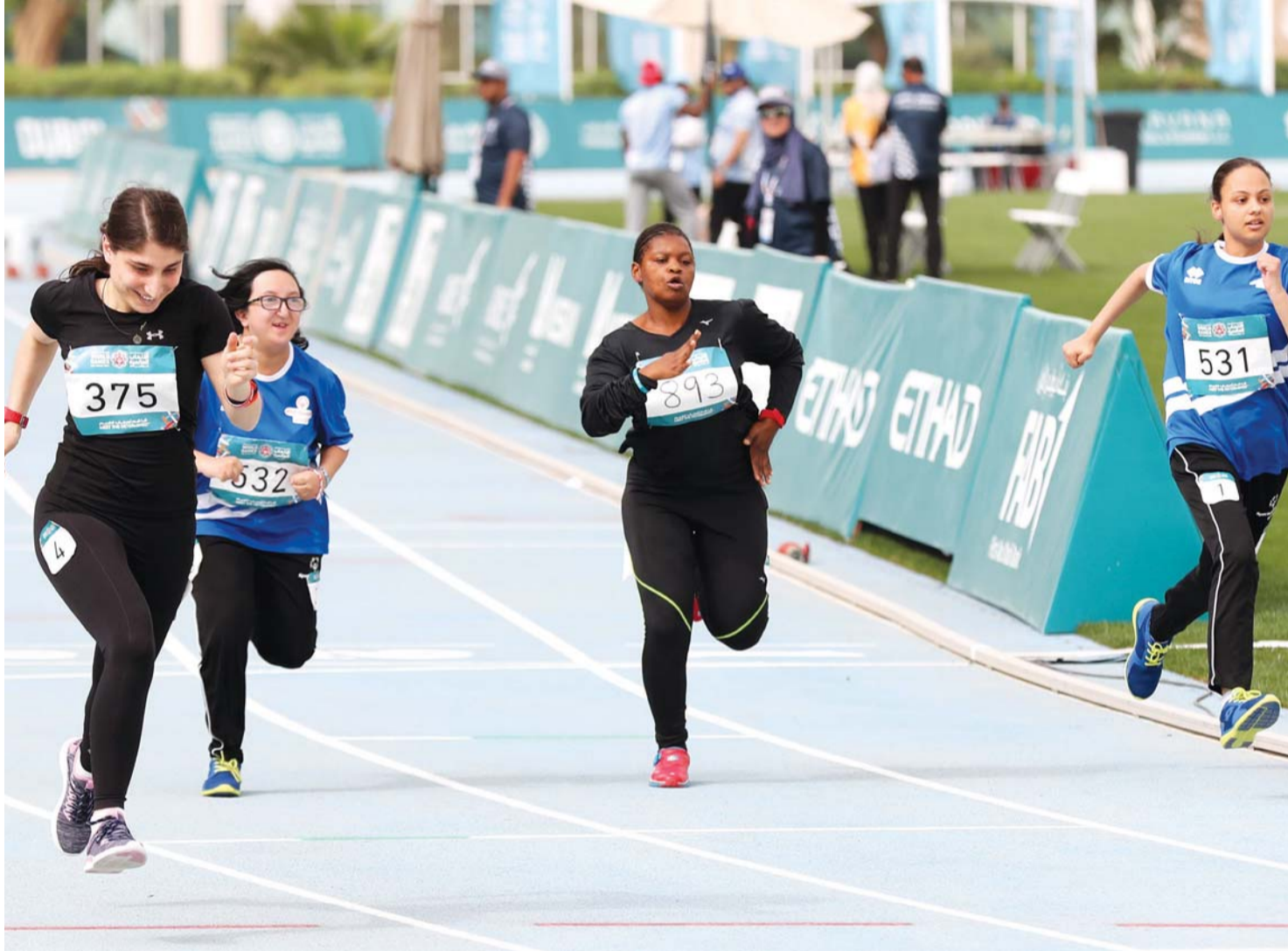
■ جانب من المنافسات

واستطرد معاليه وأضاف: هذا الأمن هو الذي يشجع على تنظيم البطولات الكبيرة لأن الناس لا يأتون إذا لم يكن هناك إحساس بالأمن والأمان، وهي أشياء متوفرة في دولة الإمارات تساعد على نجاح تنظيم كافة الفعاليات.