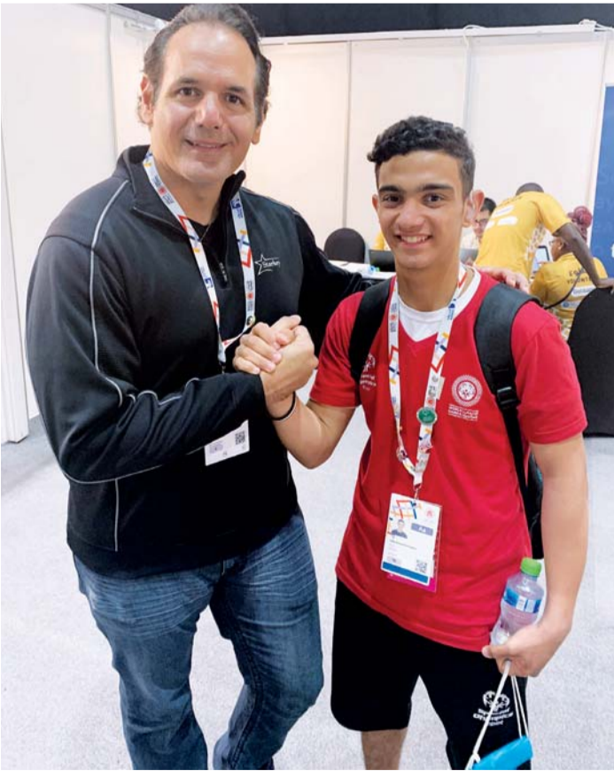
■ بشارة مع لاعب منتخب مصر بعد نجاح الفحص | البيان

وصاحب ستاركي الدكتور بيل أوستن متواجد ويقوم بنفسه بإجراء الفحوص للرياضيين، بالإضافة إلى 40 فرداً لخدمة الرياضيين، إذ يستمر العمل منذ الصباح الباكر وحتى ساعة متأخرة في أرض المعارض، حيث يستمر في استقبال جميع الرياضيين حتى نهاية الأولمبياد الخاص».