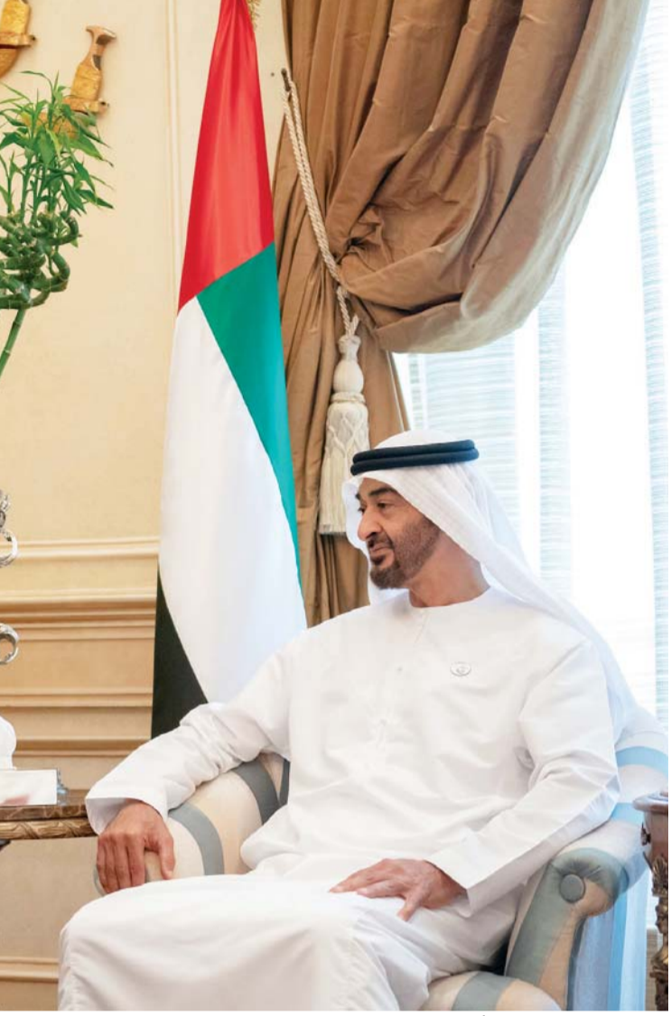
■ محمد بن زايد مستقبلاً السيناتور روي بلانت | وام