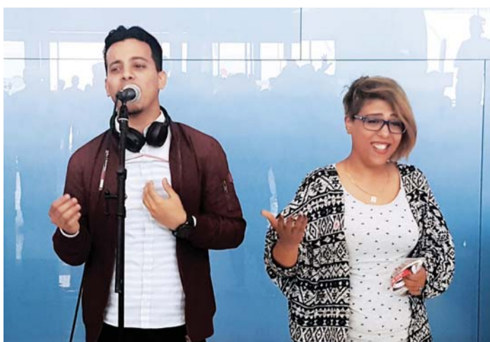
■ فنانو أسرة الزمن الجميل حرصوا على المشاركة

والفنية وغيرها، وأضاف: بالتأكيد نحن فخورون بنجاح الإمارات خاصة أنها تمثل كل العرب في هذا التحدي الذي اجتازته بنجاح.