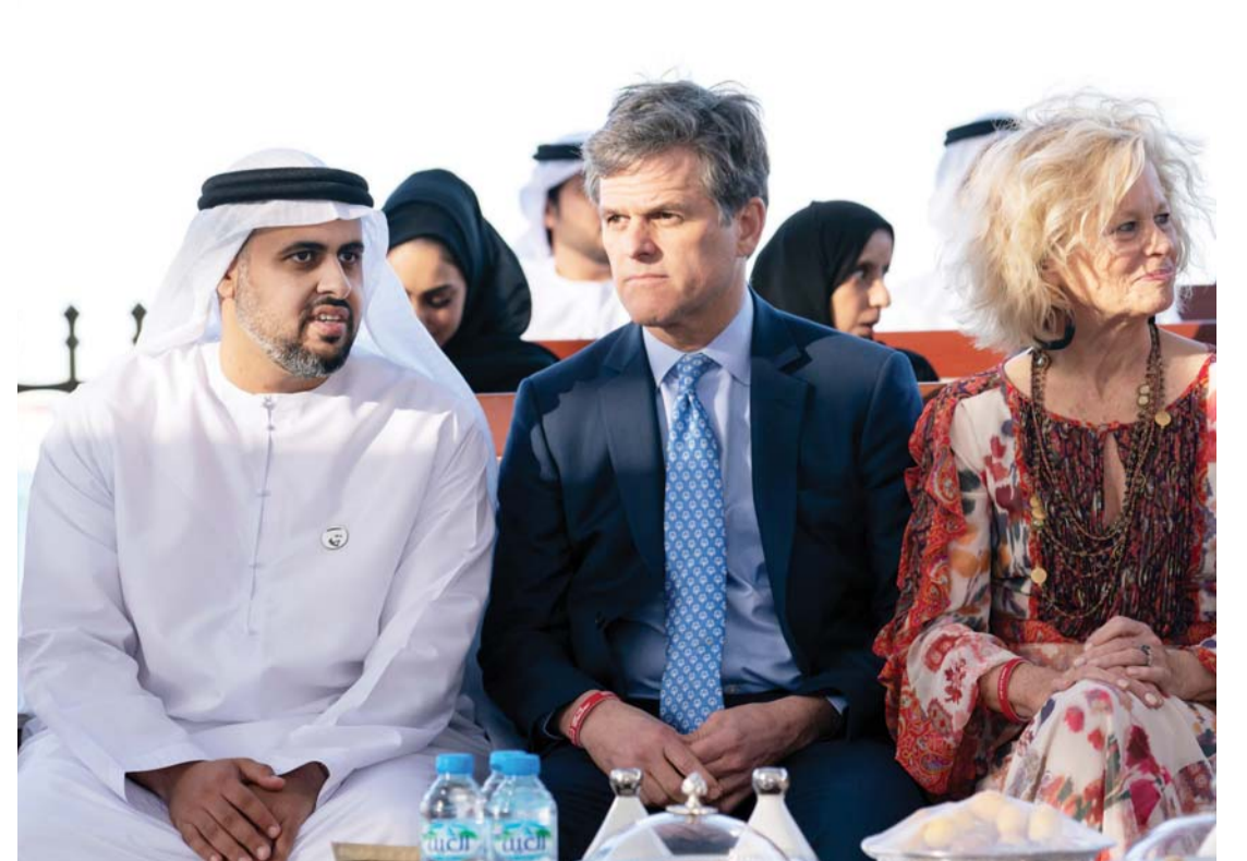
■ ذياب بن محمد بن زايد وتيم شرايفر خلال الاستقبال