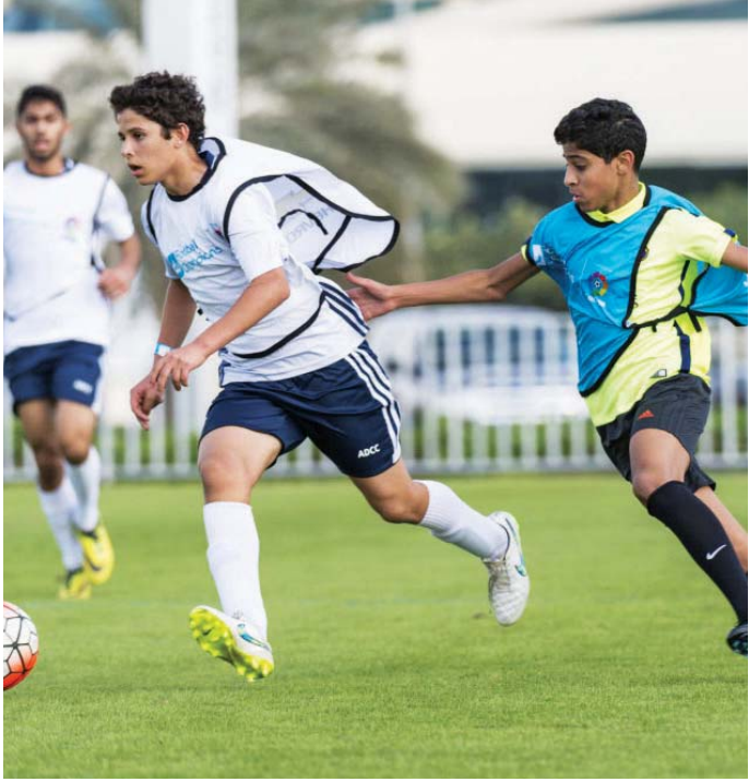
■ الفئات الأربع إضافة حقيقة | البيان