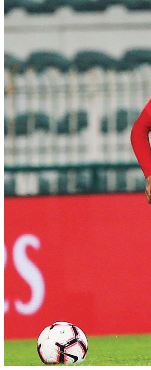
■ الأندية استفادت من المواهب الواعدة | البيان