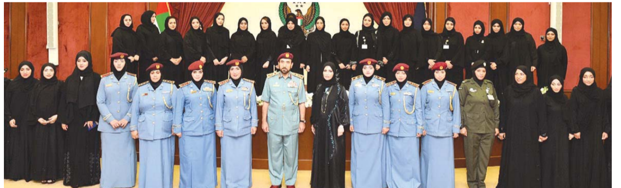
■ سيف الشفغار متوسطاً منسبات وزارة الداخلية