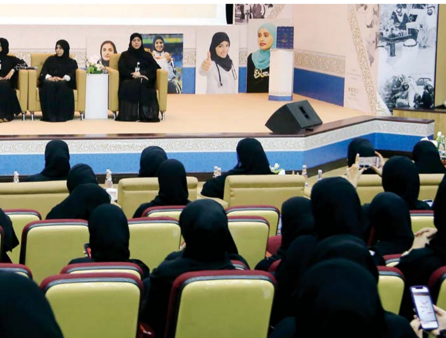
خلال احتفال مؤسسة التنمية الأسرية في أبوظبي | تصوير: مجدي اسكندر

خدماتها للأسرة الإماراتية التي أراد لها زايد الخير ولكافة أفرادها مزيداً من الاستقرار والسعادة في تلك الأيام من سبعينيات القرن الماضي. وتابعت: ونحن نتحدث عن المرأة الإماراتية و جهود التمكين التي بدأت قبل الاتحاد وإلى يومنا هذا لا يمكننا تجاوز هذا التاريخ دون أن نذكر بكل الفخر والاعتزاز الدور الكبير الذي قامت به سمو الشيخة فاطمة بنت مبارك، رئيسة الاتحاد النسائي العام الرئيس الأعلى لمؤسسة التنمية الأسرية رئيسة المجلس الأعلى للأمومة والطفولة «أم الإمارات»، في تبني قضايا المرأة ودعمها والوقوف وراء المشاريع الكبرى التي