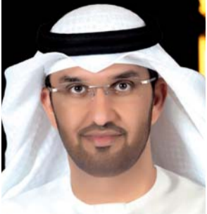
■ سلطان الجابر