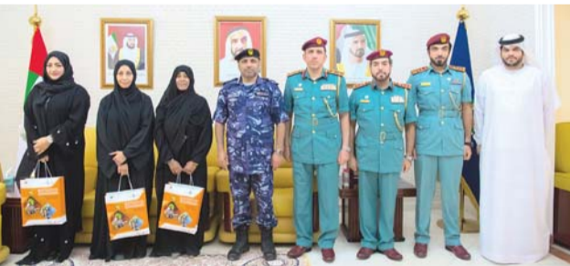
■ جاسم المرزوقي مع المكرمات بحضور عدد من المسؤولين

وأكد اللواء جاسم محمد المرزوقي قائد عام الدفاع المدني أثناء لقائه بفريق عمل القيادة العامة للدفاع المدني من ضباط وأفراد الدفاع المدني، أن القيادة العامة للدفاع المدني تخرن بنخبة متميزة من العناصر النسائية الإماراتية، وجميعهن يتمتعن بقدرات متميزة على إنجاز المهام الموكلة إليهن بكفاءة وإقتدار مع التزامهن بأعلى معايير الانضباط والسلوك الوظيفي، مؤكداً أن القيادة العامة للدفاع المدني تتجه إلى زيادة أعداد منتسباتها من العناصر النسائي لشغل عدد من الوظائف الإدارية في مختلف إداراتها العامة والإقليمية.