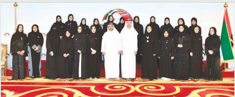
■ خلال تكريم موظفات المجلس الوطني