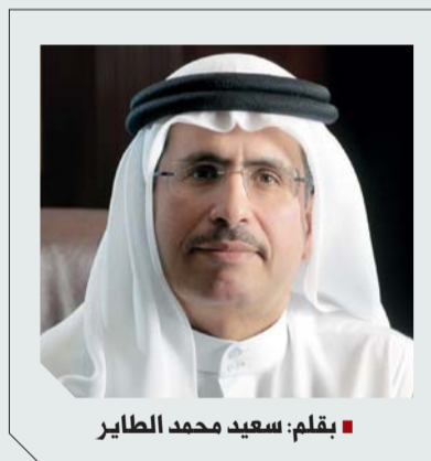
بِقلم: سعيد محمد الطائر

أكثر من رؤية المرأة الإماراتية تأخذ دورها في المجتمع وتحقق المكان اللائق بها.. يجب ألا يقف شيء في وجه مسيرة تقدمها، للنساء الحق مثل الرجال في أن يتبوأن أعلى المراكز، بما يتناسب مع قدرتهن ومؤهلاتهن.» وإذ تقدر دور المرأة كعنصر فاعل وأساسي في بناء وتطوير المجتمع وبناء الوطن، فإننا نؤكد على الدور المحوري لهيئة كهراء ومياه دبي في تمكين المرأة العاملة وتفعيل دورها وتعزيز قدراتها، لتسهم بدورها في تمكين المجتمع ككل، من خلال بيئة عمل إيجابية ومحفزة تدعم المرأة العاملة وتساعد على تحقيق التوازن بين حياتها المهنية والاجتماعية، وتمنحها الثقة الكاملة لتسخير إمكاناتها العلمية والعملية لتحقيق النجاح والتميز والمشاركة الفاعلة في جهود التنمية وبناء الوطن وإعداد أجيال المستقبل. وتعد الهيئة في مقدمة المؤسسات الحكومية السباقة في مساعي تمكين المرأة