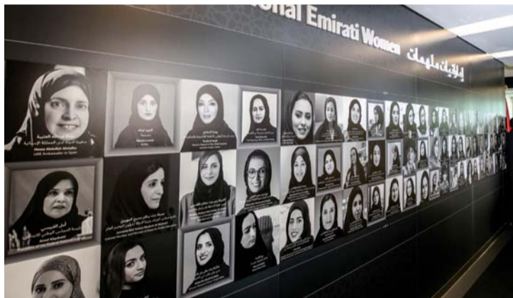
لقطة للجدارية في الهيئة الاتحادية للتأهيلية والإحصاء بدبي

إنشاء أجيال واعدة يمكنها قيادة المستقبل.. مؤكدة أن نساء دولة الإمارات سيبقن رأس المال المستقبلي الذي يمهّد الطريق لأبناء وطننا أمام آفاق الإبداع والابتكار.