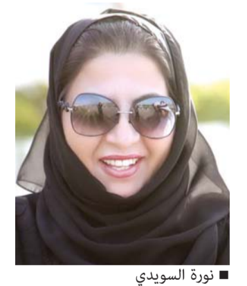
■ نورة السويدي

التمكين حتى أصبح لها دور بارز في مجتمع الإمارات والمجتمع الخليجي والعربي وعلى الساحة الدولية، حيث اقتحمت كافة المجالات وشاركت في فاصحة جزءاً لا يتجزأ من رؤية الدولة لاستشراف المستقبل. وأشارت الأمين العام للاتحاد النسائي العام، إلى أن الاحتفال بيوم المرأة الإماراتية، إنما هو تعبير حقيقي عن الحب والامتنان إلى سمو أم الإمارات التي أعطت وأجزلت العطاء فكان الحصاد رائعاً ومضيئاً.