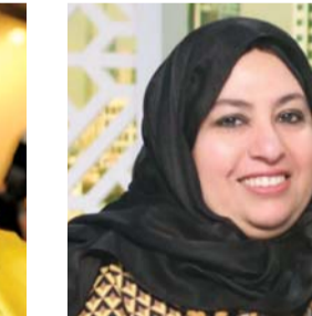
■ إقبال الطيار

في دول الخليج، الذي تزامن مع رعايتها ودعمها للمرأة الإماراتية لتصل إلى ما وصلت إليه، وما حققت من إنجازات وتقلدها لأعلى المناصب في الدولة، معربة عن الأمل أن يكمل الجيل الصاعد تلك المسيرة ناصعة اليأس ويواصل تحقيق الإنجازات، حيث إن نجاح المرأة الإماراتية هو نجاح لشقيقتها الكويتية.