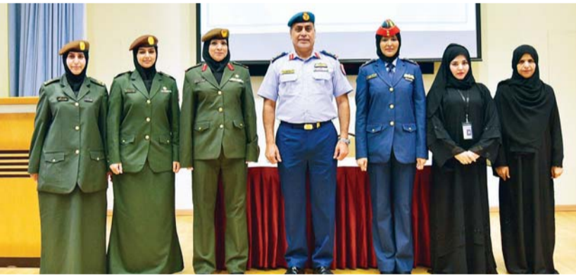
جانب من احتفال وزارة الدفاع

ومشاركة عدد من الشخصيات النسائية الإماراتية تم من خلالها إلقاء الضوء على تجاربهن المميزة في مسيرة العمل النسائي في الدولة واستعراض النجاحات التي حققتها المرأة الإماراتية في مختلف المجالات. وفي ختام الحفل تم تكريم المشاركات في الحفل وتوزيع هدايا تذكارية على منتسبات وزارة الدفاع والقوات المسلحة العسكرية والمدنيات احتفالاً بهن وامتناناً لما يبذلن من جهود في سبيل خدمة الوطن وتقديراً لمكانة المرأة الإماراتية.