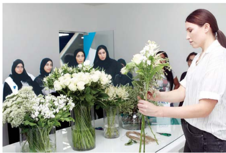
خلال ورشة تسويق الزهور