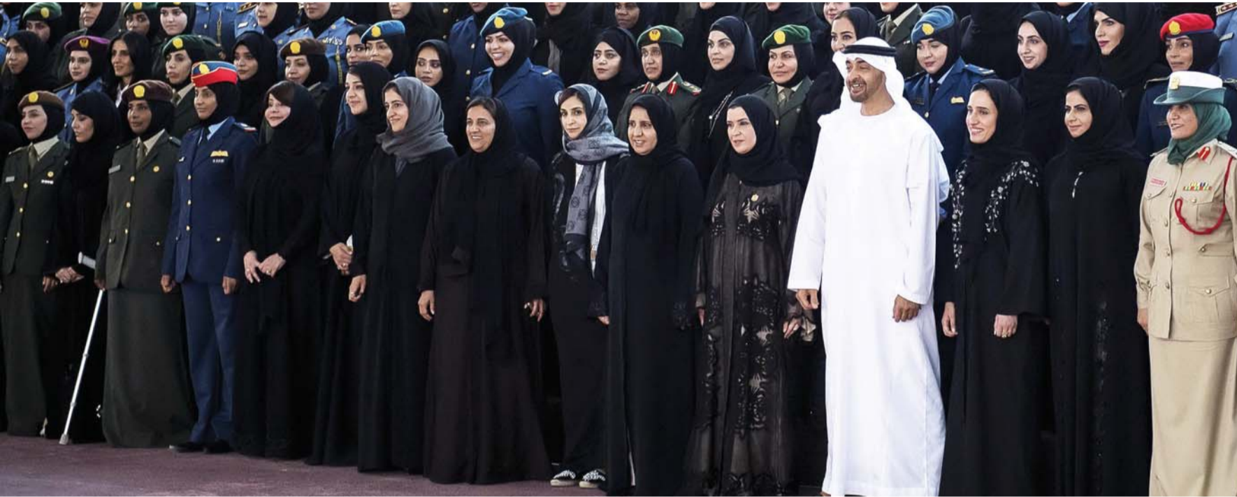
■ محمد بن زايد داعم رئيس لمسيرة المرأة في البناء والتنمية | أرشيفية

■ نستذكر قصص الوفاء والإرادة والعزيمة الصلبة لأمهات الشهداء الملهمات أيقونات العطاء