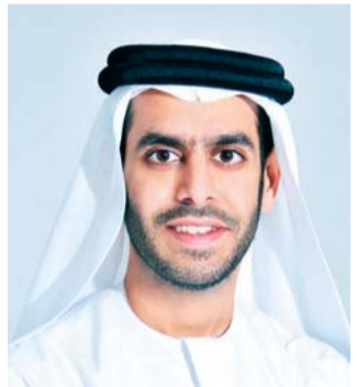
■ مروان السركال

الشارقة، وقرينته، سمو الشيخة جواهر بنت محمد القاسمي، رئيسة المجلس الأعلى لشؤون الأسرة، التي تعتبر المرأة معادلاً جوهرياً لنهوض أي أمة وبناء أي حضارة».