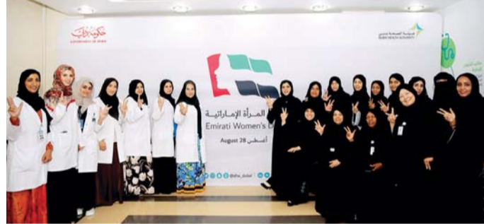
■ موظفات صحة دبي عقب الاحتفال بيوم المرأة الإماراتية

المميزة وتمكينها وفتح المجال أمامها لتولي المناصب الرفيعة والمسؤوليات القيادية والإشرافية والتنفيذية.