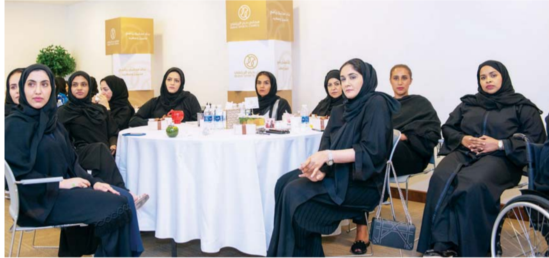
■ المرأة الإماراتية ونجاحات متميزة | البيان