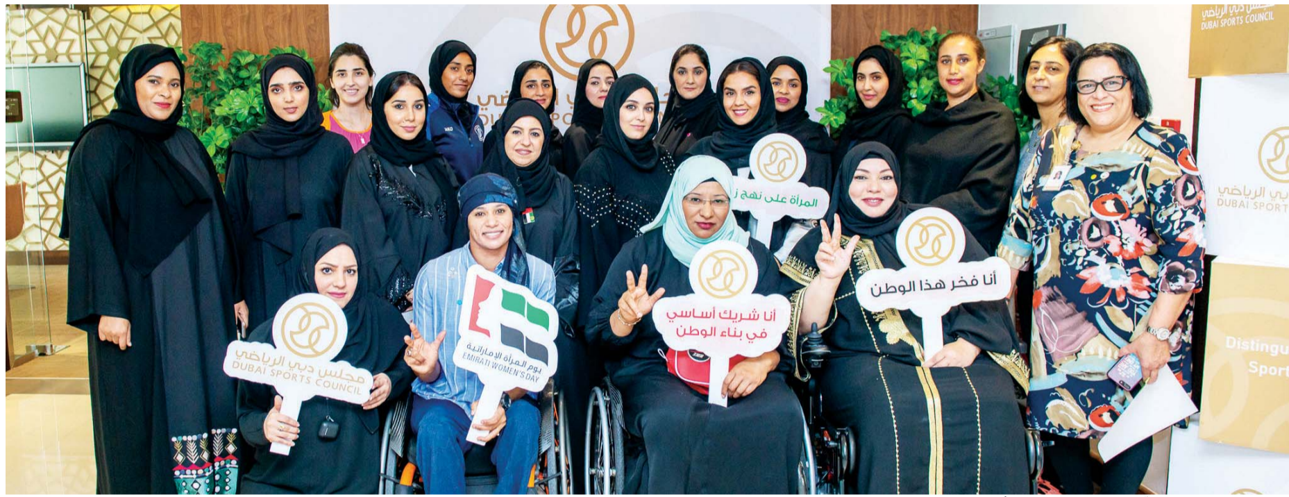
■ دبي - البيان

احتفل مجلس دبي الرياضي بيوم المرأة الإماراتية من خلال تنظيم عدد من الفعاليات الخاصة بالمناسبة، كما تم تزويد مقر المجلس بكلمات المغفور له بإذن الله الشيخ زايد بن سلطان آل نهيان، طيب الله ثراه، وصاحب السمو الشيخ خليفة بن زايد آل نهيان رئيس الدولة، حفظه الله، وصاحب السمو الشيخ محمد بن راشد آل مكتوم نائب رئيس الدولة رئيس مجلس الوزراء حاكم دبي، رعاه الله، وصاحب السمو الشيخ محمد بن زايد آل نهيان ولي عهد أبوظبي، نائب القائد الأعلى للقوات المسلحة وسمو الشيخ حمدان بن محمد بن راشد آل مكتوم ولي عهد دبي رئيس مجلس دبي الرياضي، وسمو الشيخة فاطمة بنت مبارك «أم الإمارات»، وسمو الشيخة هند بنت مكتوم بن جمعة آل مكتوم حرم صاحب السمو الشيخ محمد بن راشد آل مكتوم، وسمو الشيخة بنت محمد بن راشد آل مكتوم، التي عبرت جميعها عن مكانة المرأة في دولة الإمارات العربية المتحدة وحرص القيادة الرشيدة على دعمها وتمكينها في جميع مجالات الحياة.