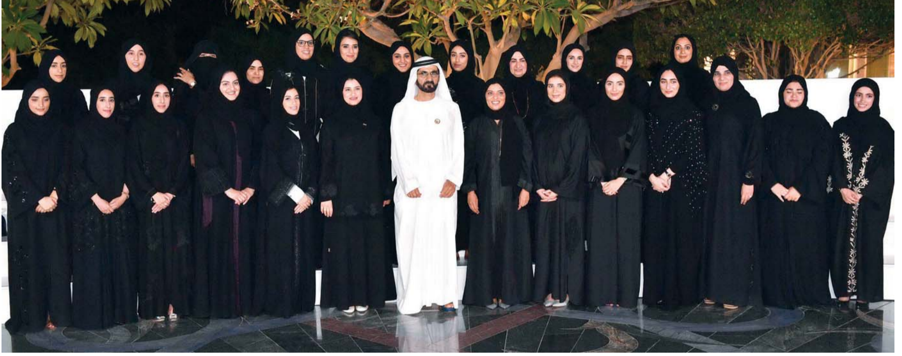
محمد بن راشد حريص على تمكين المرأة الإماراتية في جميع المجالات | أرشيفية

هنأ صاحب السمو الشيخ محمد بن راشد آل مكتوم، نائب رئيس الدولة رئيس مجلس الوزراء حاكم دبي، رعاه الله، وصاحب السمو الشيخ محمد بن زايد آل نهيان، ولي عهد أبوظبي نائب القائد الأعلى للقوات المسلحة، المرأة الإماراتية بمناسبة يوم المرأة الإماراتية، وخص سموهما بالتهنئة أمهات وزوجات وبنات الشهداء. ووجه سموهما الشكر لسمو الشيخة فاطمة بنت مبارك رئيسة الاتحاد النسائي العام رئيسة المجلس الأعلى للأمومة والطفولة الرئيسة الأعلى لمؤسسة التنمية الأسرية على دعمها وتمكينها وتشجيعها للمرأة الإماراتية في جميع أدوارها. وقال سموهما إن المرأة في الإمارات أخت وشريكة وعضيدة في مسيرة التنمية، كما أنها تخطت مرحلة المساهمة في التنمية والتطوير إلى صانعة للإنجازات التي ترتقي بمكانة الوطن. وقال صاحب السمو الشيخ محمد بن راشد آل مكتوم في تغريدات عبر «تويتر»: «في يوم المرأة الإماراتية.. نحتفل ونحتفي بالمرأة أختاً وشريكة وعضيدة في مسيرة التنمية.. أخص بالتهنئة أمهات الشهداء.. وزوجات الشهداء.. وبنات الشهداء.. وأتوجه