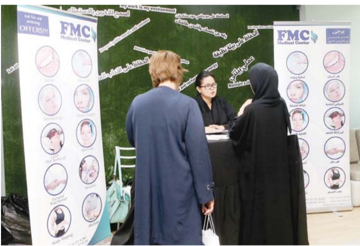
العيدة التجميلية تقدم خدماتها للموظفات