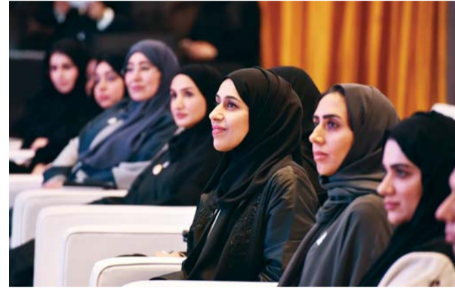
حصّة بوحيمد خلال الفعالية

نظمت وزارة تنمية المجتمع حفلاً بمناسبة يوم المرأة الإماراتية، بحضور معالي حصة بنت عيسى بوحميد، وزيرة تنمية المجتمع، وموظفات الوزارة وعدد من سيدات المجتمع ونساء رائدات في العمل الإنساني، خاصة في مجال دعم أصحاب الهمم، وتخلل الحفل فقرات ومبادرات وفعاليات مبتكرة تعبر عن مكانة المرأة الإماراتية منذ بزوغ فجر الاتحاد وحتى يومنا هذا.