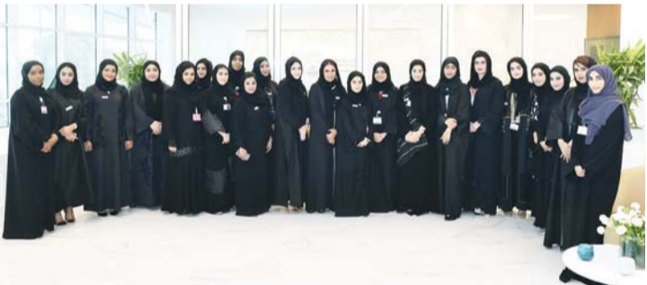
■ جانب من المشاركات في احتفال هيئة الطرق

على المستوى المحلي والإقليمي والدولي، حيث أصبحت شريكاً رئيسياً في التنمية الحضارية للدولة.