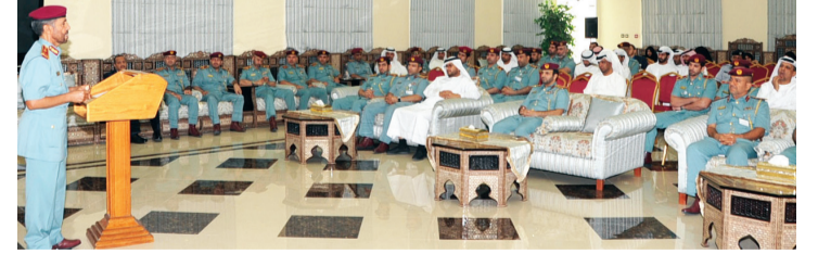
الخبيلي متحدثاً في الحفل