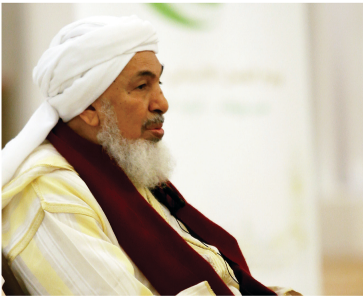
عبدالله بن بية

واستعرض مثلاً عن أعمال المغفور له الشيخ زايد الإنسانية، وهي مساعدته لبطل الملاكمة محمد علي كلاي ليؤسس مؤسسته الإنسانية التي امتد عطاها للمسلمين وغير المسلمين، فكانت مثلاً رائعاً للدعوة ضد الإسلاموفوبيا، وهو ما ليس بعيداً عن منهج الشيخ زايد، منهج الإنسان الذي يستنبط في حقيقته منهجاً