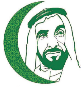
يوم العمل الإنساني الإماراتي حب ووفاء .. لتزايد العطاء .. 19 رمضان

الخريجين والذين هم على مقاعد الدراسة الجامعية وزملائهم في المراحل الدراسية الثانوية لإمدادهم بالخبرات والتغذية الراجعة عما يحتاجون إلى معرفته من معلومات تفيدهم في مسيرتهم التعليمية.