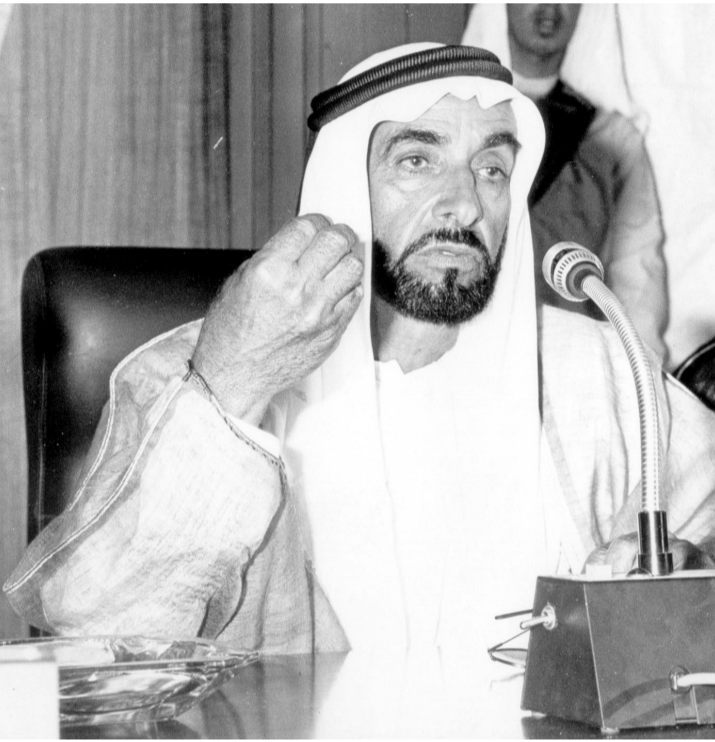
المغفور له الشيخ زايد يطالب أعضاء «الوطني» بالمصارحة في قضايا الوطن

الأساسية في عملية البناء وفي بناء مستقبل مشرق وواهر من خلال تحقيق آمال شعب الإمارات نحو بناء مجتمع الكرامة والرفاهية.