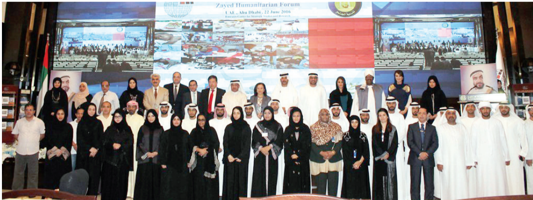
صورة جماعية للمشاركين في الملتقى

وعقدت الدورة تحت شعار «ولاء ووفاء وعطاء» إحياء لذكرى المؤسس والإنسان والقائد المغفور له الشيخ زايد بن سلطان آل نهيان، طيب الله ثراه، وذلك بمبادرة من «زايد العطاء» ومركز الإمارات للدراسات والبحوث الاستراتيجية» وبالشراكة مع كل من «مركز الإمارات للتطوع» و«الجمعية العربية للمسؤولية الاجتماعية» و«المؤسسة العربية للعمل الإنساني»، وبحضور ممثلين عن عدد من المؤسسات الحكومية والخاصة المعنية بمجال العمل الإنساني والاجتماعي محلياً وعالمياً وذلك في قاعة الشيخ زايد للدراسات والبحوث الاستراتيجية في مركز الإمارات بن سلطان آل نهيان بمقر مركز الإمارات للدورات والبحوث الاستراتيجية في إطار احتفالات الدولة بيوم زايد للعمل الإنساني الذي يصادف يوم التاسع عشر من شهر رمضان إحياء لذكرى الشيخ زايد بن سلطان آل نهيان والتذكير بأعماله الخيرة والإنسانية والافتداء به وتسلط الضوء على هذه القيم الجميلة ونشر الوعي بأهمية أعمال البر والخير وتقديم العون والمساعدة للأخريين والمحتاجين. ورفع المشاركون في ملتقى زايد الإنساني في بيانهم الختامي برفقة شكر وتقدير