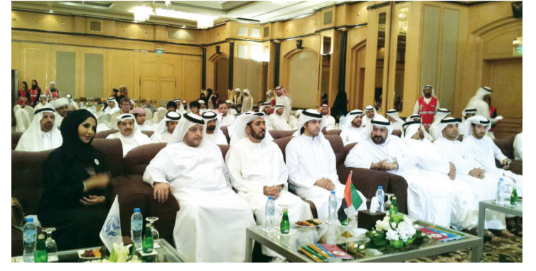
سعيد بن طحون وأعضاء جمعية حقوق الإنسان خلال الأمسية

جاء ذلك، خلال حضوره ورعايته فعاليات الأمسية الرمضانية التي نظمتها جمعية الإمارات لحقوق الإنسان بحضور الشيخ محمد بن خليفة بن شخبوط آل نهيان، والشيخ سالم بن محمد بن ركاض العامري، وسلطان صالح الباكري، مستشار