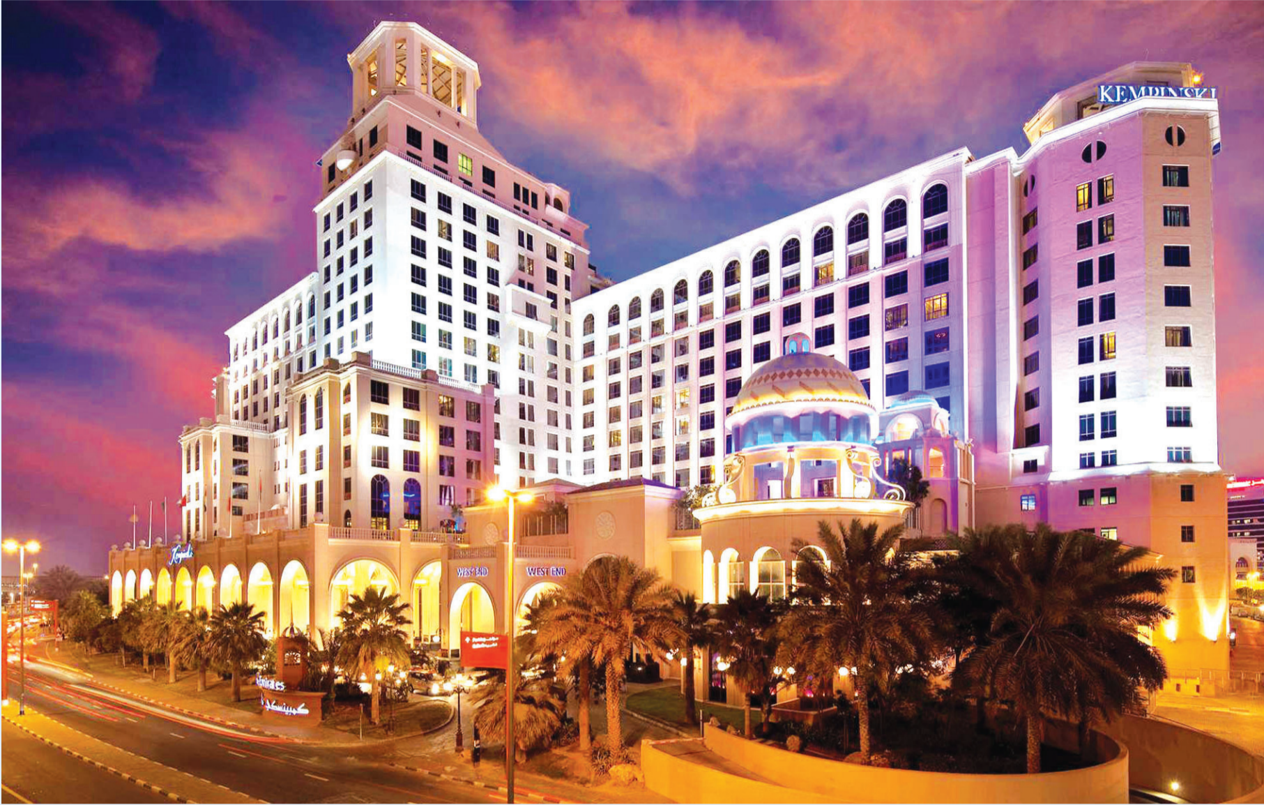
العائلات تعزز نسب الإشغال الفندقي في دبي | البيان

السياحة المحلية والخليجية تتجاوز 60٪ من إشغالات الغرف