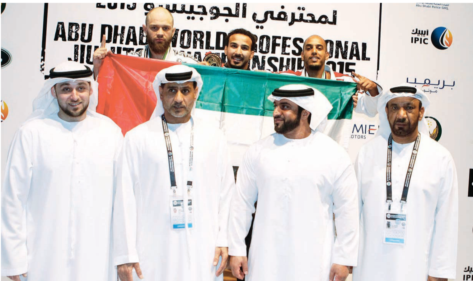
عبدالله بن محمد يتوج الفائزين بحضور الهاشمي والظاهري والقيبيبي