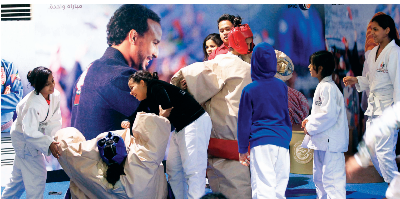
لحظات من المرح والسعادة مع مجسمات المصارعين المحترفين