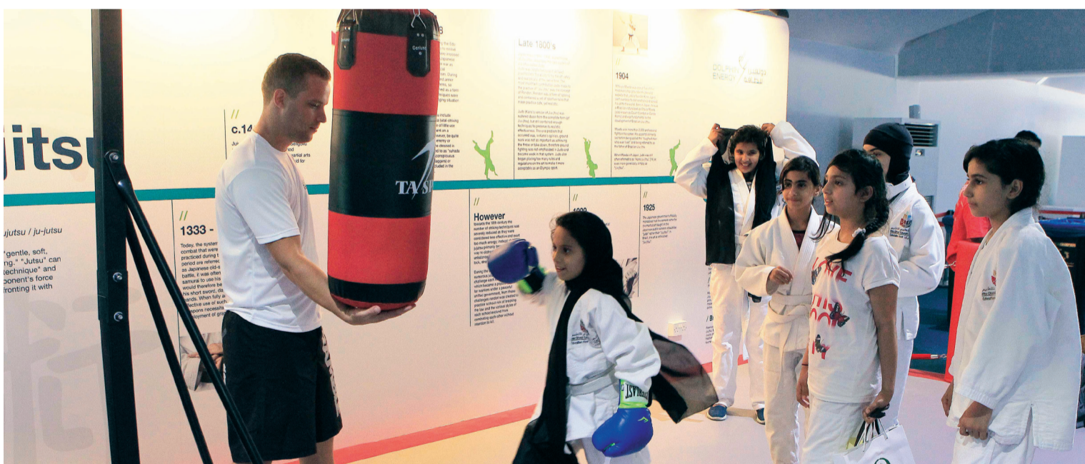
تستعد تحت أنظار المدرب لتوجيه ضربتها إلى جهاز تدريب الملاكمة

لقطة فنية رائعة في إحدى مباريات البطولة أمس. تتم عن لياقة بدنية مرتفعة وتكتيك فني متميز من نخبة نجوم الجوجيتسو البيان