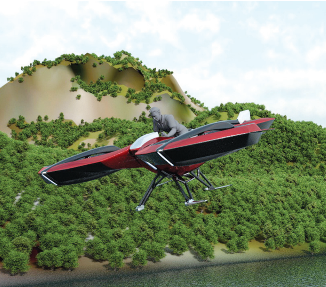
الطائرة الآلية المسيرة بطيار جاهزة للعرض في دبي