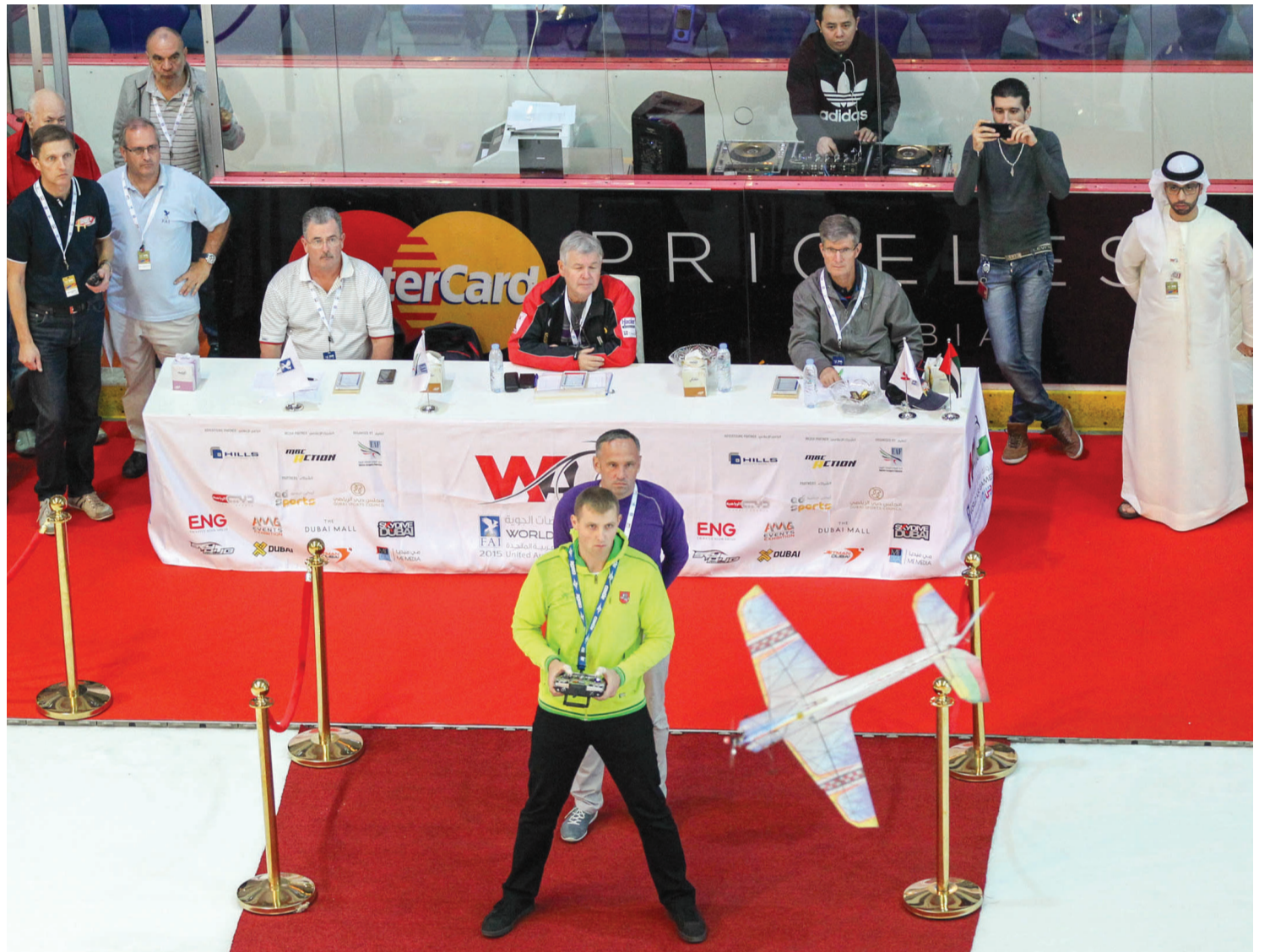
المتصدر الليتيواني فرض نفسه على الحدث