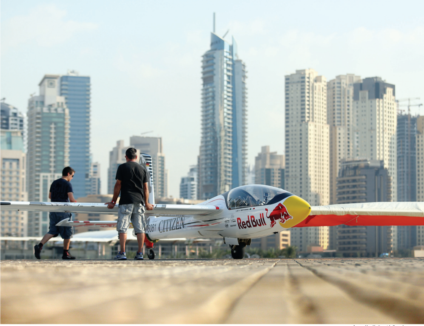
دبي جاهزة لاستقبال الحدث