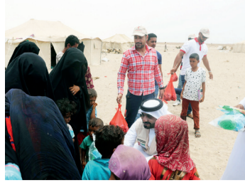
«وصية زايد» تتواصل في عدن وحضرموت