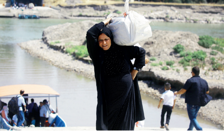
السياسة القطرية فاقتمحة السوريين في الوقوع بين فكّي الإرهاب والنظام

العسكري والمسار السياسي لهذه الثورات في اتساق واحد، وذلك بالتنسيق مع القوى الداعمة للحركات الإرهابية، حيث قادت تركيا على مستوى الإقليم محاولة تصدّر الإخوان المشهد السياسي، بالتوازي مع الأدوار التي لعبها المال القطري إلى جانب الأيديولوجيا الإسلامية لحزب العدالة والتنمية، ما مهد لأدوار تدميرية قلبت مسار الحراك المدني في سوريا، وتم الالتفاف على جميع المكونات المدنية، ليقصّر الدعم على جماعة الإخوان، بما نجح في تحييد القوى المدنية الديمقراطية.