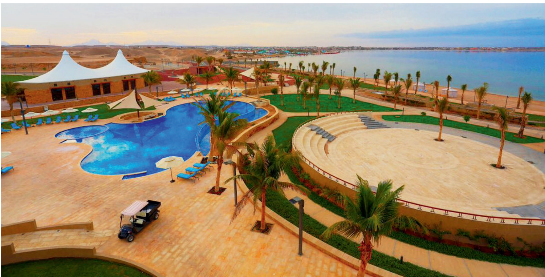
فنادق الدوحة تغرق في الخسائر.. والإيرادات لا تغطي النفقات