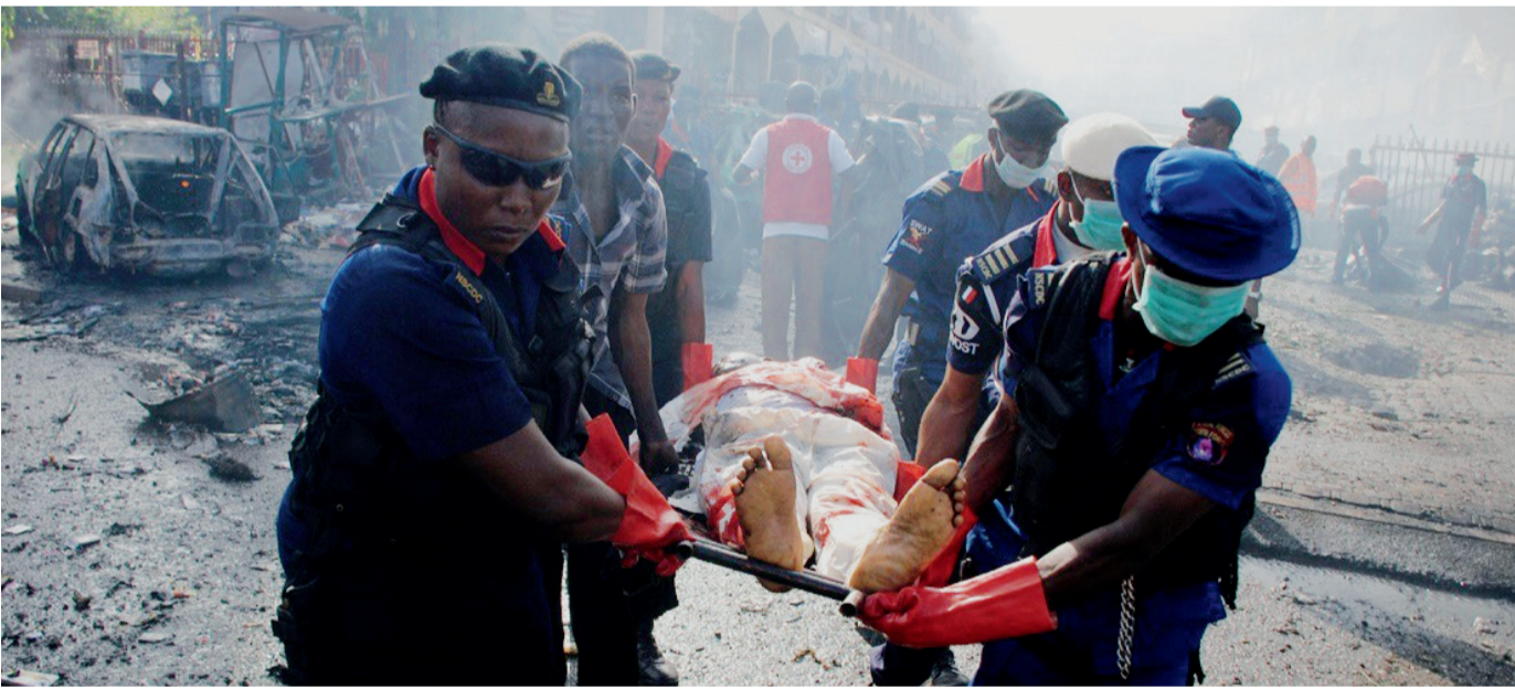
آلاف الضحايا في غرب أفريقيا نتيجة النشاط الإرهابي | أرشيفية