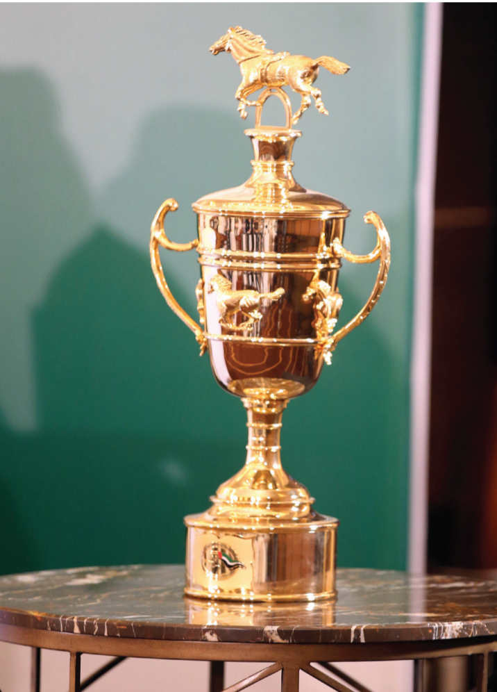
كأس رئيس الدولة

70 صحافياً من جميع الصحف العالمية، سيتابعون سباق كأس رئيس الدولة للقدرة اليوم وسباق كأس سموه للخيول العربية لمسافة 2200 متر غداً، ومن المؤكد أن هؤلاء الصحافيين سينقلون لبلادهم انطباعاتهم عن روعة الإمارات وقوة سباقاتها، واختتمت تصريحاتها متمنية التوفيق للجميع من مشاركين في السباق وكذلك لضيوف الحدث.