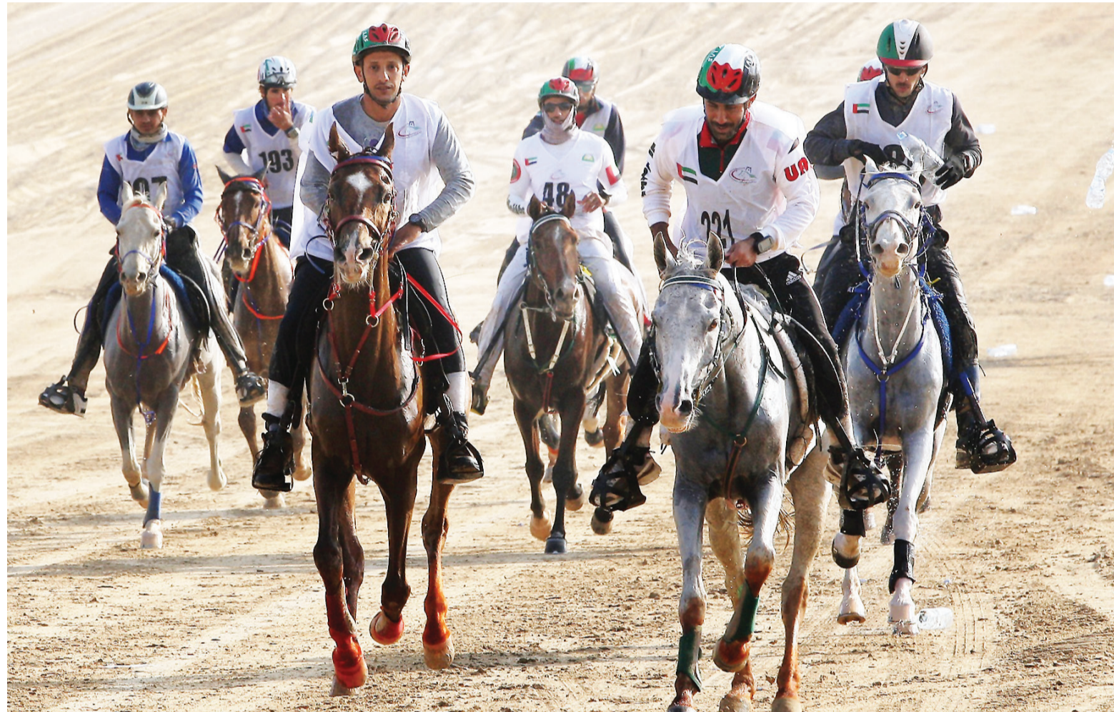
الحدث يستقطب أبرز الفرسان والفارسات | البيان

من خلال حرص المشاركة فيه من أفضل الفرسان على المستوى العالمي. وأكدت أن هذا السباق غال على قلوب الجميع وهو سباق مهم وداعم لمهرجان سمو الشيخ منصور بن زايد آل نهيان، موضحة أن وجود أعضاء الجمعية العمومية للاتحاد الدولي لأكاديميات سباقات الخيل «أفهر» سيتابعون السباق، كما أشارت إلى وجود أكثر من