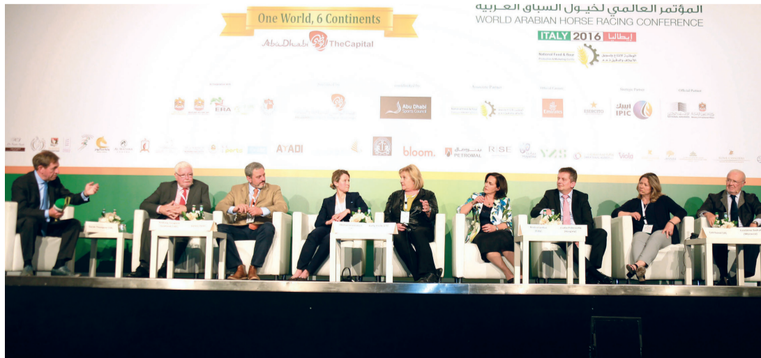
الجلسة الأولى للمؤتمر العالمي