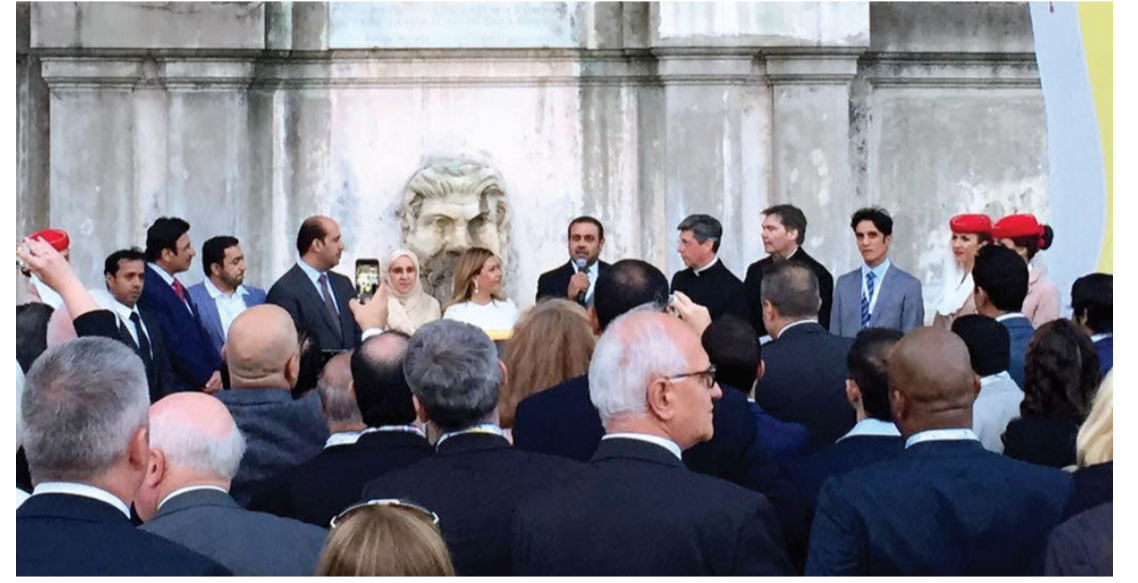
عبد الله الرئيس خلال حديثه أمام قبة الفايكان بحضور ضيوف المهرجان

منحني إياه صاحب سمو الشيخ خليفة بن زايد آل نهيان رئيس الدولة، حفظه الله، من منطلق الرؤية الحكيمة للسياسة والتوجهات السديدة للقيادة الرشيدة التي تتمتع بأفق واسع في عالم متغير ومتنوع يفرض علينا التسامح كعامل أساسي ونقطة التقاء بين الشعوب والحكومات التي تعمل معاً من أجل تحقيق السلام والرفاهية لشعوبها.