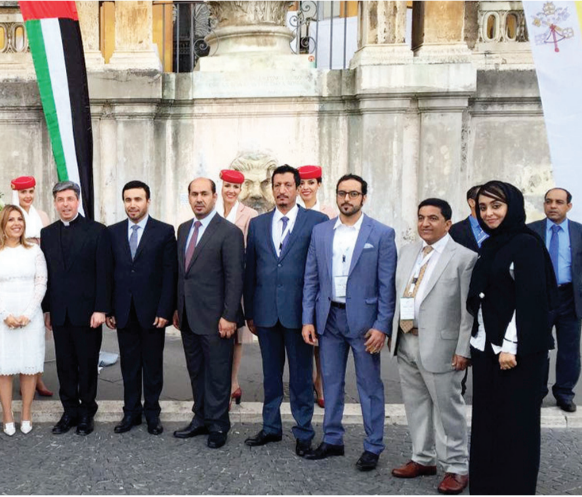
كبار الضيوف يتوسطون علمي الإمارات والفايتكان في منصة الاحتفال