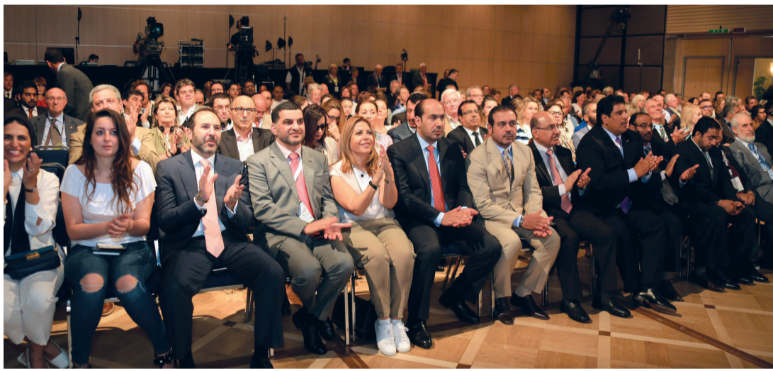
حضور كبير في الجلسة الأولى للمؤتمر

ومن هنا أنقل التحية لقيادة الباشا فرانسيس وإلى حكومته القديرة لما يقدمه من تعاون ومساعدة لكافة أنحاء العالم للتمكن من إيجاد الحلول لكثير