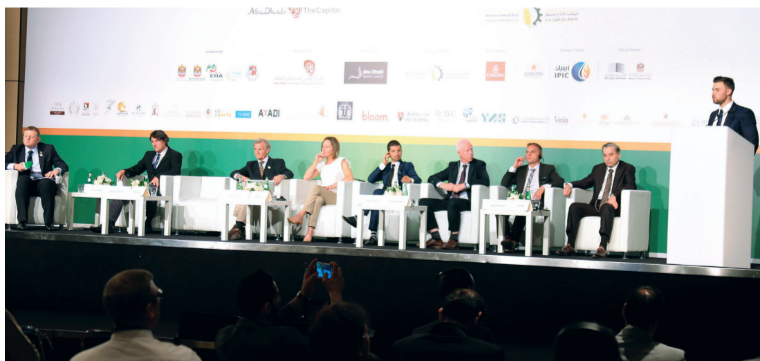
جانب من الجلسة الثالثة للمؤتمر العالمي

ويجري هذا البحث العلمي المتميز بين جامعة ليفربول جون موريس وبين مهرجان سمو الشيخ منصور بن زايد آل نهيان العالمي للخيول العربية الأصيلة، بشأن عمل دراسة وتجربة وتحسين الطريقة التي يحافظ بها الفرسان على أوزانهم بقيادة الدكتور جورج ويلسون وفريق عمله.