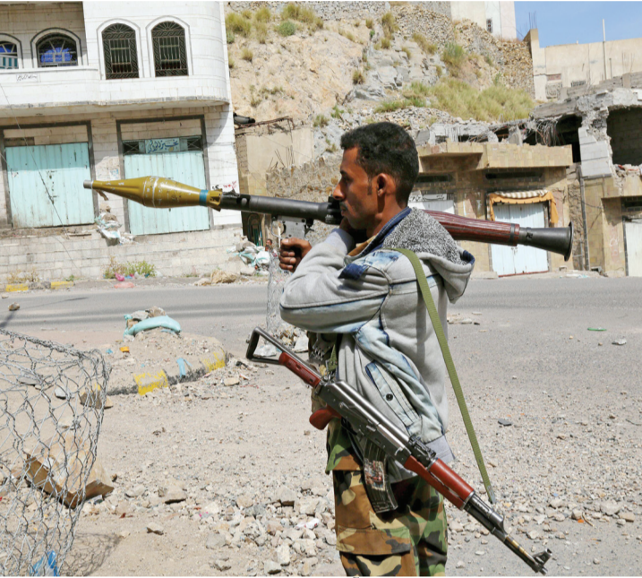
مقاتل من المقاومة الشعبية يحمل آر بي جي في تعز