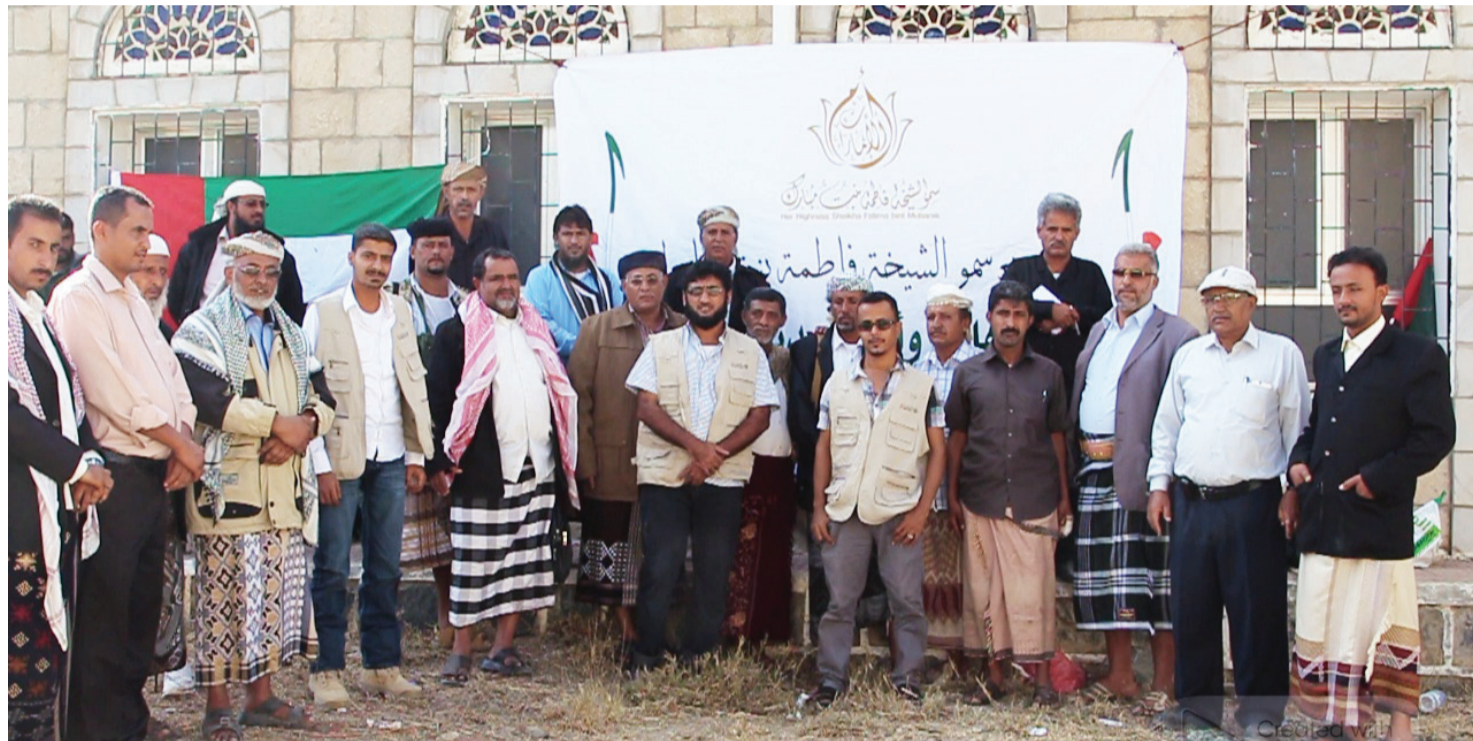
■ خلال تدشين مشروع السدود في اليمن | البيان

لتيسير حياة سكان القرى والمناطق النائية التي تواجه الكثير من التحديات وفي مقدمتها مياه الشرب. يذكر أن مبادرة سمو الشيخة فاطمة بنت مبارك في اليمن تضمنت توفير الدعم اللازم لـ (15) مشروعاً في عدن والمحافظات المجاورة في عدد من المحاور المهمة، كالصحة والتعليم وتعزيز قدرات المرأة اليمنية وتأهيل المعاقين وتحسين خدمات المياه والكهرباء وبرامج الإيواء ودعم استقرار الأسر والبدو الرحل خاصة في المناطق الساحلية.