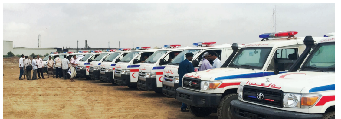
■ سيارات الإسعاف بعد وصولها إلى عدن

للقطاع الصحي في عدن، وأضاف إنه أنعش القطاع الصحي من خلال دعمه المتواصل.