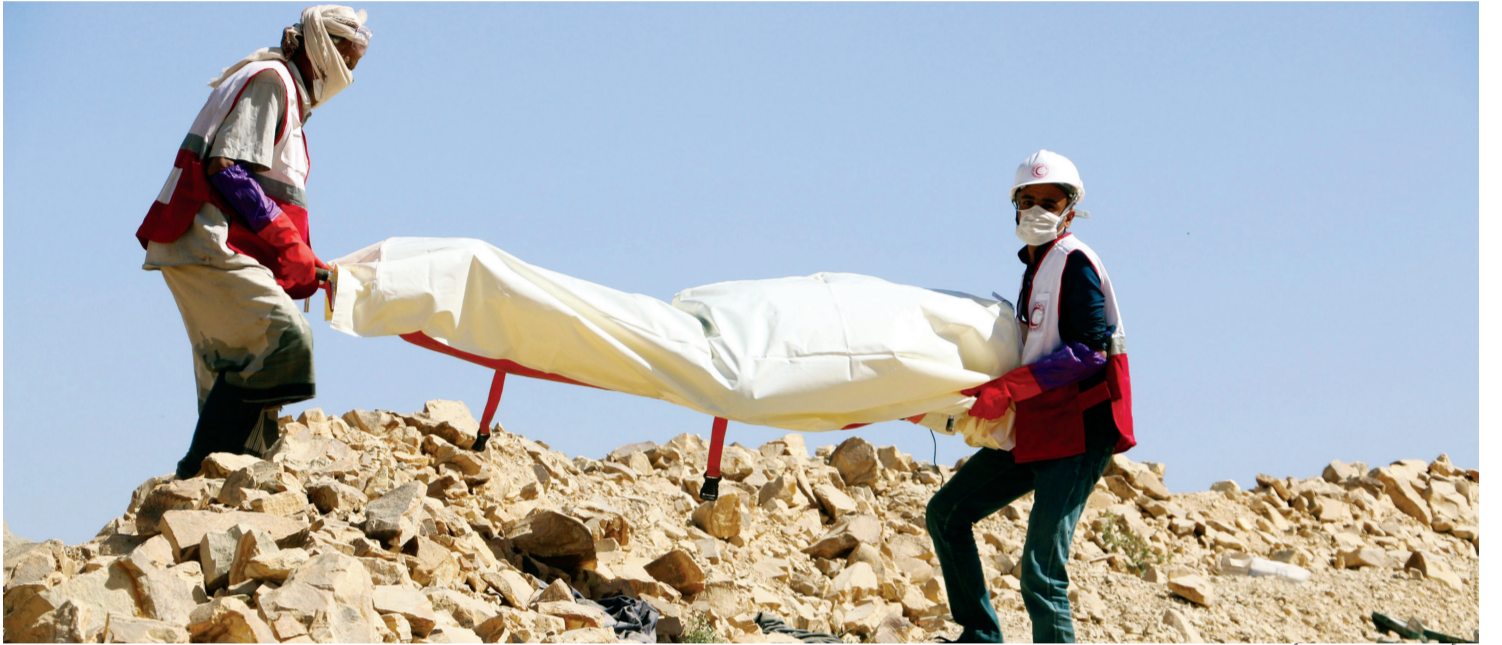
أعضاء من الهلال الأحمر اليمني ينقلون جثة حوثي قتل في اشتباكات بصنعاء