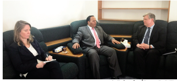
■ اللقاء اليمني الأميركي | البيان

سلام دائم في اليمن. من جهته أكد القائم بأعمال السفير الأميركي دعم حكومة بلاده لجهود السلطة الشرعية في تحقيق السلام، وتطبيق قرار مجلس الأمن الدولي 2216، وحرصها على أمن وسلامة ووحدة اليمن. حضر اللقاء نائب مدير الشؤون السياسية والاقتصادية في السفارة كارن إل برونسن. الرياض - سيانت