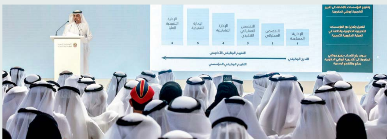
■ خلال إطلاق مشروع أكاديمية أبو ظبي الحكومية

ومن الجدير بالذكر أنه سيتم إطلاق برامج الأكاديمية في النصف الثاني من عام 2018 بالشراكة مع المؤسسات التعليمية في الإمارة والقطاع الخاص. وستقوم أكاديمية أبو ظبي الحكومية بمنح الفرص التدريبية لكافة الموظفين في كافة الجهات والمجالات، ما سيجعلها المحرك التطويري على مستوى الإمارة لرفع كفاءة الموظفين واحتضان الكفاءات المبدعة والقيادية.