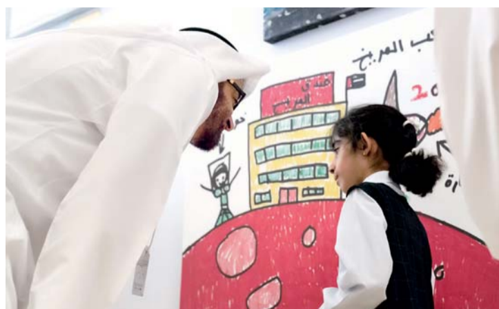
سموه خلال الفعاليات