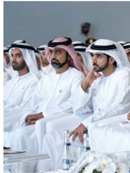
محمد بن سعود

عقدت الاجتماعات السنوية لحكومة دولة الإمارات برئاسة صاحب السمو الشيخ محمد بن راشد آل مكتوم نائب رئيس الدولة رئيس مجلس الوزراء حاكم دبي، رعاه الله، وصاحب السمو الشيخ محمد بن زايد آل نهيان ولي عهد أبوظبي نائب القائد الأعلى للقوات المسلحة، بحضور سمو أولياء العهود ورؤساء المجالس التنفيذية والوزراء ورؤساء الدوائر وأكثر من 450 شخصية من وكلاء الوزارات والأمناء العاميين ومديري العموم والوكلاء المساعدين والمديرين التنفيذيين والقيادات الحكومية الاتحادية والمحلية، واستعرضت جهود تحقيق الإنجازات المرورية لرؤية الإمارات 2021، وسبل تحقيق محاور «مئوية الإمارات 2071».