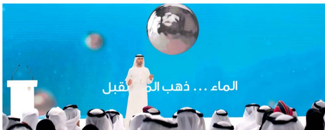
■ سهيل المزروعى يكشف عن استراتيجية الأمن المائي

وتعالج الاستراتيجية على المدى الطويل تحديات الأمن المائي المستقبلية من منظور وطني، وتغطي سلسلة إمدادات المياه بأكملها، في ضوء تحديات المياه في دولة الإمارات التي تشمل محدودية موارد المياه الطبيعية العذبة، واستنزاف المياه الجوفية وارتفاع الطلب على المياه وارتفاع معدلات استهلاك الفرد للمياه وارتفاع الفاقد من المياه في النظام المائي.