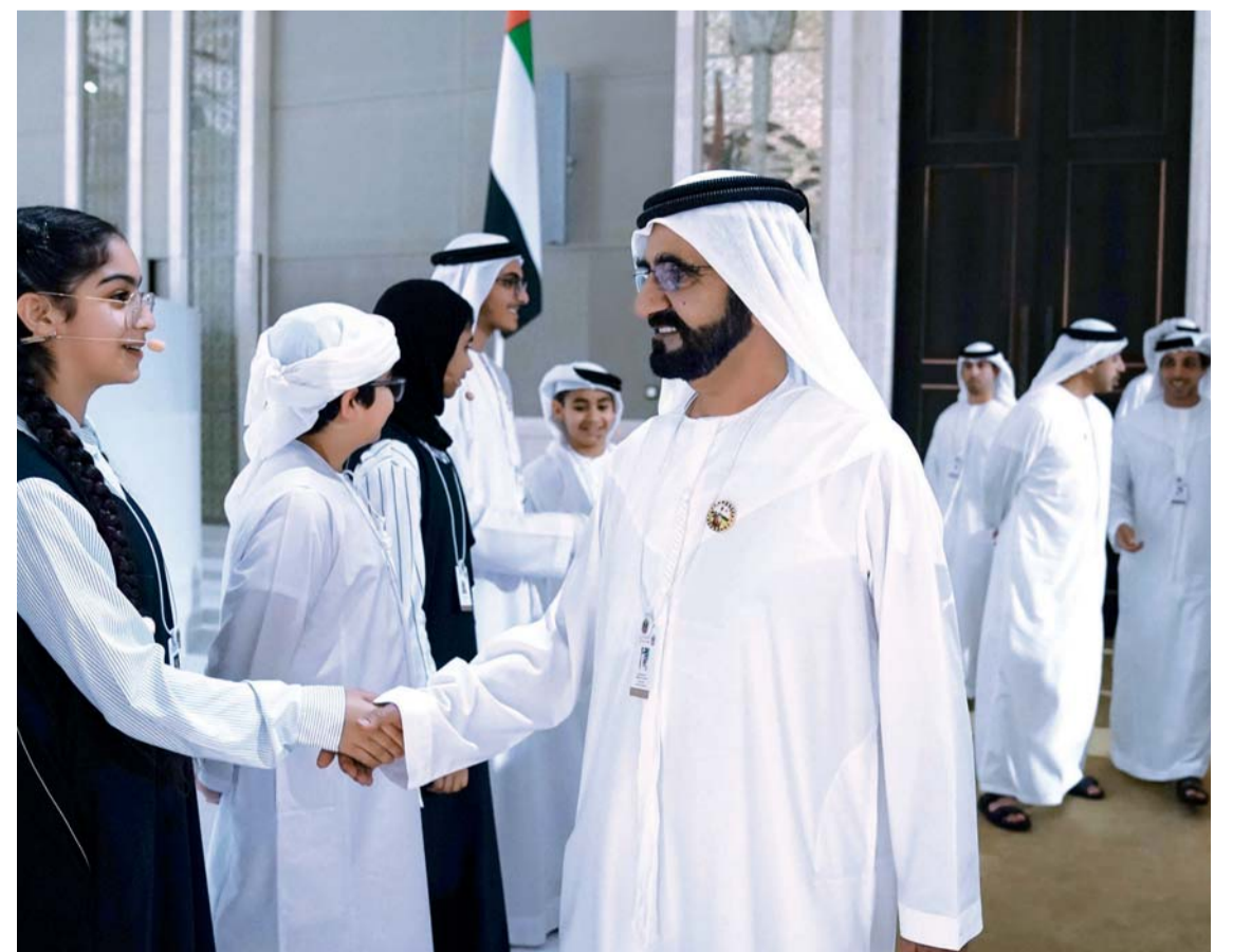
محمد بن راشد مصافحاً إحدى طالبات الوطن بحضور منصور وعبدالله بن زايد