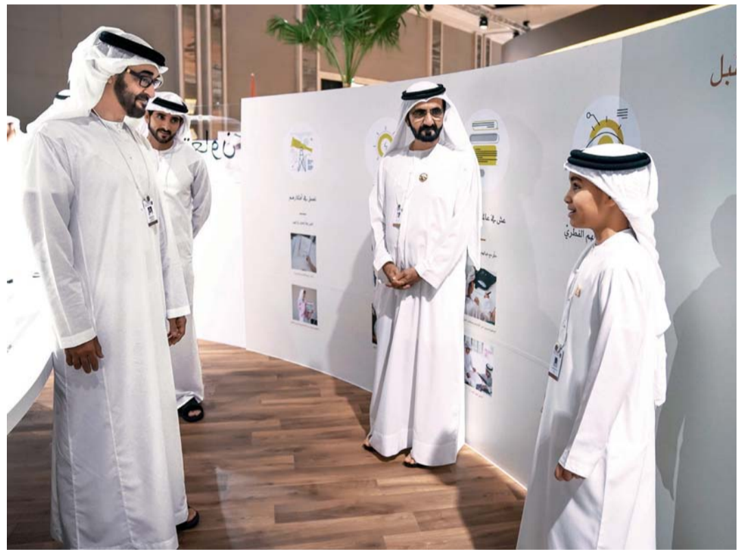
محمد بن راشد ومحمد بن زايد وحمدان بن محمد خلال الفعاليات

وفي إطار رؤية القيادة الرشيدة بالاستماع إلى أفكار الأجيال الناشئة والأخذ بطروحاتهم ووجهات نظرهم ناقش الأطفال خلال الجلسات وورش العمل التي تمت على مدى شهرين، عدداً كبيراً