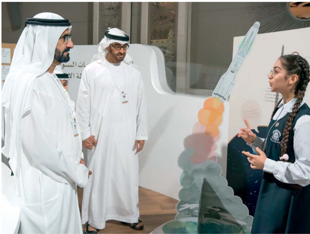
■ نائب رئيس الدولة وولي عهد أبوظبي يحفزان تطلعات أطفال المستقبل

في مختلف شرائح المجتمع، وتعمل على إعداد أجيال المستقبل لمواكبة هذه التوجهات من خلال تشجيعهم على التخيل والإبداع، وغرس مفاهيم المستقبل في نفوسهم، ليسهموا في ابتكار حلول لتحديات العالم الحقيقي، وهذه المبادرة عبارة عن تطبيق عملي لاختبار مخيلة الأطفال والتعرف إلى رؤيتهم للمستقبل والاستفادة من هذه التصورات في تشكيل معالم الكثير من القطاعات فيه، وقد تم اختيار أبرز الرسوم وجمعها في كتاب يتناول ملخصاً تحليلياً للأفكار الواردة فيها.