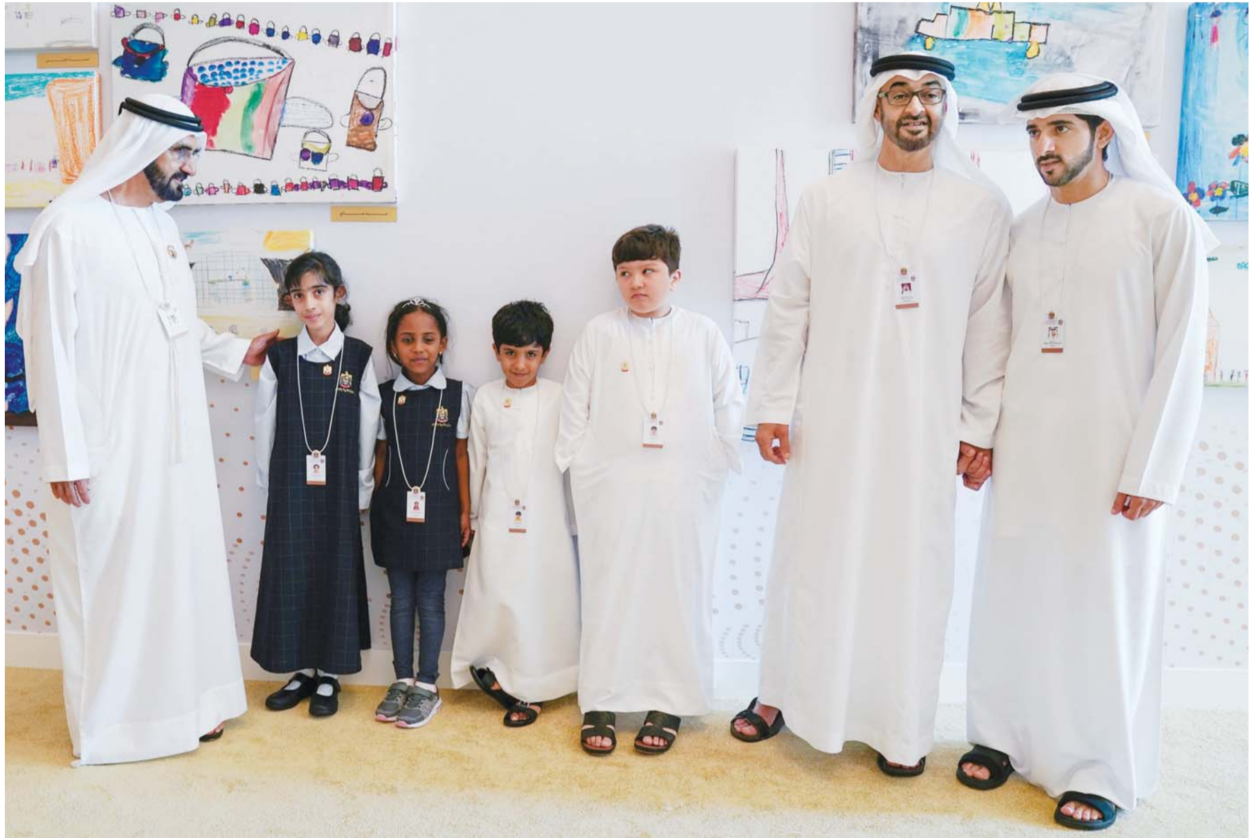
محمد بن راشد ومحمد بن زايد وحمدان بن محمد وعدد من الأطفال خلال الفعاليات المصاحبة للاجتماعات السنوية

مناقشة 4 مواضيع رئيسية تناولت الحفاظ على البيئة وتنظيم رحلات علمية إلى الفضاء والتقدم التكنولوجي والثورة الصناعية الرابعة وغيرها من الموضوعات