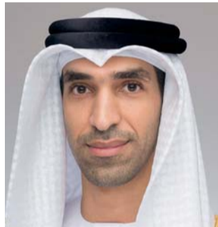
■ ثاني الزيودي

وازداد الظواهر الجوية العنيفة، التي تظهر تبعاتها على معظم القطاعات الاقتصادية والاجتماعية تدريجياً على المدى المتوسط والبعيد.