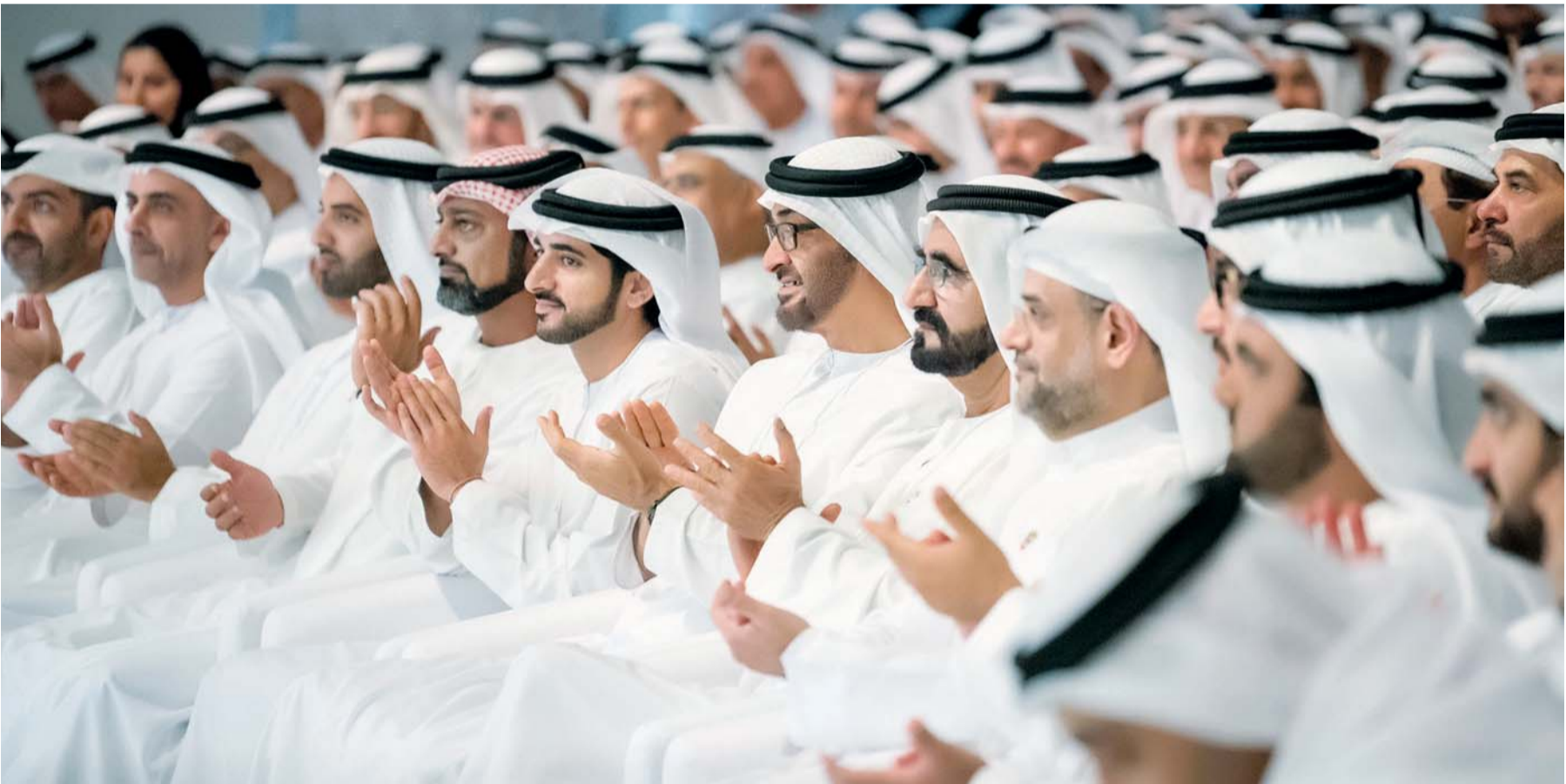
محمد بن راشد ومحمد بن زايد وحمدان بن محمد وسلطان بن محمد بن سلطان وعمار النعيمي ومحمد الشرقي وراشد الملا ومحمد بن سعود ومكتوم بن محمد وسيف وحامد بن زايد