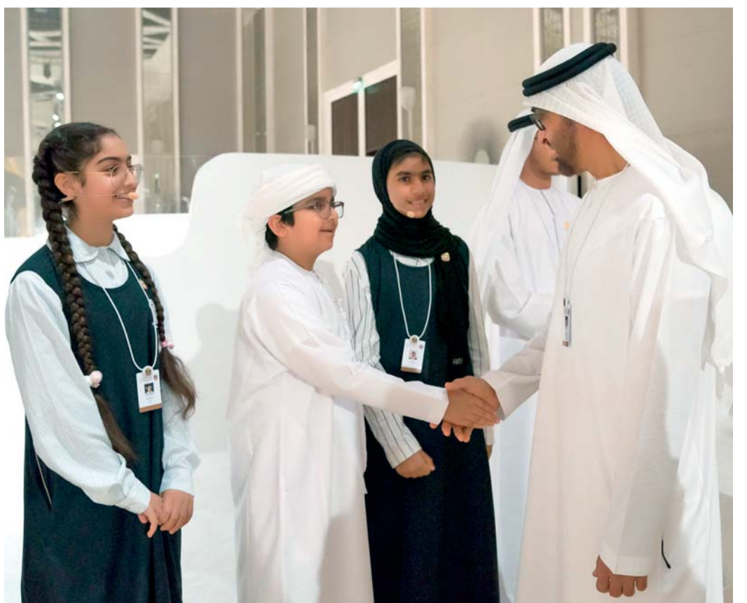
■ محمد بن زايد مصافحاً أحد الأطفال

للاتاقة التقليدية، وستستخدم الروبوتات في تنظيف البيئة وسيكون العالم مكاناً أكثر نظافة وجمالاً. محطات وفي مجال الصحة، رسم الأطفال محطات