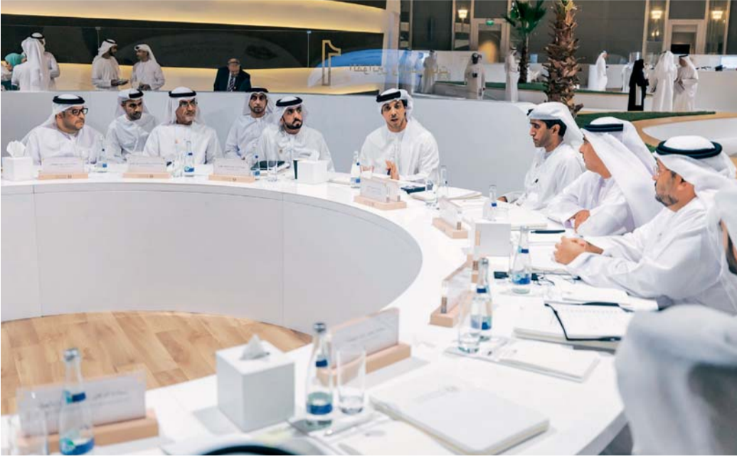
■ منصور بن زايد مترئساً اجتماع أمناء المجالس التنفيذية