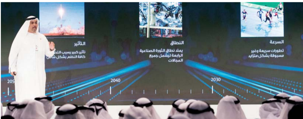
■ خلال الإعلان عن إطلاق الاستراتيجية

وتشمل الاستراتيجية محور أمن المستقبل من خلال تحقيق الأمن المائي والغذائي عبر تطوير منظومة متكاملة ومستدامة للأمن المائي والغذائي تقوم على توظيف علوم الهندسة الحيوية والتكنولوجيا المتقدمة للطاقة المتجددة، وتعزيز الأمن الاقتصادي عبر تبني الاقتصاد الرقمي وتكنولوجيا التعاملات الرقمية «بلوك تشين» لتعزيز اقتصاد الدولة في التمويل والخدمات.