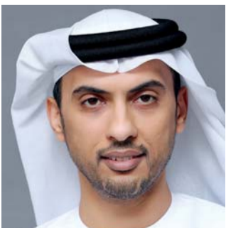
■ وسام لوتاه