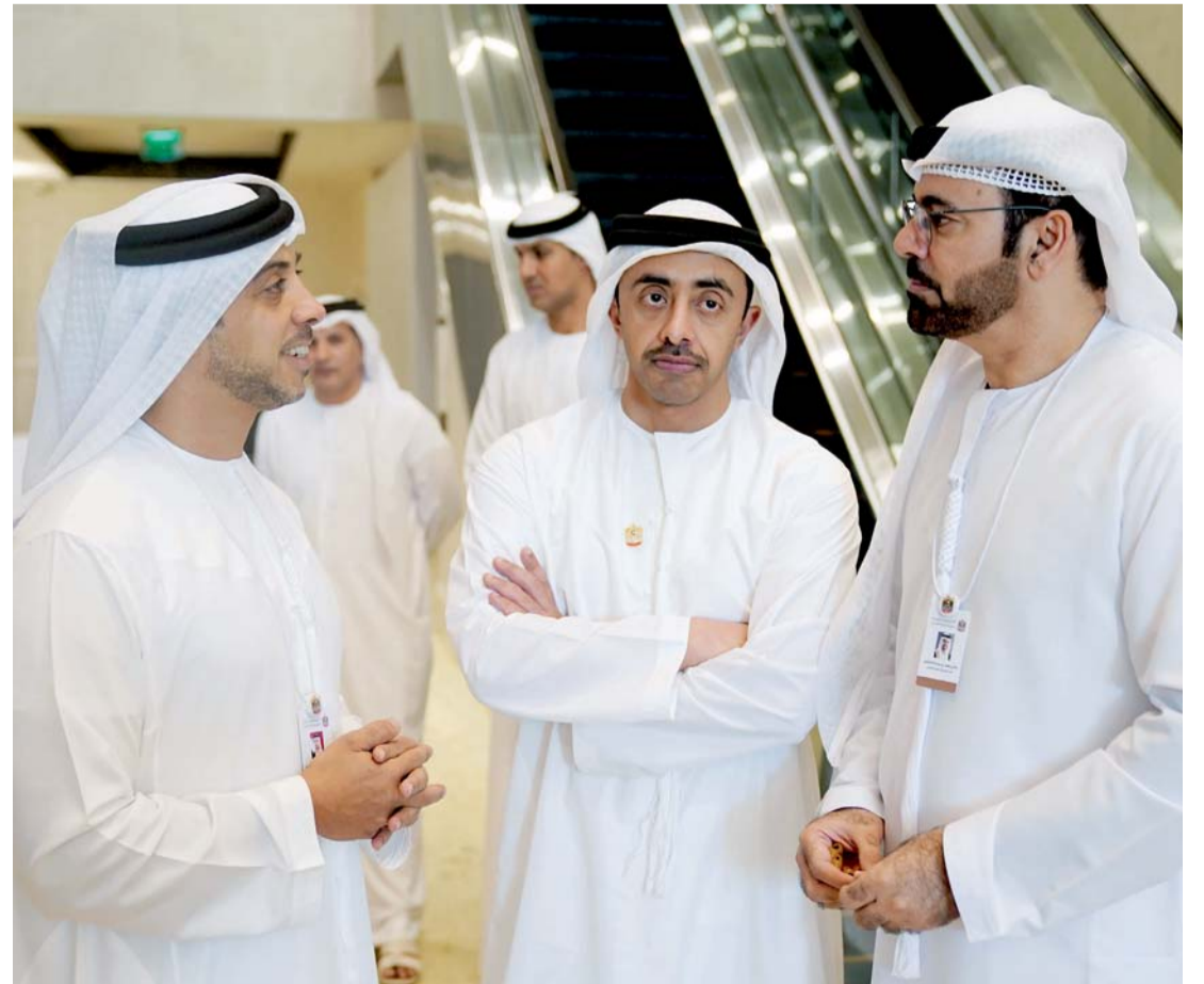
منصور وعبد الله بن زايد ومحمد القرقاوي