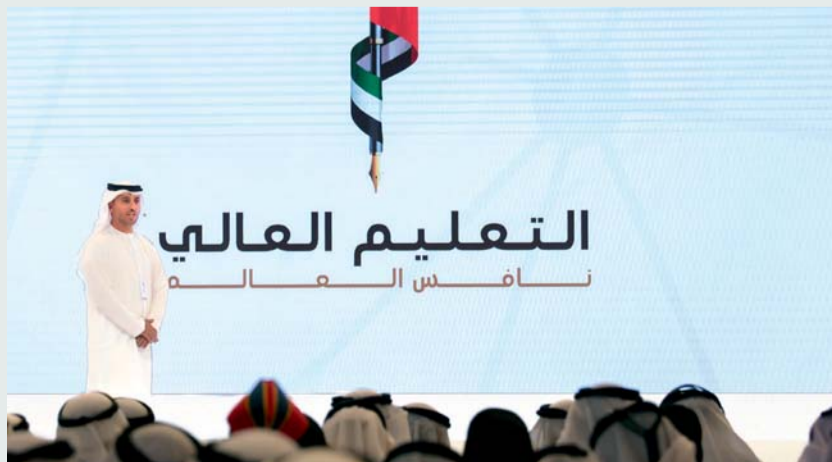
■ أحمد الفلاسي متحدثاً خلال إطلاق الاستراتيجية

وبين معاليه أن دولة الإمارات، تحرص من خلال الاستفادة من جميع التجارب والخبرات العالمية، وبناء الشراكات والتعاون مع أصحاب التجارب الرائدة، على تقديم نموذج عالمي متفرد في الارتقاء بالتعليم وتطوير أساليبه وأدواته، ليكون مثلاً يحتذى في بناء الأجيال القادرة على الخروج عن الأطر التقليدية، وابتكار الحلول والأفكار التي تصب في خدمة المجتمع. وتؤكد الاستراتيجية الوطنية للتعليم العالي 2030، على ضرورة تزويد الطلبة بالمهارات الفنية والعملية، ليكونوا منتجين وقادرين على دفع عجلة الاقتصاد في القطاعين الحكومي والخاص، كما أنها تحرص على تخريج أجيال من المتخصصين والمحترفين في القطاعات الحيوية، ليكونوا لبنة رئيسية في بناء اقتصاد معرفي، وليشاركوا بفاعلية في مسارات الأبحاث وريادة الأعمال وسوق العمل.