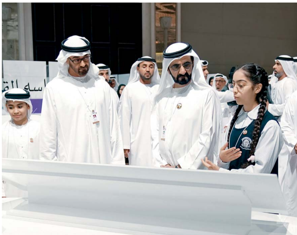
نائب رئيس الدولة وولي عهد أبوظبي خلال إطلاقها مسيرة تحقيق «مئوية الإمارات 2071»