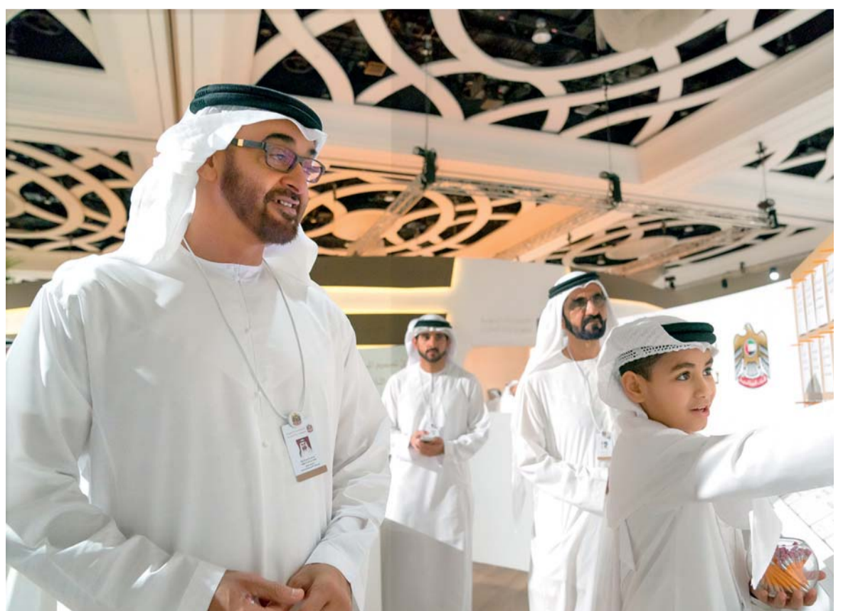
■ محمد بن راشد ومحمد بن زايد وحمدان بن محمد يتعرفون على طموحات أطفال المستقبل