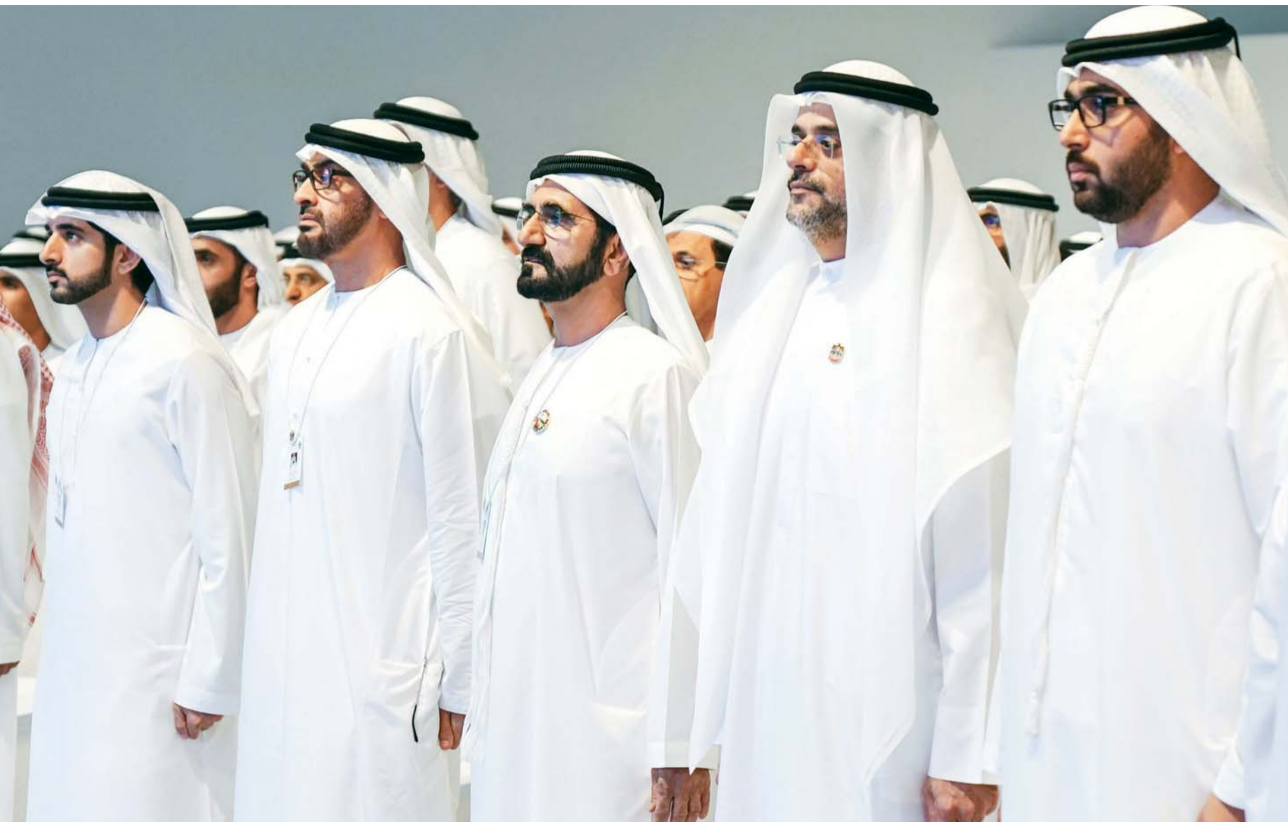
محمد بن راشد ومحمد بن زايد وحمدان بن محمد وسلطان بن محمد بن سلطان القاسمي وعمار النعيمي وراشد المعلا ومحمد بن سعود وسيف بن زايد خلال أعمال الدورة الأولى للاجتماعات السنوية للحكومة