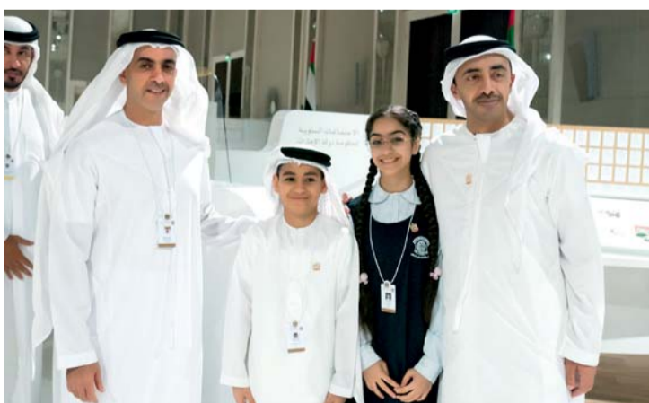
سيف وعبدالله بن زايد خلال لقاء أطفال الغد

للتعافي من الأمراض ورأوا أن الأدوية ستختفي مع تطور المناعة ضد الأمراض، وأدوية مصممة حسب احتياجات المرضى. وعلى صعيد مستقبل المجتمع وأنماط الحياة، رسم الأطفال حياة مفعمة