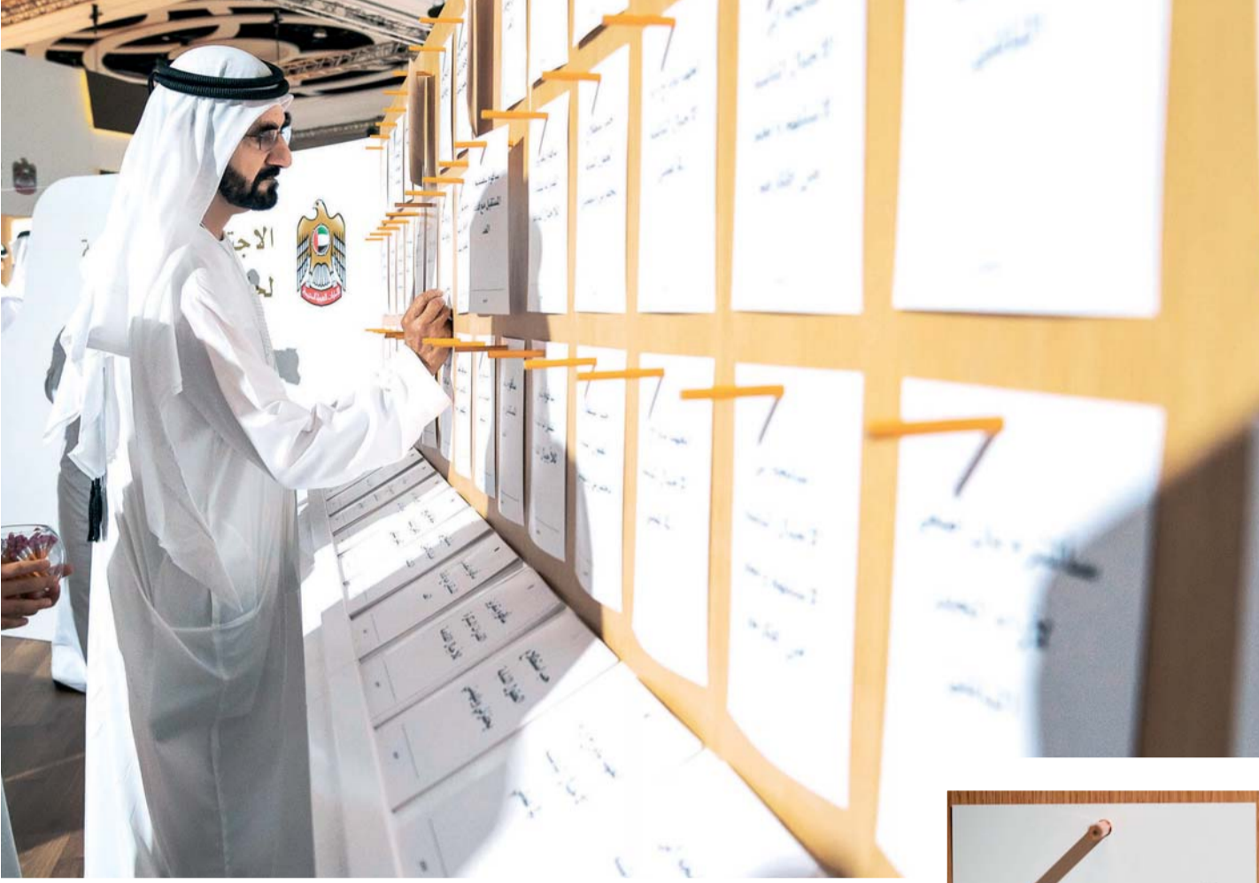
محمد بن راشد: أوّمن بقوة العمل مع قادة الغد

نائب رئيس الدولة: بتوجيهات خليفة اعتمدنا آلية عمل لتحقيق مئوية الإمارات 2071 المئوية تضمن لأجيالنا القادمة أفضل مستويات الحياة والرفاهية