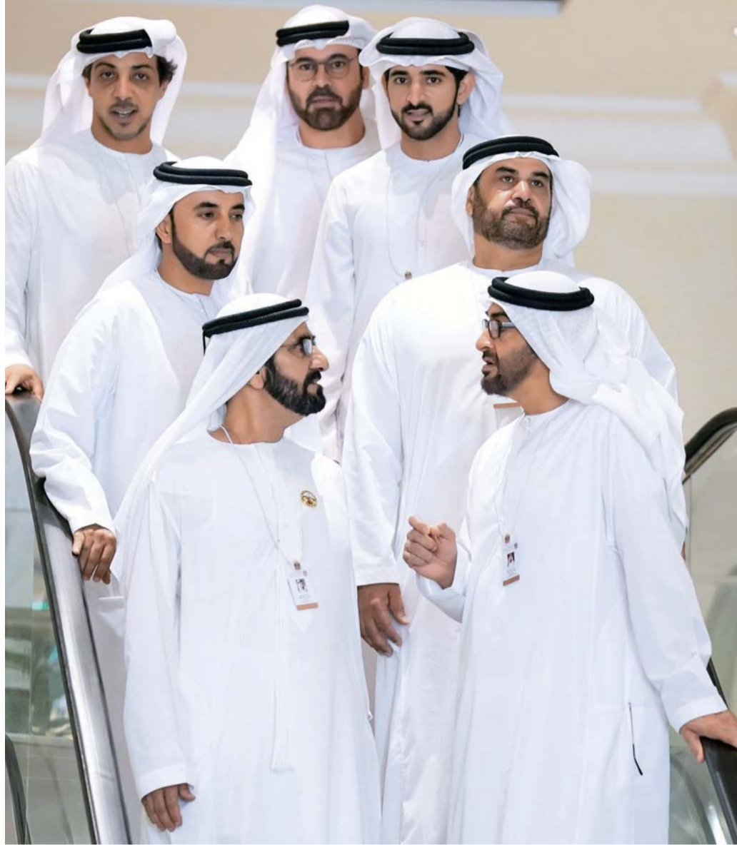
محمد بن راشد ومحمد بن زايد وحمدان بن محمد ومنصور بن زايد ومحمد القرقاوي وسلطان السبوسي

تؤكد المئوية تعزيز تمسك جيل المستقبل بهويته الوطنية والقيم المتجذرة والأصيلة منذ تأسيس الدولة عام 1971 كقيم إيجابية والسلم والتواضع والعطاء