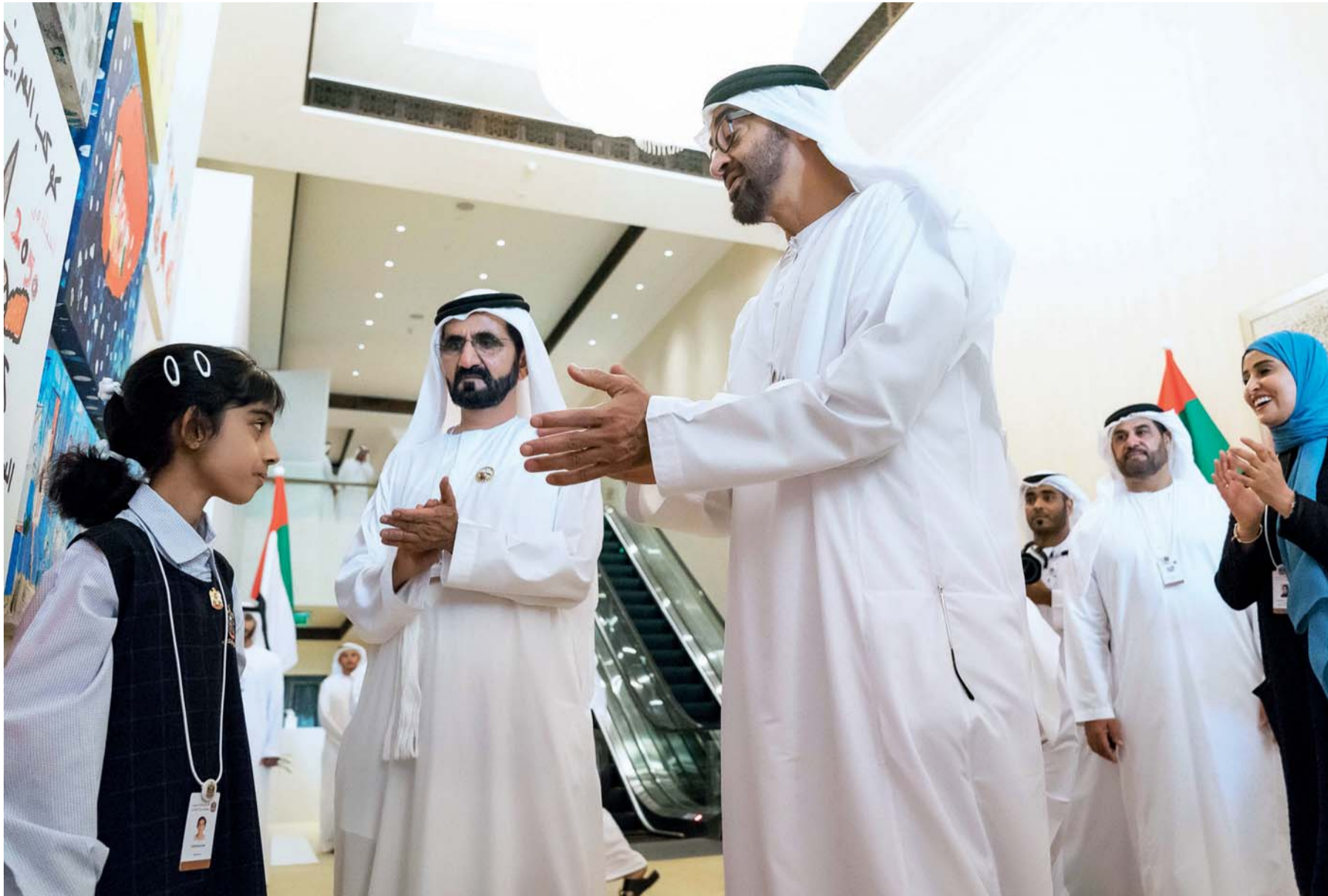
محمد بن راشد ومحمد بن زايد يحتفیان بأطفال الغد بحضور عهد الرومي