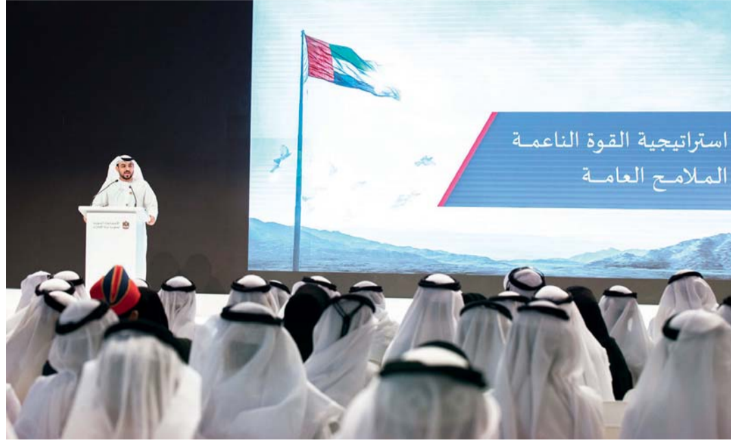
■ سعيد العطر يستعرض محاور استراتيجية القوة الناعمة لدولة الإمارات

وكان صاحب السمو الشيخ محمد بن راشد آل مكتوم شكل مجلس القوة الناعمة لدولة الإمارات في مايو الماضي، وأسند إليه مهمة تطوير وصياغة استراتيجية القوة الناعمة للدولة، بحيث تشمل كافة القطاعات الاقتصادية والثقافية والمجتمعية لتعزيز سمعة الإمارات الإيجابية.