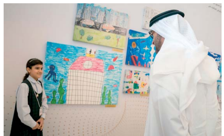
ولي عهد أبوظبي متحدثاً إلى إحدى المشاركات