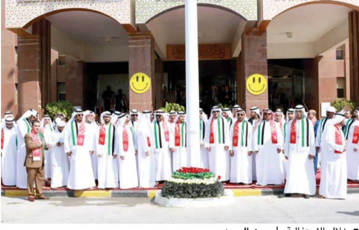
خلال الاحتفالية | من المصدر