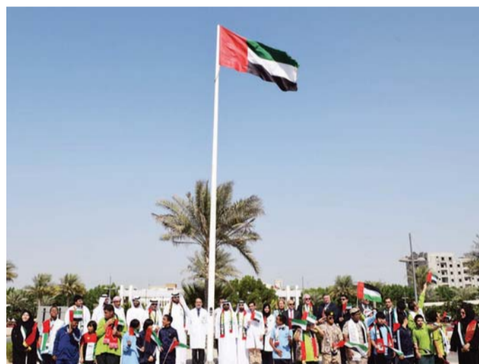
مشاركة مستشفى الشيخ خليفة العام في أم القيوين بالمناسبة

الحكيمة والفخر والاعتزاز بعلم الإمارات العزيز على قلوبنا جميعاً، مؤكداً أن هذه المناسبة تجسد مشاعر الوحدة والولاء بين أبناء الإمارات، وتعمل على تعزيز الشعور بالانتماء إلى الوطن.