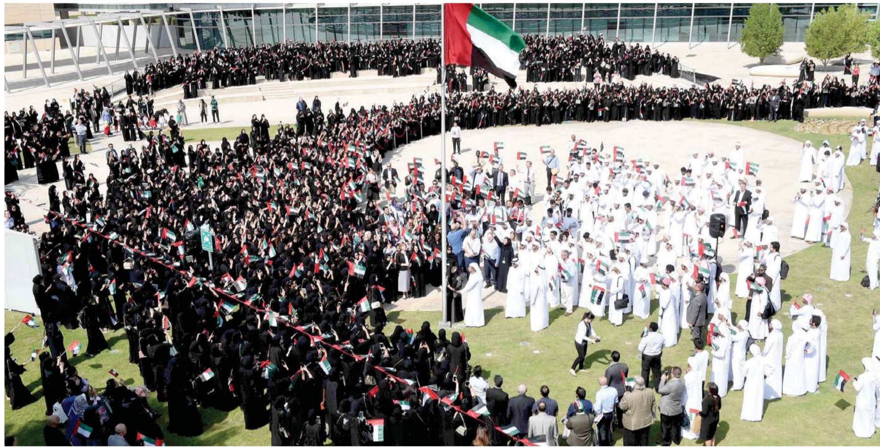
خلال رفع العلم في الساحة الخارجية لحرم جامعة زايد