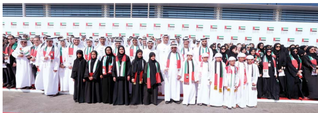
قيادات دائرة التعليم والمعرفة خلال احتفالية رفع العلم