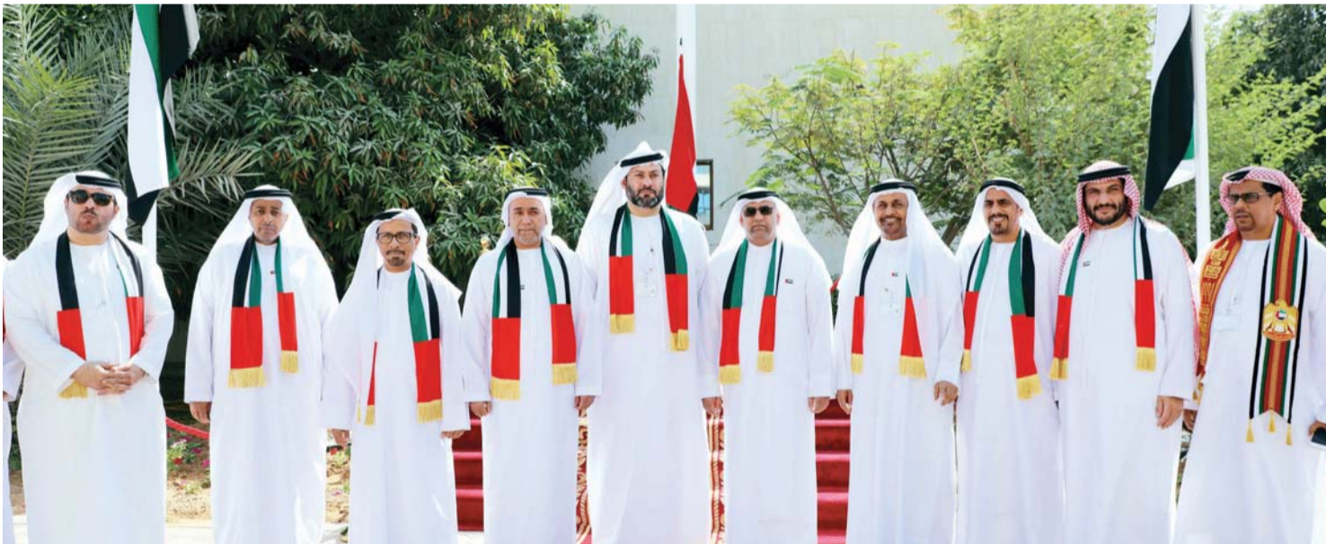
البادي متوسطاً موظفي الوزارة خلال الاحتفال