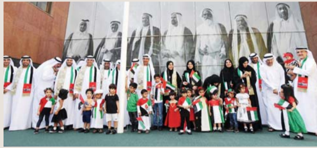
■ حسين لوتاه متوسطاً المشاركين في فعالية بلدية دبي

شهر نوفمبر من كل عام، إذ تحتفل فيه دولة الإمارات العربية المتحدة بمعاني التوحد والتلاحم وبناء الأوطان، بفضل من الله، وعزيمة الأوائل المؤسسين الذين تجاوزت رؤيتهم وبصيرتهم الحاضر لتلامس المستقبل. وشهد المدير العام لبلدية دبي على أن «يوم العلم» يمثل رمزاً للوحدة والوفاق على الساحة الإماراتية، وتجديداً للولاء للقيادة والانتماء للوطن الغالي، وتجسيداً لصورة إماراتية مشرقة تخفق الرايات فيها فوق كل البيوت.