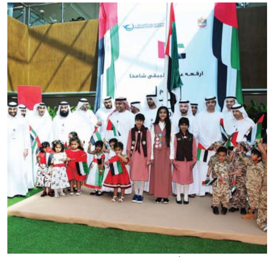
خلال الاحتفال