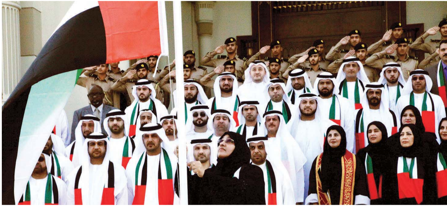
خولة الملا خلال رفع العلم على مبنى المجلس الاستشاري

كما أقام الطب الوقائي بالذيد احتفاليته برفع العلم بحضور ومشاركة الطاقم الإداري والفني لأسرة المركز وكذلك مشاركة طلاب روضة الحصن الأخوة المتعاملين والمراجعين. إلى ذلك، تجسدت أبرز مراسم الاحتفالية لبلدية الحمرة بمسيرة ارتجالية أمام مبنى بلدية الحمرة بحضور مبارك راشد الشامسي مدير بلدية الحمرة والمجلس البلدي لمنطقة الحمرة والديوان الأميري ودائرة التخطيط والمساحة والنيابة العامة وضباط مركز شرطة الحمرة الشامل وأعيان الحمرة.