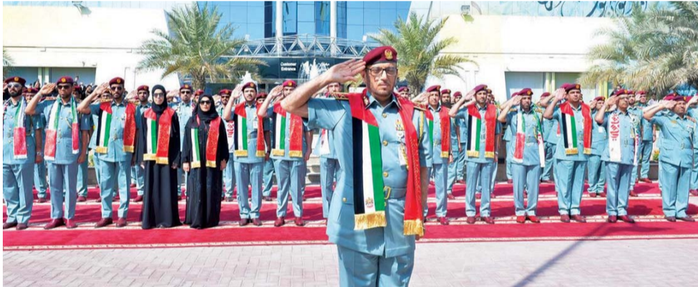
■ محمد المري خلال احتفالات إقامة دبي

إقامة دبي. وأكد اللواء المري أن هذا اليوم يوم يجسد معاني الفخر والاعتزاز لأبناء الإمارات بنهضة الدولة وبالإنجازات العظيمة لمؤسس وباني الدول المغفور له بإذن الله الشيخ زايد بن سلطان آل نهيان، رحمه الله.