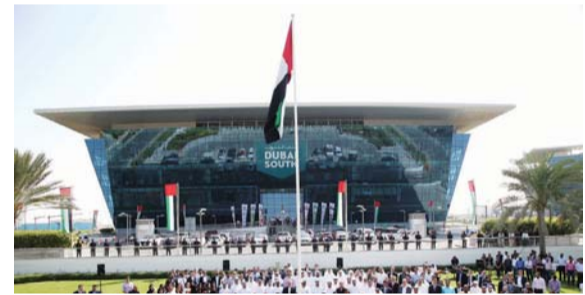
■ خلال احتفالات دبي الجنوب بيوم العلم