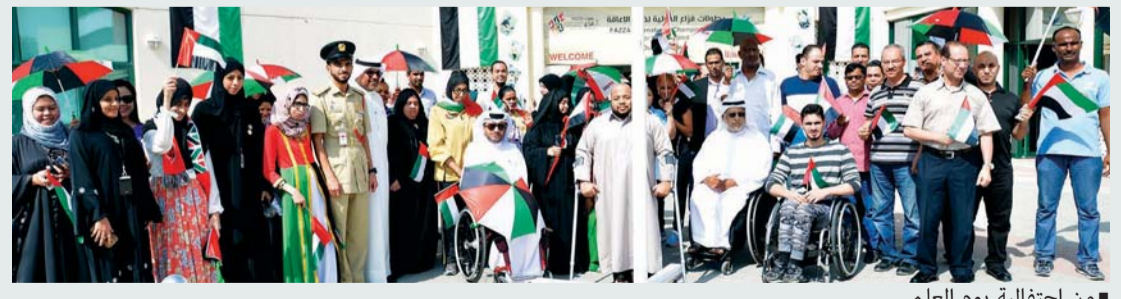
من احتفالية يوم العلم