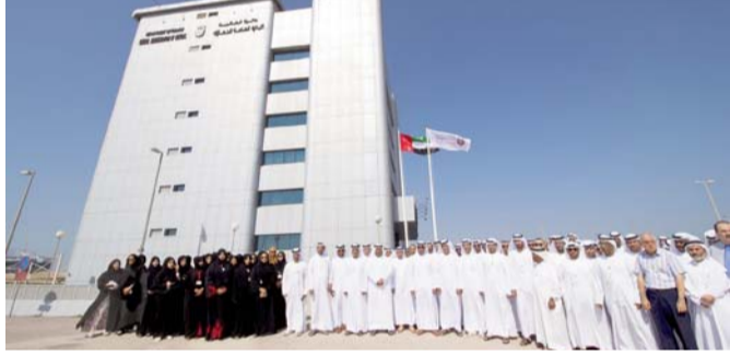
خلال احتفالات جمارك أبوظبي | البيان

نائب رئيس الدولة رئيس مجلس الوزراء حاكم دبي، رعاه الله، وصاحب السمو الشيخ محمد بن زايد آل نهيان، ولي عهد أبوظبي نائب القائد الأعلى للمواطنة المسلحة، وإخوانهم أصحاب السمو حكام الإمارات؛ راجياً الله تعالى أن يديم نعمة الأمن والأمان على دولة الإمارات وشعبها.