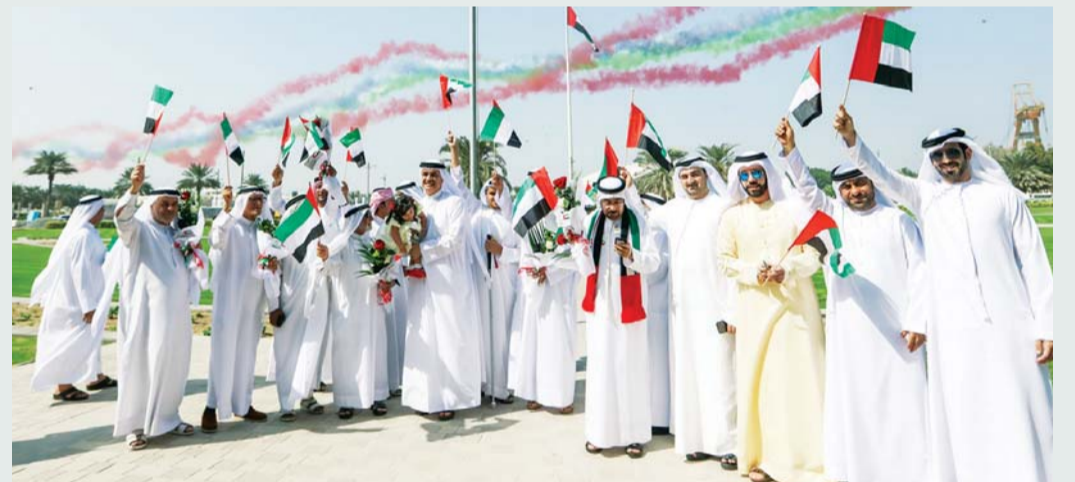
■ جانب من فعالية هيئة تنمية المجتمع