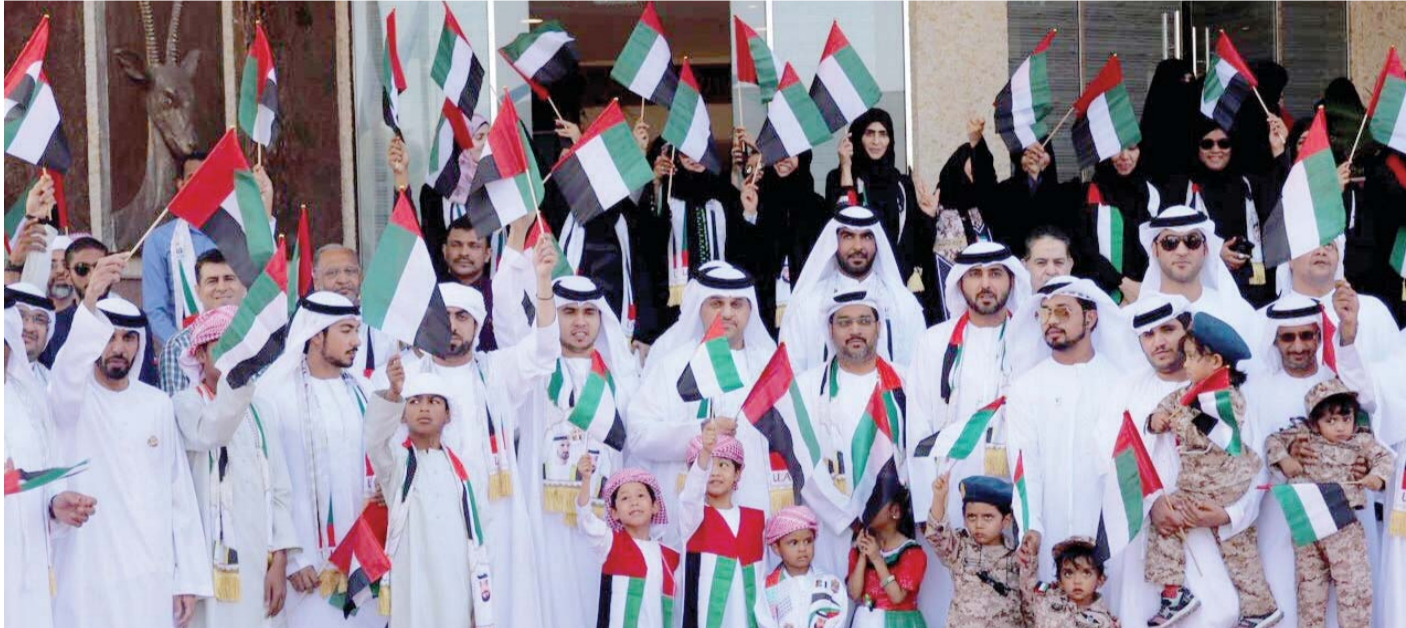
■ من احتفالات مدينة العين | تصوير: عمران خالد