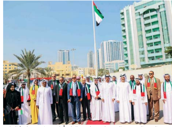
■ عبد العزيز النعيمي والمسؤولون يرفعون العلم أمام متحف عجمان | البيان

وقام الشيخ عبد العزيز بن حميد يرافقه المديرون العامون وكبار موظفي الدائرة برفع العلم أمام متحف عجمان، وسط احتفالية ضخمة، شهدت تقديم الأناشيد الوطنية وأهازيج فرق الفنون الشعبية، وإطلاق مسيرة الدراجات النارية التي ترفع علم الإمارات المجلس الأعلى حكام الإمارات وشيوخها في لفحة تعبر عن مدى الاعتزاز بهذه المناسبة الوطنية. وقال الشيخ عبد العزيز بن حميد النعيمي: إن احتفالية يوم العلم تتويج لعهدة هذا الوطن التي لا تزال ترسم على مدار تاريخه بإنجازات أبنائه حتى وصل إلى المكانة الرفيعة التي تشرف به كرمز للسيادة والعطاء.