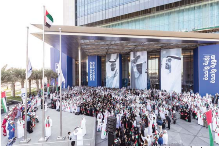
موظفو أدنوك خلال الاحتفال

احتفلت شركة بترول أبوظبي الوطنية «أدنوك» ومجموعة شركاتها بيوم العلم الذي يتزامن مع ذكرى تولى صاحب السمو الشيخ خليفة بن زايد آل نهيان رئيس الدولة، حفظه الله، مقاليد الحكم. وقام معالي الدكتور سلطان بن أحمد الجابر، وزير دولة الرئيس التنفيذي لأدنوك ومجموعة شركاتها، بمشاركة مجموعة من أصحاب الهمم من موظفي شركات المجموعة برفع علم الدولة أمام واجهة المبنى الرئيسي