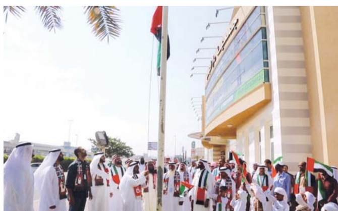
■ احتفالية رفع العلم أمام مبنى الجمعية