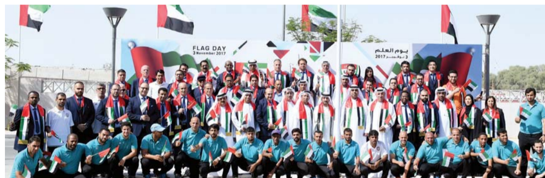
■ من احتفال اتحاد كرة القدم

بدوره، تقدم مجلس أبوظبي الرياضي بأسمى آيات الشكر والعرفان للقيادة