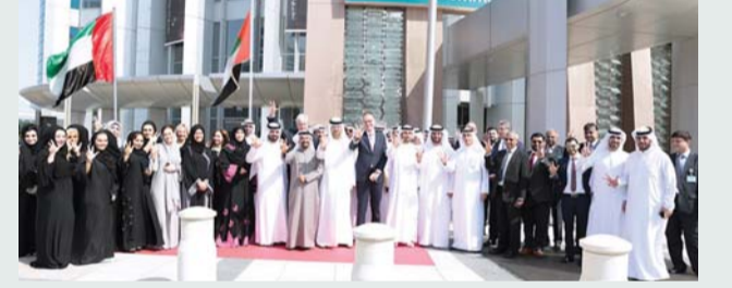
بنك دبي التجاري