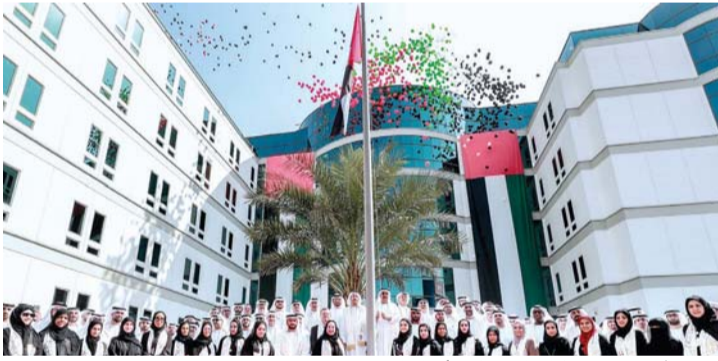
■ موظفو إينوك خلال الاحتفال | البيان

رئيس الدولة، رئيس مجلس الوزراء، حاكم دبي، رعاه الله، إلى المشاركة في احتفالات يوم العلم، الذي يصادف ذكرى جلوس صاحب السمو الشيخ خليفة بن زايد آل نهيان، رئيس الدولة، حفظه الله ورعاه.