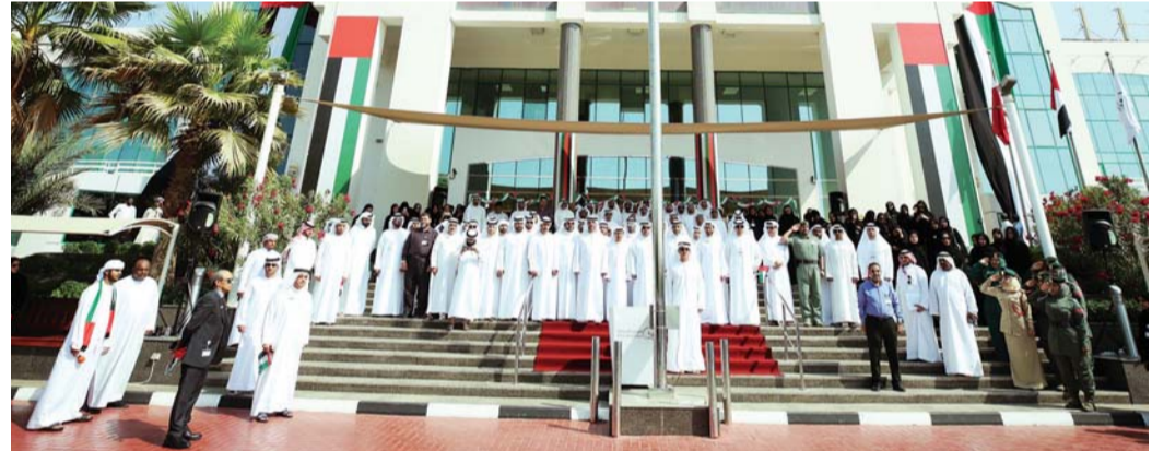
■ جانب من احتفالات نيابة دبي

11 صباحاً، لنجدد عهد الولاء لصاحب السمو الشيخ خليفة بن زايد آل نهيان، رئيس الدولة، حفظه الله، واستجابة لدعوة صاحب السمو الشيخ محمد بن راشد آل مكتوم، نائب رئيس الدولة رئيس مجلس الوزراء حاكم دبي، رعاه الله، بتوحيد رفع العلم، رفعناه في سماوات العز والفخر والكرامة شامخاً