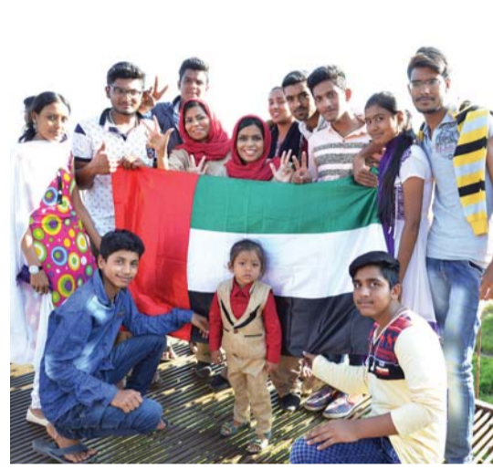
.. وخلال مشاركتهما في إحدى الرحلات