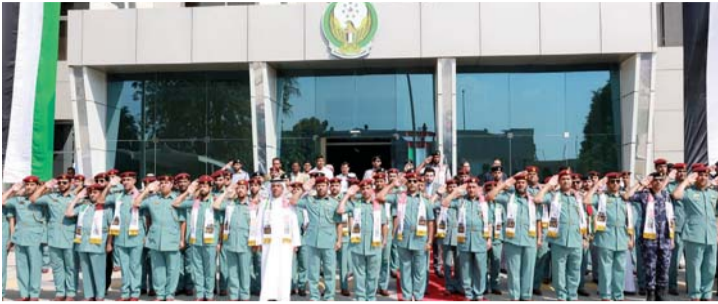
■ جانب من احتفالات شرطة الفجيرة

العلم، وبعدها قَدَم طلاب مدرسة الفجيرة للتعليم الأساسي عرضاً وطنياً تعبيراً عن حبهم للوطن. وبهذه المناسبة، قال العميد البحري، المدير العام للعمليات الشرطة، إن فعالية رفع العلم تأتي تزامناً مع ذكرى تولي صاحب السمو الشيخ خليفة بن زايد آل نهيان، رئيس الدولة، حفظه الله، مقاليد الحكم، ويعتبر العلم رمزاً للهوية الوطنية للوطن والمواطن.