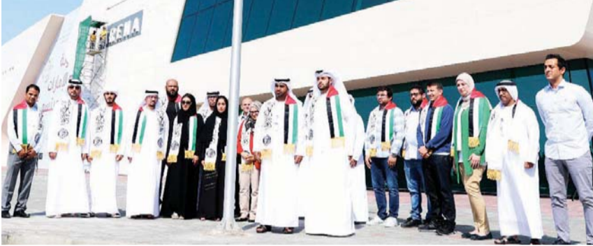
اتحاد الإمارات للجوجيتسو خلال الاحتفال

عبد المنعم الهاشمي رئيس الاتحادين الآسيوي والإماراتي للجوجيتسو، النائب الأول لرئيس الاتحاد الدولي للجوجيتسو: «إن الاحتفال بيوم العلم ينطلق من الثوابت الوطنية ويعبر عن قيم الولاء والانتماء والوفاء للوطن وقيادته الرشيدة، حيث إن هذه المناسبة العزيزة على قلوب جميع المواطنين والمقيمين على أرض الإمارات فرصة لتعزيز مفاهيم المواطنة والحس الوطني».