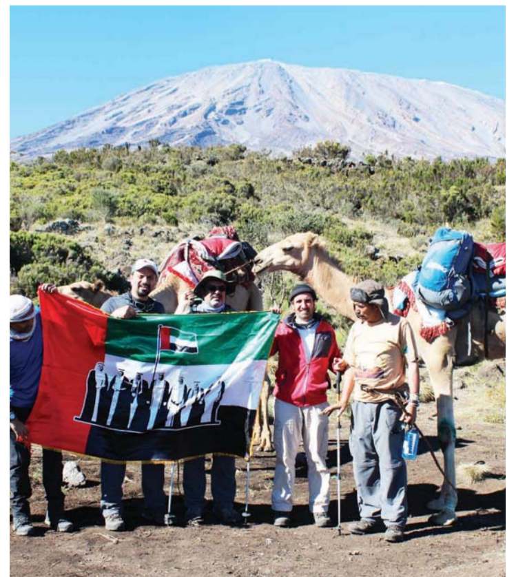
فريق رحالة الإمارات رافعا علم الدولة خلال رحلته إلى المناطق الجبلية والناحية حول العالم