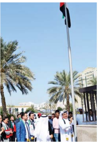
■ خلال الاحتفال بالشارقة | البيان