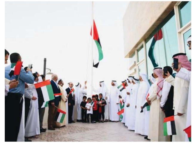
■ خلال احتفالية الأوقاف وشؤون القصر

احتفلت مؤسسة الأوقاف وشؤون القصر بدبي، أمس، برفع علم الإمارات على مبناها الرئيسي، كما نظمت إدارة شؤون القصر برنامج توزيع علم الإمارات بالتعاون مع مؤسسة وطني الإمارات، على منازل الحاضنات والقصر. وحضر فعالية رفع العلم، طيب الرئيس، الأمين العام لمؤسسة الأوقاف وشؤون القصر، ومدراء الإدارات والأقسام، وعدد من موظفي المؤسسة وعدد من القصر.