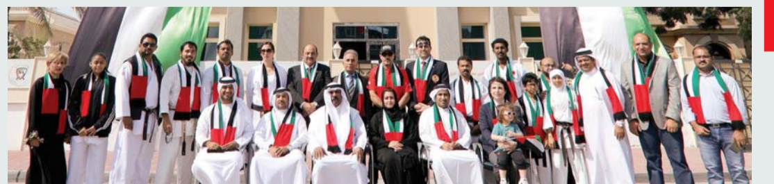
■ أسرة الكاراتيه خلال الاحتفالية | البيان