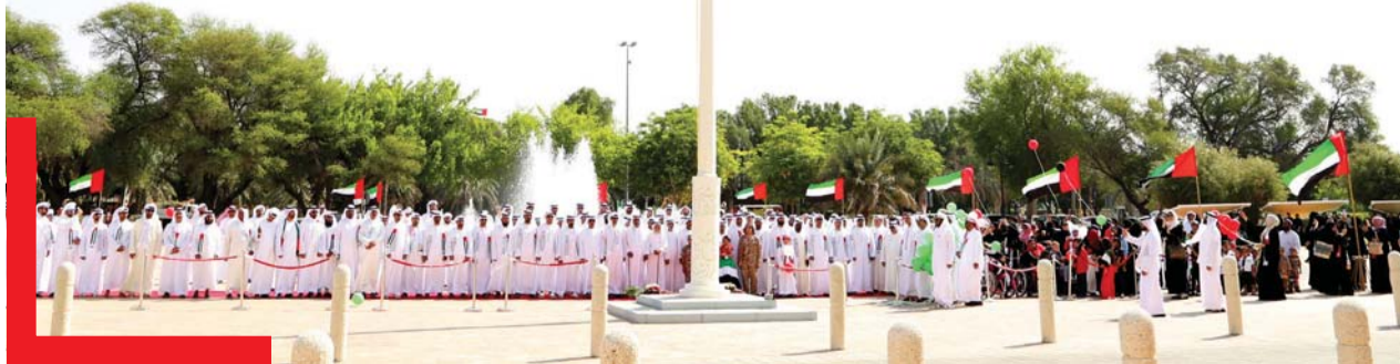
■ موظفو بلدية العين يحتفلون برفع العلم

ونظمت دار زايد للرعاية الأسرية بالتنسيق مع هيئة البيئة مكتب العين الاحتفال بيوم العلم وسط تجمع موظفي وأطفال وشباب الدار. كما احتفلت حديقة الحيوانات بالعين بيوم العلم.