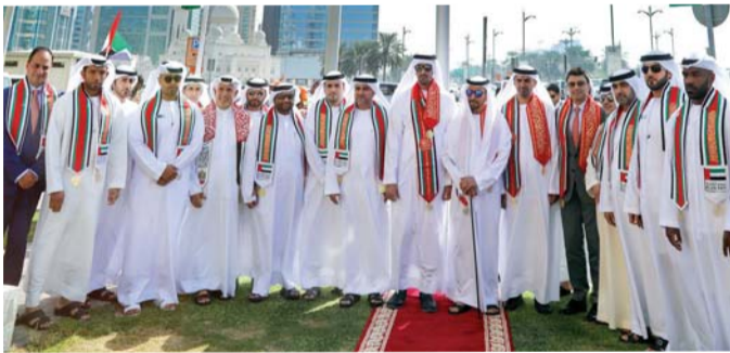
«أراضي دبي» تحتفل بيوم العلم | البيان