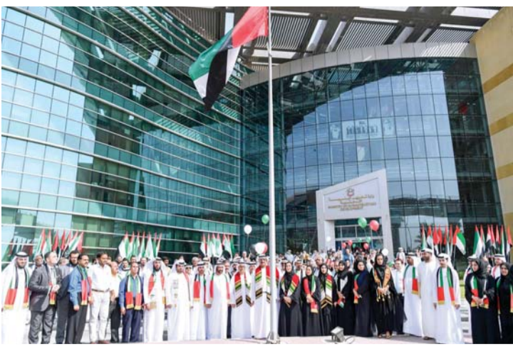
موظفو الوزارة خلال فعالية رفع العلم

شاركت وزارة تطوير البنية التحتية في احتفالات دولة الإمارات العربية المتحدة بيوم العلم، الذي يصادف الثالث من نوفمبر من كل عام، وهو ذكرى تولى صاحب السمو الشيخ خليفة بن زايد آل نهيان رئيس الدولة، حفظه الله، مقاليد الحكم. وقد قام معالي الدكتور المهندس عبد الله بلحيف النعيمي وزير تطوير البنية التحتية، يرافقه الوكلاء المساعدون،