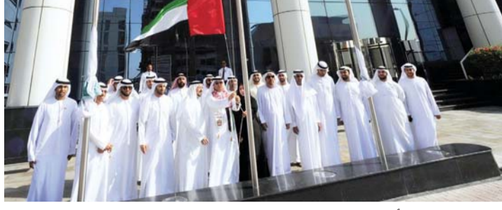
مسؤولو الهيئة أثناء رفع العلم

أكد الدكتور عبيد الزعابي، الرئيس التنفيذي لهيئة الأوراق المالية والسلع بالإمارة، أن يوم العلم مناسبة وطنية يتجدد فيها الولاء والوفاء، وإعلاء قيمة الاتحاد والانتماء للوطن، وهي تجسيد لمعاني الانتماء والتلاحم والوحدة التي يحملها كل مواطن ومقيم على هذه الأرض الطيبة، حيث نستلهم من هذه الذكرى الغالية العطرة كل معاني الوفاء والبناء والتضحية.