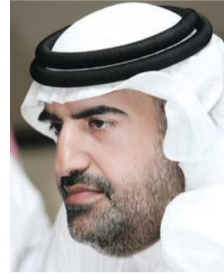
■ جمال بن حويرب

أبو ظبي نائب القائد الأعلى للقوات المسلحة، وإخوانهم أصحاب السمو أعضاء المجلس الأعلى للاتحاد حكام الإمارات، الذي يرسخ وحدتنا، ويؤكد ارتباطنا الوثيق باتحاد إماراتنا، كما نجدد عهدنا لدولتنا على الولاء للوطن ورفعته رايته، ليبقى علماً عالياً خفاً شامخاً في كل مكان.