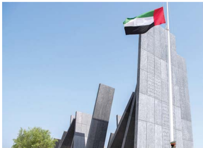
خلال رفع العلم

احتفلت وزارة الخارجية والتعاون الدولي بـ «يوم العلم» وشهد مراسم رفع علم الدولة في ديوان عام الوزارة دولة وأحمد ساري المزروعى وكيل وزارة الخارجية والتعاون الدولي ونوابهم إضافة لموظفي ومنتسبي الوزارة. وتحتفل دولة الإمارات كل عام بـ «يوم العلم» الذي يصادف ذكرى