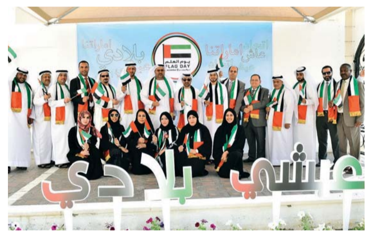
خلال الاحتفالية

علم دولة الإمارات، بحضور الدكتور سعيد محمد الغفلي، وكيل الوزارة المساعد لشؤون المجلس الوطني الاتحادي، وسامي بن عدي، وكيل الوزارة المساعد لقطاع الخدمات المساندة، ومديري الإدارات وموظفو الوزارة. وقال طارق لوتاه بهذه المناسبة: «علم الإمارات رمز عزتنا وعنوان هويتنا، والاحتفال به يتزامن مع ذكرى عالية على قلوبنا جميعاً. وهي تولي صاحب السمو الشيخ خليفة بن زايد آل نهيان، رئيس الدولة، حفظه الله، مقاليد الحكم في دولة الإمارات». وأضاف: «علم الإمارات، بما يحمله من معاني سامية ودلالات كبيرة، تحول إلى أيقونة تترين بها إنجازات دولة الإمارات الرائدة».