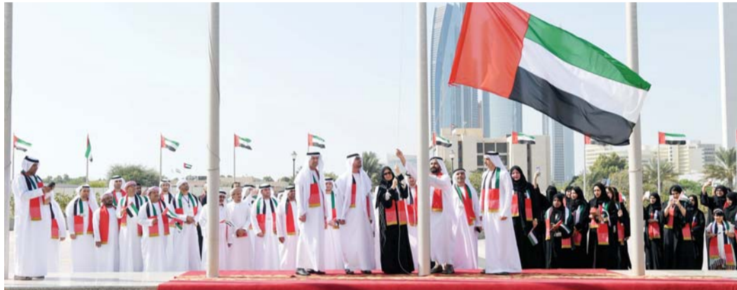
أمل القبيسي خلال رفع العلم