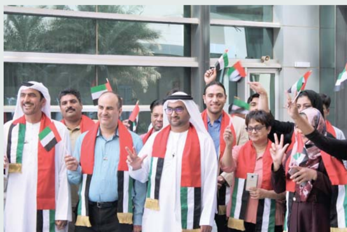
■ من احتفالات الفروسية