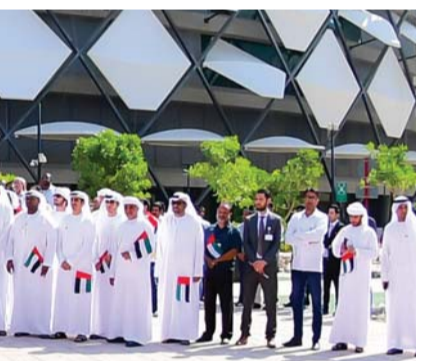
■ العين واحتفالية العلم

من جانبه، توجه سامي القمزي المدير العام لدائرة التنمية الاقتصادية بدبي بالشكر إلى سمو رئيس اللجنة الأولمبية الوطنية وقال: نشكر سمو الشيخ أحمد بن محمد بن راشد آل مكتوم على دعمه المستمر وتشريفه بالحضور في هذه الاحتفالية البهيجة التي تؤكد الانتماء والولاء إلى دولة الإمارات