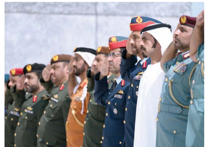
خليفة بن طحنون وكبار الضباط يحيون العلم | وام

والولاء للقيادة الحكيمة. وشملت المراسم عرضاً خاصاً للموسيقى العسكرية، واستعراضاً لمراسم حرس الشرف، وبعدها قام الشيخ خليفة بن طحنون بن محمد آل نهيان برفع العلم وسط أجواء وطنية تجسد أسمى معاني الالتفاف حول القيادة الرشيدة، ومشاعر الفخر والاعتزاز بعلم الإمارات الأبي.