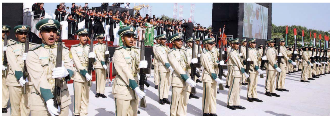
■ أطفال يعزفون خلف أفراد شرطة دبي

التسامح، والاعتدال، والوسطية، وتقبل الآخر، والحفاظ على العادات والتقاليد والهوية الوطنية، وكما يرى أفلاطون في مدينته الفاضلة أن الموسيقى لها صفة تربوية وتأثير فعال على النفوس إضافة إلى اتصالها بالجمال بحيث تكسب النفس اثلاً وارتزاقاً من أجل تحقيق الخير والجمال. ومن هنا ندرك أهمية الموسيقى في تعزيز مهارات التفكير الإيجابي، وإطلاق الطاقة الإيجابية باتجاه الآخرين، سواء من خلال الارتباط بالموسيقى المحلية أو بالانفتاح على موسيقى العالم بإيقاعاتها المختلفة، وإذا اخترنا هذا المفهوم في علم النفس تنبئنا الدراسات والبحوث المختلفة بدور الموسيقى في تهيئ النفس الإنسانية، قيماً وأخلاقاً وسلوكاً، وتعزيز الطاقة الإيجابية، ومهارات الإبداع والابتكار من أجل عالم لا يصغي سوى إلى موسيقى التواصل والحوار، وموسيقى المحبة والسلام، وموسيقى التسامح والتعايش بين الشعوب، بعيداً عن ضجيج الحروب والعنف، مستجيباً لفطرة الوجود وفطرة الحياة، وفطرة الإنسان.