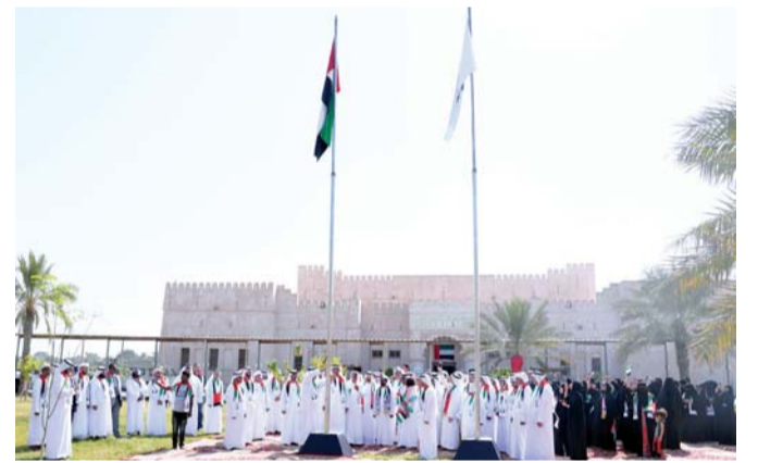
■ من فعاليات الاحتفال