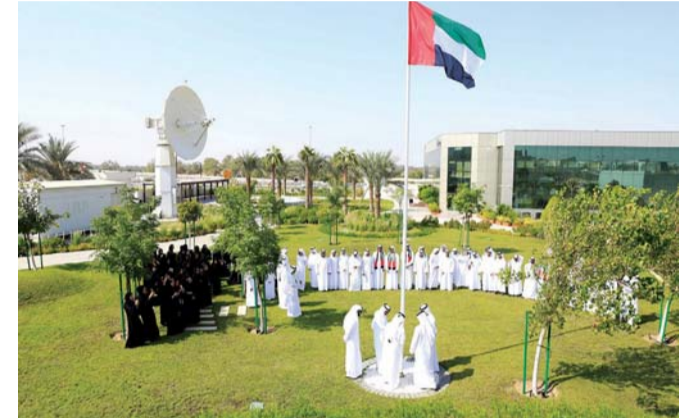
■ جانب من فعالية مركز محمد بن راشد للفضاء