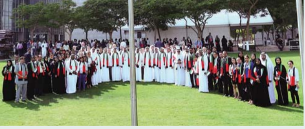
عيسى كاظم يتقدم المشاركين في الاحتفال أمس

والذي يتكون من 1750 شركة. وتقدم عيسى كاظم، محافظ مركز دبي المالي العالمي، الاحتفالات التي أقيمت في المنطقة المواجهة لمبنى البوابة. وقال عيسى كاظم: «يمثل يوم العلم الإماراتي مناسبة غالية على قلوبنا في مركز دبي المالي العالمي».