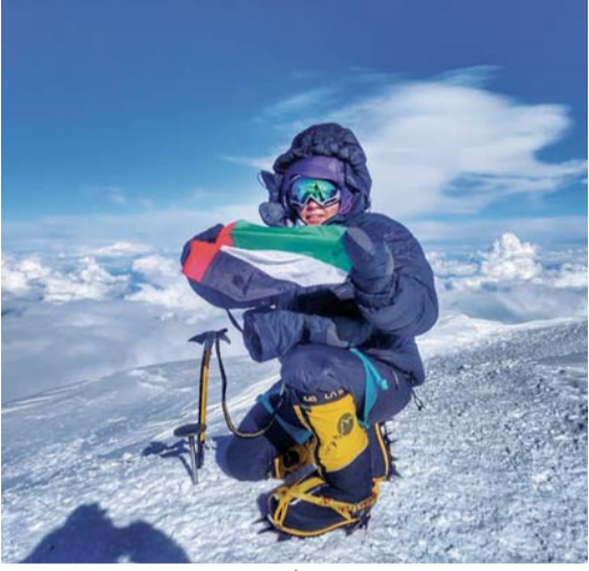
.. وخلال صعودها قمة جبلية أخرى