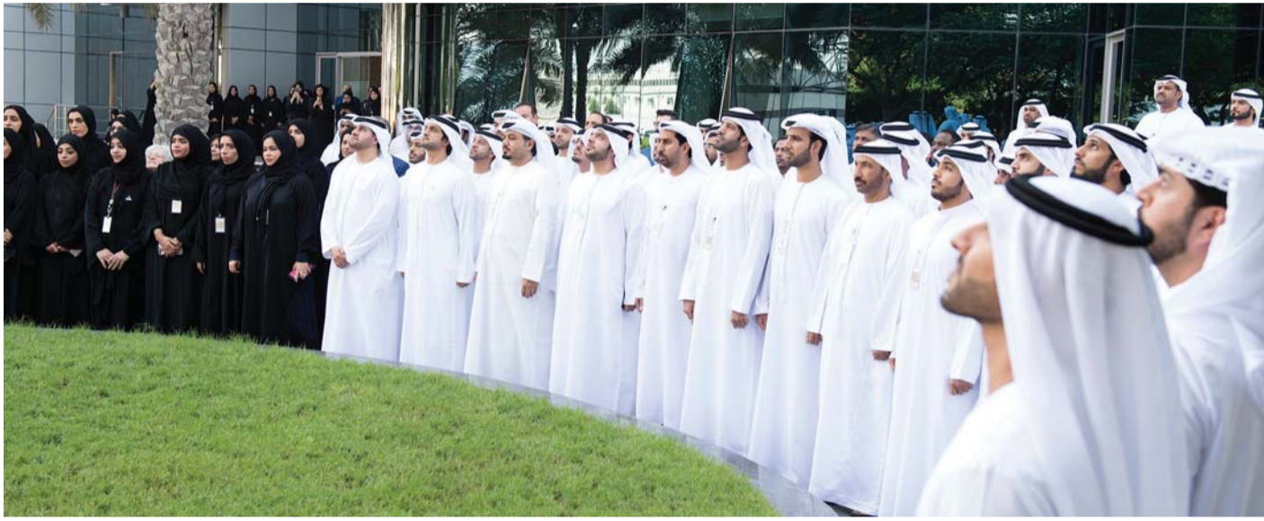
■ خلال الاحتفال بيوم العلم في الأمانة العامة للمجلس التنفيذي بأبوظبي

احتفت الشركة الوطنية للضمان الصحي (ضمان)، أمس، بيوم العلم بمشاركة أعضاء الإدارة التنفيذية وعدد من موظفي الشركة في مقرها الرئيس بأبوظبي.