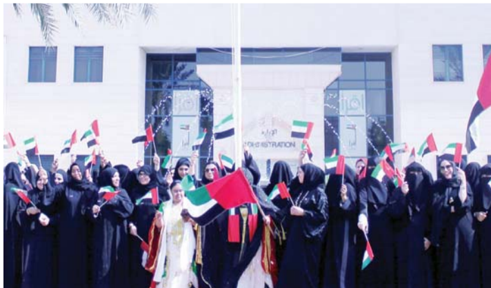
■ جانب من فعالية «نسائية دبي» | من المصدر