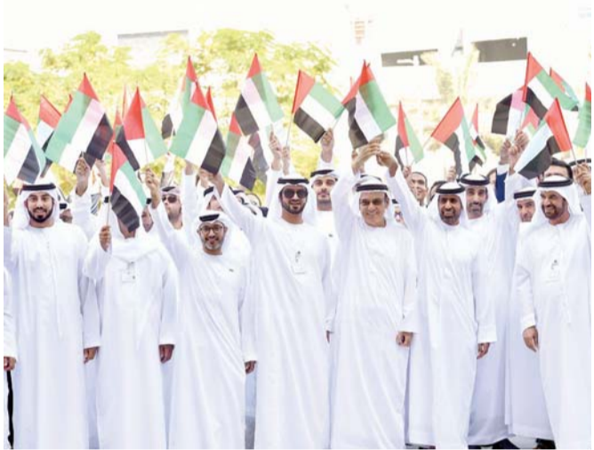
أثناء الاحتفالات

تولي صاحب السمو الشيخ خليفة بن زايد آل نهيان رئيس الدولة، حفظه الله، مقاليد الحكم، حيث كان صاحب السمو الشيخ محمد بن راشد آل مكتوم، نائب رئيس الدولة رئيس مجلس الوزراء حاكم دبي، رعاه الله، قد أطلق في الثالث من نوفمبر 2013 حملة وطنية وشعبية شاملة ومستمرة احتفالاً بـ «يوم العلم»، داعياً إلى رفع علم دولة الإمارات عالياً تعبيراً عن عشق الوطن والشعور بالامتنان لمؤسسي الدولة والتحام كل أبناء الشعب وتعهدهم ببذل الغالي والنفيس من أجل الحفاظ على الاتحاد.