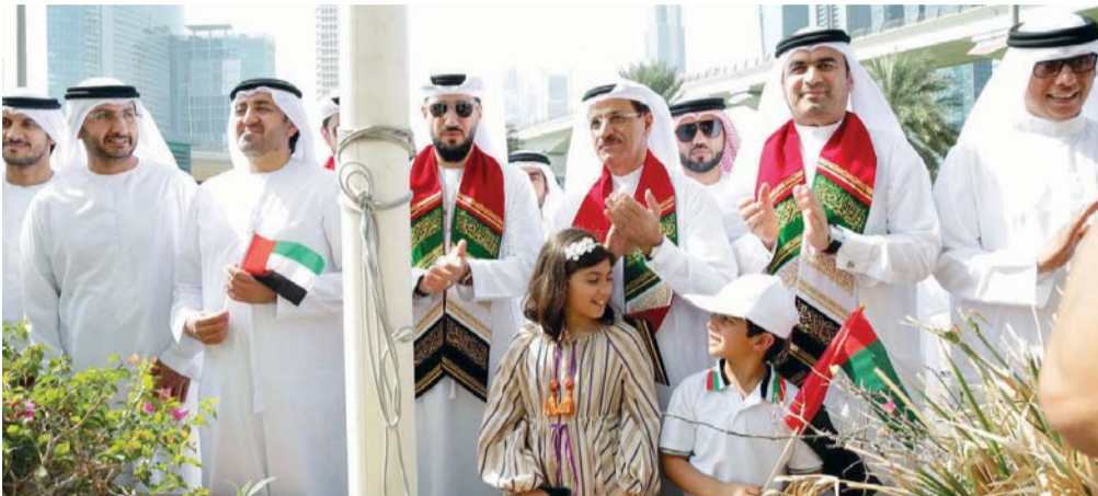
سلطان المنصوري وموظفو الوزارة خلال رفع العلم

قلوب أبناء الإمارات والمقيمين على أرضها تلاقى فيها مشاعر الجميع على معاني الانتماء الصادق والمخلص لدولة الإمارات العربية المتحدة وتمثل فرصة للتعبير عن أعلى درجات التلاحم بين أبناء الوطن والتفافهم حول قيادتهم الرشيدة واعتزازهم بعلمهم.