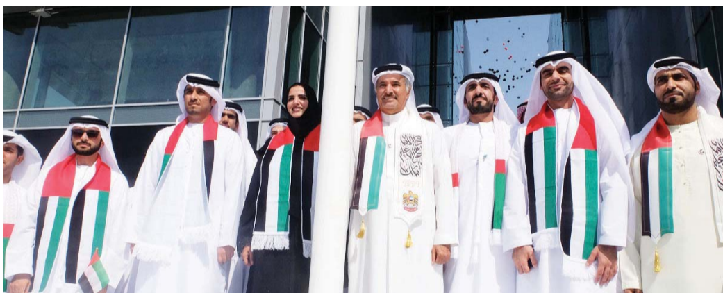
■ جانب من احتفالية اللجنة العليا للتشريعات

المؤسسون. ولا يسعنا اليوم إلا أن نعرب عن فخرنا واعتزازنا بانتمائنا إلى وطن يستظل بظل القيادة الحكيمة لصاحب السمو الشيخ خليفة بن زايد آل نهيان، رئيس الدولة، حفظه الله، الذي عاهد فصدق، ليقود مسيرة الاتصاف بأمانة واقتدار، امتداداً لنهج المغفور له الشيخ زايد بن سلطان آل نهيان، طيب الله ثراه، القائم على الوحدة والتآزر، باعتبارهما مصدر كل قوة ورفعة وفخر.»