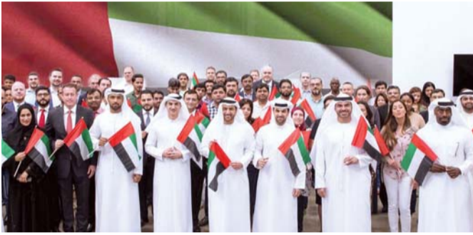
■ خلال احتفال دبي القابضة في أم سقيم | البيان

القابضة، في هذه المناسبة الوطنية الغالية، بالجهود الكبيرة التي بذلها الآباء المؤسسون لدولة الإمارات، وتقدموا بأسمى آيات الشكر والتقدير إلى صاحب السمو الشيخ خليفة بن زايد آل نهيان، رئيس الدولة، حفظه الله، على جهوده الدؤوبة لإعلاء مكانة الدولة، لتكون نموذجاً يحتذى به العالم أجمع.