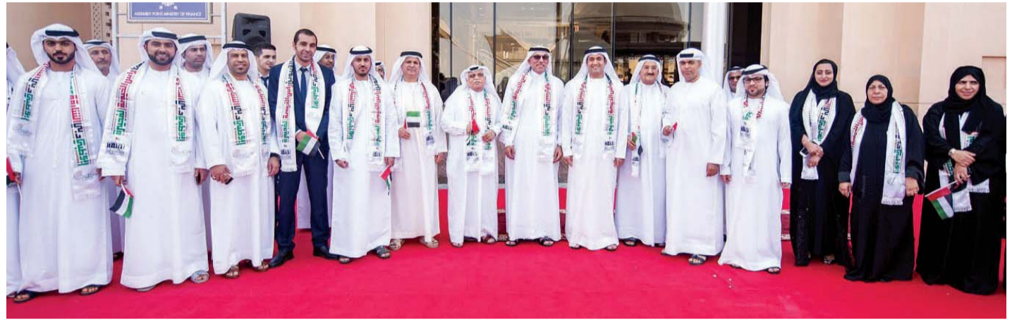
مسؤولو وزارة المالية والعاملون يحتفلون بيوم العلم | البيان