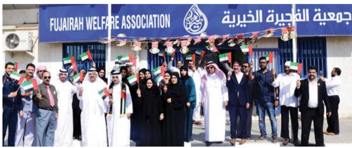
■ خلال فعالية جمعية الفجيرة