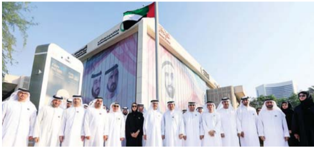
■ سعيد الطاير خلال احتفالات كهرباء دبي

الرئيس، وموظفي الهيئة وعدد كبير من المتعاملين الذين حرصوا على المشاركة. وقال الطاير: «في «يوم العلم» نهنئ قائد المسيرة صاحب السمو الشيخ خليفة بن زايد آل نهيان، رئيس الدولة، حفظه الله، وأخيه صاحب السمو الشيخ محمد بن راشد آل مكتوم، نائب رئيس الدولة رئيس مجلس الوزراء حاكم دبي، رعاه الله، وصاحب السمو الشيخ محمد بن زايد آل نهيان، ولي عهد أبوظبي نائب القائد الأعلى للقوات المسلحة، وإخوانهما أصحاب السمو أعضاء المجلس الأعلى للاتحاد حكام الإمارات».