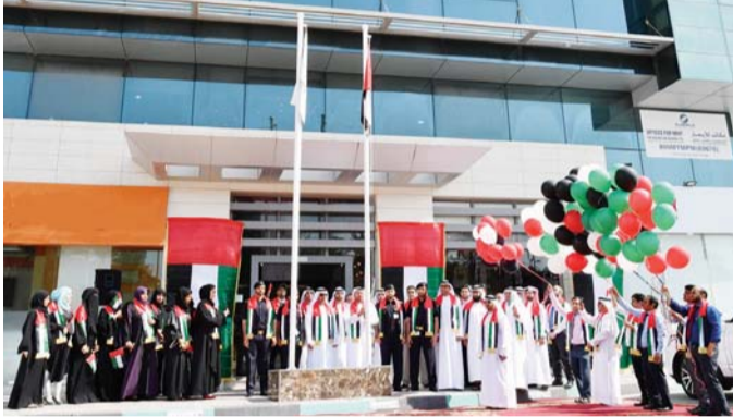
موظفو الجمارك يرفعون العلم في مقر الهيئة بأبوظبي