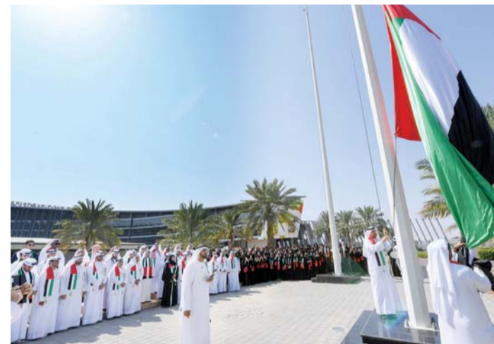
مدير جامعة الإمارات والموظفون والطلبة خلال رفع العلم

واحتفلت جامعة الإمارات بيوم العلم بحضور الدكتور محمد البيلي مدير الجامعة والدكتور غالب الحضرمي نائب مدير الجامعة للشؤون الأكاديمية والدكتور علي الكعبي، نائب مدير الجامعة لشؤون الطلبة ومديرو الإدارات وعمداء الكليات. وأكد الأستاذ الدكتور محمد البيلي مدير الجامعة أن الاحتفال بيوم العلم يُعد واجباً وطنياً نستلهم منه استذكار إنجازات الدولة في كافة المجالات، حيث أنه يجسد عنوان وطن وشعب، وقصة