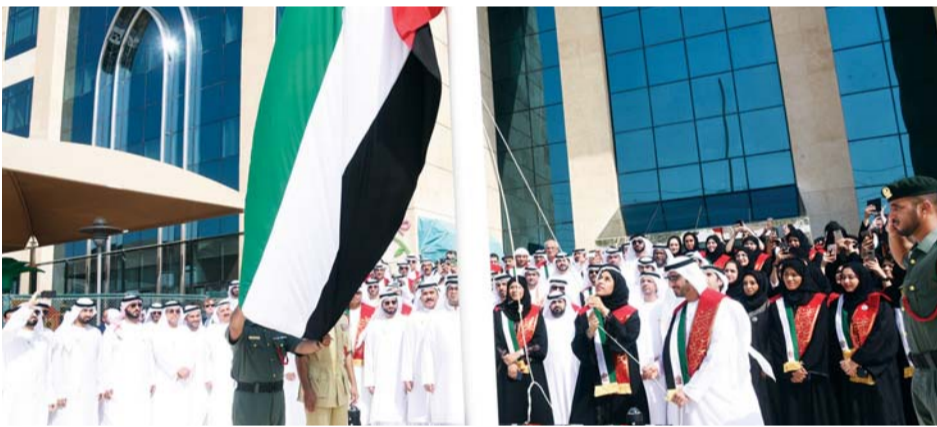
خلال رفع العلم

الدولة وأخيه صاحب السمو الشيخ محمد بن راشد آل مكتوم نائب رئيس الدولة رئيس مجلس الوزراء حاكم دبي، حفظهما الله، وصاحب السمو الشيخ محمد بن زايد آل نهيان ولي عهد أبوظبي نائب القائد الأعلى للقوات المسلحة وإخوانهم أصحاب السمو أعضاء المجلس الأعلى حكام الإمارات السبع، أننا على العهد ماضون، وسنحقق بإذن الله المزيد من الإنجازات بدعمهم وتوجيهاتهم الرشيدة، وسنظل دوماً رافعين علم الفخر والعزة علم الاتحاد محافظين على كيان هذا الرمز الوطني.