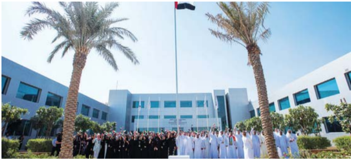
■ خلال احتفال إكسبو بالعلم أمس | البيان

التنفيذي لمكتب «إكسبو 2020 دبي»، علم الدولة أمس، في مكاتب موقع «إكسبو 2020 دبي»، في دبي الجنوب، بحضور فريق عمل «إكسبو 2020» من المواطنين والمقيمين من مختلف الجنسيات.