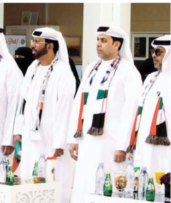
■ فقرات فنية وتراثية متنوعة في الاحتفال

بالإنابة للهيئة: تتشرف بإحياء هذه المناسبة الغالية على قلوبنا، والانضمام إلى كافة المؤسسات والشركات والمواطنين والمقيمين، للالتحاق بهذا اليوم الذي يحمل الكثير من المعاني والقيم الوطنية السامية، وتسهم هذه الفعاليات في تجسيد مشاعر الوحدة والسلام بين أبناء الإمارات، كما تعزز