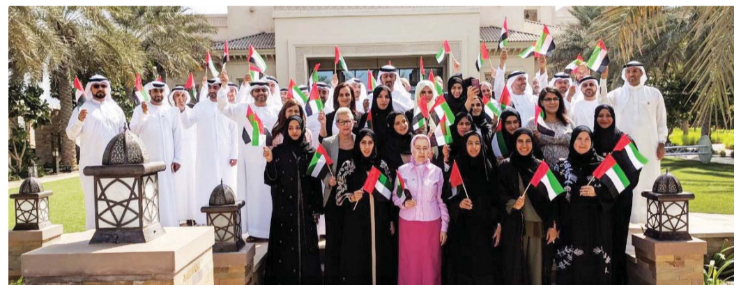
■ فريق عمل الأمانة العامة للمجلس التنفيذي لإمارة دبي خلال الاحتفالية