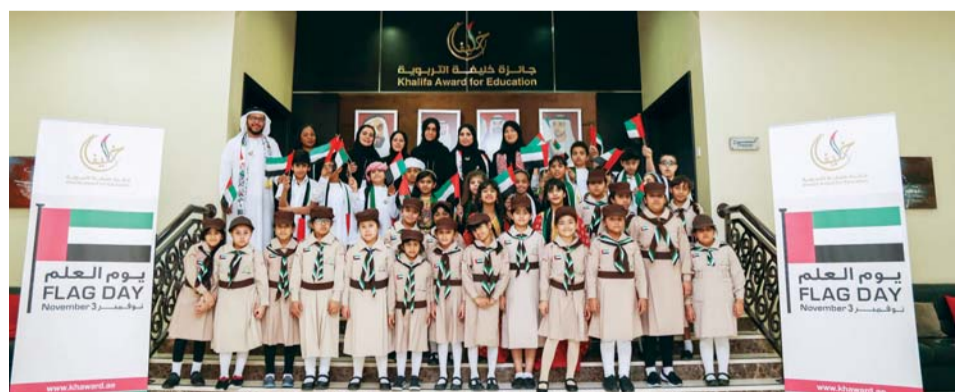
خلال احتفال جائزة خليفة التربوية بيوم العلم