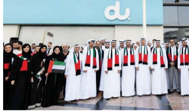
■ خلال احتفال دو عبر كافة مكاتبها ومراكزها في الدولة | البيان