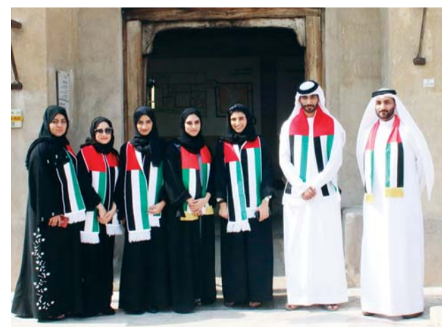
■ خلال احتفالات الشؤون القانونية | من المصدر