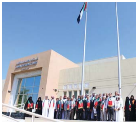
خلال الاحتفال

احتفلت المحكمة الاتحادية العليا بيوم العلم، وشارك المستشار محمد بن حمد البادي، رئيس المحكمة، وقضاة المحكمة والإداريون في رفع علم الدولة على سارية المحكمة. وألقى محمد البادي كلمة بالمناسبة، قال فيها: «نتنزه هذه المناسبة الغالية على قلوبنا جميعاً، لنتقدم بخالص التحية والتبريكات إلى مقام صاحب السمو الشيخ خليفة بن زايد آل نهيان، رئيس الدولة، حفظه الله، وأخيه صاحب السمو الشيخ محمد بن راشد آل مكتوم، نائب رئيس الدولة رئيس مجلس الوزراء حاكم دبي، رعاه الله، وصاحب السمو الشيخ محمد بن زايد آل نهيان، ولي عهد أبوظبي نائب القائد الأعلى للقوات المسلحة». أبوظبي - وام