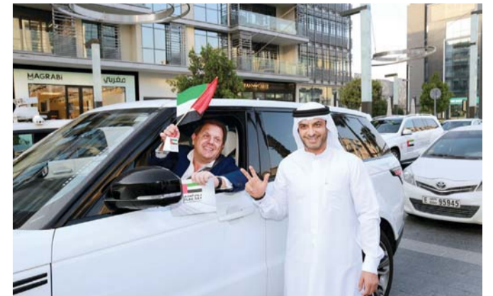
■ مرور دبي تشارك فرحة الجمهور بيوم العلم | من المصدر