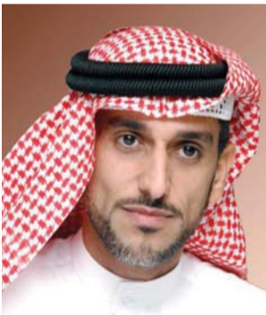
■ سيف المدفع

أكد مسؤولون وفعاليات اقتصادية في الدولة، أن «يوم العلم» الذي يصادف الثالث من نوفمبر من كل عام، ويتزامن مع تولي صاحب السمو الشيخ خليفة بن زايد آل نهيان، حفظه الله، مقاليد الحكم، مناسبة وطنية مهمة في حياة شعب الإمارات، لتأكيد الولاء للوطن ولقيادتنا الرشيدة وشعبنا الأبي، وأنه مناسبة تجدد فيها مواطنين ومقيمين انتماءنا إلى علم دولة الإمارات، الذي يمثل قيماً إنسانية رسمتها الإمارات بحروف من ذهب على جدار التاريخ. وقالت الدكتورة عائشة بنت بطي بن بشر مدير عام دبي الذكية: «يحل يوم العلم، وقد امتدت مساحة علم دولتنا الحبيبة، لتشمل مختلف أنحاء العالم، بفضل الإنجازات التي تحققت في ظل قيادتنا الرشيدة بمختلف المجالات، قيمة علمنا شجرة فخر غرسها المغفور له بإذن الله، الوالد المؤسس الشيخ زايد، رحمه الله، وكل عام في يوم العلم، نحتفل بقيمة جديدة تصل إليها هذه الشجرة وسارية علم الإمارات، فيحل هذا العام ونحن أقرب إلى رحلة استيطان المريح، ويحل وحكومتنا أكثر شباباً واستشرافاً للمستقبل». هذا العام مع محطة تاريخية، أعلنها سيدي صاحب السمو الشيخ محمد بن راشد آل مكتوم نائب رئيس الدولة رئيس مجلس الوزراء حاكم دبي، وأخيه صاحب السمو الشيخ محمد بن زايد آل نهيان ولي عهد أبوظبي نائب القائد الأعلى للقوات المسلحة، تتمثل بمسيرة متواصلة الإمارات 2071، ولا بد أن نكرس جهودنا لنحافظ على العلم، كرمز متجدد لكافة هذه الإنجازات الوطنية، سواء على صعيد العمل، والأهم على مستوى غرس قيم الاعتزاز الدائم بالوطن في نفوس أبنائنا».