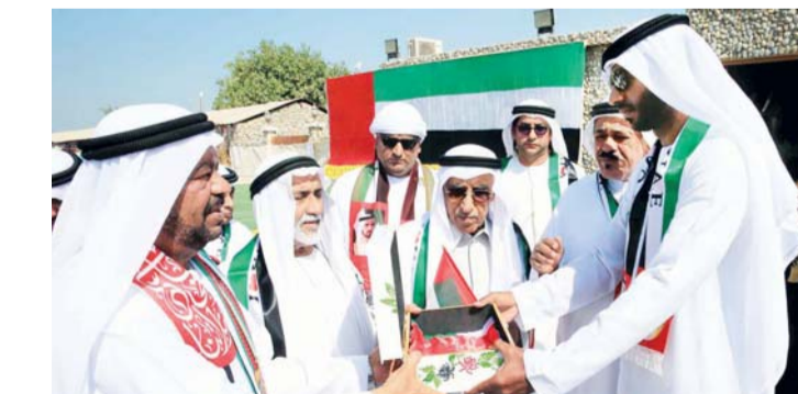
جمعية شمل تحفل بالمناسبة

إدارة المرور والدوريات، وفرع الشرطة المجتمعية بمركز شرطة المعجورة الشامل، وقسم النقل والمشاكل، وقسم الصيانة والخدمات العامة، وقسم شرطة المطار كما تم نشر الدوريات المرورية وتوزيع الأعلام على الجمهور، مع تقديم عروض فرقة