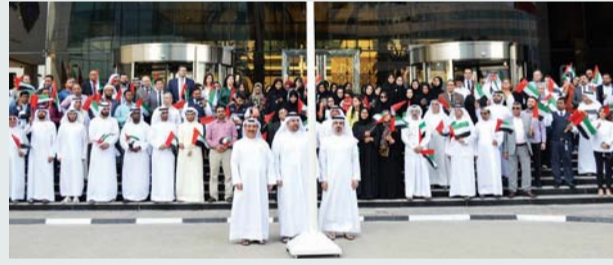
خلال احتفال سوق دبي المالي بيوم العلم