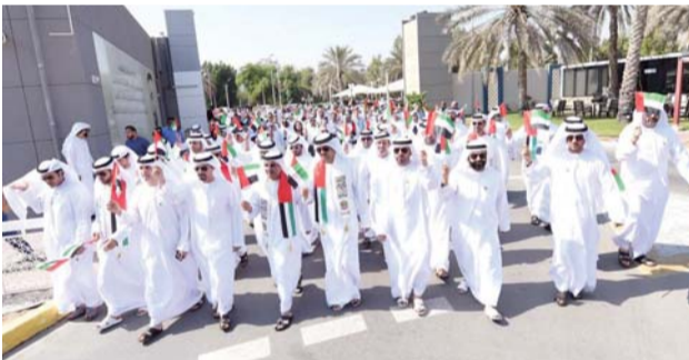
■ علي بن تميم يتوسط المشاركين في المسيرة الاحتفالية | من المصدر

الموظفين تقسم الولاء، إضافة لمتابعة عرض مصور للمشهد التاريخي لرفع العلم من قبل المغفور له الشيخ زايد بن سلطان آل نهيان وحكام الإمارات، طيب الله ثراه، على شاشة كبيرة بجانب منصة العلم. وتخلل احتفالات أبوظبي للإعلام، بث الأناشيد الوطنية وتوزيع أعلام الدولة، وفعاليات أخرى. كما احتفلت «twofour54» خارج مكاتبها في أبوظبي، بمناسبة «يوم العلم» الإماراتي، بحضور مريم عيد المهيري، الرئيس التنفيذي لهيئة المنطقية الإعلامية-أبوظبي و twofour54.