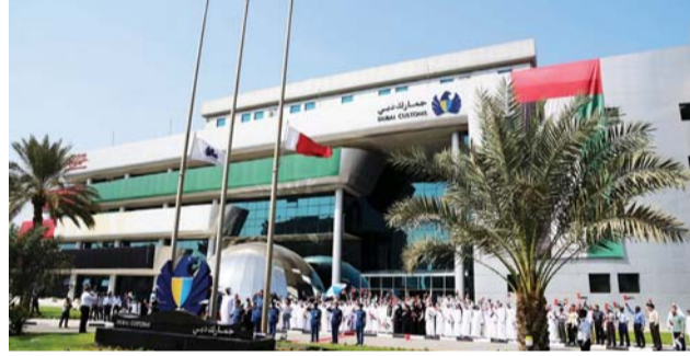
خلال احتفالات جمارك دبي