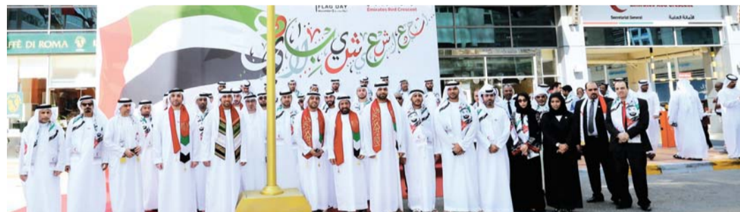
الاحتفال بيوم العلم في المقر الرئيس للهلال الأحمر

شعب الإمارات، ويعكس مشاعر الوحدة، ويعزز الشعور بالانتماء إلى الإمارات، إذ تخفق أعلام الدولة شامخة في كل أرجاء مدن الإمارات في الموعد السنوي لتعميق الانتماء إلى الوطن، ويجدد الاحتفال العزم ومضاعفة الجهود والعمل، ليبقى هذا الوطن منارة تضيء نوراً ودفناً وتقدماً وحضارة لا تعرف الحدود، مستشعرين أرواح شهدائنا الذين لبوا نداء الواجب .