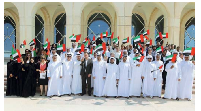
■ جانب من برامج الاحتفال