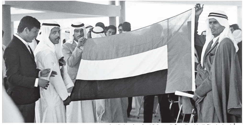
■ أول علم لدولة الإمارات العربية المتحدة قبل رفعه في دار الاتحاد بدبي

نشرت حرم صاحب السمو الشيخ محمد بن راشد آل مكتوم، نائب رئيس الدولة رئيس مجلس الوزراء حاكم دبي، رعاه الله، سمو الأميرة هيا بنت الحسين رئيسة المدينة العالمية للخدمات الإنسانية، عبر حسابها في موقع التواصل الاجتماعي «تويتر»، صورة لأول علم لدولة الإمارات العربية المتحدة قبل رفعه في دار الاتحاد بدبي.