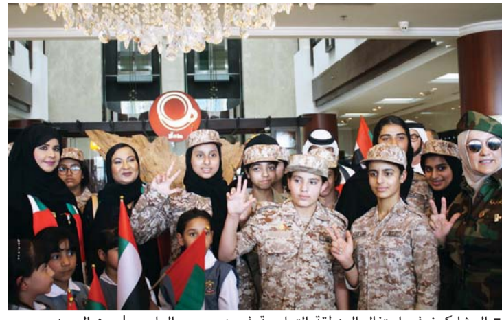
المشاركون في احتفال المنطقة التعليمية في دبي بيوم العلم

احتفلت مدارس دبي بهذه المناسبة برفع العلم إلى جانب عدد من الفعاليات الوطنية الهادفة والمحفزة على الولاء والانتماء. ودشنت الفعاليات الرئيسية بمقر المنطقة التعليمية برفع العلم وتحيته كما ردد الطلبة والطالبات النشيد الوطني. وتبجج قيمة يوم العلم من مكانة المناسبة التي