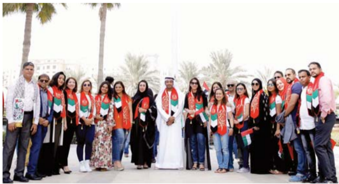
■ مشاركة واسعة من المسؤولين والمعنيين في فعاليات الاحتفال