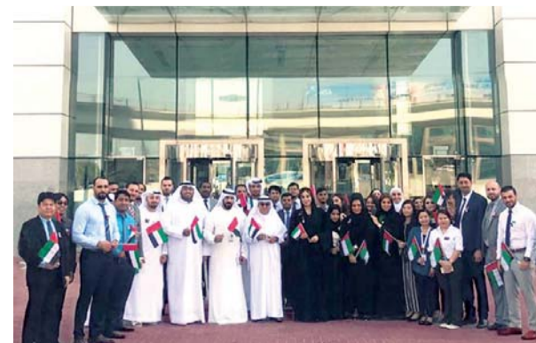
■ آفاق الإسلامية لتمويل تحتفل بيوم العلم | البيان

أمس، برفع علم دولة الإمارات، وأشار سيف الشحي عضو مجلس الإدارة المنتدب في «آفاق» إلى أن الاحتفال بالذكرى الغالية لتولي صاحب السمو الشيخ خليفة بن زايد آل نهيان، حفظه الله، مقاليد الحكم في الدولة، مناسبة عزيزة.