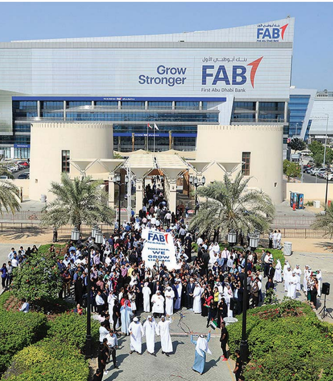
خلال الاحتفال