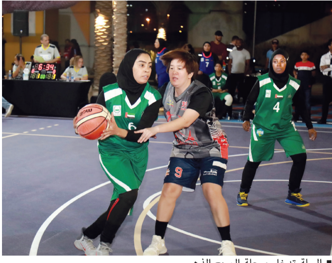
السلة تدخل مرحلة المربع الذهبي