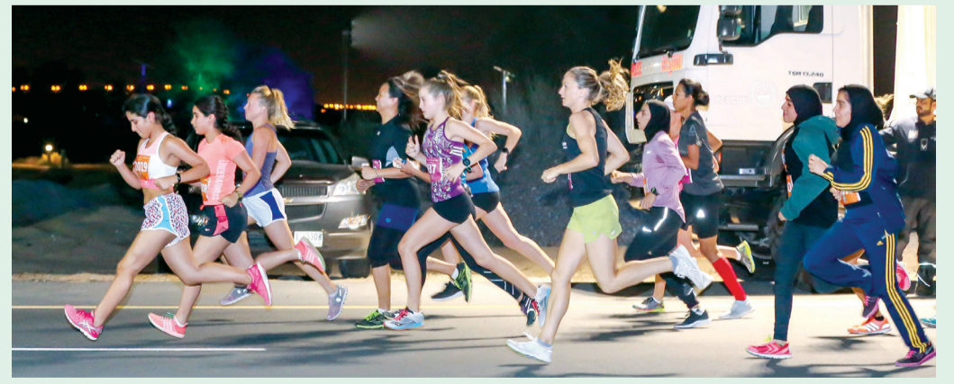
■ تنظيم جيد لسباق الجري

بحالات الإرهاق أو وعكات صحية خفيفة، مشيراً إلى أنه تم تخصيص أول من أمس، سيارة إسعاف كل 2 كلم على طول مسار السباق إضافة إلى سيارات إسعاف مستجيب متحركة مع المتسابقين للتدخل الطارئ ومسعفين على دراجات هوائية ونارية، بجانب