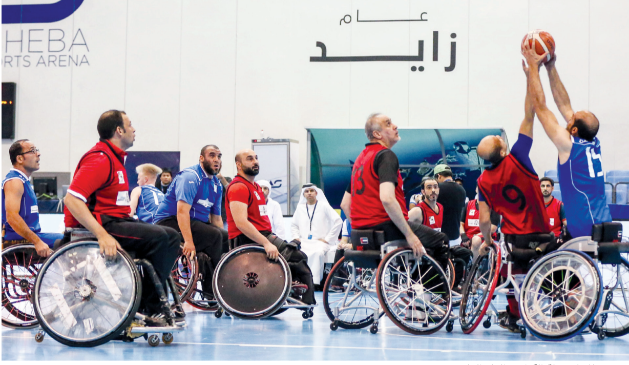
■ من منافسات سلة الكراسي العام الماضي

وأعرب ماجد العصيمي رئيس اللجنة الآسيوية البارالمبية المدير التنفيذي لنادي دبي لأصحاب الهمم عن سعادته باستمرار تواجد أصحاب الهمم بكل قوة في المنافسات بعدما اعتمد سمو الشيخ حمدان بن محمد بن راشد آل مكتوم ولي عهد دبي رئيس المجلس التنفيذي رئيس مجلس دبي الرياضي مشاركة أصحاب الهمم في الدورة بعد نسخة الأولى وكل عام تتزايد المشاركات وبات لأصحاب الهمم 4 منافسات في سلة الكراسي المتحركة وبطولة كرة القدم للإعاقة السمعية والمشاركة في فئة في سباق الجري وفي فئة الدراجات بايلد في سباق الدراجات.