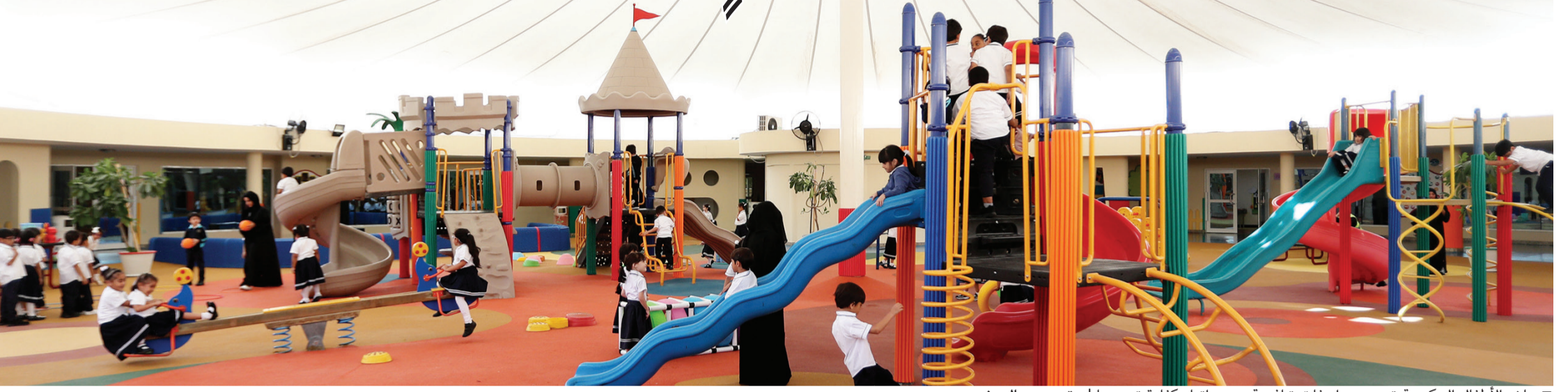
■ رياض الأطفال الحكومية تتمتع بمواصفات تنافسية بتجهيزاتها وكفاءة تدريسيها