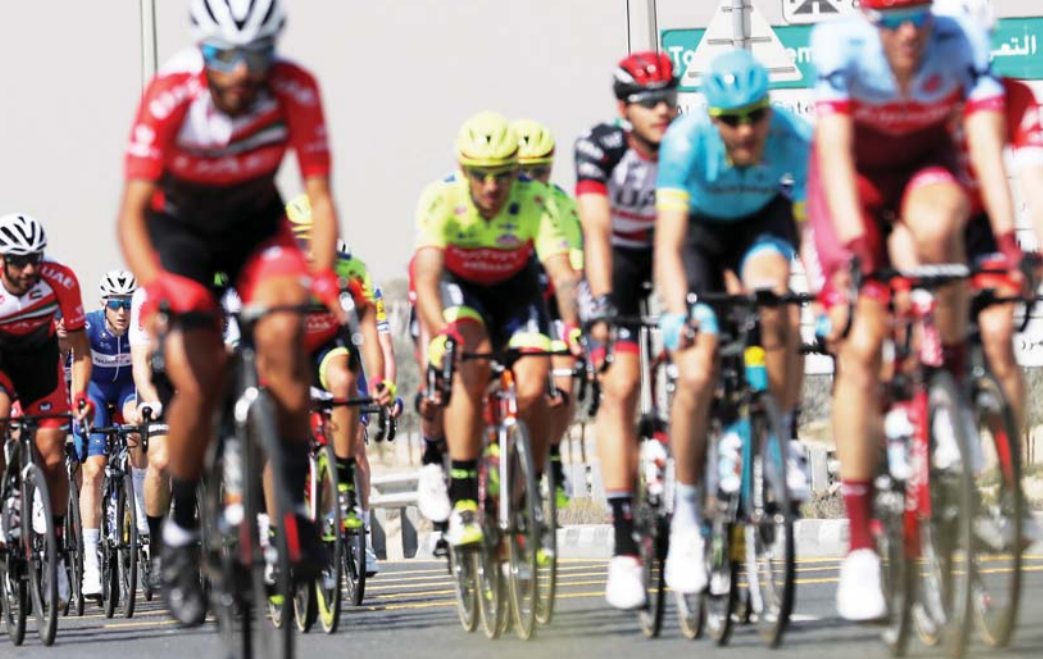
■ منافسة مثيرة بين الفرق المشاركة | البيان