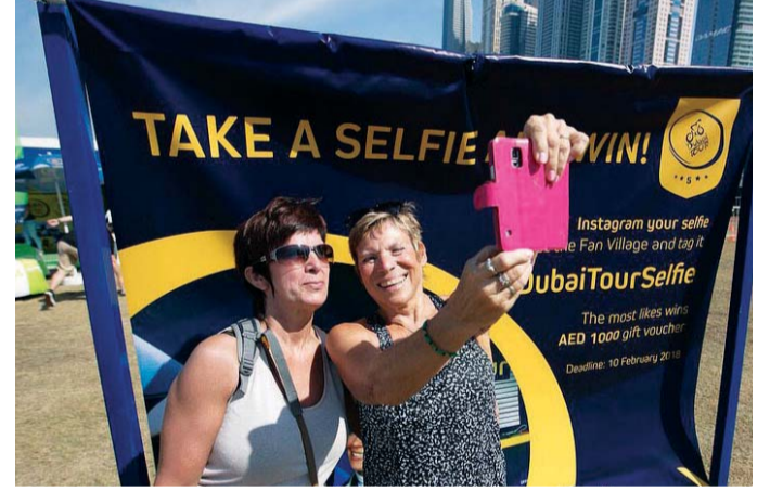
سيدتان تلتقطان صورة سيلفي

طواف دبي بالعديد من الفعاليات الترفيهية والرياضية في نادي سكاى دايف دبي حتى الختام يوم السبت المقبل. وحرصت العديد من الأسر على متابعة السباق في الصباح والاستمتاع بالأجواء الرائعة.