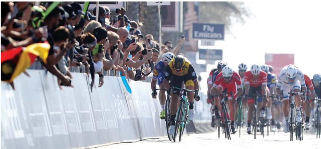
نجوم العالم يتنافسون بقوة في طواف دبي | البيان