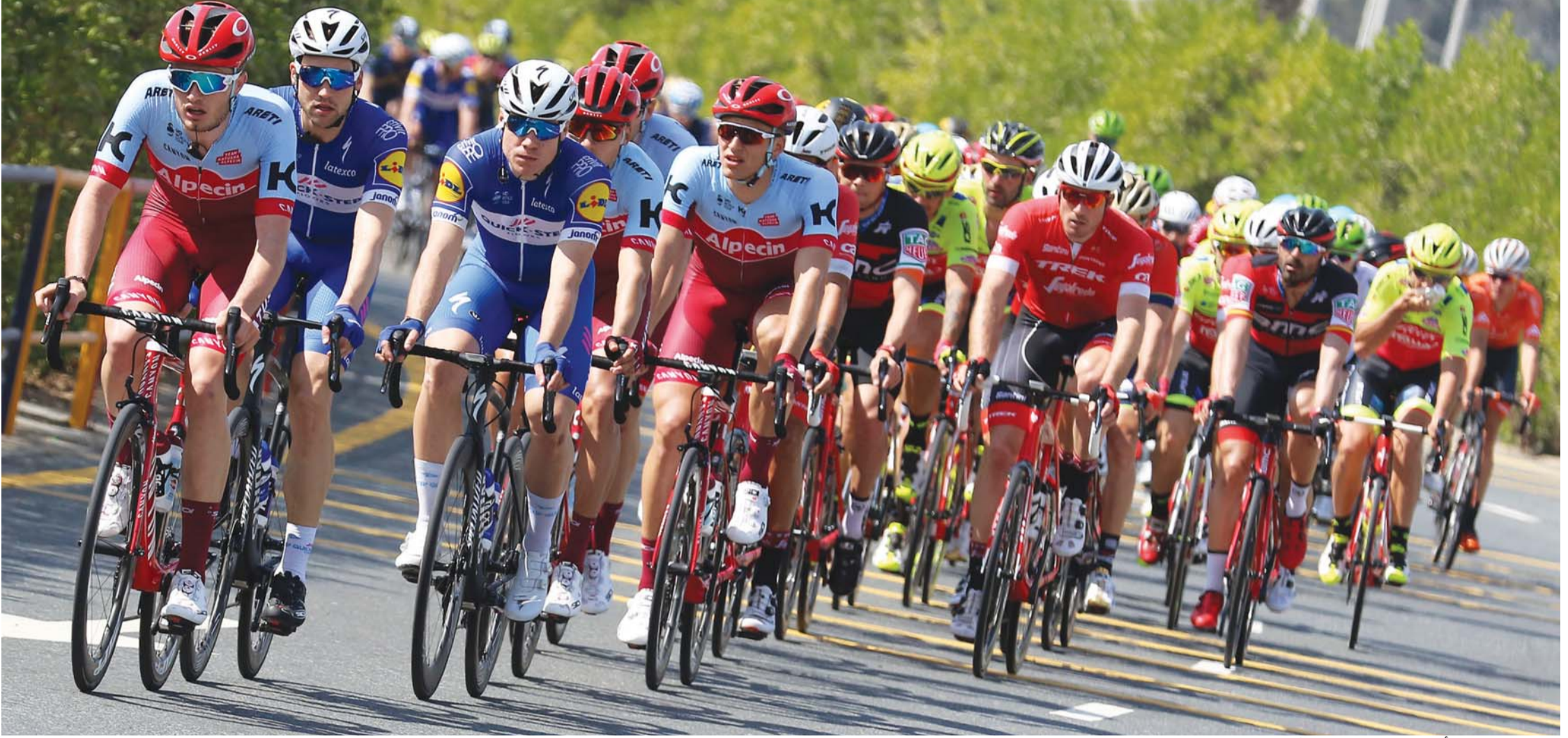
سباق المرحلة الأولى يطوف شوارع دبي | تصوير: دينيس مالاري