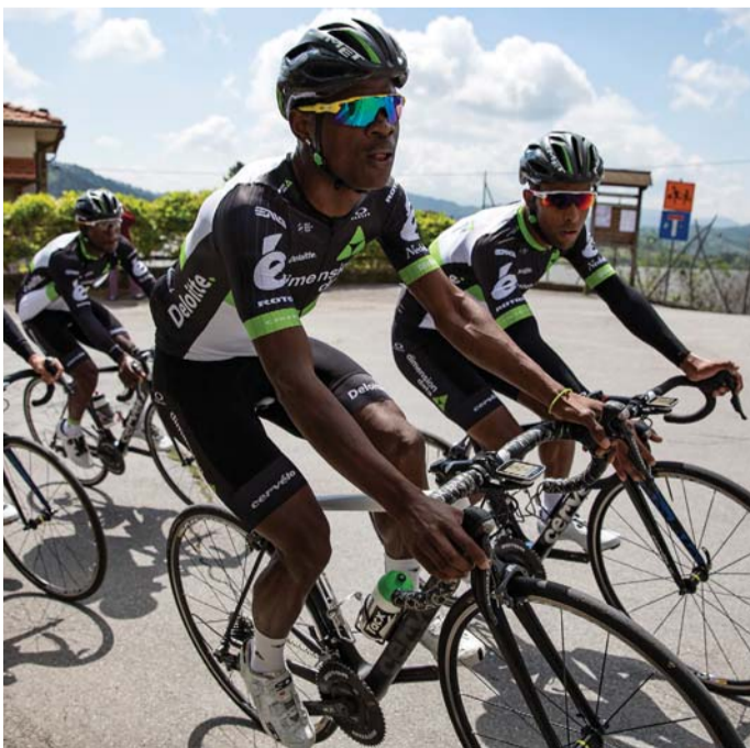
فريق دايمنتش | البيان

كيلومتراً في اليوم الأول وإذا أكملنا المسافة الكاملة سنترع بدراجة هوائية إلى مؤسسة كوبيكا الخيرية»