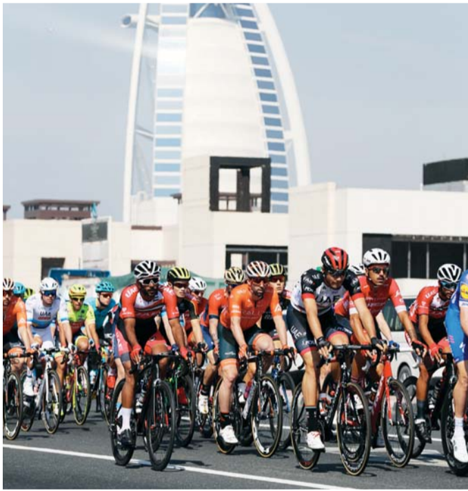
السباق يمر بجانب برج العرب

اللجنة المنظمة تبذل جهوداً كبيرة من أجل نيل ثقة الدراجين وفرقهم، موضحاً أن التنظيم المميز يفسح المجال أمام الدراجين لتقديم أفضل مستوياتهم، وهو الأمر الذي ينعكس على روعة الحدث واستمتاع الجمهور وعشاق رياضة الدراجات الهوائية في كل مكان في العالم باعتباره منقولاً تلفزيونياً إلى 180 دولة من جميع القارات.