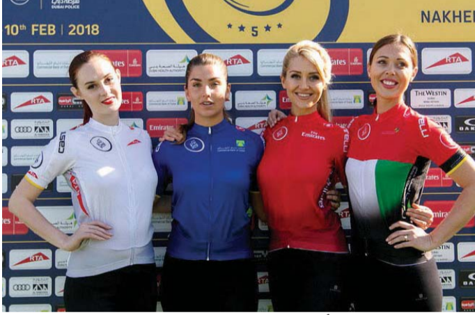
خلال عرض القمصان الأربعة | البيان

طيران الإمارات، وقميص علم الإمارات لتمتد الانطلاقات السريعة «السريرت» وترعاه هيئة الصحة في دبي، فيما يتم منح القميص الأبيض من هيئة الطرق والمواصلات في دبي لتمتد ترتيب الدراجين الشباب.