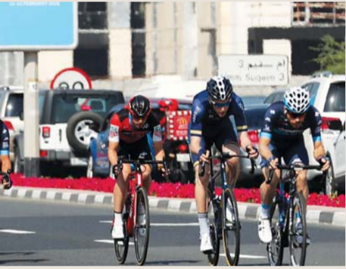
■ جانب من السباق