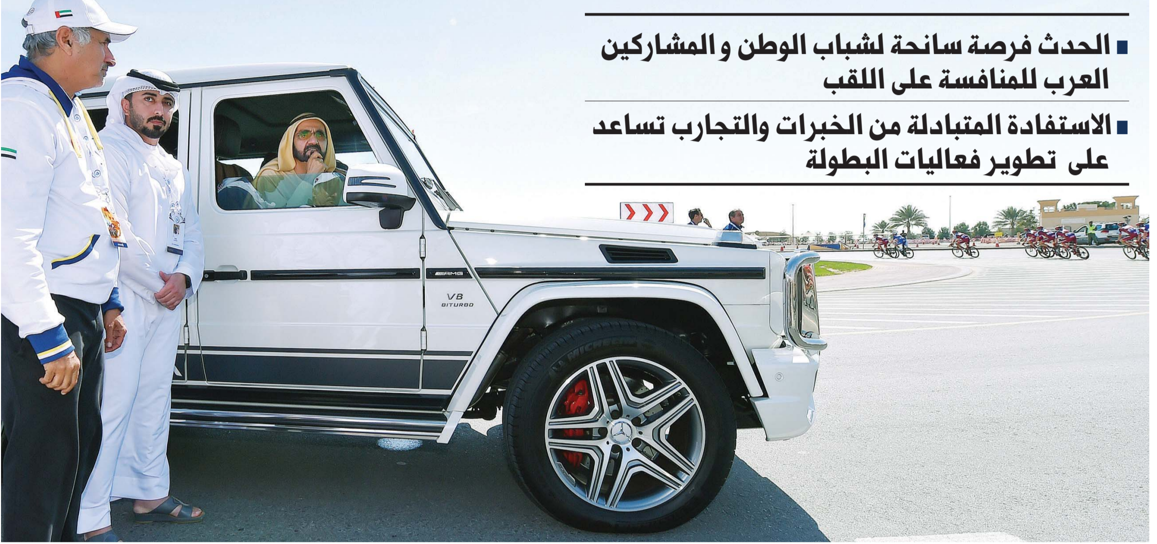
■ محمد بن راشد خلال متابعته لجانب من السباق

■ الحدث فرصة سانحة لشباب الوطن والمشاركين العرب للمنافسة على اللقب