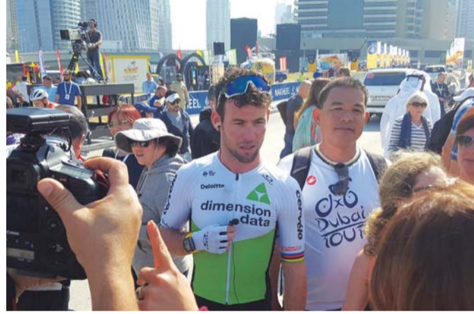
كافنديش مع الجمهور والإعلام

كافنديش الذي يشارك مع فريق دايمنتش داتا. وحرصت العديد من وسائل الإعلام المحلية والأجنبية على إجراء مقابلات تلفزيونية مع كافنديش بطل نسخة 2015.