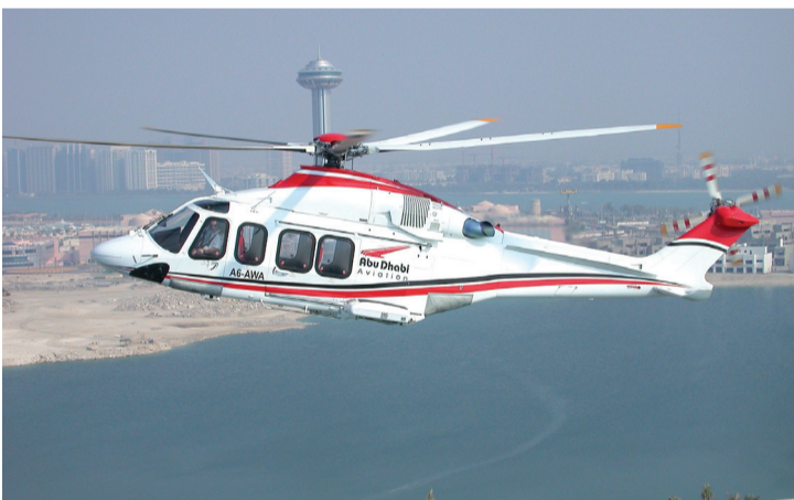
توفر الشركة خدمات مخصصة لدعم الطائرات المروحية

ويستلاند أكثر من 200 طائرة مروحية قيد الاستخدام في المنطقة اليوم، حيث تمكنت هي وشركة طيران أبوظبي في توحيد جهودهما بفضل الدمج بين خبرات الهندسة والصيانة واستعداد الشريك المحلي للاستثمار في التقنيات الحديثة.