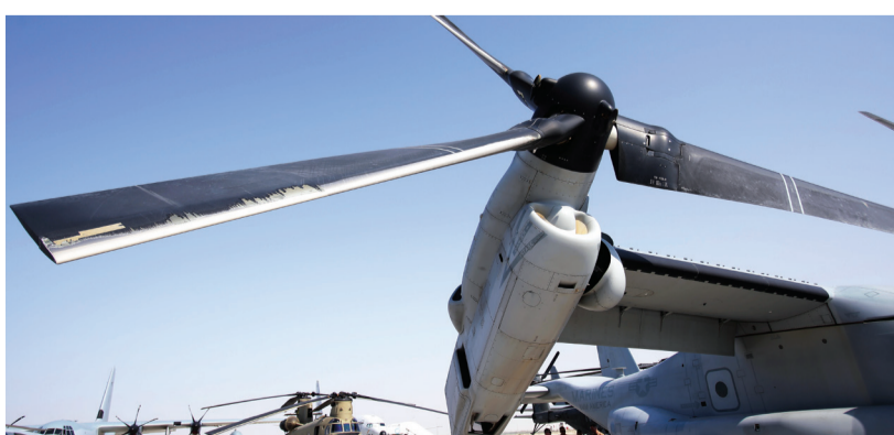
تقديم خدمات الصيانة والإصلاح