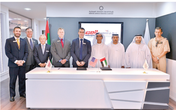
من حفل توقيع خطاب النوايا | البيان

وتوفر بيل هيليكوبتر الدعم لعملائها في مختلف أنحاء العالم، وتتمتع بأكثر شبكة دعم في العالم حيث توجد لديها 100 منشأة خدمات في 43 دولة. وقد أنت بيل هيليكوبتر في المرتبة الأولى وللعام 21 على التوالي بعد أن اختارها العملاء من خلال استبيان مجلة بروفيشنال بايلوت.