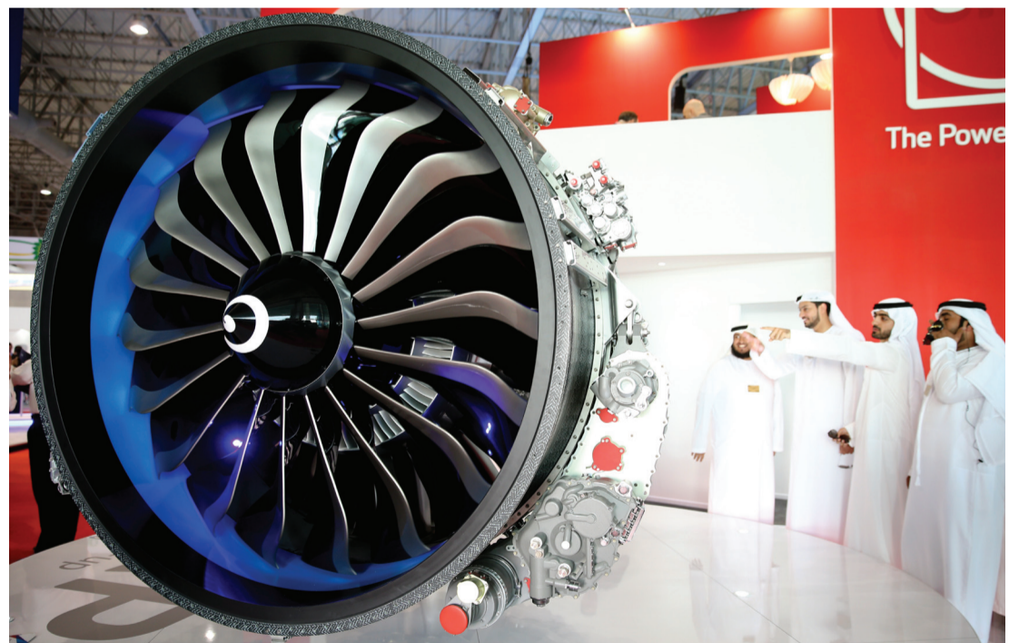
المعرض يشهد اهتماماً واسعاً

وتناول الهاشمي الجانب التنظيمي للمعرض مشيراً إلى أنه ومنذ البداية كان لدى كل فرق العمل ولجانها التي شاركت في إظهار