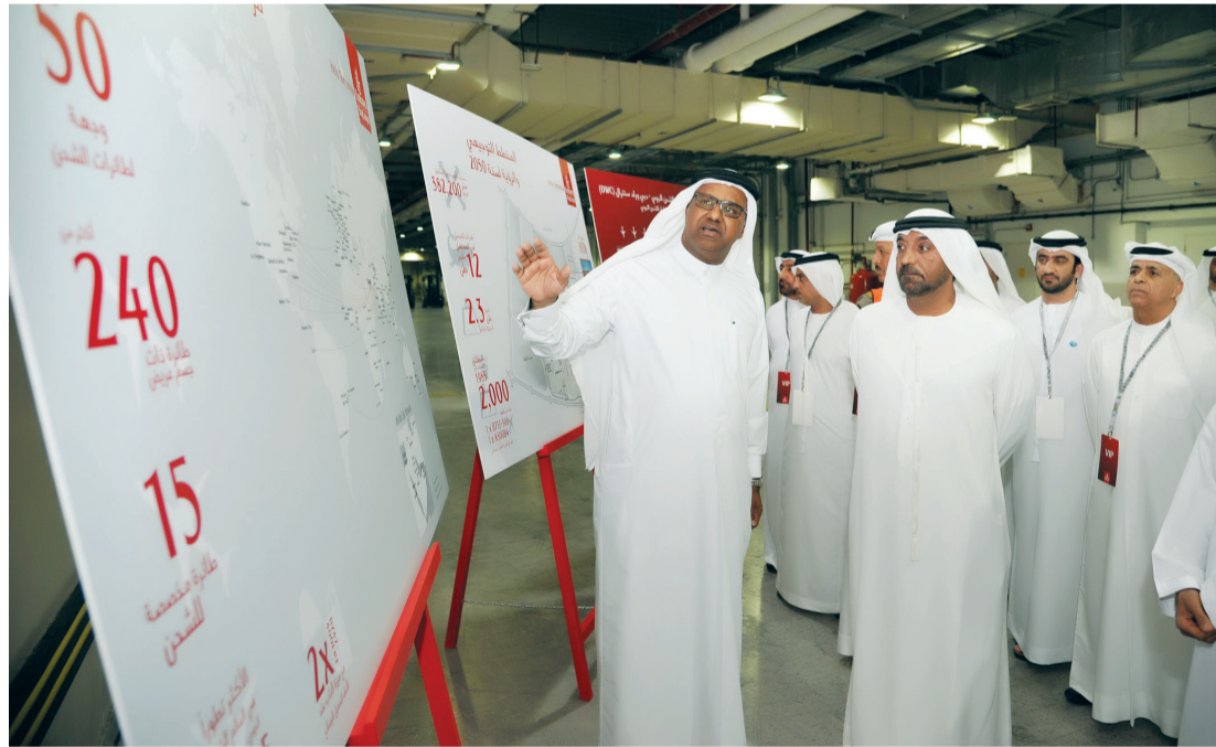
■ سموه خلال الجولة

وعلى الرغم من ضخامة حجم المنشأة الجديدة، إلا أنها لا تشغل سوى نسبة محدودة من مساحة الأراضي المخصصة للإمارات للشحن الجوي في دبي الجنوب، ما يتيح لنا آفاقاً كبيرة لتنفيذ برامج التوسعة والتطوير المستقبلية بشكل تدريجي لتعزيز طاقة مناولة الشحن لدينا وصولاً لتحقيق رؤيتنا المتمثلة في مناولة 12 مليون طن سنوياً بحلول عام 2050.