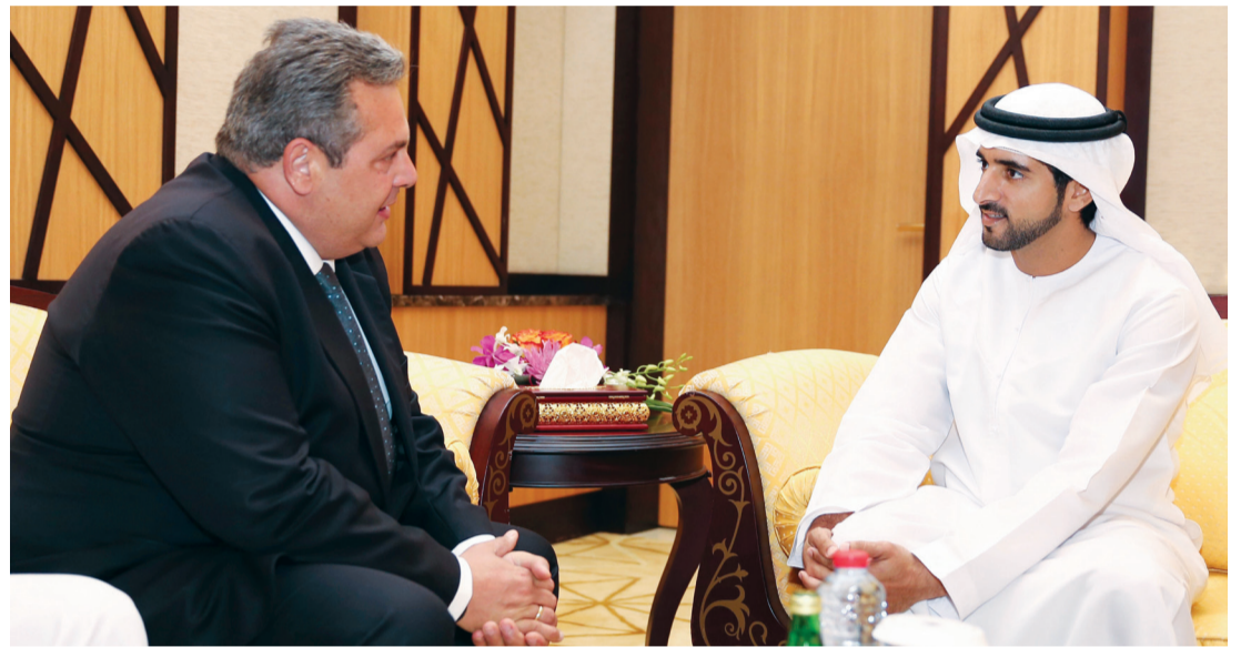
حمدان بن محمد في حديث مع وزير الدفاع اليوناني | تصوير: محمد هشام

وأشاد وزير الدفاع اليوناني بالتطور الكبير الذي تشهده دولة الإمارات في مختلف المجالات، وما أكبه من مشروعات وإنجازات نوعية أكسبت الدولة مكانة مرموقة على الصعيدين الإقليمي والدولي، مثنياً الرؤية الحكيمة وراء هذه النهضة الشاملة ضمن مختلف مساراتها.