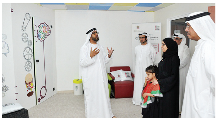
مريم الرومي خلال إطلاق الفعاليات

وأشارت الرومي إلى أن تجربة الوزارة مع موظفيها في أسبوع الابتكار كانت مشجعة وأنها لمست تفاعلاً من الموظفين في جميع الإدارات من خلال تقديم أفكارهم وابتكاراتهم التي دعا أسبوع الابتكار الإماراتي للاهتمام بها وإبرازها، مؤكدة معاليها أن الإمارات فخورة بما أنجزته مؤسسات الدولة في هذا الأسبوع، والذي جاء بتوجيهات من صاحب السمو الشيخ خليفة بن زايد آل نهيان رئيس الدولة، حفظه الله، وأخيه صاحب السمو الشيخ محمد بن راشد آل مكتوم نائب رئيس الدولة رئيس مجلس الوزراء حاكم دبي، رعاه الله.