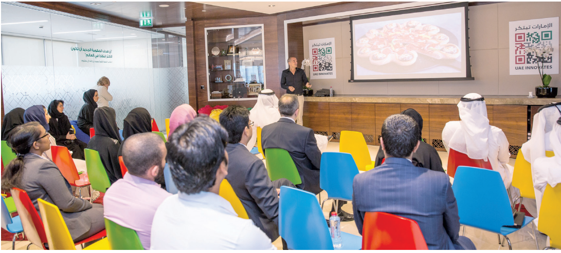
■ جانب من ورش العمل

الحكومي لتكون الإمارة مركز ابتكار عالمياً يحتذى به.