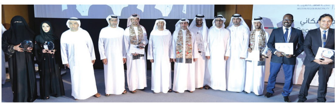
المكرمون في جوائز الابتكار الجيومكاني