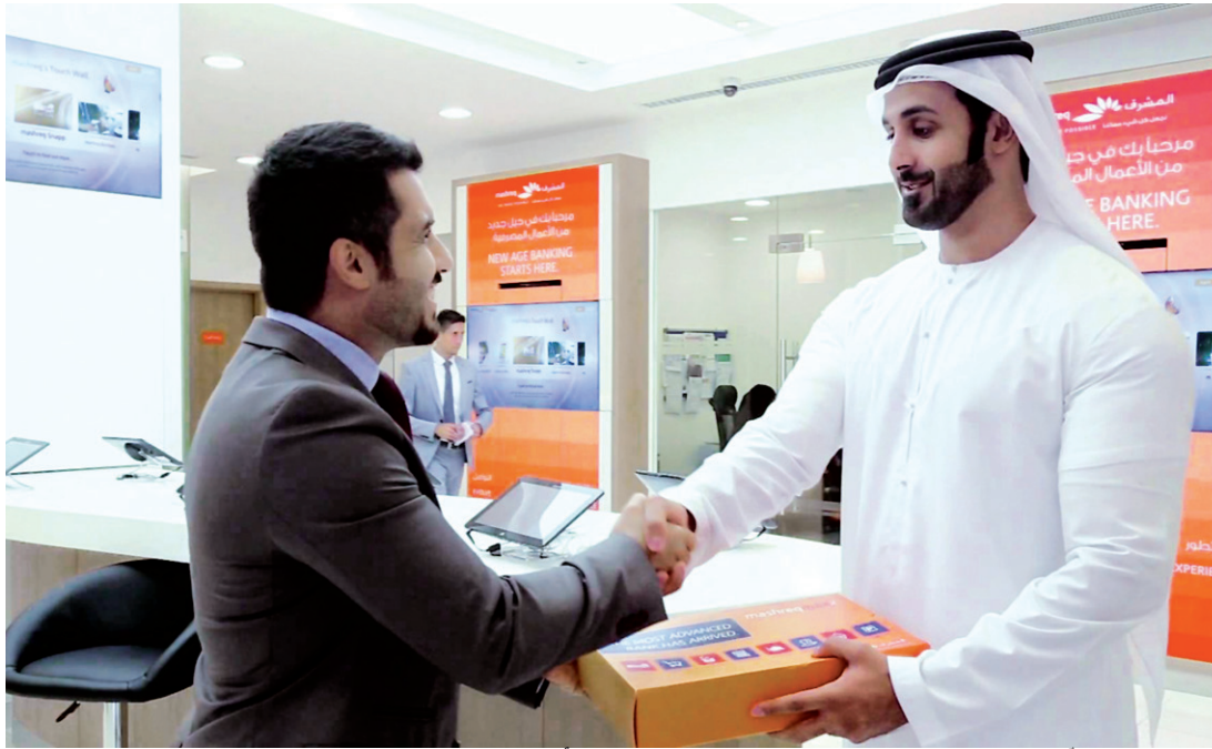
الابتكارات سلّمت عملاء البنوك دفعة قيادة تعاملاتهم المصرفية | أرشيفية