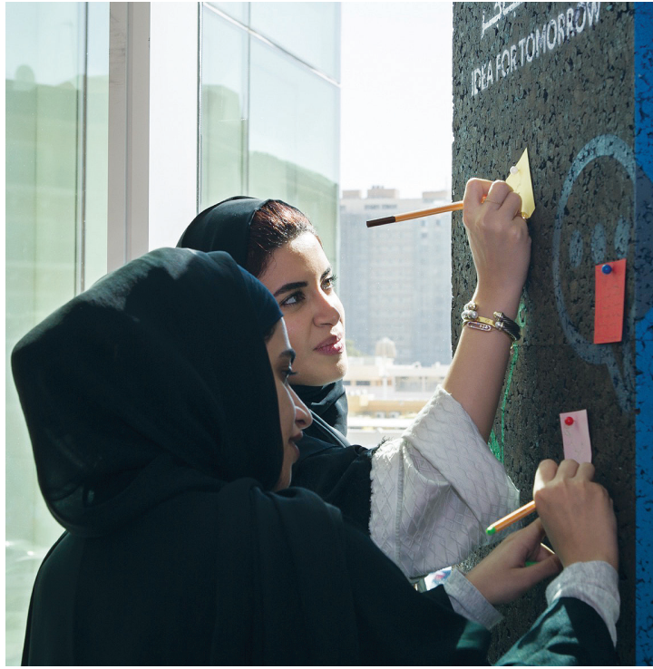
الهيئة تعمل على تحسين مهارات منتسبيها الابتكارية