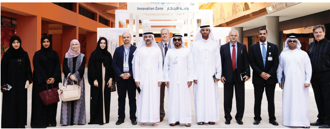
وفد الهيئة العامة للطيران المدني خلال زيارة «مصدر» | البيان

للطيران المدني كانت قد أطلقت استراتيجية الابتكار في الطيران المدني خلال شهر يونيو الماضي بحضور معالي المهندس سلطان بن سعيد المنصوري، وزير الاقتصاد ورئيس مجلس إدارة الهيئة العامة للطيران المدني، وسيف محمد السويدي، مدير عام الهيئة العامة للطيران المدني، ومديري القطاعات في الهيئة وفي قطاع الطيران المدني المحلي. وتم إطلاق استراتيجية الابتكار في الطيران المدني تماشياً مع الخطة الاتحادية لتعزيز الابتكار في كافة قطاعات الدولة وتمكين الإمارات من الحصول على المركز الأول عالمياً في مؤشر الابتكار الدولي خلال الأعوام المقبلة.