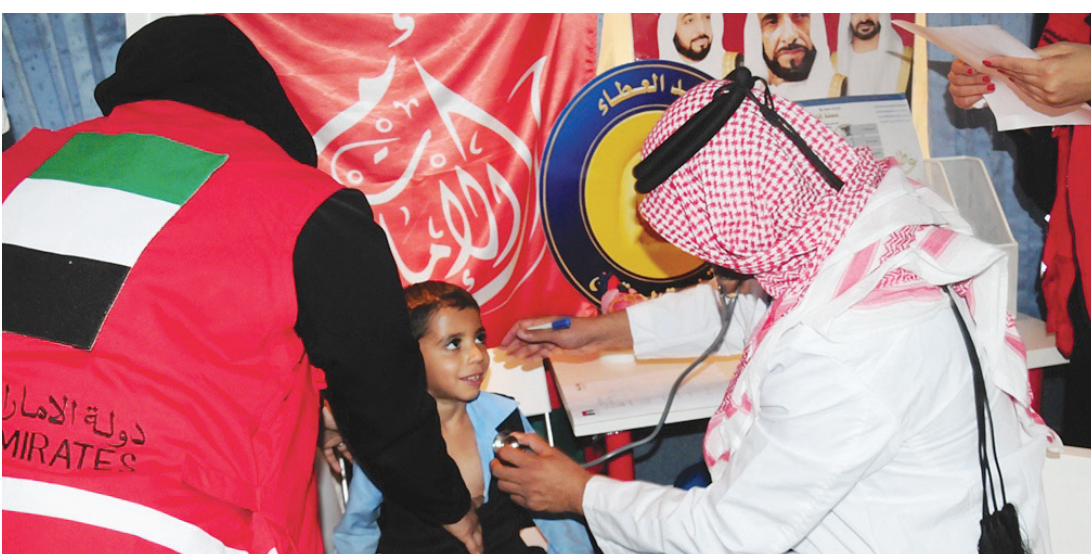
■ الابتكار ركيزة العطاء الإنساني للدولة | من المصدر