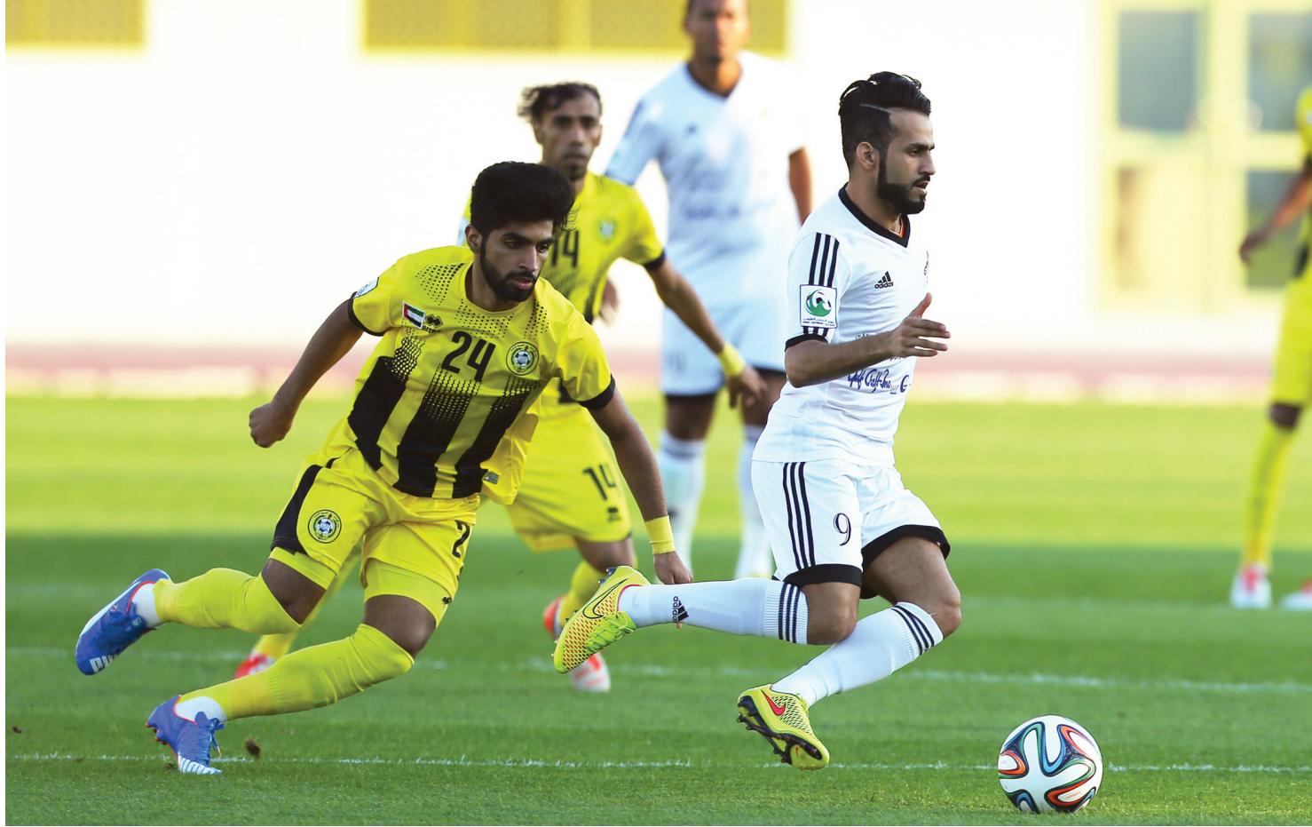
أندية الأولى تصدر برامج المرشحين | البيان