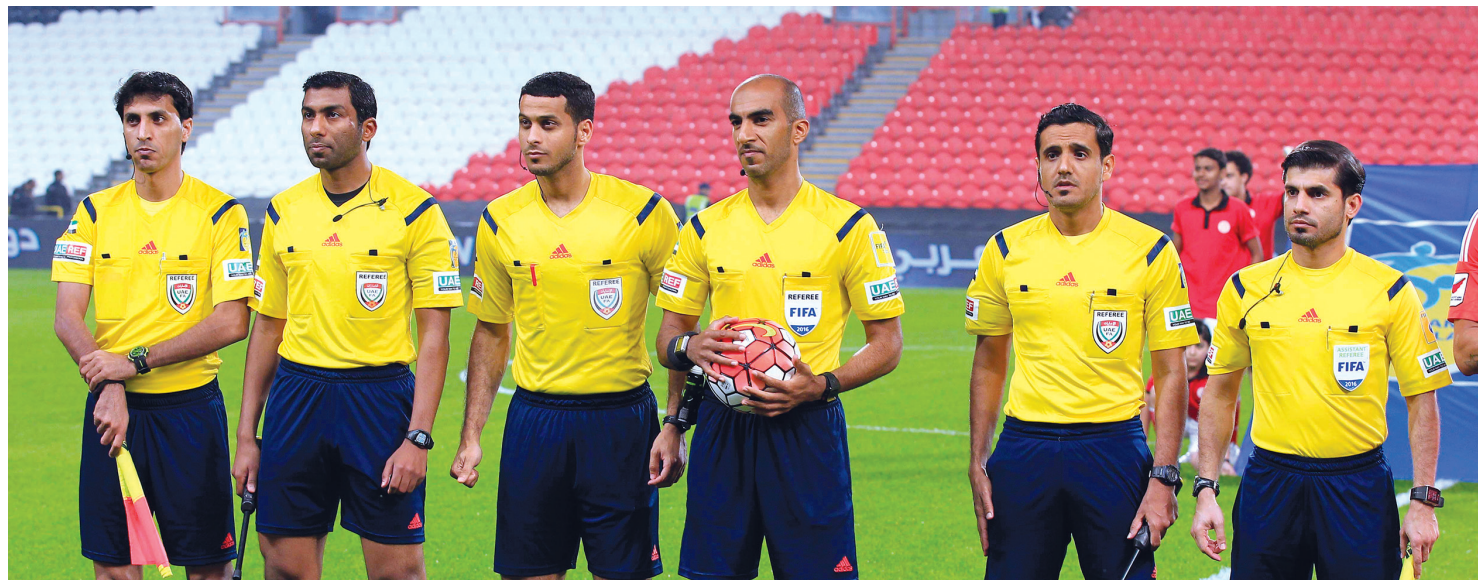
وعود بتطوير التحكيم | البيان