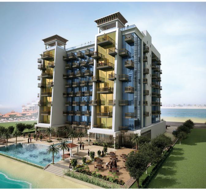
■ «سنترال» جزيرة النخلة بتصميمه العصري

للضيوف من رجال الأعمال والمسافرين بغرض العمل وذلك بفضل إطلالاته الخلابة على قناة دبي المائية و برج خليفة. إضافة لذلك، حرصنا على أن يكون لكلا الفندقين تصميم ذكي يجعلهما ملائمين للبيئة من خلال اتباع نهج يعتمد على الابتعاد عن استخدام الورق.