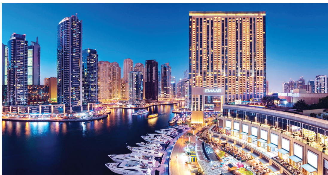
«إعمار للضيافة» تعمل على ترسيخ مكانتها ورسم ملامح جديدة للقطاع | من المصدر

وأضاف: تشهد منطقة الشرق الأوسط وشمال أفريقيا تركزاً متنامياً على تنوع الموارد الاقتصادية، مع التركيز بشكل خاص على قطاعي الضيافة والسياحة كمحاور رئيسية للرؤى الاستراتيجية الحكومية. فعلى سبيل المثال، شددت رؤية الإمارات 2021 ورؤية السعودية 2030 على الدور الجوهري لقطاع الضيافة في توفير فرص العمل وتعزيز الإيرادات غير النفطية وبدورها فإننا نتطلع إلى دعم النمو المتواصل لقطاع السياحة في الشرق الأوسط الذي بلغت نسبته 5% في 2017 عبر تعزيز البنى التحتية للقطاع ومنح الزوار