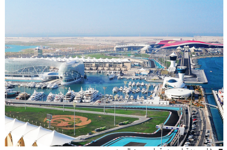
مشاريع عدة في جزيرة ياس

تستعرض شركة «ميرال» جميع مشاريعها الحالية والمستقبلية على جزيرة ياس، وذلك خلال مشاركتها في معرض «سوق السفر العربي 2018». وينطوي 2018 على أهمية كبيرة بالنسبة للشركة، حيث يتزامن مع احتفال جزيرة ياس بمرور 10 سنوات على إنشائها، وافتتاح المدينة الترفيهية التي طال انتظارها عالم وارن برادز أبوظبي في 25 يوليو 2018، وهي أول مدينة ترفيهية مغلقة في العالم تحمل