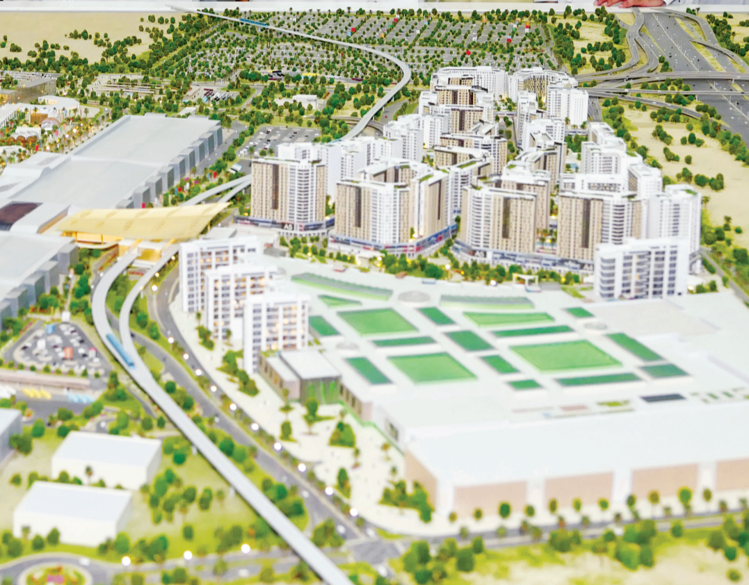
مكتوم بن محمد يستمع إلى شرح من نجيب العلي عن إكسبو دبي بحضور هلال المري وجمال الحاي | تصوير: خليفة اليوسف