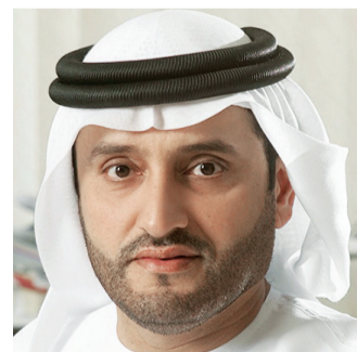
■ علي المدفع

رحلات جديدة من الشارقة إلى حيدر أباد ولوكنو.