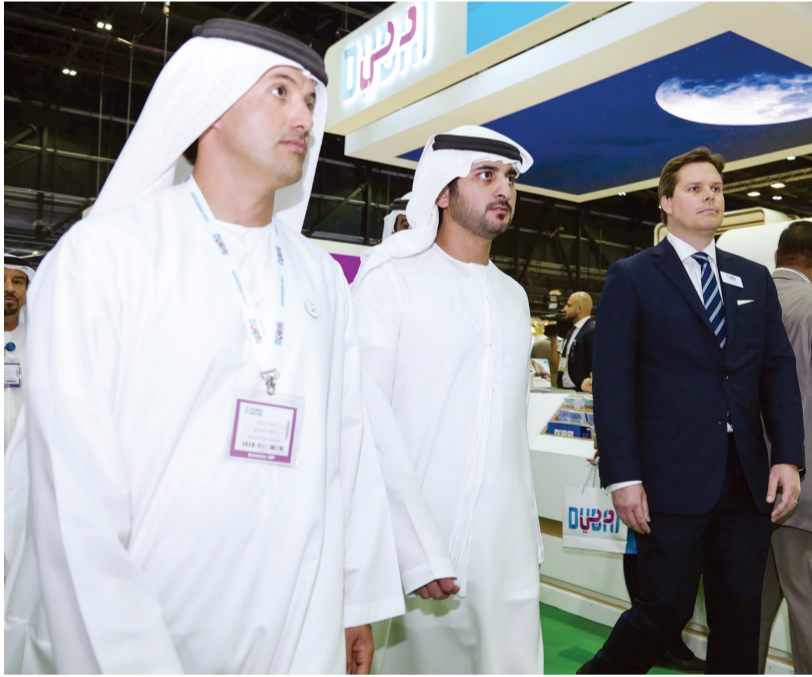
مكتوم بن محمد وهلال المري خلال الجولة

خدمة ومنتجاً سياحياً، كما زار سموه جناح مركز جامع الشيخ زايد واستمع من خلال أحد أخصائيي الجولات الثقافية إلى بديع فون العمارة الإسلامية التي تجلت بوضوح في الصرح، إضافة إلى التعرف إلى أنشطة المركز المختلفة.