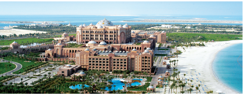
فندق قصر الإمارات يوفر خدمات نوعية مميزة | من المصدر

ومن خلال إدراكه العميق لكافة التغييرات الطارئة على السوق، يسعى «قصر الإمارات» إلى تجسيد الأصالة المتميزة، من خلال توفير المزيد من العروض الجاذبة للضيوف، بما في ذلك مفاهيم مبتكرة لتناول الطعام، عرض الأحداث الرياضية ذات المستوى العالمي، جنباً إلى جنب مع إبراز المعالم الإماراتية الثقافية الأصيلة والتي تتكامل مع اللمسة الفاخرة لمجموعة كيميونسي.