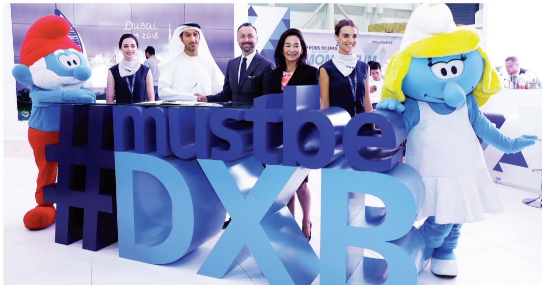
■ عقب توقيع اتفاق الشراكة

وأوضح أن الفترة الماضية لم تعكس الأداء الحقيقي نظراً لعدم اكتمال جميع المرافق باعتبار المشروع ما زال جديداً نسبياً، إضافة إلى حداثة مفهوم الحدائق والوجهات الترفيهية بشكل عام في المنطقة، مؤكداً أن التركيز خلال الفترة