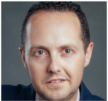
■ براين سعيد

إنفاق توقعت بيانات صادرة عن مجلس السفر والسياحة العالمي أن ينفق سكان الإمارات خلال العام الماضي نحو 87,6 مليار درهم على السفر للخارج مقارنة مع 85,2 مليار درهم العام الماضي بنمو 2,8%. وتوقع أن ينفق سكان الدولة على السياحة الداخلية العام الجاري نحو 40,4 مليار درهم بنمو 1,9% مقارنة بالعام الماضي، على أن ينمو بمعدل 3,1% سنوياً ليصل إلى 54,9 مليار درهم بحلول 2028.