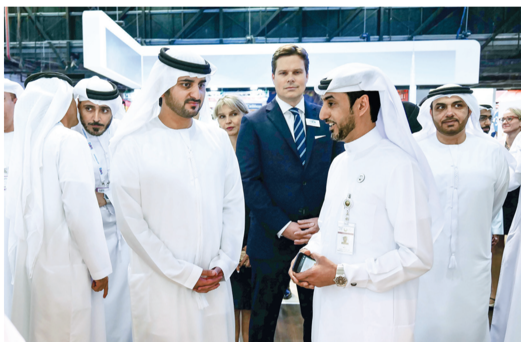
سموه يتعرف إلى مشاريع الشركات

التجاري مروراً بأجنحة القيادة العامة لشرطة دبي والإدارة العامة للإقامة وشؤون الأجانب في دبي وشركة الاتحاد للطيران وهيئات أوبطي السياحة وبلدية دبي والجناب الأردني وجناب دولة الكويت وجناب مملكة البحرين ثم جناح سلطنة عُمان. وعرج سموه كذلك على جناح «فلاي دبي» ومطارات دبي وجناح «إكسبو دبي 2020» و«دبي باركس أنديزورترس». وزار سمو الشيخ مكتوم بن محمد بن راشد آل مكتوم، جناح طيران الإمارات، الناقل الرسمي لمعرض سوق السفر العربي (الملتقى 2018)، حيث كان في استقبال سموه، الشيخ ماجد المعلا نائب رئيس أول طيران الإمارات لدائرة العمليات التجارية، الذي اصطحب سموه في جولة تعريفية على جناح الناقل الذي يتضمن جناح الدرجة الأولى المغلق بالكامل ومقصورة درجة رجال الأعمال على طائرة البوينغ 777 بطلتها الجديدة والصالون الجوي الجديد على طائرة الإيرباص A380 وهذه هي أول مرة تعرض فيها طيران الإمارات الأجنحة الخاصة لطائراتها البوينغ 777-300ER في معرض سوق السفر العربي. وتوقف سموه عند جناح إمارات عجمان والشارقة والفجيرة وجناح المملكة العربية السعودية الذي