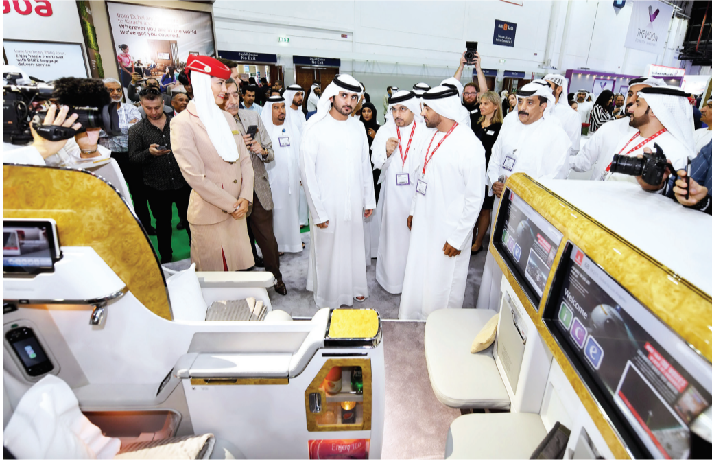
سموه خلال زيارة جناح طيران الإمارات