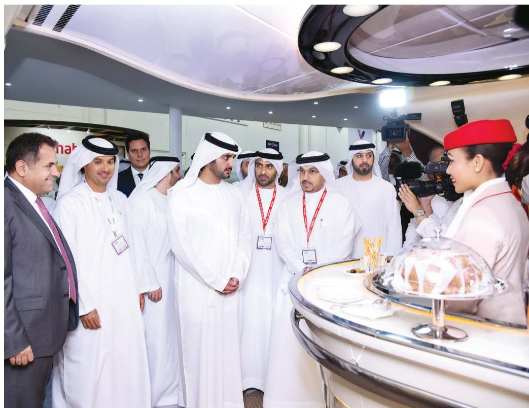
مكتوم بن محمد يستمع إلى شرح من ماجد المعلا خلال الجولة بحضور هلال المري