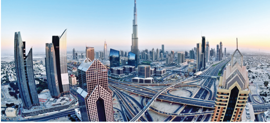
■ دبي تتمتع بمقومات سياحية متفردة | البيان

يقدم التقرير معلومات شاملة مع التقييم والتحليل لمحرك النمو التي أسهمت في تحقيق أرقام قياسية جديدة في أعداد الزوار الدوليين خلال 2017، والذين بلغ عددهم 15,8 مليون زائر، بنسبة نمو وصلت إلى 6,2% بالمقارنة مع عام 2016. كما يوفر التقرير تحليلاً شاملاً عن الزوار وفقاً للمناطق الجغرافية التي أتوا منها إلى دبي، والأسباب التي دعتهم إلى زيارتها وكيف قضوا أوقاتهم فيها، فضلاً عن المسح السنوي الميداني الخاص بزوار دبي، الذي يوضح مدى رضاهم عن التجربة.