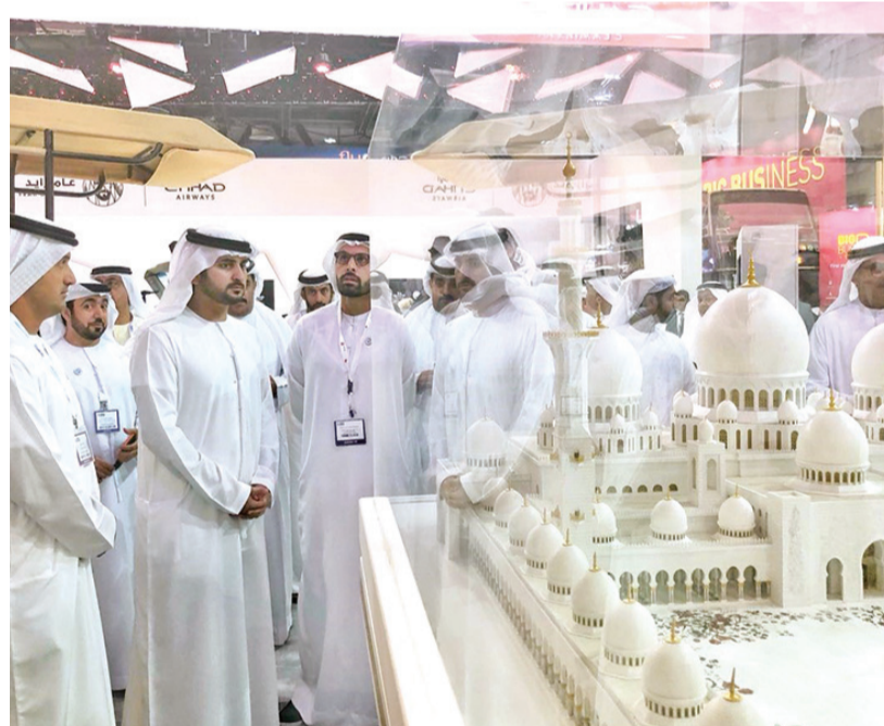
مكتوم بن محمد أمام مجسم لمسجد الشيخ زايد

وتجول سمو الشيخ مكتوم بن محمد بن راشد آل