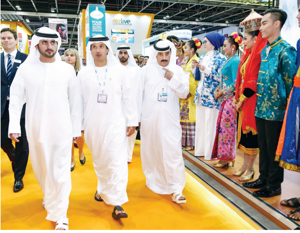
سموه خلال جولة بين أجنحة المعرض