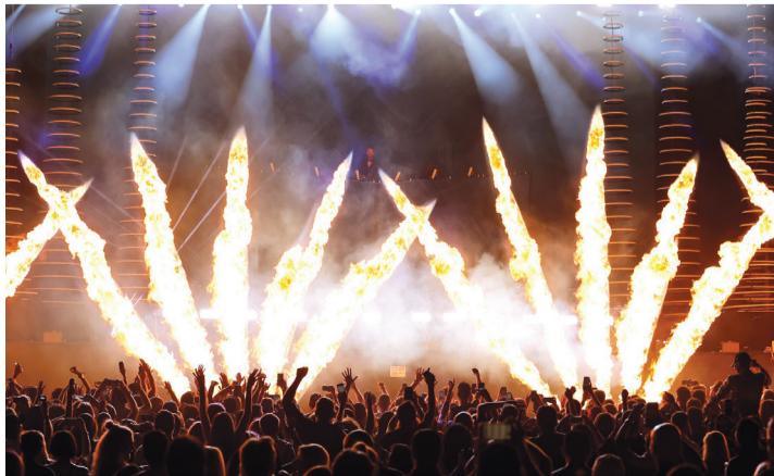
■ كالفن هاريس يلهب حماس الجمهور في أبوظبي خلال أولى حفلات ياسلام | البيان

ومن ألمع النجوم إلى نجوم المستقبل، حيث شهدت العاصمة سطوع أقوى المواهب الموسيقية المستقبلية من جميع أنحاء المنطقة، وذلك مع ختام منافسات الدورة الثالثة من مسابقة المواهب الناشئة على مسرح «ذا فيلدج» في ميدان دو. وتنافس المشتركون الأربعة الذين وصلوا إلى المرحلة النهائية من المسابقة قبل بدء حفلات ما بعد السباق، وأعلنوا عن موهبتهم الغنائية على مسرح «ذا فيلدج» للمرة الأخيرة قبل إعلان الفائز من قبل لجنة التحكيم. تأهل للتصفيات النهائية أمان شريف