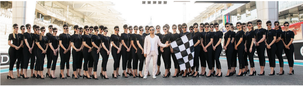
مضيفات «الاتحاد للطيران» في الزي الجديد ويتوسطهن مصمم الأزياء | البيان

غمار صناعة الأزياء هي حقاً كسر مبتكر للتقاليد. وبدورنا، أردنا تحدي السائد حول الأزياء التقليدية لفتيات حلبة السباق. ومن خلال التعاون الوثيق تمكنا وبشكل فخر من ابتكار بزة بأكتاف عريضة يتخللها تصميمنا الهندسي المميز - وهي حركة غير اعتيادية إلى حد ما، لكنها تبقى أنثوية وقوية».