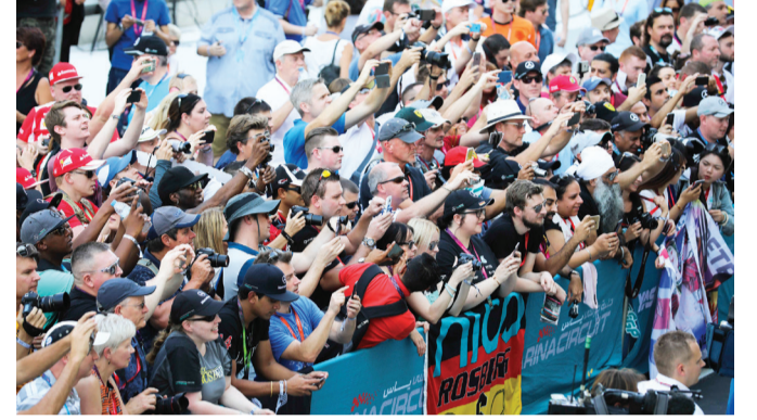
■ فورمولا 2 البداية للانطلاق والوصول إلى عالم الشهرة | البيان

العالم للفورمولا 1. ويعد الفرنسي تشارلز لوكلير، البطل الذي ينتظر تويجه بلقب 2017، فقد شارك سائق فيراري الناشئ في العديد من جلسات التجارب الحرة، ومن المتوقع أن يشارك كسائق في موسم 2018 من بطولة العالم للفورمولا 1 مع فريق ساوبر.