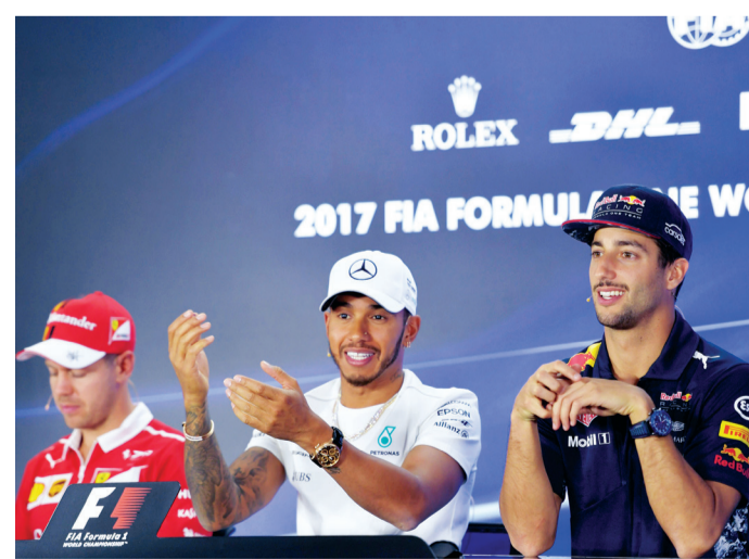
هاميلتون وفيتيل وريتشاردو خلال المؤتمر الصحفي

النهاية الأمر لن يكون سيئاً. ومازحاً قال الأسترالي دانييل ريتشاردو، الذي جلس بجوار بطلي العالم أربع مرات إنه سيحاول منح خوذته شكلاً مميزاً في سباق الأحد. وأضاف سائق رد بول «هي (الخوذة) سيكون من الصعب رؤيتها بالتأكيد في العام المقبل. لا أعتقد أن الأمر سيكون درامياً مثل حديث أغلب الجماهير. سيكون مقبولاً».