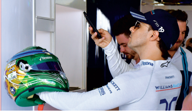
■ فيليبي ماسا

لاستمتاع بكل لحظة منه» وكان ماسا قد أعلن اعتزاله نهاية 2016، وتلقى حينها وداعاً يليق بالملك، ولكنه تراجع بعد ضغط من فريقه لحين اكتساب بديل لانس ستروال الخبرة الكافية، يعلن عودته ثم يعيد إعلان اعتزاله بنهاية سباق الاتحاد للطيران.