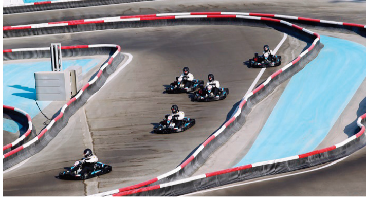
■ من سباقات الكارتينغ في «كارت زون» | أرشيفية

مرافق التدريب وتغيير الملابس المطورة والمجددة بشكل كامل. ويمكن للآلاف من زوار حلبة ياس اختبار مركبة الكارتينغ لتطويع مهاراتهم في القيادة. وأعيد افتتاح مسار الكارتينغ للبالغين والصغار من عمر 8 أعوام أو أكثر طيلة أيام الأسبوع.