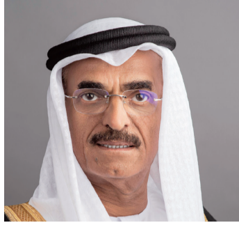
عبد الله النعيمي

وأكد معالي الدكتور المهندس عبد الله بلحيف النعيمي، وزير البنية التحتية ورئيس مجلس إدارة الهيئة الاتحادية للمواصلات البرية والبحرية، أن المرأة الإماراتية أثبتت مكانة مهمة وسعة راقية على مختلف الصعد والمستويات المحلية والعالمية، حيث جاء ذلك بفضل دعم المغفور له الشيخ زايد بن سلطان آل نهيان، طيب الله ثراه، الذي مكن المرأة في مسيرة البناء والتنمية، ودعم القيادة الرشيدة وبرؤية حكيمه من صاحب السمو الشيخ خليفة بن زايد آل نهيان، رئيس الدولة، حفظه الله، وأخيه صاحب السمو الشيخ محمد بن راشد آل مكتوم، نائب رئيس الدولة رئيس مجلس الوزراء حاكم دبي، رعاه الله، وصاحب السمو الشيخ محمد بن زايد آل نهيان، ولي عهد أبوظبي نائب القائد الأعلى للقوات المسلحة، وإخوانهم أصحاب السمو حكام الإمارات، ووجود دولتنا العزيزة التي حرصت منذ تأسيسها على تهيئة بيئة داعمة للمرأة لتكون