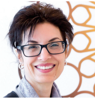
حياة شمس الدين