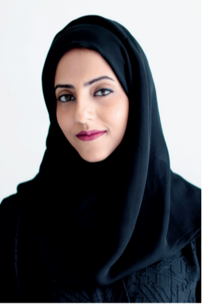
■ جواهر بنت عبدالله القاسمي

قال سيف سعيد غياش وكيل دائرة الثقافة والسياحة - أبوظبي: منذ تأسيس دولة الإمارات العربية المتحدة بقيادة المغفور له الشيخ زايد بن سلطان آل نهيان، طيب الله ثراه، كانت وما زالت، عملية البناء والتطوير بقدرات مشتركة بين الرجل والمرأة، وتعزز ذلك من خلال الإنجازات المهمة التي قامت بها سمو الشيخة فاطمة بنت مبارك «أم الإمارات»، رئيسة الاتحاد النسائي العام رئيسة المجلس الأعلى للأمومة والطفولة الرئيس الأعلى لمؤسسة التنمية الأسرية، التي دعمت المرأة في كافة