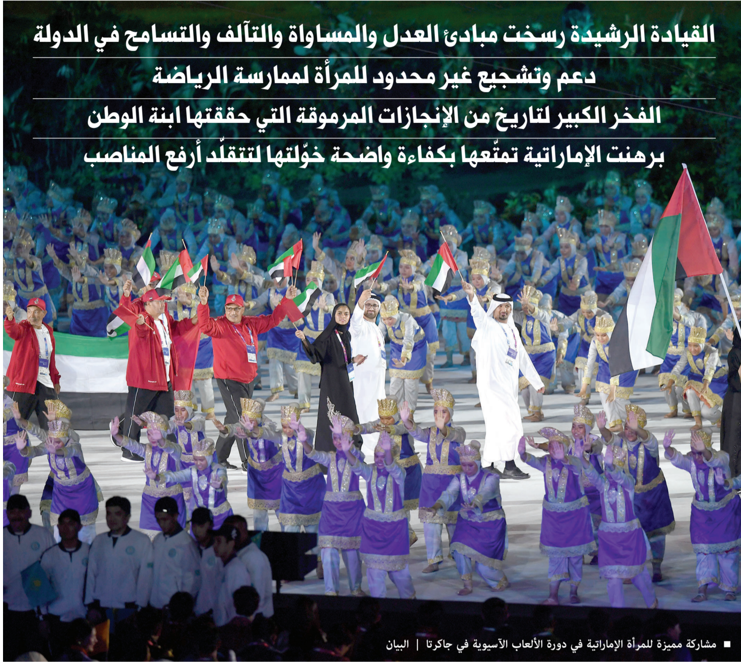
■ مشاركة مميزة للمرأة الإماراتية في دورة الألعاب الآسيوية في جاكرتا | البيان