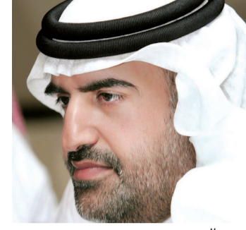
■ جمال بن حويرب

وبهذه المناسبة، رفع بن حويرب أسمى آيات الشكر والتقدير إلى سمو الشيخة فاطمة بنت مبارك، وعلق قائلاً: «أم الإمارات كانت وما زالت قدوة لكل امرأة إماراتية، فقد وقفت سموها إلى جانب الوالد المؤسس خلال فترة تأسيس الدولة متمسكةً بالإيمان والتسامح والإيجابية؛ فكانت له عوناً وسنداً، لتستمر على العهد من خلال دعم المرأة لتصل بها إلى آفاق غير