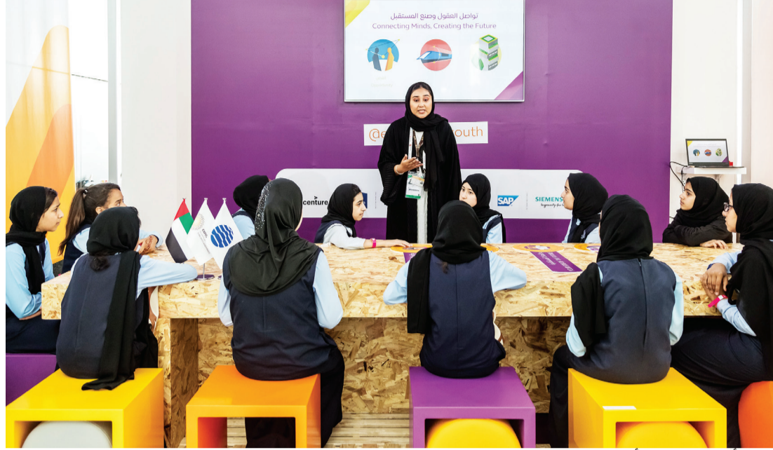
المرأة الإماراتية رافد أساسي لـ«إكسبو 2020 دبي» | البيان