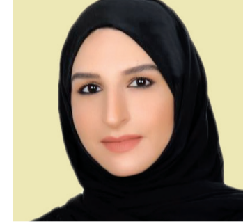
■ هالة بدري