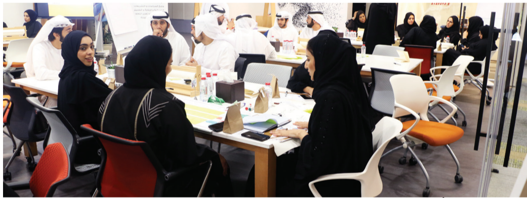
مشاركة فاعلة للمرأة الإماراتية في الجمارك | من المصدر

أصبحت اليوم شريكاً في صنع القرار في قطاع الجمارك، ولها بصماتها الواضحة في مجال التفتيش والابتكار والإبداع الجمركي.