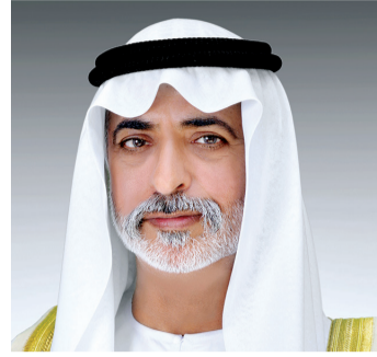
نهيان بن مبارك