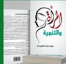
■ غلاف الكتاب