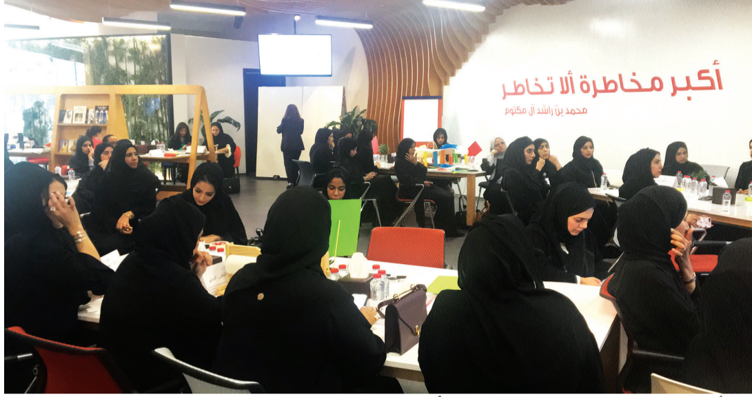
■ المرأة الإماراتية، إنجازات مستمرة ونجاحات مهمة | أرشيفية

وأضاف المبارك: في يوم المرأة الإماراتية، نثمن جهود سمو الشيخة فاطمة بنت مبارك لعملها على تكريس فضائل التسامح في المجتمع، وهي الميزة التي تعطي قيمة خاصة لمجتمعنا وللرأة الإماراتية بشكل خاص لتأثيرها المباشر في تربية النشء على هذه القيم وفي تعزيزها بين الأفراد.