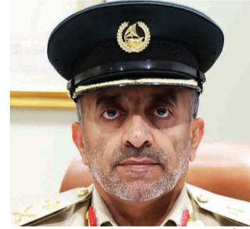
أحمد بن ثاني