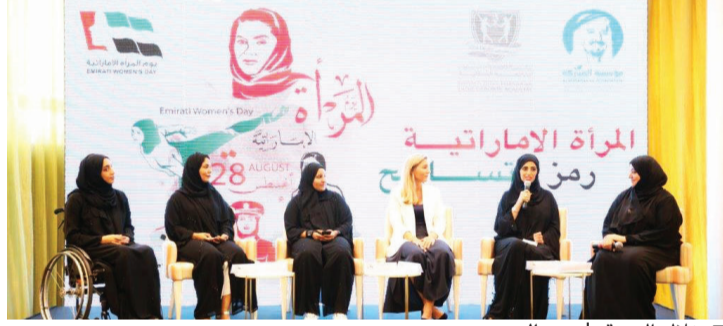
خلال الندوة | من المصدر

وأكدت الشيخة فاطمة بنت هزاع بن زايد آل نهيان رئيس مجلس إدارة أكاديمية فاطمة بنت مبارك للرياضة النسائية على أهمية هذه المناسبة التي تجسد مكانة المرأة في المجتمع، وما تحظى به من