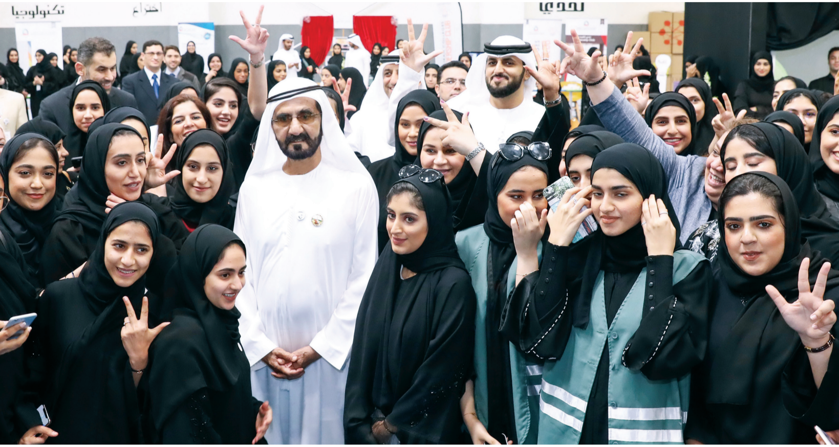
■ القيادة الرشيدة رسخت تمكين المرأة وريادتها | أرشيفية