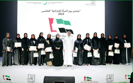
سعید الطاير والحضور خلال الحفل