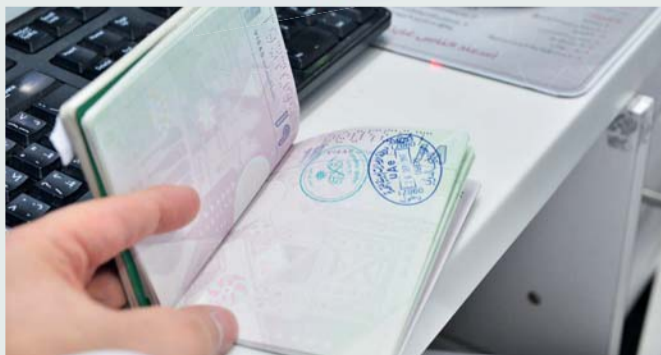
■ طريقة مبتكرة بإصدار ختم خاص بالمناسبة