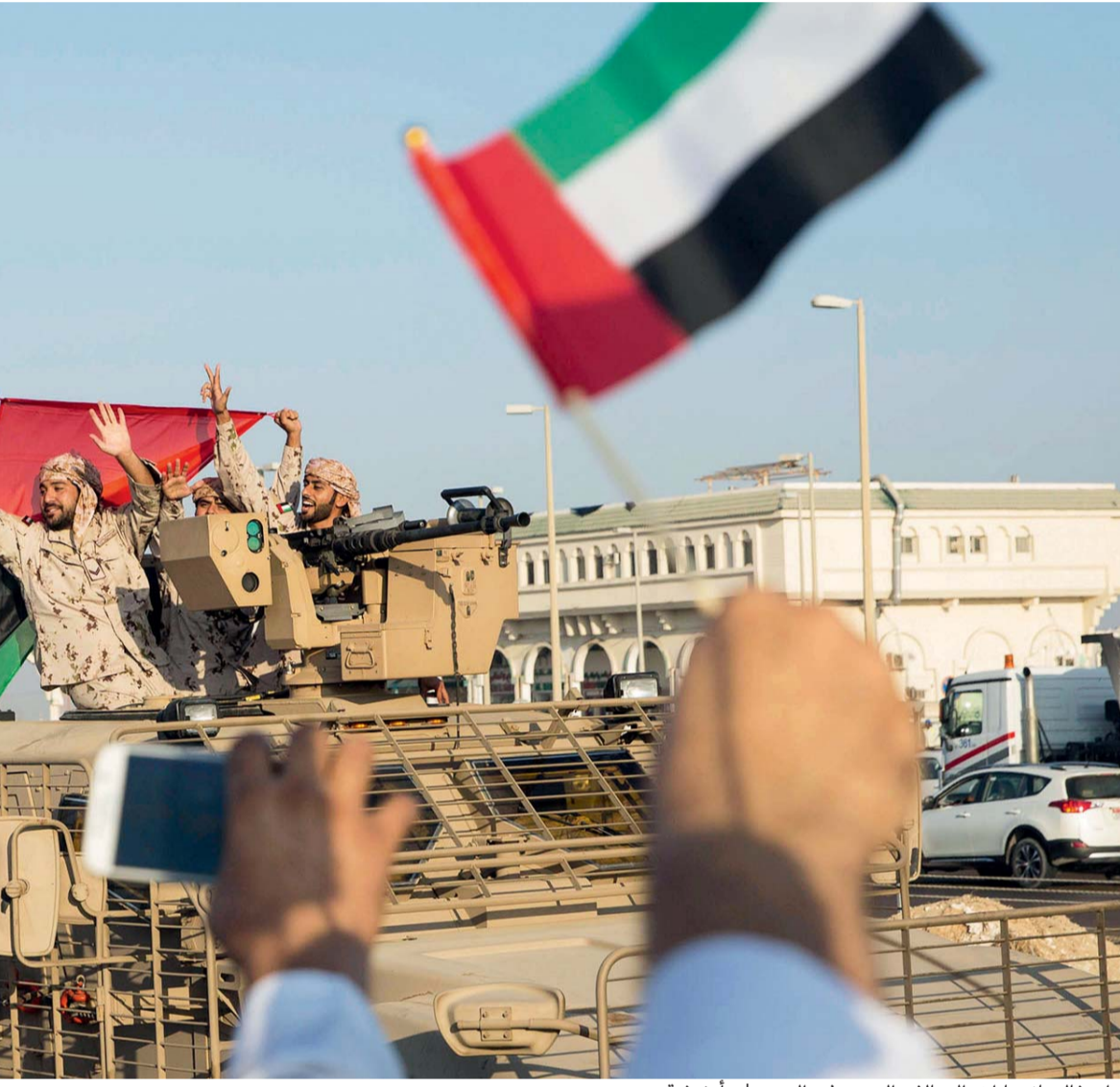
احتفال بانتصارات التحالف العربي في اليمن | أريشيفيه