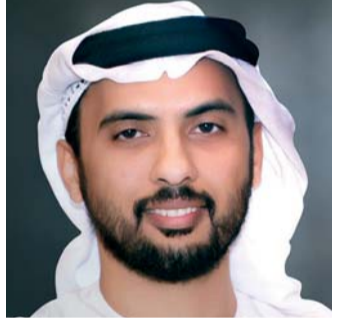
■ وسام لوتاه

الوطني السعودي مناسبة عزيزة على قلوبنا في الإمارات ومناسبة متجددة للاحتفال بأخوة تاريخية ولدت من رحم حكمة وأخوة الأبناء المؤسسين في البلدين وحملت رايتها قيادتنا البلدين وصولاً ليومنا الحاضر وامتدت فروع وشجرة الإخوة العريقة لتشمل التعاون في مختلف المجالات بصورة انعكست إيجاباً ليس على البلدين فحسب بل المنطقة والعالم».