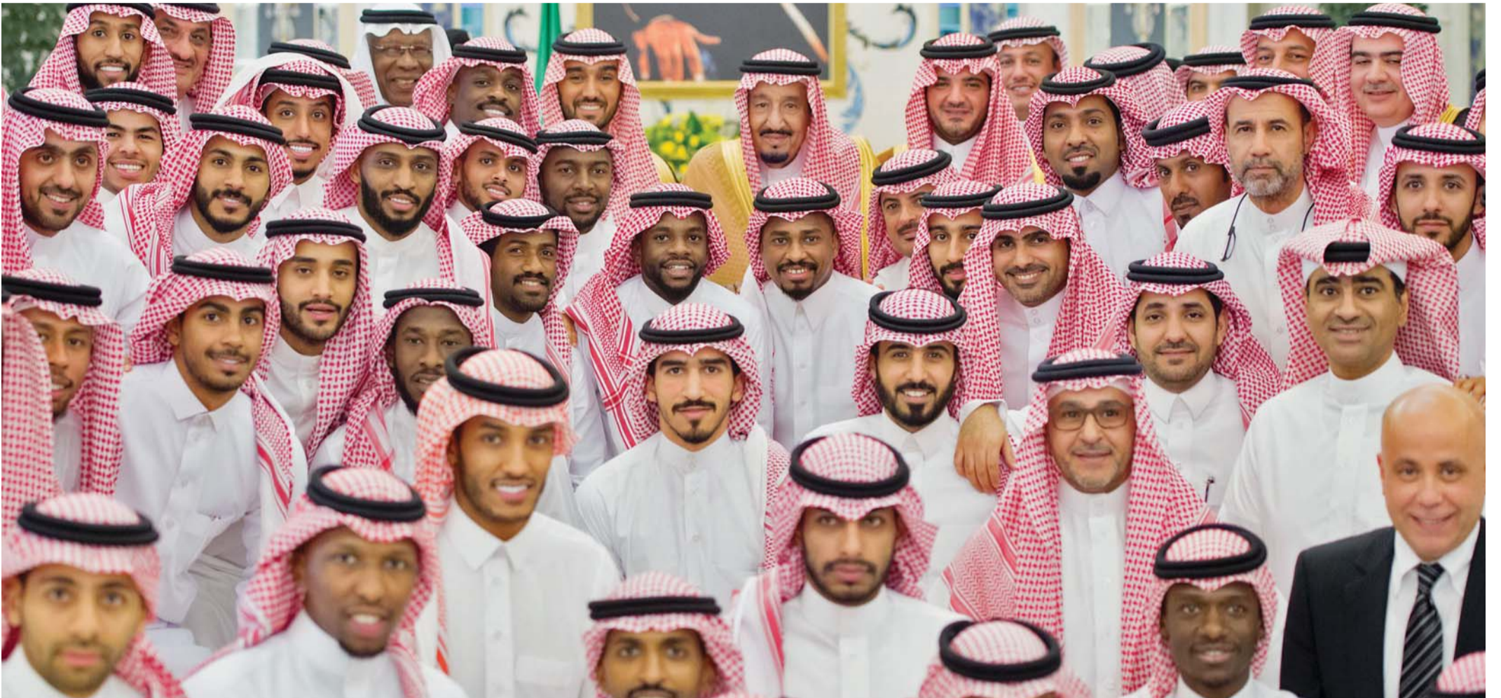
خادم الحرمين الشريفين يتوسط نجوم المنتخب السعودي