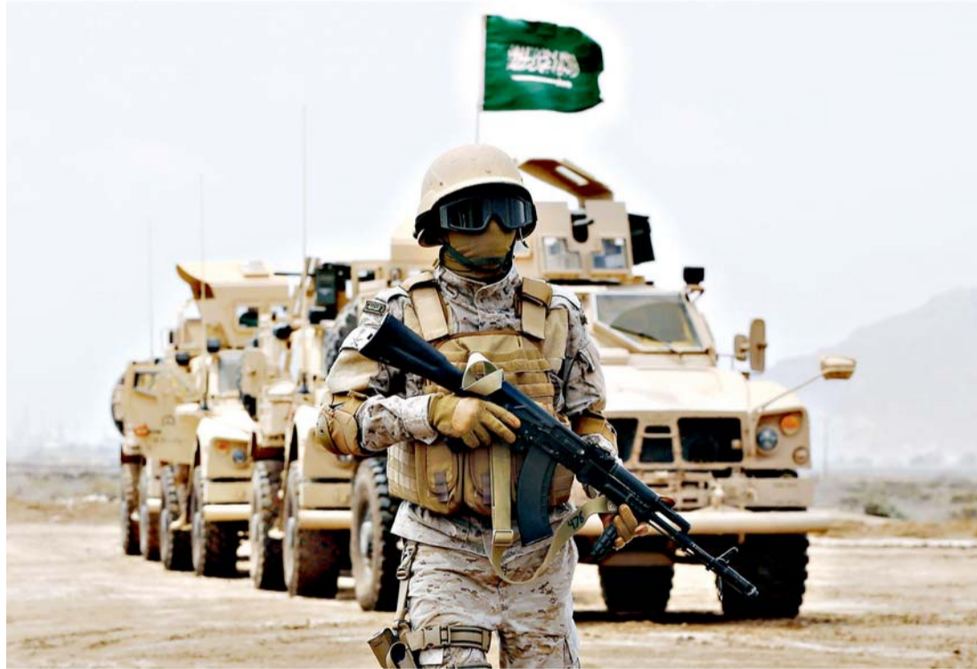
جندي سعودي أمام مدرعات عسكرية في اليمن