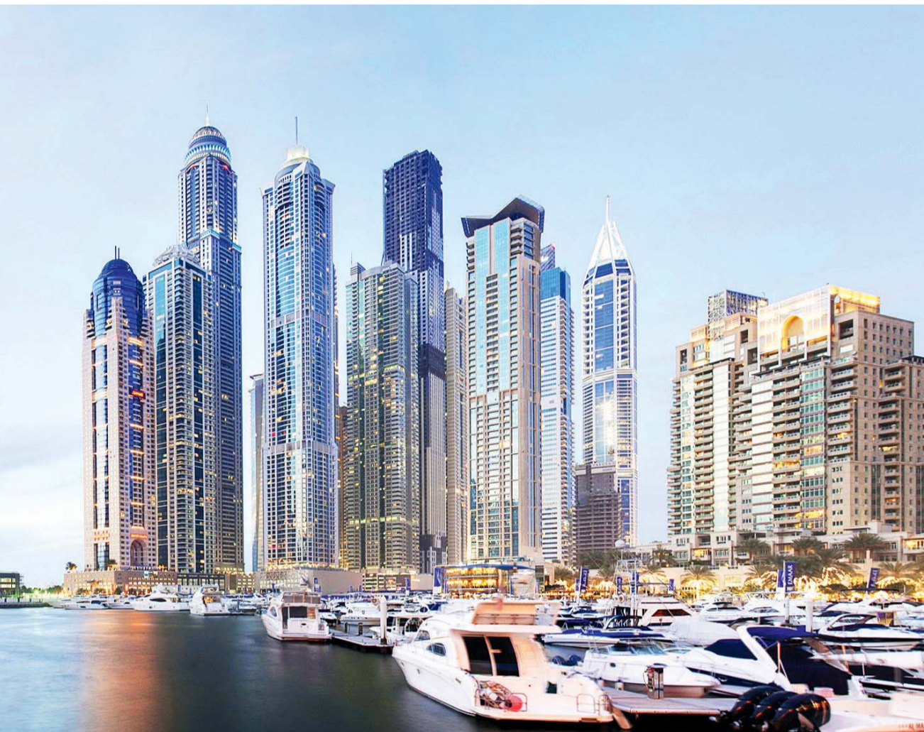
يعد برج كيان أعلى برج لولبي في العالم ويقع في مرسى دبي وتملكه شركة سعودية | البيان