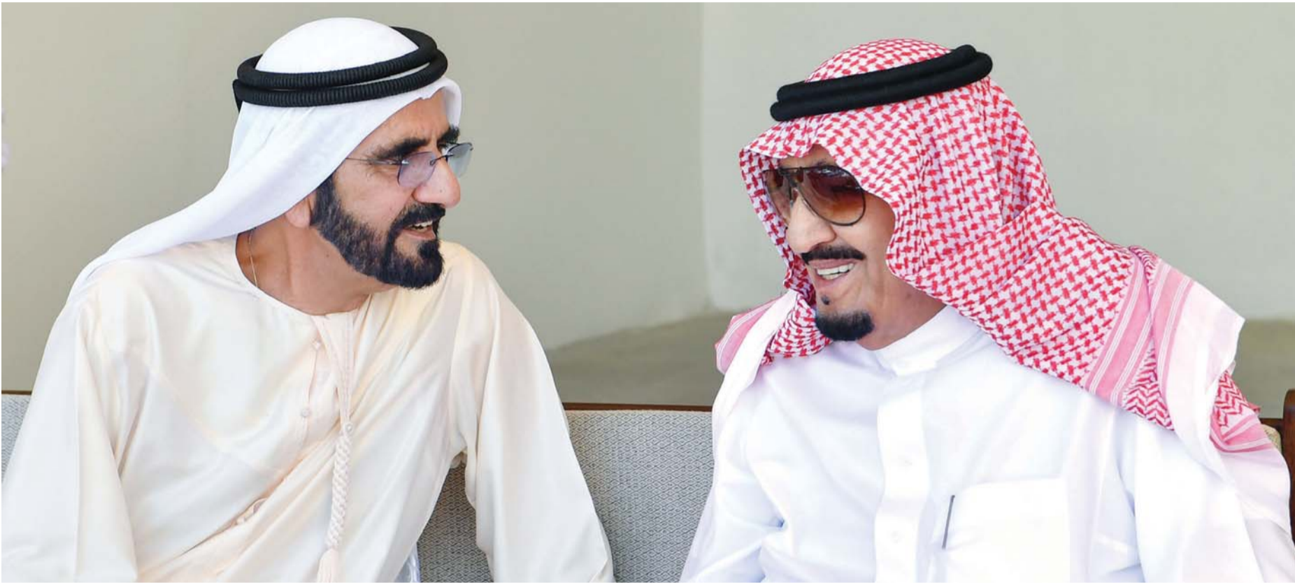
■ قيادتا الدولتين عملتا باستمرار على تطوير الروابط المشتركة في جميع المجالات

وقال سموه: «فرحة المملكة بيومهم الوطني هي فرحة لدولة الإمارات وشعبها.. حفظ الله المملكة وملكيها وشعبها الكريم».