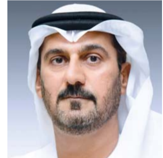
■ حسين الحمادي

وأشار معاليه إلى أن مجالات التعاون بين البلدين تزداد وترسخ يوماً بعد يوم، ويعد التعليم جانباً مهماً من هذه الجوانب، إذ يتمثل في التبادل المعرفي واسع النطاق، والطلبة المتبعثين للدراسة في الخارج، بجانب العديد من الفعاليات والمؤتمرات العلمية والتعليمية.