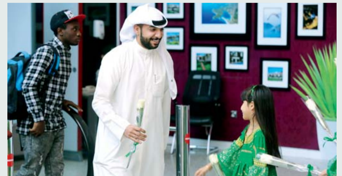
■ توزيع الورود بالمناسبة في مطار الشارقة

بمناسبة اليوم الوطني الـ 87، للملكة، سائلاً المولى عز وجل التوفيق لحكومة المملكة الحكيمة بقيادة خادم الحرمين الشريفين، في سعيها لنصرة القضايا العادلة للأمة العربية والإسلامية، متمنياً للشعب السعودي كل السعادة. كما استقبلت هيئة مطار الشارقة الدولي صباح أمس السعوديين