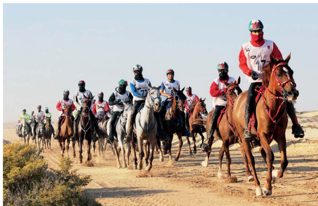
موسم قوي للقدرة بانتظار الفرسان | أرشيفية

وينطلق مهرجان سمو الشيخ سلطان بن زايد آل نهيان الذي سيقام في قرية بوظبي العالمية للقدرة، بسباق سموه لمسافة 240 كم دولي «3 نجوم» (80 كم / 3 أيام)، وسباق مهرجان سمو الشيخ سلطان بن زايد آل نهيان للسيدات لمسافة 100 كم، يليه اليوم الثاني سباق مهرجان سمو الشيخ سلطان بن زايد آل نهيان للشباب والناشئين والمسافات الدولية للقدرة بالوثبة، فيما يبدأ يوم 23 فبراير سباق كأس الشيخة فاطمة بنت منصور بن زايد آل نهيان للقدرة المخصص