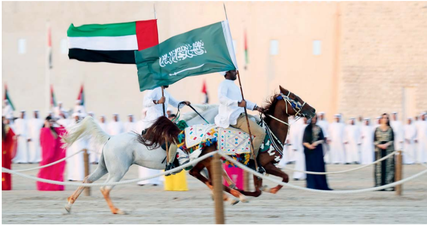
قنوات المؤسسة تواكب الاحتفالات في عدد من إمارات الدولة والمملكة