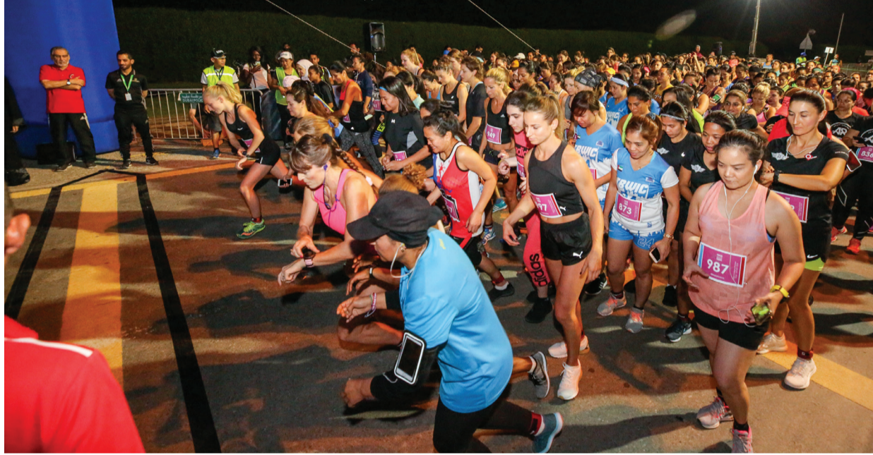
5000 رياضي يشاركون في الدورة السادسة | البيان

السادسة للدورة، وزيادة عدد البطولات الرياضية إلى 11 بطولة، وارتفاع عدد المشاركين إلى 5000 رياضي ورياضية من مختلف الجنسيات من الهواة والمحترفين، وكذلك تنظيم بطولتين خارجيتين، ضمن فعاليات الدورة في جمهورية مصر العربية والمملكة الأردنية الهاشمية، يؤكد نجاح الدورة، وحرص سمو الشيخ حمدان بن محمد بن راشد آل مكتوم، على وصولها للأشياء، وتوسيع رقعة المشاركين فيها، لما لها من فوائد كبيرة على مستوى نشر الوعي بأهمية الرياضة، وتوفير أجواء تنافسية ترفع المستويات الفنية للمشاركين فيها.