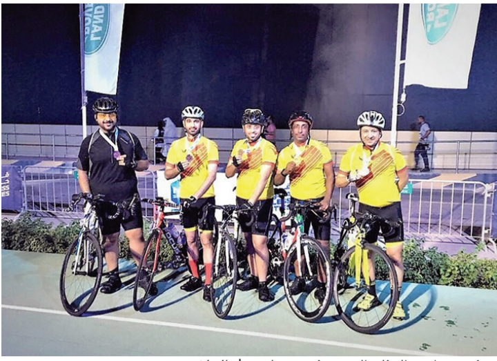
■ فريق دراجي الدفاع المدني في عجمان