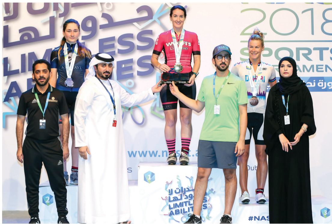
■ تتويج الفئة المفتوحة للسيدات

دراج فريق تريك دبي يحصل على المركز الثاني