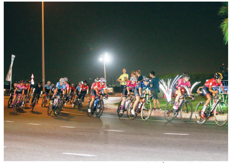
من سباق السيدات