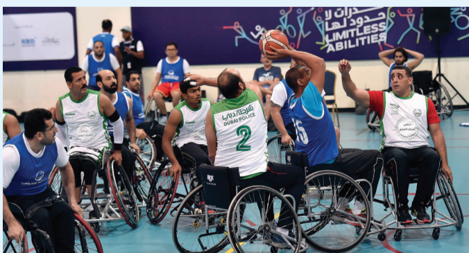
مستويات متفاوتة في الجولة الأولى للبطولة | البيان

على التسجيل كبيراً، سواء من اللاعبين أو الفرق ويكفي أن نسخة هذا العام شهدت مشاركة شركات خاصة، وهو ما يؤكد تطور الدورة وعدم اقتصرها على المؤسسات الحكومية بجانب العدد الكبير من اللاعبين الأجانب والمواطنين، ونشعر أنها كرنفال كبير لأصحاب الهمم.