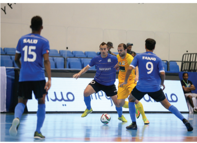
صراع قوي في بطولة كرة قدم الصالات

تستمر الليلة منافسات كرة قدم الصالات بـ 3 مواجهات مثيرة، تجمع الأولى بداية من الساعة العاشرة ليلاً فهود زعبيل مع فريق سيورت فور أول، وتنتقل الثانية بين شرطة دبي ومياه دماي الساعة الحادية عشرة و20 دقيقة، فيما تقام المباراة الأخيرة منتصف الليل و40 دقيقة بين الإمارات للسياسة و«ام كي أس». ويشترك في بطولة كرة قدم الصالات 12 فريقاً تضم جميعها 36 لاعباً أجنبياً منهم 15 لاعباً برازيليّاً و7 برتغاليين إضافة إلى جنسيات أخرى. دبي- البيان الرياضي