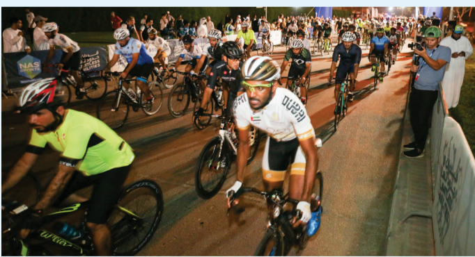
■ من سباق الهواة | البيان

المدرسين ليس فقط محراب وميرزا بجانب الكوادر الإدارية. وأشار محراب إلى أنه أول مدرب مواطن محترف يقود فريقاً محترفاً وهو سكاى دايف دبي، ونجح معه في الفوز بعدة سباقات دولية، ونافس كل الفرق العالمية، وبالتالي اهتمام الاتحاد باللاعبين والمدربين والحكام، أفرز عن وجود قاعدة كبيرة.