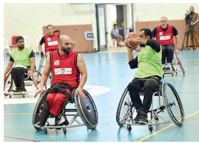
منافسات كرة السلة على الكراسي المتحركة

تقام الليلة 4 مباريات لحساب الجولة الثانية لكرة السلة على الكراسي المتحركة، وتنتقل الأولى الساعة التاسعة و45 دقيقة، بين جمعية الاتحاد والقيادة العامة لشرطة دبي، والمباراة الثانية بين مؤسسة دبي لخدمات الإسعاف وهيئة الطرق والمواصلات، الساعة العاشرة و35 دقيقة، أمام المباراة الثالثة، بين النيابة العامة والأنصاري للصرافة، فيما تختتم منافسات اليوم الثالث بقاء يجمع بلدية دبي ودناتا للسفرات. دبي- البيان الرياضي