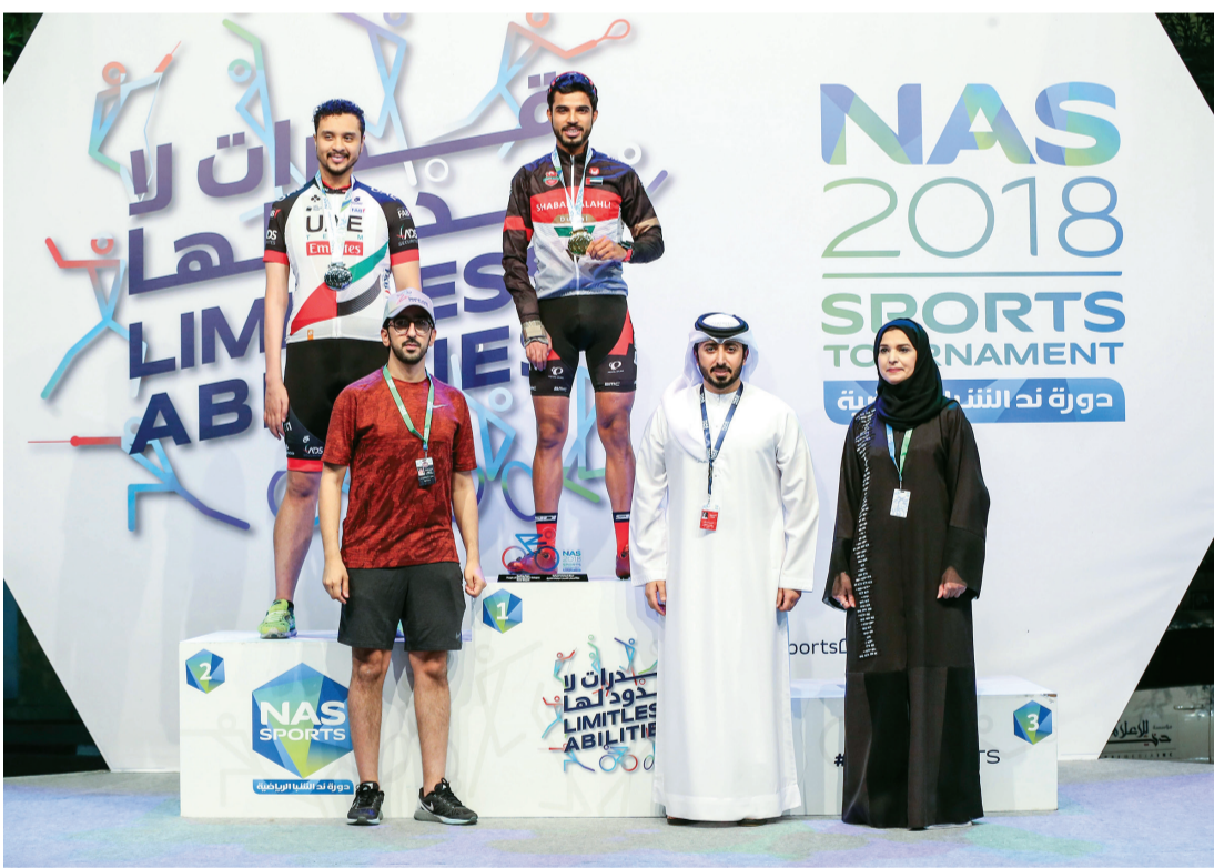
تتويج أبطال دراجات الطريق فئة أصحاب الهمم | البيان

وأشار الشعفار إلى أن مشاركة المنتخب في سباق ند الشبا، طمأنت الاتحاد على استعداداته للمشاركة في دورة الألعاب الآسيوية، التي ستقام في جاكارتا خلال