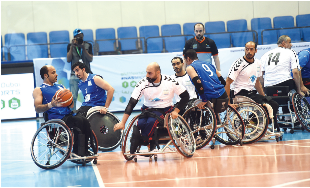
منافسات سلة الكراسي المتحركة تبدأ اليوم | البيان

البطولة تواجد لاعبين من الأصحاء رفقة 3 لاعبين من أصحاب الهمم على أرضية الصالة في نفس الوقت خلال المباراة، وهو ما جعل المزيد من فئات المجتمع يتعرفون على هذه الرياضة عن قرب ويتواصلون مع أصحاب الهمم وبالتالي جذب المزيد من الشركات والمؤسسات المحلية لتشكيل فرق والمشاركة في المنافسات، كما أن البطولة ساهمت في جذب أسماء عالمية حيث سيعود التايلاندي أكاسيت أفضل لاعب في العالم للمشاركة في هذه النسخة، والمصري أبو الفتوح، إلى جانب نجوم من تركيا ودول أخرى ولاعبين منتخبنا الوطني الذين شاركوا مؤخراً في بطولة فزاع الدولية لأصحاب الهمم وأن مشاركة هؤلاء النجوم تعزز مكانة البطولة. وكشف العصيمي، أن اللجنة المنظمة للندوة وقفت معهم على كافة الترتيبات الخاصة بالبطولة لضمان حصد النجاحات والمستوى المميز الذي ظهرت به في النسخ الماضية، كما سيتم تخصيص سحبات على جوائز قيمة على مدار أيام الحدث في ظل توقعات بحضور جماهيري على المدرجات من عشاق هذه الرياضة وعائلات اللاعبين المشاركين.