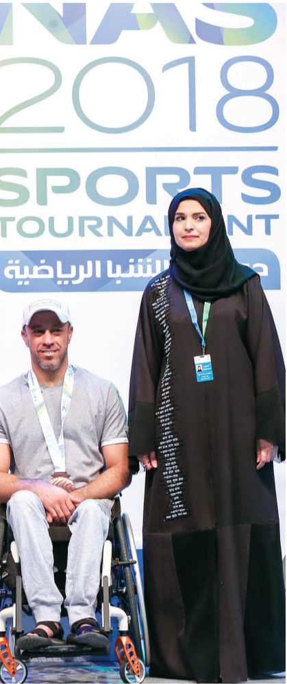
تتويج أبطال الدراجات اليدوية | البيان