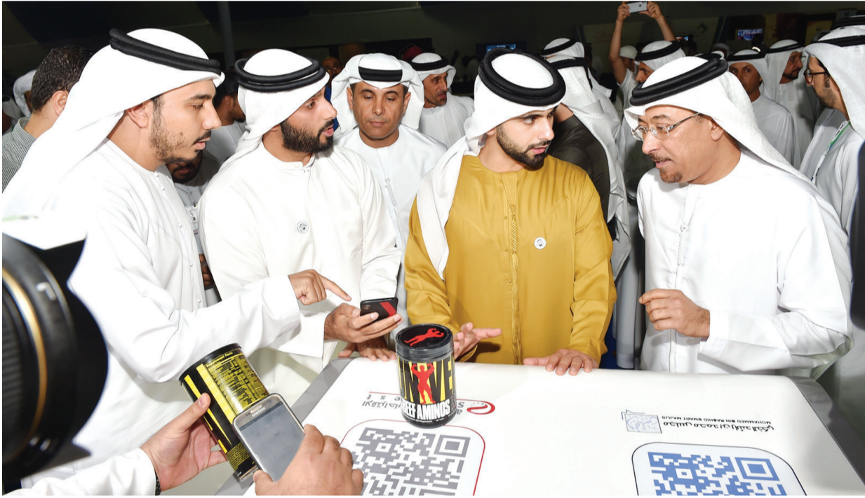
منصور بن محمد يزور جناح بلدية دبي في الخيمة بحضور داوود الهاجري | البيان

في مسابقتي الجري والدراجات الهوائية بعد قرار صاحب السمو الشيخ خليفة بن زايد آل نهيان رئيس الدولة، حفظه الله، بالسماح لأبناء المواطنين وحملة جواز سفر الدولة ومواليد الدولة والمقيمين من المشاركة في المسابقات الرياضية، وقال: إنها فرصة لا تعوز بثمن للاتحادات، أدعوهم لزيارة الدورة واكتشاف سر الحضور الجماهيري الكبير الذي لا نجده في الألعاب الجماعية.