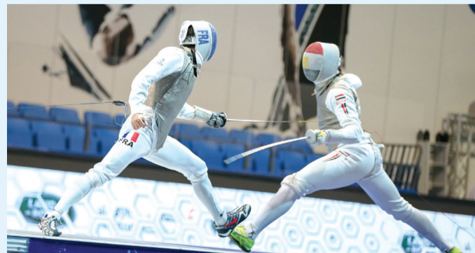
من منافسات العام الماضي