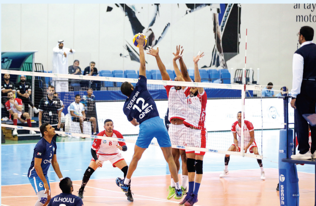
من مباراة «إف 3 أ» وليدر سبورت | البيان

تكرر السيناريو في الشوط الثالث بالتعادل في البداية ووصلت النتيجة إلى 5-5، وسارت المواجهة نقطة بنقطة، ورغم أن إف 3 كان البادئ بالتسجيل إلا أن ليدر سبورت عاد إلى اللقاة ويتقدم للمرة الأولى 7-8 إلا أن إف 3 عادل النتيجة، وتصل النتيجة إلى 10-10، ويبدأ إف 3 في التقدم بـ3 نقاط 11-14، وسيطر إف 3 على أجواء اللقاء ويتقدم 14-20، وينجح ليدر في تقليص الفارق إلى 3 نقاط، 17-20، وتتحرك النتيجة إلى 18-21، ثم 23-19، وتصل النتيجة إلى 23-24 لفريق إف 3، ويحسمها إلى 23-25.