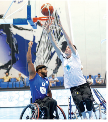
من منافسات العام الماضي | البيان

وهيئة الصحة في دبي، ومؤسسة دبي لخدمات الإسعاف، في حين ضمت المجموعة الثانية، النيابة العامة والأنصاري للصرافة، والقيادة العامة لشركة دبي، وهيئة كهرباء ومياه دبي، وجمعية الاتحاد التعاونية. وبحسب برنامج البطولة سيقيم شريط الافتتاح النيابة العامة وهيئة كهرباء ومياه دبي في اليوم الأول الأحد المقبل، وتتواصل بمواجهات بلدية دبي وهيئة الصحة في دبي، الأنصاري للصرافة وشركة دبي، ودناتا للسفرات وهيئة الطرق والمواصلات في دبي.