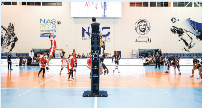
تعاون كبير بين الدورة واتحاد الإمارات لكرة الطائرة في مجال التحكيم | البيان

بطل النسخة الماضية من الدورة التي انتهت بخسارة بنتيجة 3-2، مؤكداً أنها إثارة غير متوقعة خاصة في ظل رغبة الفريقين بالحصول على أول ثلاث نقاط في البطولة.