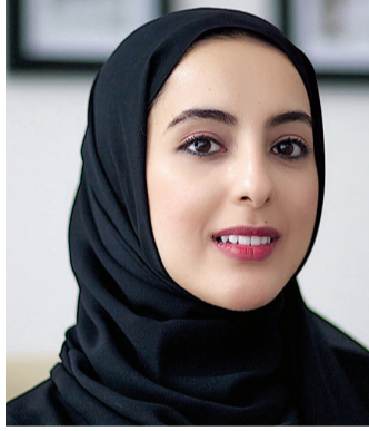
■ شما المزروعى

وجميع أفراد المجتمع أمر لا بد منه لتعزيز التنمية المجتمعية. وقالت معاليها - بمناسبة اليوم العالمي للمرأة: «ستواصل السعي نحو وداخل العديد من المجتمعات ويجب علينا أن نفهم القوى في تلك المجتمعات التي تحدد وضع المرأة سواء كانت في المجال الثقافي والاجتماعي والقانوني والسياسي أو الديني»، وأضافت إن سياق تمكين المرأة هو مسار حرج نحو تحقيق هدف تمكين المرأة نفسه.