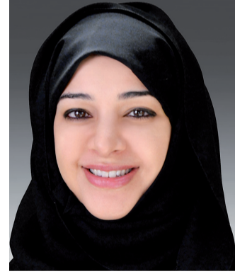
■ ريم الهاشمي