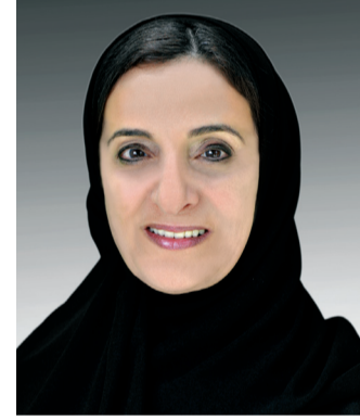
■ لبنى القاسمي

وأكدت معالي الشيخة لبنى بنت خالد القاسمي وزيرة دولة للتسامح، أن المرأة الإماراتية أصبحت أيقونة التقدم والتميز والريادة عالمياً، في ظل العناية الفائقة من صاحب السمو الشيخ خليفة بن زايد آل نهيان رئيس الدولة، حفظه الله، وأخيه صاحب السمو الشيخ محمد بن راشد آل مكتوم نائب رئيس الدولة رئيس مجلس الوزراء حاكم دبي، رعاه الله، وصاحب السمو الشيخ محمد بن زايد آل نهيان ولي عهد أبوظبي نائب القائد الأعلى للقوات المسلحة، وإخوانهم أصحاب السمو حكام الإمارات، وأعربت معاليها، بمناسبة اليوم العالمي للمرأة، عن شكرها البالغ لسمو الشيخة فاطمة بنت مبارك رئيسة الاتحاد النسائي العام، الرئيسة الأعلى لمؤسسة التنمية الأسرية، رئيسة المجلس الأعلى للأمومة والطفولة «أم الإمارات»، على ما توليه سموها من اهتمام كبير بتمكين المرأة الإماراتية في شتى القطاعات، فضلاً عن دعمها للمرأة بشكل عام في العالم أجمع، دون النظر إلى الأصل أو