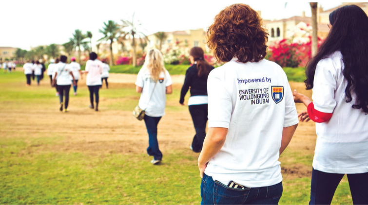
المسير العالمي يسلم الضوء على الدور القيادي للمرأة | من المصدر