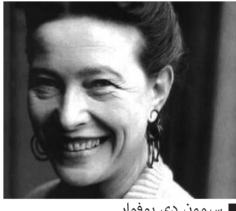
سيمون دي بوفوار

سيمون دي بوفوار أحد أبرز الأعلام المؤسسين للفلسفة النسوية، التي بذلت ما وسعها من أجل تقديم إجابات شافية عن سؤال: كيف بنى العقل البشري فكرة النوع؟ وكشفت عما أسمته بالهزائم الكبرى للمرأة في تاريخ البشرية. في سنة 1954 نشرت دي بوفوار روايتها الشهيرة «المثقفون» التي حازت على أبرز الجوائز الأدبية في فرنسا، كجائزة «الغونكور».