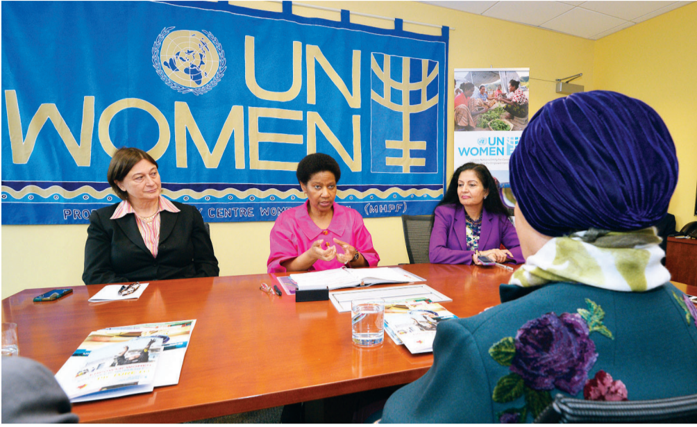
■ جواهر القاسمي خلال زيارتها المقر الرئيس لهيئة الأمم المتحدة للمرأة في نيويورك | أرشيفية

في الإمارات، فإنه لا يمكننا أن ننسى الدور الرئيس والمنهجية الحكيمة لسمو الشيخة فاطمة بنت مبارك (أم الإمارات)، رئيسة الاتحاد النسائي العام، الرئيس الأعلى لمؤسسة التنمية الأسرية، رئيسة المجلس الأعلى للأمومة والطفولة، في دعم المرأة، حيث شكلت جهودها الكبيرة المتواصلة، الدافع والمحفز للمرأة الإماراتية، كي تغدو قدوة عالمية بقدراتها وإنجازاتها ومكانتها الاجتماعية والاقتصادية والمهنية.