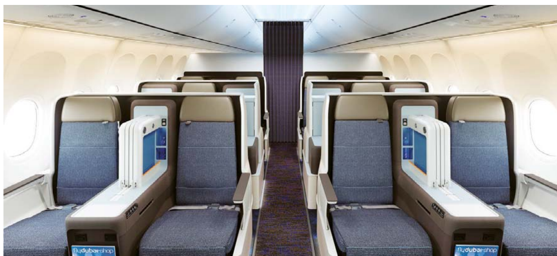
طائرة «فلاي دبي» من الداخل | البيان

دعامة إضافية لالتزامنا بفتح وجهات جديدة، فضلاً عن تجربة السفر الاستثنائية التي توفرها لمسافريننا. وسيتم تشغيل هذه الطائرة في البداية على الوجهات البعيدة للناقله مثل بانكوك