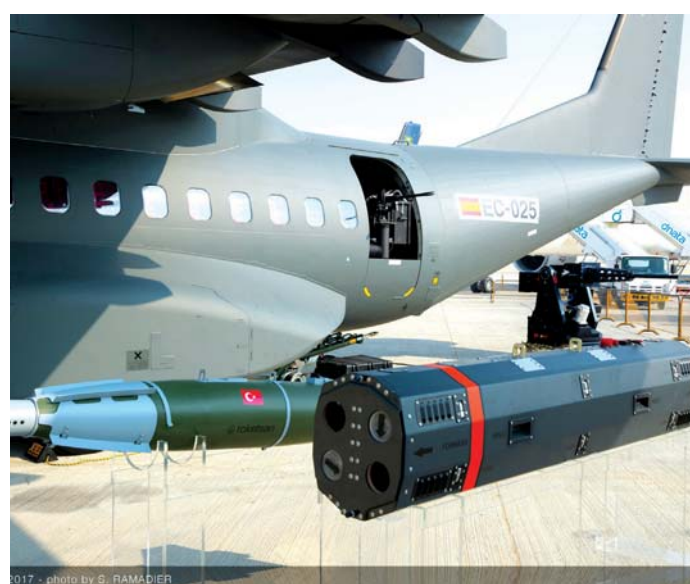
الطائرة الجديدة «C295» | البيان

وكذلك Rheinmetall الألمانية، ومزودين أميركيين هما Nobles وWorldwide, US Ordnance. وتم تسليم الطائرة بطنها القتالية لزيون لم يتم الكشف عنه، وتم تزويدها برشاشات خفيفة عيار 12,7 ملم، تم تثبيتها على الأبواب الجانبية للطائرة. وخلال المرحلة المقبلة، سيتم تزويد الطائرة بنظام مضاد للمدركات من Roketsan، تحمل اسم I-UMTAS.