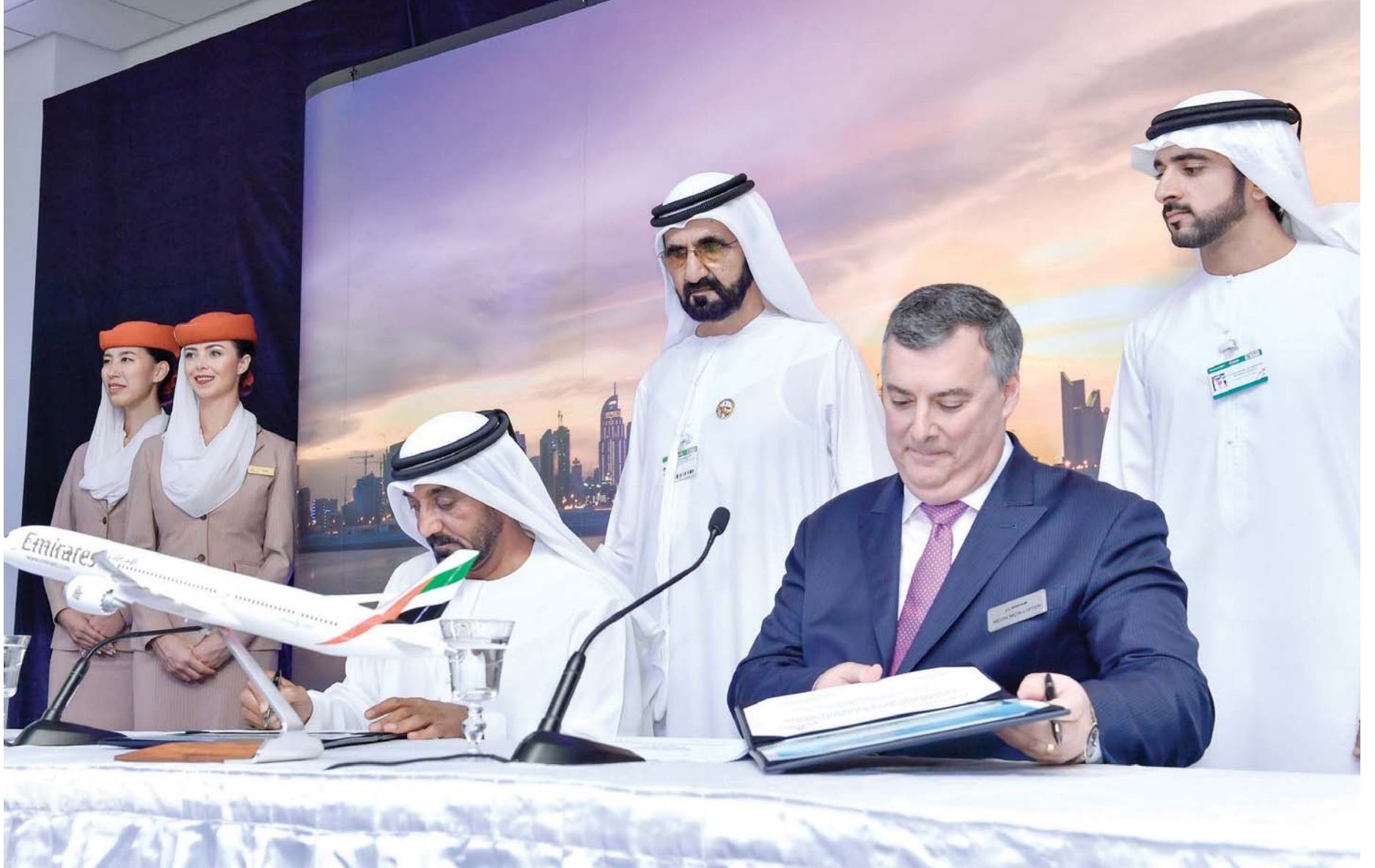
محمد بن راشد وحمدان بن محمد يشهدان توقيع أحمد بن سعيد وكيفن ماكاليستر اتفاقية شراء 40 طائرة «بوينغ 787»

أحمد بن سعيد: طلبيات «الإمارات» الجديدة ترفع قيمة طلبيات الناقل من بوينغ إلى 130.6 مليار درهم