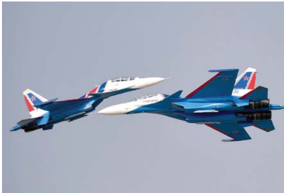
طائرة سوخوي سو-30SM الروسية تستعرضان مهارتهما