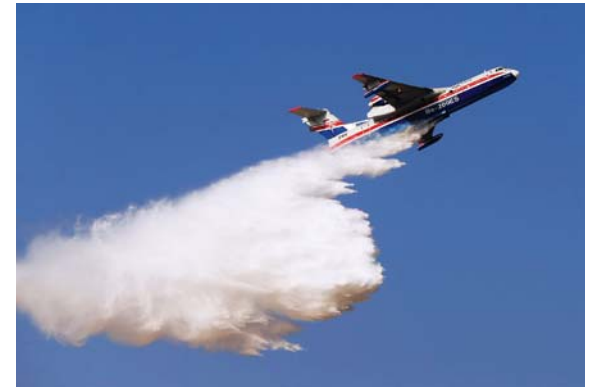
طائرة خلال عرض جوي في المعرض