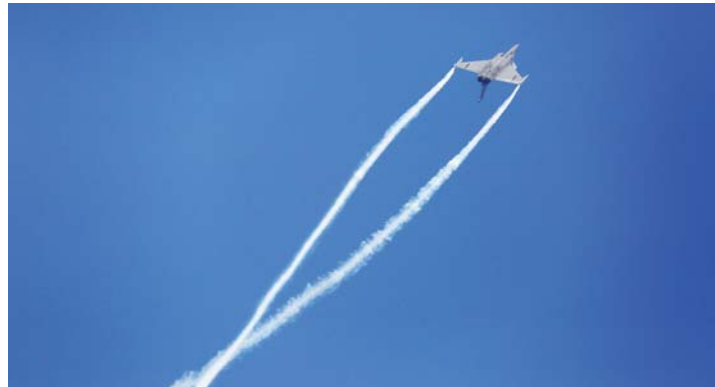
طائرة مقاتلة من طراز رافال الفرنسية