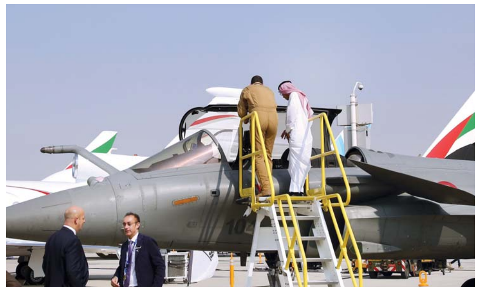
فنيون ومتخصصون يطلعون أحدث طراز الطائرات المقاتلة خلال عرضها في المعرض أمس