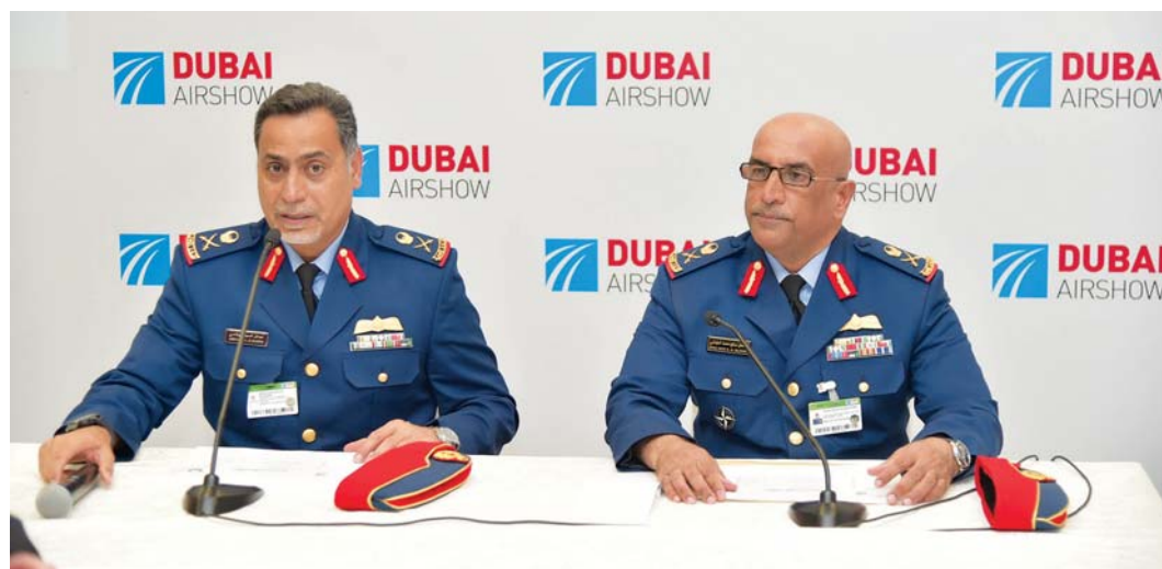
عبدالله الهاشمي وإسحاق البلوشي خلال المؤتمر الصحفي أمس

و634 ألف درهم لتحديث عدد من كبائن الرادارات وتركيب أجهزة الراديو. وأكد أن الصفقات تعكس حرص وضمان جاهزيتها القتالية، لافتاً إلى أن حجم الصفقات العسكرية للمعرض لا يتحدد بحجم التورات السياسية في المنطقة بل بحجم الاحتياجات الحقيقية للقوات المسلحة، مشيراً إلى أن الإعلان عن إجمالي صفقات المعرض سيكون في ختام المعرض دون تقسيم إلى صفقات مدنية وصفقات عسكرية. من جانبه، أشار اللواء الركن طيار إسحاق صالح البلوشي إلى أن الحضور القوي لشركات التصنيع العسكري الإماراتية في المعرض يعكس الانطلاقة القوية التي يشهدها القطاع في أعقاب عملية إعادة الهيكلة، مشدداً على أن منتجات الشركات الدفاعية الإماراتية نجحت في فتح أسواق لها في الكثير من الدول، وأضاف أن حجم الصفقات في اليوم الأول من المعرض يعكس أهميته وحجم الإقبال من قبل الشركات المحلية والدولية المشاركة، حيث حرصت هذه الشركات على عرض أحدث التقنيات والتكنولوجيا وسعت للاستفادة من المنصة المثالية التي يوفرها، لافتاً إلى حرص العديد من الخبراء والمهنيين على الحضور والتعرف إلى جديد الشركات وكيفية الاستفادة من التكنولوجيا العالمية في تلك المجالات.