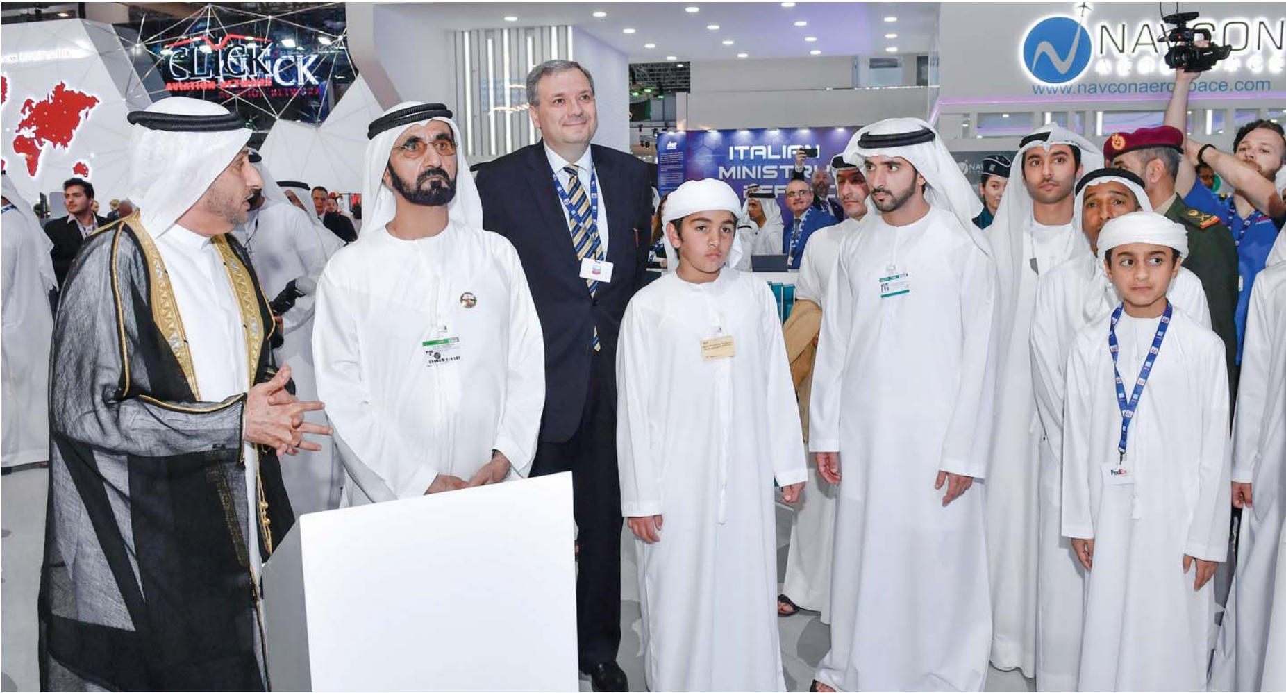
محمد بن راشد يطلق المبادرة بحضور حمدان بن محمد ومحمد بن راشد بن محمد ومحمد الزرعوني