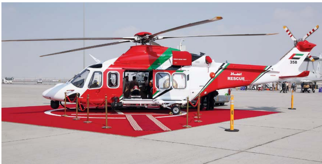
جانب من مشاركة المركز في معرض دبي الدولي للطيران

ومما يجدر ذكره أن المركز الوطني للبحث والإنقاذ، الذي يتخذ من العاصمة أبوظبي مقراً رئيسياً له، هو المركز الأول من نوعه في دولة الإمارات العربية المتحدة، حيث يتولى جميع المهام الخاصة بعمليات البحث والإنقاذ في الدولة مطبقاً أعلى المعايير الدولية المستمدة من الهيئة الدولية للطيران المدني والمنظمة البحرية الدولية.