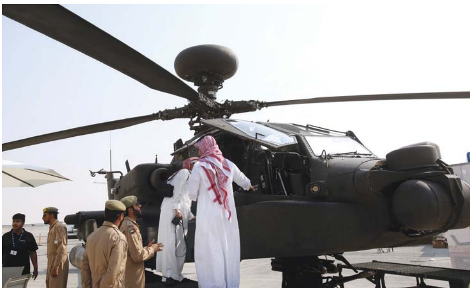
طائرة هليكوبتر مقاتلة مشاركة في المعرض