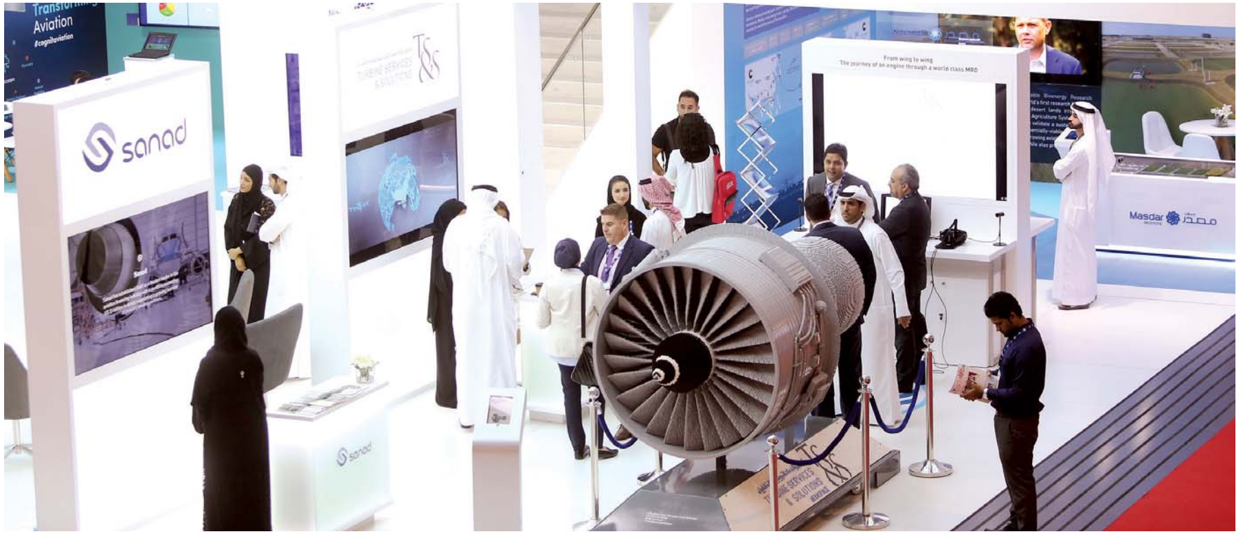
معرض دبي للطيران يعيد رسم خريطة القطاع عالمياً

حسب توقعات خطة مطارات دبي الاستراتيجية 2017-2025 من المستهدف أن ترتفع حصة قطاع الطيران إلى 195 مليار درهم، أي ما يوازي 37,5% من إجمالي الناتج المحلي لإمارة دبي، وتوفير نحو 745 ألف فرصة عمل خلال العام 2020. كما تتوقع الخطة ارتفاع إجمالي أعداد المسافرين عبر مطاري دبي الدوليين، وهما «مطار دبي ومطار دبي ورلد سنترال» إلى 143 مليون مسافر في 2020. وحققت صناعة الطيران في دولة الإمارات بشكل عام ودبي بشكل خاص إنجازين كبيرين خلال 2016 وهما الحصول على هذا التصنيف غير المسبوق في مجال أمن الطيران من قبل منظمة عالمية.