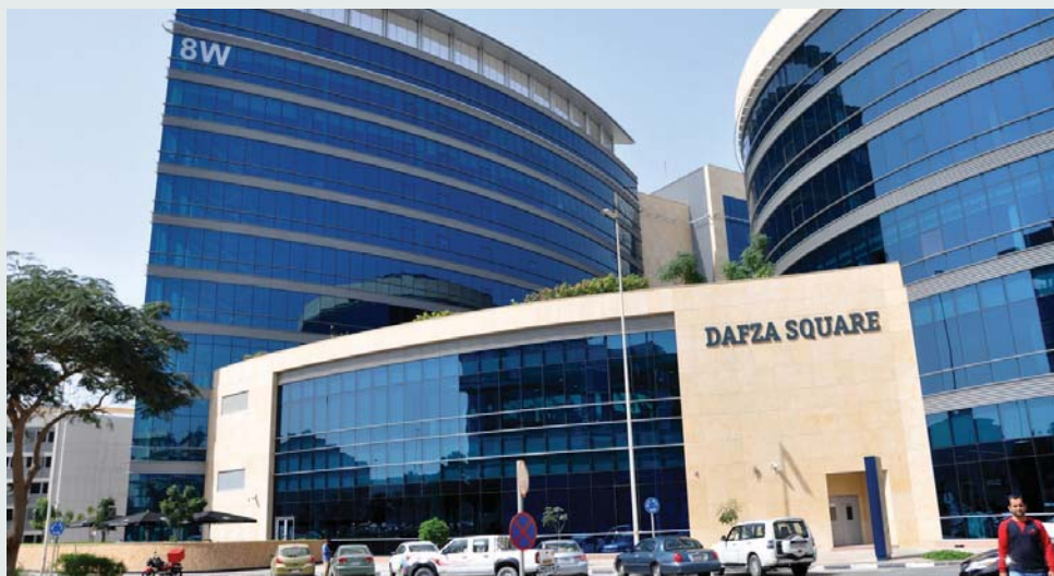
«دافزا» تستقطب الشركات المتخصصة في صناعة الطيران