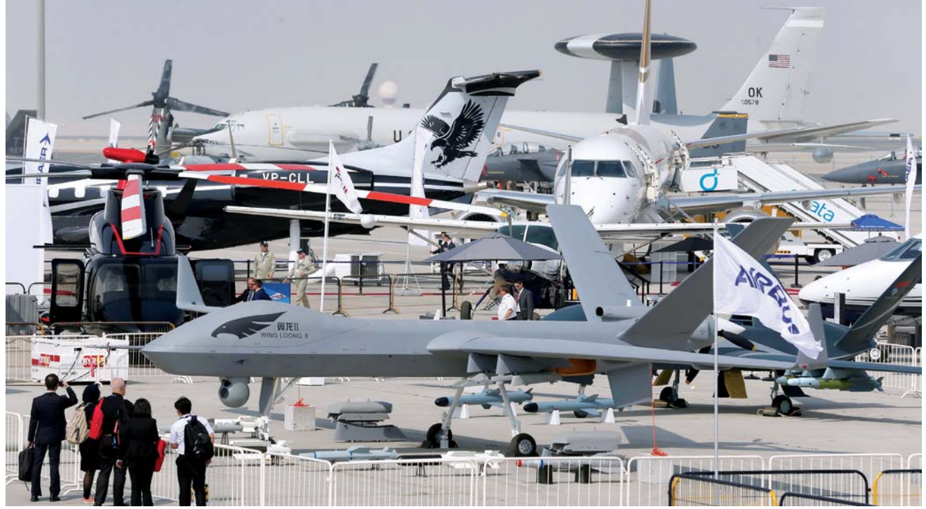
زوار يطلعون على طائرة بدون طيار عرضت خلال معرض دبي للطيران أمس