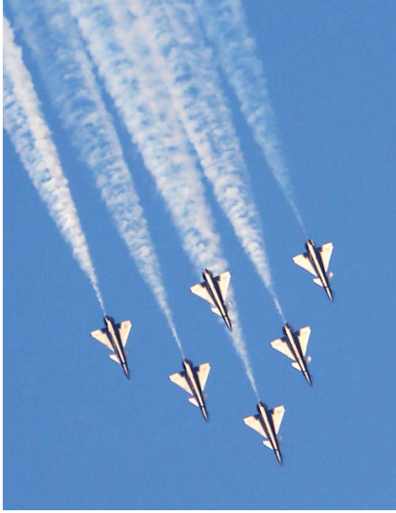
عرض جوي خلال فعاليات المعرض