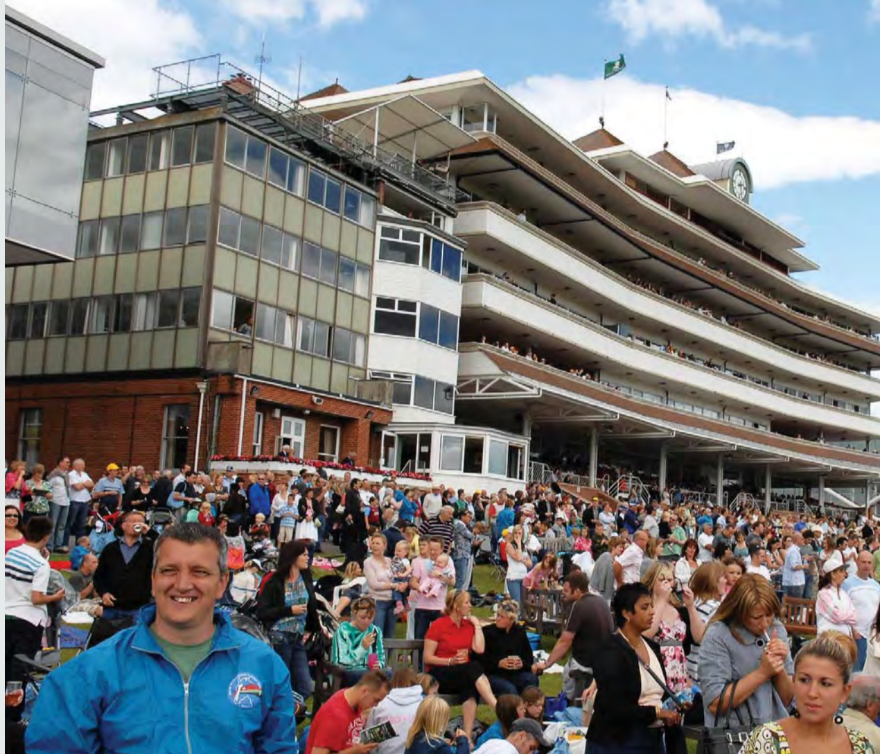
مضمار نيوبري تاج سباقات الخيول العربية في بريطانيا | أرشيفية