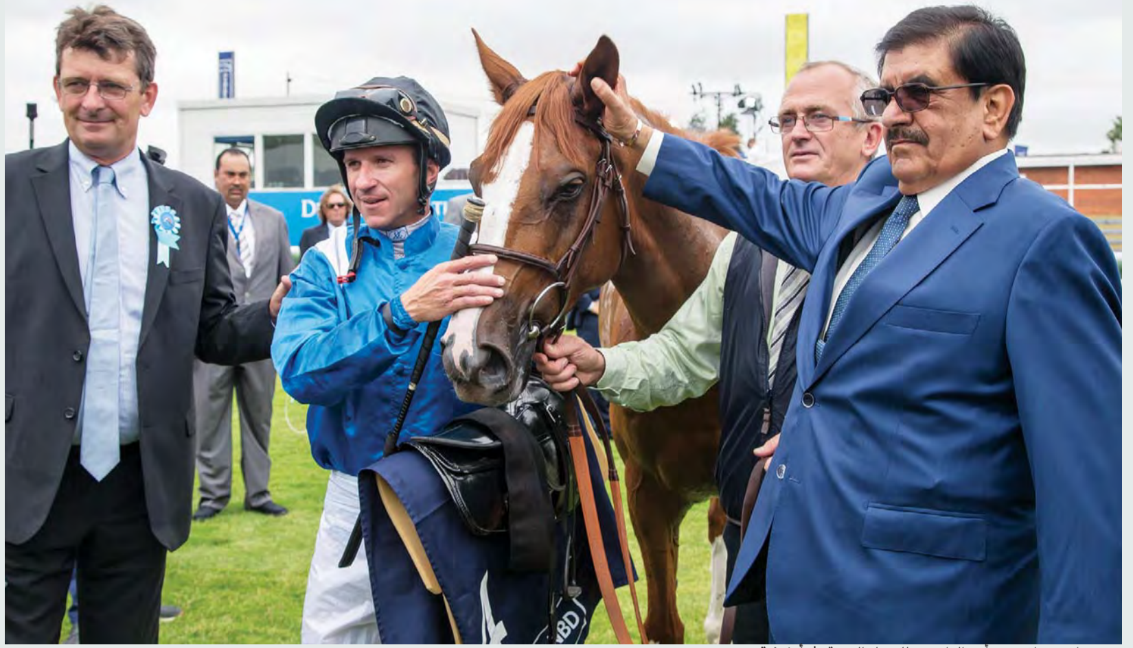
حمدان بن راشد من أبرز الداعمين للخيل العربية | أرشيفية