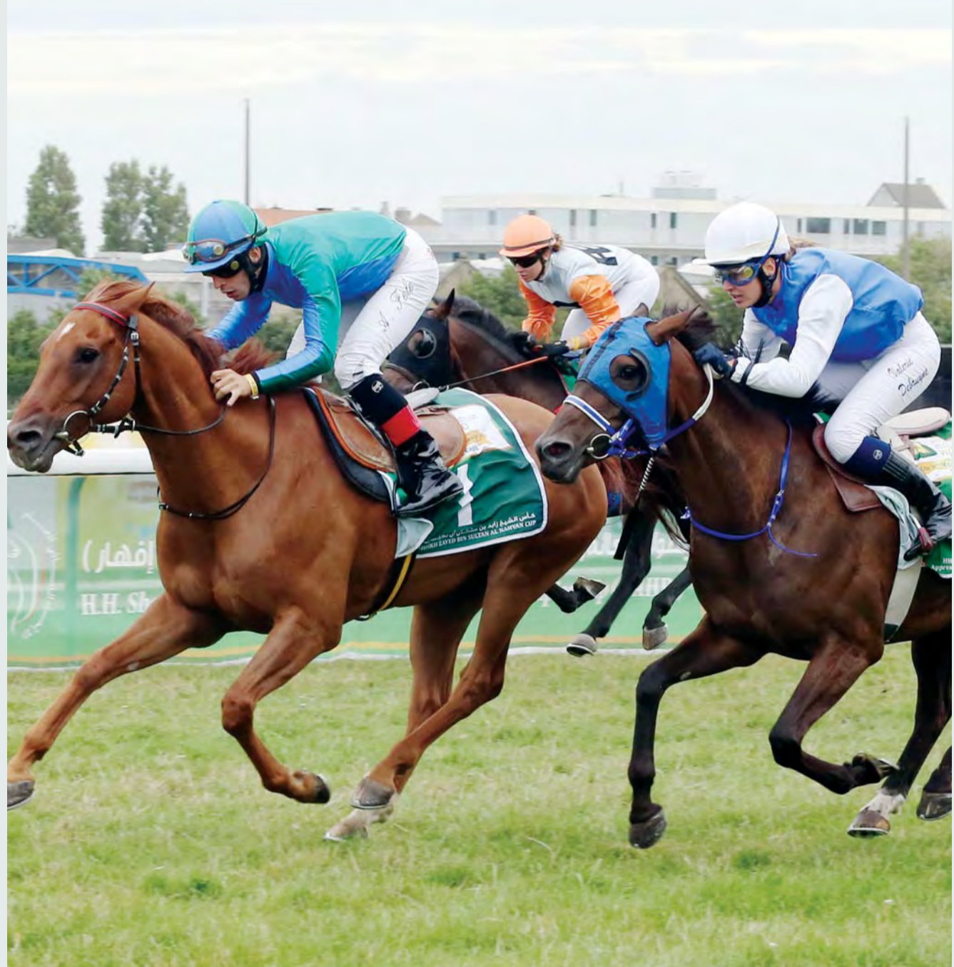
نخبة الخيول العربية تتنافس في السباقات الأوروبية | أرفيفية