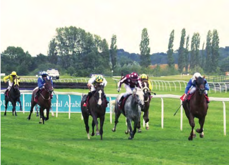
الإمارات داعم مهم للخيول العربية في مختلف المضامير العالمية | أرشيفية