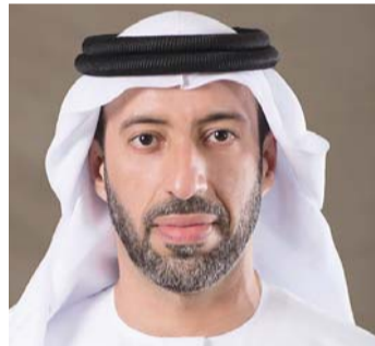
■ سيف القبيسي

وقالت معاليها: إن مثل هذه المبادرات الكريمة ليست بغريبة على قيادتنا الرشيدة التي تعمل دائماً على إدخال البهجة والفرحة في نفوس شعب دولة الإمارات، بل تؤكد أن المبادئ والقيم التي أسسها مؤسس الاتحاد وباني نهضة دولة الإمارات الحديثة ستظل حية دائماً، وأن راية الخير والعطاء ستظل دائماً مرفوعة.