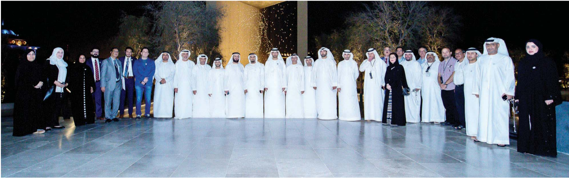
سلطان الجابر ومنصور المنصوري وموظفو «الوطني للإعلام» خلال الزيارة