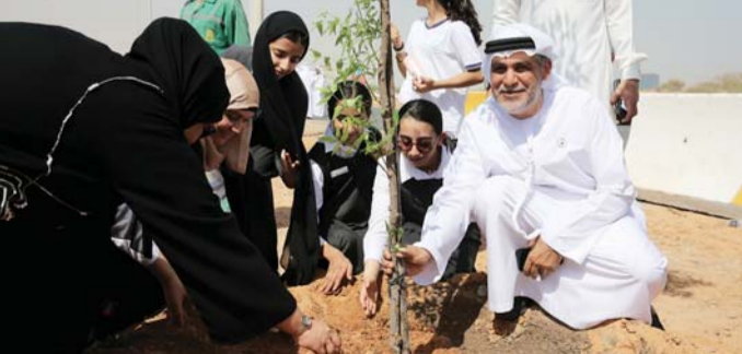
خلال زرع الأشجار ضمن المبادرة