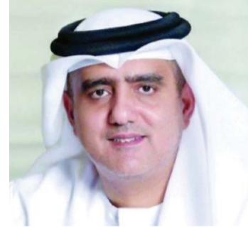
■ عصام الحميدان

قال المستشار عصام عيسى الحميدان النائب العام لإمارة دبي، إن احتفاء شعب الإمارات بمئوية المغفور له بإذن الله الشيخ زايد بن سلطان آل نهيان، طيب الله ثراه، محطة وطنية لترسيخ القيم والمبادئ التي أسسها المغفور له بإذن الله، القائمة على المحبة والتلاحم بين القيادة والشعب، التي يتوارثها أبنائه ويؤكدون عليها جيلاً بعد جيل تحقيقاً للهدف السامي للقيادة الرشيدة في تعزيز مكانة دولة الإمارات تجاه نشر الخير في أنحاء العالم.