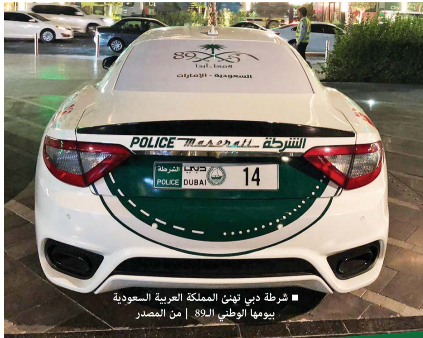
شرطة دبي تهنيي المملكة العربية السعودية بيومها الوطني الـ 89 | من المصدر

الوزراء وزير الدفاع، وإلى كل أبناء الشعب السعودي، بخالص التهاني والتبريكات بمناسبة اليوم الوطني الـ 89، متمنية للمملكة العربية السعودية الشقيقة دوام التقدم والنجاح في مسيرة البناء والتنمية والازدهار والرفعة. وئمن اللواء عبد الله خليفة المري القائد العام لشرطة دبي، بالعلاقات التاريخية الممتدة والقوية بين دولة الإمارات العربية المتحدة والمملكة العربية السعودية الشقيقة، معرباً عن تهانئه للمملكة حكومة وشعباً بهذا اليوم المجيد الذي يعد مصدر فخر واعتزاز للجميع، وهي أرض الرسالة النبوية الشريفة السمحاء، أرض العزة والوحدة والبناء والرخاء، متمنين لهم مزيداً من التقدم والازدهار، وأكد القائد العام لشرطة دبي على دور المملكة العربية السعودية ورؤية قيادتها الثاقبة في مختلف المواقف والقضايا العربية،