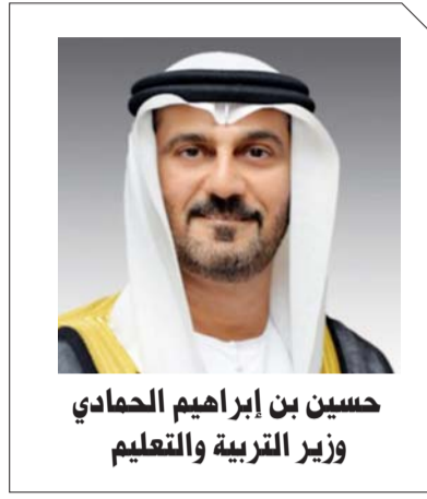
حسين بن إبراهيم الحمادي وزير التربية والتعليم

والهدف الذي يجمعنا أمن السعودية والإمارات واستقرار المنطقة، يجمعنا مصرنا ومستقبلنا.. لقد تبنت الإمارات والسعودية العديد من المواقف الوطنية المصرية، واختلط الدم الإماراتي والسعودي في ميادين الحق والواجب، ليعلن عن مشهد جديد وصورة ناصعة من التلاحم المصري والوقوف صفاً واحداً ضد الأطماع الخارجية التي تسعى للنيل من مكتسباتنا ومنجزاتنا التي تحققت.