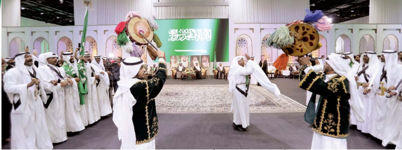
■ الإمارات والسعودية.. انسجام عميق الجذور متأصل في وجدان الشعبين