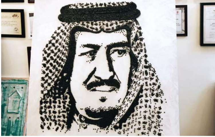
اللوحة التي أهداها الفنان الإماراتي للسعودية | البيان