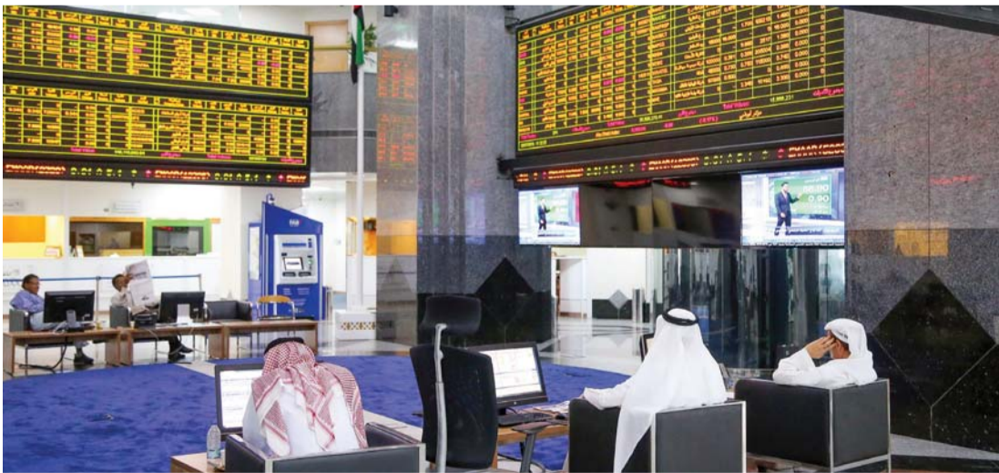
تداولات مؤثرة للمستثمرين السعوديين في أسواق الإمارات