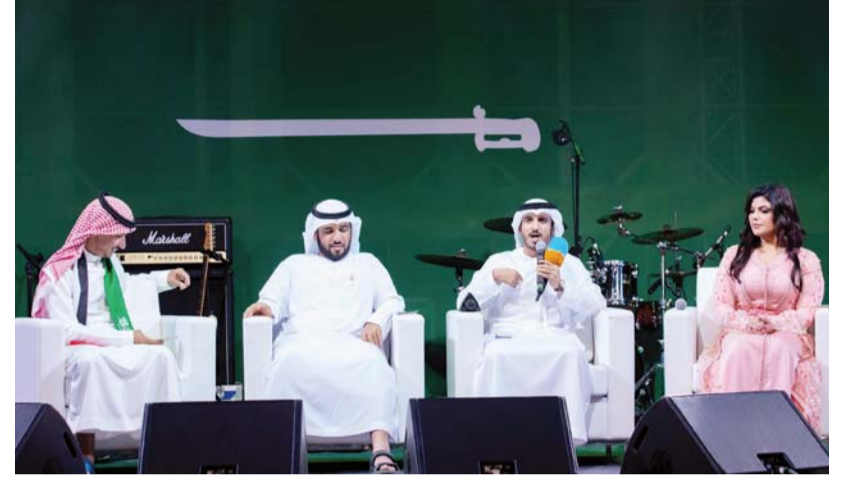
الشعراء خلال الأمسية