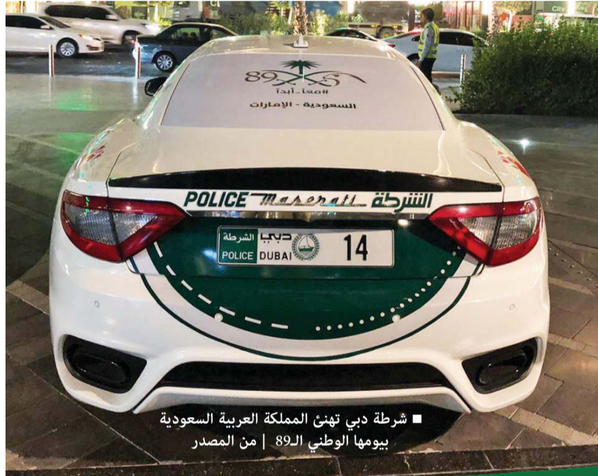
شرطة دبي تهنئ المملكة العربية السعودية بيومها الوطني الـ 89

والتي لا تلبث أن تؤكد من خلالها عمق انتمائها العربي، وحرصها على صون مقدرات الأمة وحماية مكتسباتها.