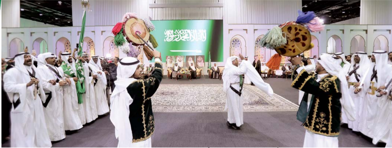
الإمارات والسعودية.. انسجام عميق الجذور متأصل في وجدان الشعبين