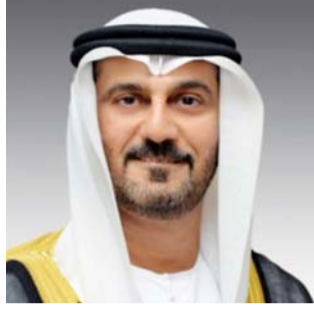
حسين بن إبراهيم الحمادي وزير التربية والتعليم

تأتي هذه المناسبة الوطنية، ونحن نقدم اليوم نموذجاً عالمياً في اللمة والتعاون والعمل المشترك لما فيه خير الشعبين وصالح