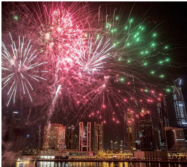
عروض مميزة للألعاب النارية في مواقع عدة بدبي | أرشيفية

الاستمتاع بالأنشطة الاحتفالية الأخرى التي ستقام بهذه المناسبة الكبيرة.