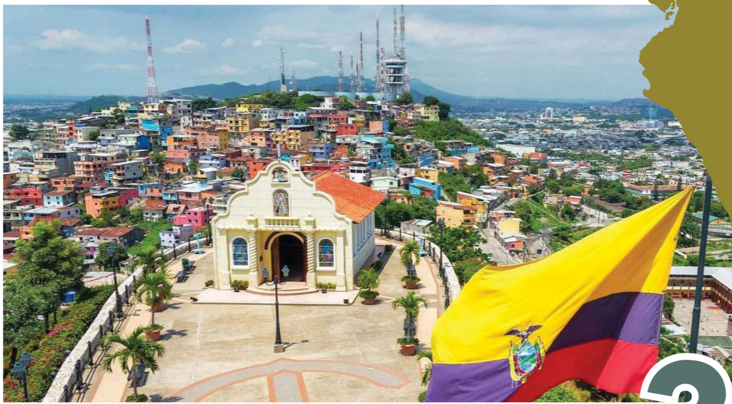
مشهد من جماليات الإكوادور