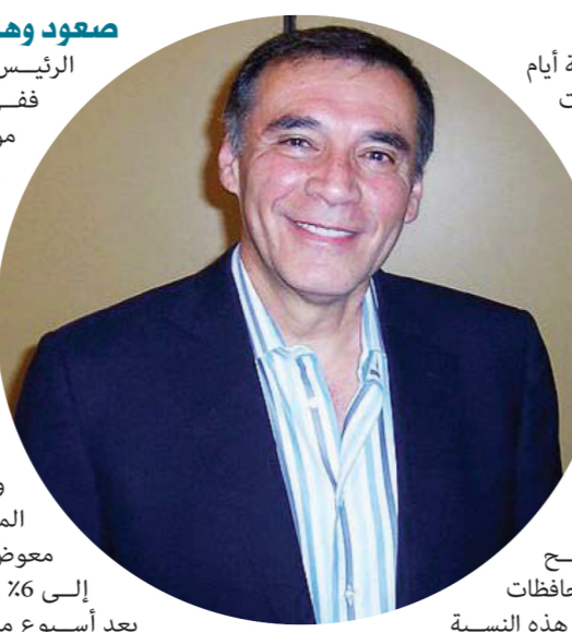
صعود وهبوط الرئيس اللبناني الثالث للإكوادور هو جميل معوض، ففي أول انتخابات رئاسية بعد عزل بوركوم، أتى معوض ذو الأصول اللبنانية أيضاً جميل معوض، ومارس مهامه كرئيس للإكوادور في 10 أغسطس 1998. وكان معوض ترشح للرئاسة قبل عشرة أعوام من وصوله للحكم، ولكنه حينها حل

الثاني هو الرئيس عبد الله بوركوم حيام وسياسي ولد بالإكوادور، وكان والده لبنانياً مهاجراً. نشأ عبد الله كرياضي حتى أنه تولى رئاسة نادي برشلونة الإكوادوري، وخاض العمل السياسي حتى وصل إلى كرسي الحكم في 10 أغسطس لعام 1996 إلا أنه لم يجلس في الرئاسة سوى أربعة أشهر، إذ عزله مجلس الشيوخ الوطني شتما إياه بعدم الأهلية العقلية لإدارة شؤون البلاد، وهو ما اعتبره أشد مآزماً حيكبت ضده، وكان قد فاز في انتخابات الرئاسة أمام جيم نيوب مرشح الحزب المسيحي في 20 محافظة من إجمالي عدد المحافظات الـ 21، وكان أول مرشح في تاريخ الإكوادور يحصل على هذه النسبة العالية من أصوات الناخبين.