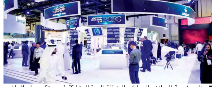
جناح مؤسسة الموانئ والجمارك والمنطقة الحرة المشاركة في جيتكس | البيان

الحكومات، كما يدعم هذا النظام العالمي المتطور الارتقاء بالتصنيف العام للدولة في مؤشرات التنافسية العالمية وزيادة العائدات وتسريع التجارة عبر حماية وإدارة سلسلة الإمداد.