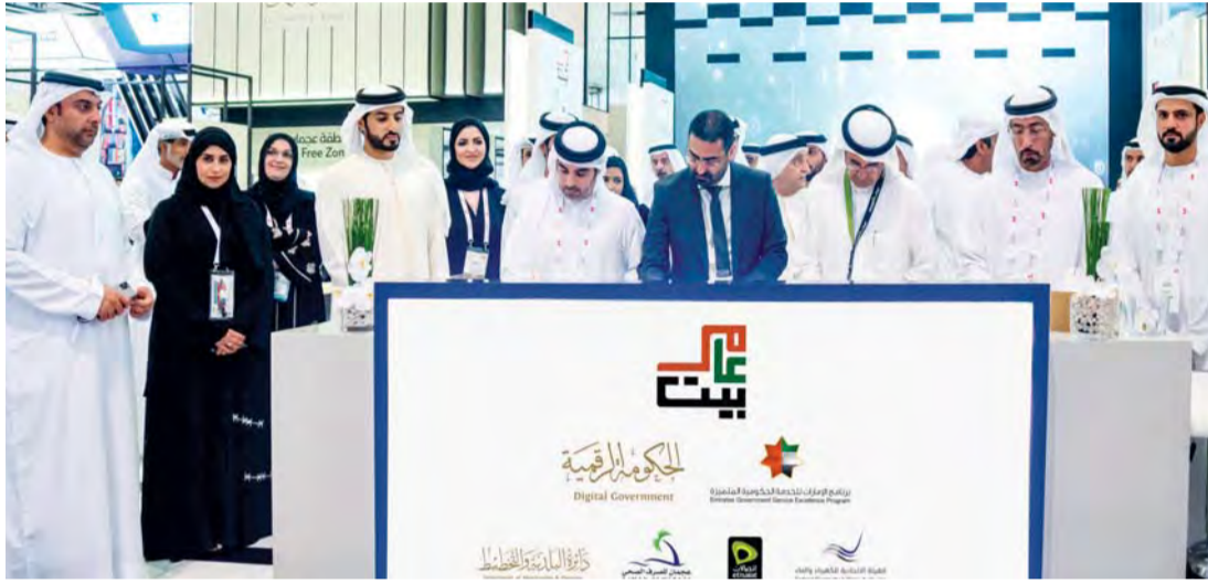
■ خلال توقيع الاتفاقية بحضور راشد بن حميد

تم تطوير «بيت عامر» بالشراكة مع فريق مبادرة «تحدي الـ 50 يوم» في برنامج الإمارات للخدمة الحكومية المتميزة، لوضع التحديات التي تواجه المتعاملين عبر تنظيم ورش عمل هدفت لدراسة رحلة المتعامل وإعادة تصميم الإجراءات الحالية بهدف تقليصها، من خلال إيجاد حلول جديدة مبتكرة تسهل حصول المتعامل على الخدمة عند الانتقال إلى منزل جديد في إمارة عجمان.