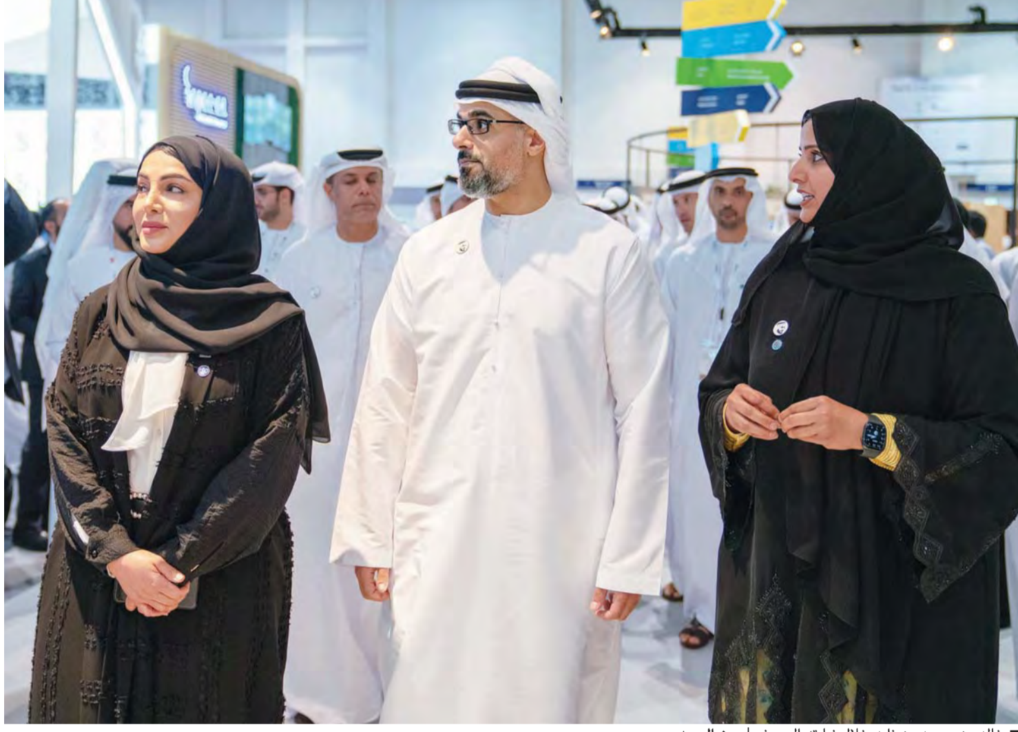
خالد بن محمد بن زايد خلال زيارته المعرض

وزار سموه جناح حكومة الشارقة، الذي يضم 33 جهة حكومية، وتعرف إلى أحدث الخدمات الرقمية التي أطلقتها الجهات الحكومية في الإمارة، وتعرف سموه، خلال زيارة منصة حكومة عجمان، إلى آخر الحلول التقنية والأنظمة التكنولوجية التي تسهم في تعزيز الخدمات الحكومية المقدمة للجمهور. كما زار جناح حكومة الفجيرة، وتعرف إلى أحدث الحلول التكنولوجية لتطوير عدد من الخدمات الحكومية في الإمارة. وزار سموه منصة وزارة الداخلية السعودية التي تستعرض أحدث خدماتها الذكية وتقنيات أمن المنافذ، ودور الذكاء الاصطناعي في تعزيز الأمن. رافق سموه، خلال الزيارة، معالي الدكتور أحمد مبارك المزروعى، رئيس مكتب رئيس المجلس التنفيذي لإمارة أبوظبي، وجاسم محمد بوغتابه الزعابي، رئيس دائرة المالية، والشيخ عبد الله محمد آل حامد، رئيس دائرة الصحة، والمهندس عويضة مرشد المر، رئيس دائرة الطاقة، ومحمد خليفة المبارك، رئيس دائرة الثقافة والسياحة، وعلي راشد قنص الكبيسي، رئيس دائرة الإسناد الحكومي.