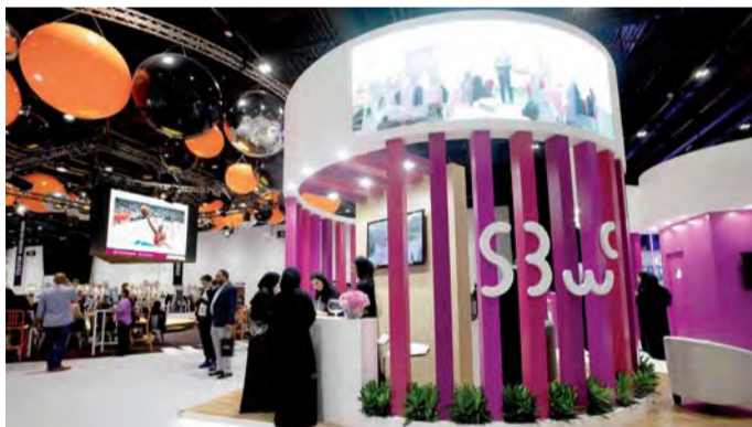
■ منصة مجلس سيدات أعمال الشارقة في «جيتكس» | البيان

مجال التكنولوجيا، والراعي الرسمي لفئة (المراة في مجال التكنولوجيا)، وذلك تعزيزاً لجهودها في دعم الأعمال التجارية والشركات الناشئة التي تقودها المرأة، وخصوصاً في القطاعات غير التقليدية، مثل التكنولوجيا، من خلال توفير منصات فعالة للتعريف بمشاريعهن والترويج لها، واختيار الأفضل والأكثر ابتكاراً منها لرعايتها وتقديمها خلال أيام المعرض». وأشارت إلى أن جميع العضوات اللواتي فزن برعاية مجلس سيدات أعمال الشارقة في معرض «جيتكس نجوم المستقبل 2019» لديهن صفة مشتركة، وهي القدرة على الحلم، والشجاعة لتحويله إلى واقع، كما أن لديهن أفكاراً جديدة سيكون لها بالتأكيد تأثير إيجابي على المجتمع.