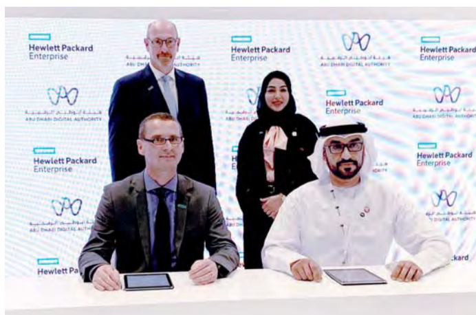
■ خلال توقيع الاتفاقية | البيان

الخدمات إلى سكان ومجتمع أبوظبي. وأضافت مدير عام هيئة أبوظبي الرقمية أن الهيئة تحرص على توطيد شراكتها مع الشركات الرائدة في ميادين التحليلات المتقدمة ودمج البيانات». ومن جانبها، ستقدم «هيوليت باكارد إنتربرايز» نخبة من أفضل علماء البيانات في العالم لدعم جهود حكومة أبوظبي في مجالات تصميم وابتكار وتنفيذ الهيكلية اللازمة لاستحداث منصة استشارية لأغراض دمج البيانات. وبمجرد تأسيسها، ستطرح منصة البيانات المرتقبة هذه باقية من الخدمات الجديدة المعززة لمواطني أبوظبي وسكانها عموماً. كما تعزز «هيوليت باكارد إنتربرايز» تزويد هيئة أبوظبي الرقمية بحل «إتش بي إي إنفوسايت»؛ وحل «إتش بي إي سيرجي»؛ البنية التحتية الوحدرة القابلة للتخصيص في القطاع والمزودة بمزايا الذكاء القائم على البرمجيات والجهازية المستقلة للضوئيات.