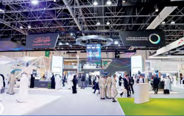
24 مبادرة جديدة عرضتها الهيئة | من المصدر

مقارنات معيارية مع المواقع الإلكترونية التابعة لعدد من أكبر المؤسسات العالمية، حيث تم استحداث تصاميم مبتكرة وسلسلة لشاشات العرض ولقوائم التصفح تم اختبارها مع مختلف فئات المستخدمين.