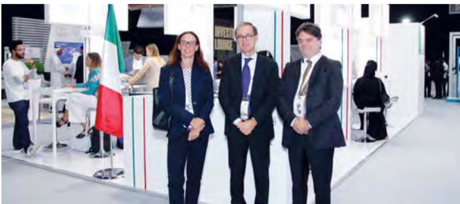
المسؤولون الإيطاليون بجناحهم في جيتكس

حيث تشارك 11 شركة إيطالية ناشئة وتعرض أحدث منتجاتها التقنية وتتعقد اجتماعات مع العديد من الشركاء المحتملين.