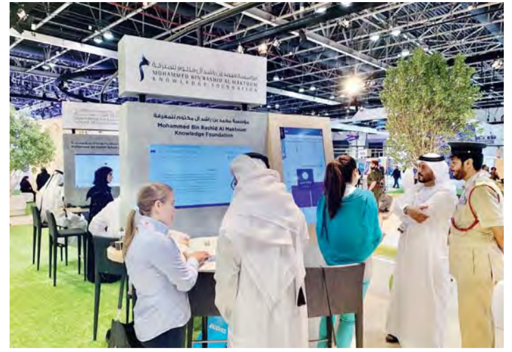
■ منصة المؤسسة في «جيتكس» | البيان

الإسهام في تحقيق مستهدفات استراتيجية حكومة دبي اللاورقية وتوجيهات القيادة الرشيدة، من خلال تفعيل الخدمات الرقمية، التي تتيح للجمهور الوصول السهل والسريع إلى مشاريع ومبادرات المؤسسة من خلال هواتفهم الذكية، وتعمل بشكل مستمر على تطوير هذه الخدمات بما يواكب أفضل المعايير العالمية بهذا المجال، منوها بأهمية أسبوع جيتكس دبي - البيان.