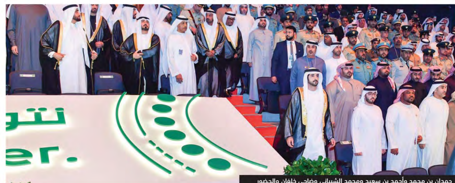
حمدان بن محمد وأحمد بن سعيد ومحمد الشيباني وضاحي خلفان والحضور