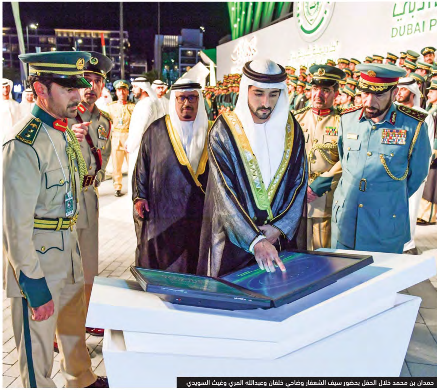
حمدان بن محمد خلال الحفل بحضور سيف الشعفار وضاحي خلفان وعبدالله المري وغيث السويدي

سموه شهد حفل تخريج الدفعة الـ 27 من الطلبة المرشحين بأكاديمية شرطة دبي