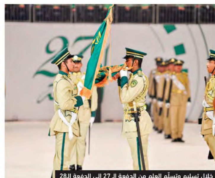
خلال تسليم وتسلم العلم من الدفعة الـ 27 إلى الدفعة الـ 28