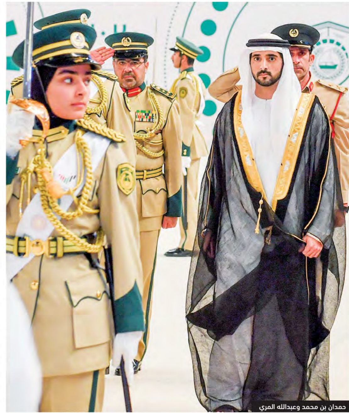
حمدان بن محمد وعبدالله المري

دبي - وام شهد سمو الشيخ حمدان بن محمد بن راشد آل مكتوم ولي عهد دبي، مساء أمس، حفل تخريج الدفعة السابعة والعشرين من الطلبة المرشحين في أكاديمية شرطة دبي. وقال سموه عبر «تويتر»: «شهدت اليوم (أمس) حفل تخريج دفعة جديدة من الطلبة المرشحين في أكاديمية شرطة دبي. فخور بالمستوى المتطور الذي بلغته الأكاديمية في تخريج كوادر جديدة تتمتع بمستوى كبير من الكفاءة». وأضاف سموه: «شرطة دبي ومختلف القوى الأمنية في دولتنا هي محل ثقة قيادتنا وشعبنا. نسال الله لهم التوفيق للحفاظ على جعل دبي والإمارات مثارة للأمن والأمان». وحضر الحفل - الذي جرى في قاعة آرنا في «سيتي ووك» في دبي - سمو الشيخ أحمد بن سعيد آل مكتوم رئيس هيئة دبي للطيران الرئيس الأعلى لمجموعة طيران الإمارات، ومعالى محمد إبراهيم الشيباني مدير عام ديوان صاحب السمو حاكم دبي، والفريق سيف الشعفار وكيل وزارة الداخلية، ومعالى الفريق ضاحي خلفان نائب رئيس الشرطة والأمن العام بدبي، ومعالى اللواء عبدالله خليفة المري القائد العام لشرطة دبي، والمستشار عصام عيسى الحميدان النائب العام لإمارة دبي، واللواء محمد أحمد المري مدير عام الإدارة العامة للإقامة وشؤون الأجانب في دبي، واللواء الدكتور محمد أحمد بن فهد مساعد القائد العام لشؤون الأكاديمية والتدريب، إلى جانب