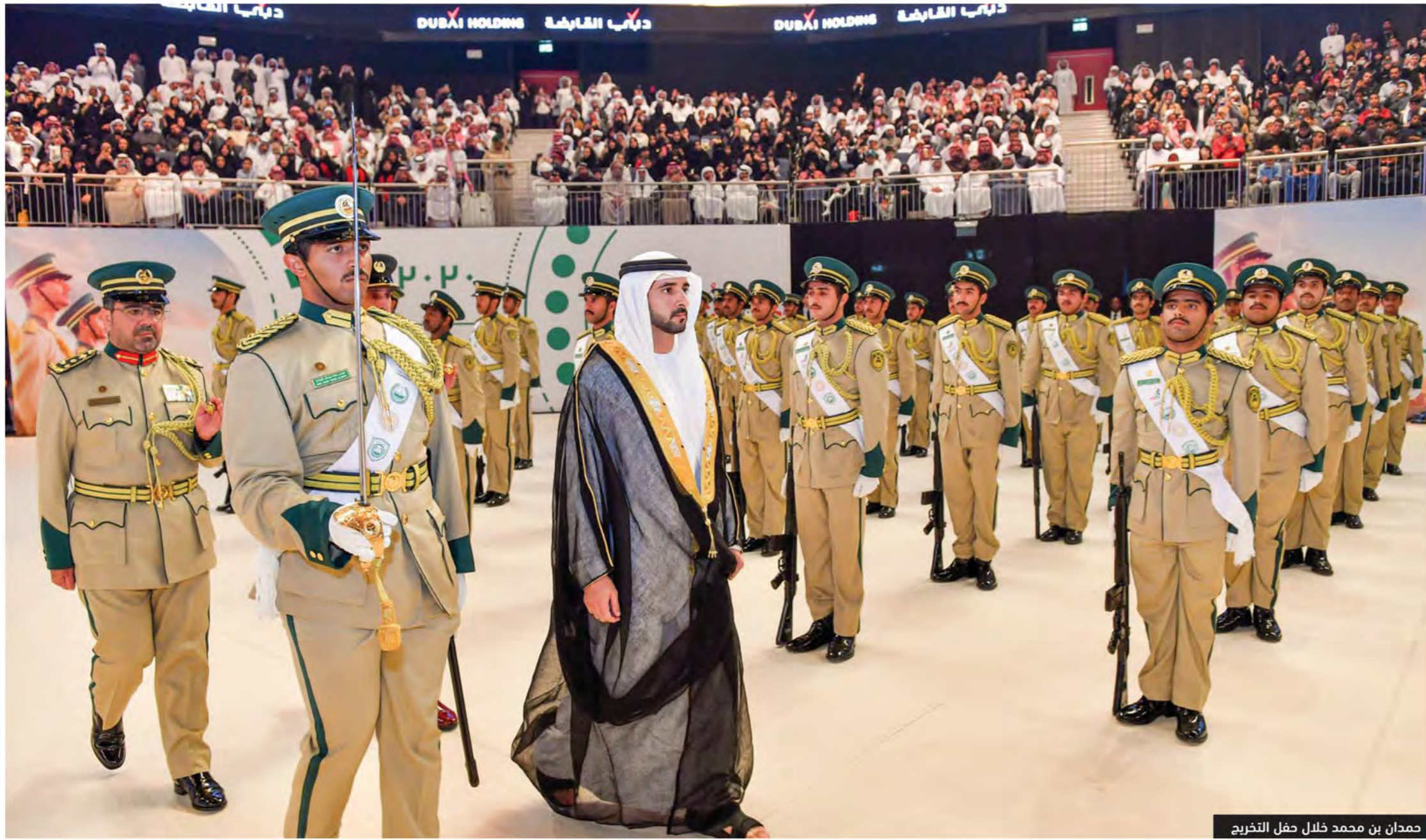
حمدان بن محمد خلال حفل التخرج