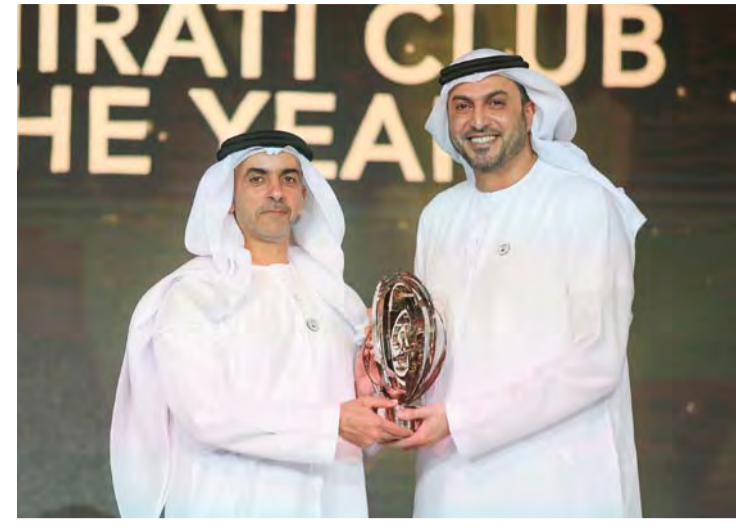
سيف بن زايد يسلم خالد الهنائي جائزته | البيان

أبدي خالد الهنائي رئيس مجلس إدارة شركة الوحدة للألعاب الرياضية سعادته بحصول نادي الوحدة على أفضل نادٍ محلي، وذلك للمرة الأولى، وثمن الهنائي الرعاية الكريمة لصاحب السمو الشيخ محمد بن زايد آل نهيان ولي عهد أبوظبي نائب القائد الأعلى للقوات المسلحة، والذي من شأنه أن طور ودعم رياضة الجوجيتسو على المستويين المحلي والدولي، ما يمكن أبوظبي من كونها