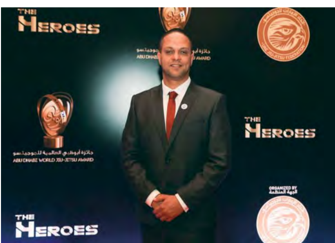
جوس أوليفيرا رئيس الاتحاد الإنجليزي للجوجيتسو | البيان

واخيراً بأفضل لاعب عالمي، ولافتاً إلى ان هذه الجوائز المقدمة تحفز الرياضيين والمؤسسات الرياضية على التطوير والتنافس الشريف.