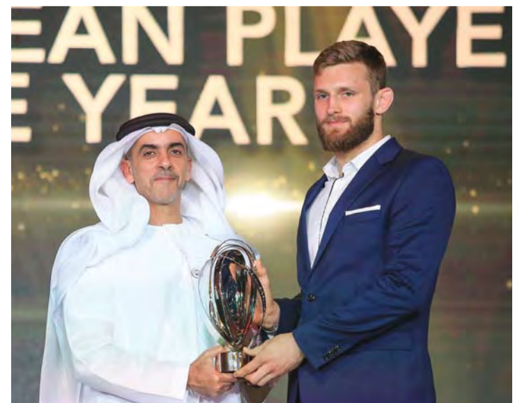
■ سيف بن زايد يقبل أفضل لاعب جائزته | البيان