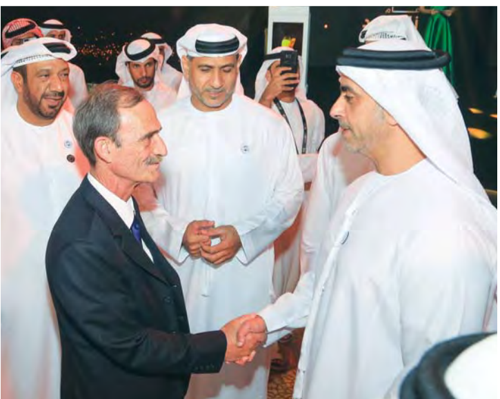
■ سيف بن زايد يلتقي رئيس الاتحاد الدولي للجوجيتسو | البيان

الله ثراه، وتناول عرض الفيديو أهم اللقطات الحاسمة لأمتع النزلات، وردود فعل الأبطال الفائزين على بساط النبلاء، بالإضافة إلى تفاعل الجماهير، وقام سمو الشيخ سيف بن زايد آل نهيان نائب رئيس مجلس الوزراء وزير الداخلية، وعبد المعزم الهاشمي بتتويج الفائزين على المنصة.