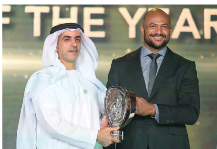
سيف بن زايد يسلم إيغور الجائزة | البيان

ومع كل نسخة يولد بطل ونجم جديد سواء من اللاعبين أو اللاعبات، وقد رأينا جميعاً منافسات قوية بين نخبة وصفوة لاعبي العالم على بساط النبلاء.