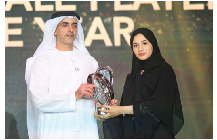
سيف بن زايد خلال تتويجه المكرمات