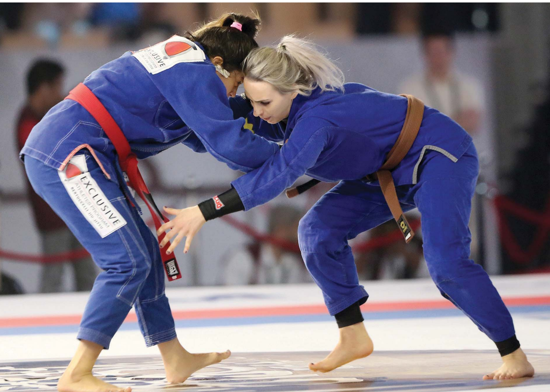
■ من منافسات بطولة أبطوبي العالمية لمحترفي الجوجيتسو

وأضاف حينما التحقت إلى لجنة الجوجيتسو وكانت تتكون من 5 أفراد عام 2010، لم يكن الشغل التنظيمي موجود بهذه الصورة أو الكيفية، وأن الفوارق شاسعة لا شك، وقد بدأت الأسس والقواعد ترسم في عام 2012 بتأسيس اتحاد الإمارات للجوجيتسو. وأوضح أن بطولة أبطوبي لمحترفي