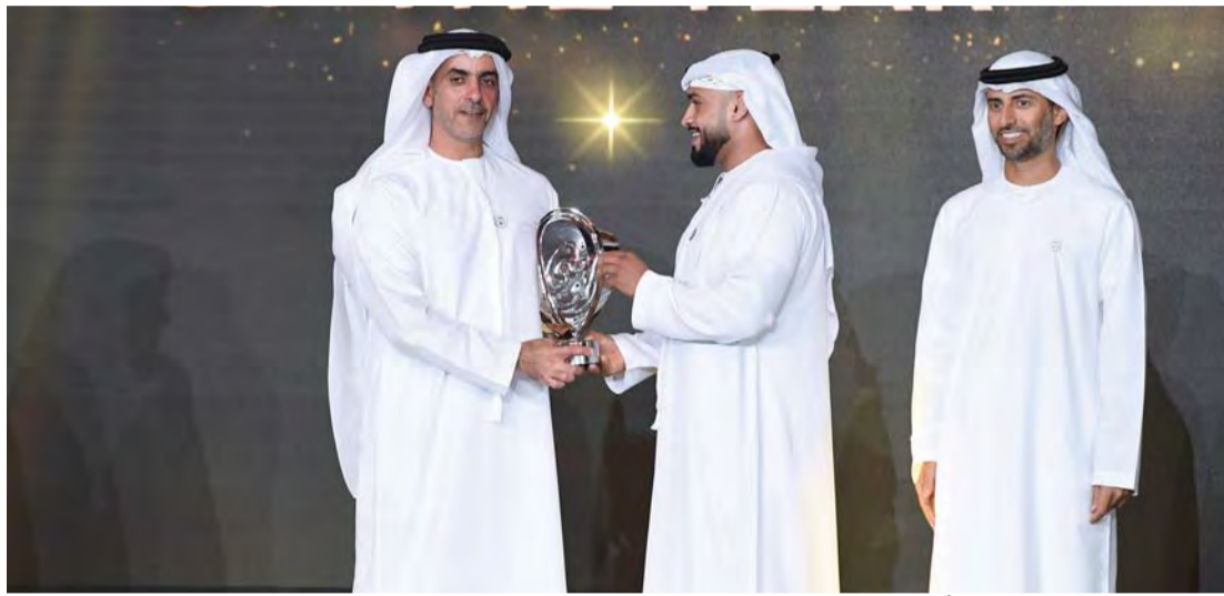
سيف بن زايد خلال تتويج أحد الفائزين بحضور سهيل المزروعى

وشدد المدير التنفيذي لاتحاد أن بطولة أبوظبي العالمية لمحترفي الجوجيتسو هي منصة للأبطال، والجميع يسعى إليها من كافة الأقطار فهي تقدم كل جديد، سواء على مستوى المنافسات، أو اظهار أبطال جدد على الساحة، وهذا الجهد نتاج عمل جاد من اتحاد الإمارات، وتكرس لدور أبوظبي عاصمة الجوجيتسو العالمي، في السير قدماً