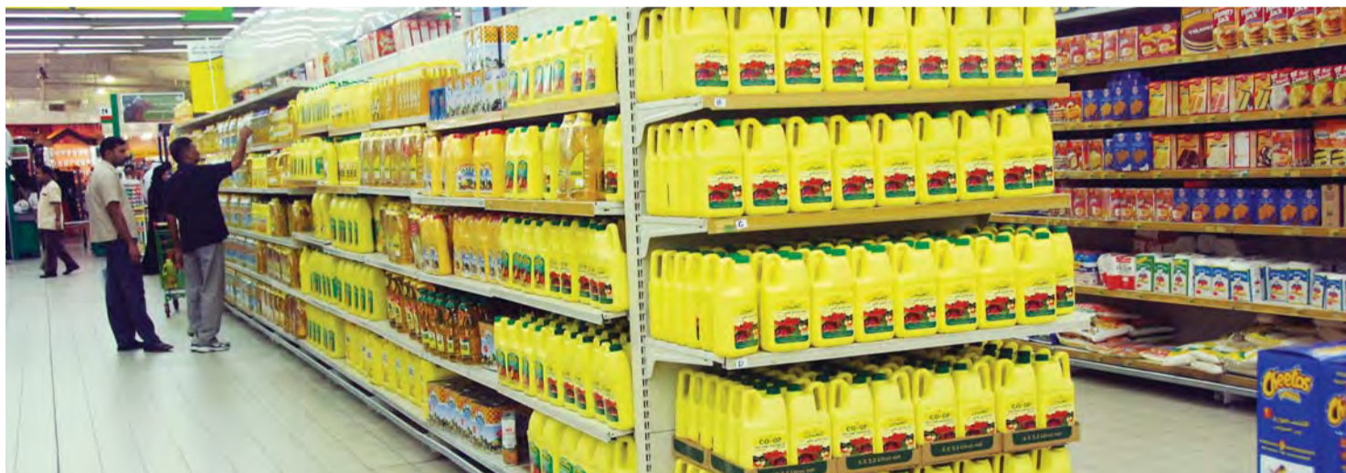
المستهلكون يطالبون بالمزيد من الرقابة على الأسواق | البيان